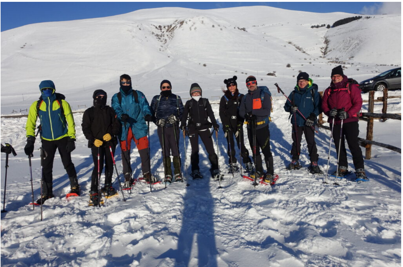
1- Il gruppo di amici alla partenza dal Ranch del Piano Grande.

Ci ha sempre accompagnato un forte freddo vento , di seguito le immagini della giornata.