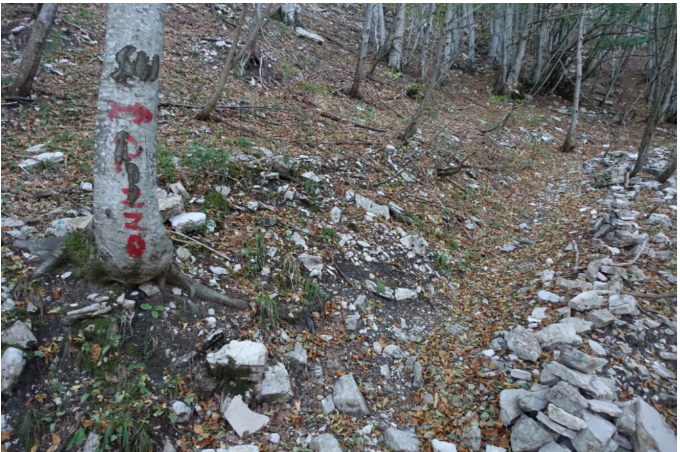
4- La "bellissima" indicazione con vernice sul tronco che indica la deviazione in salita per Il Pizzo, solo sui Monti Sibillini si vedono certe cose.