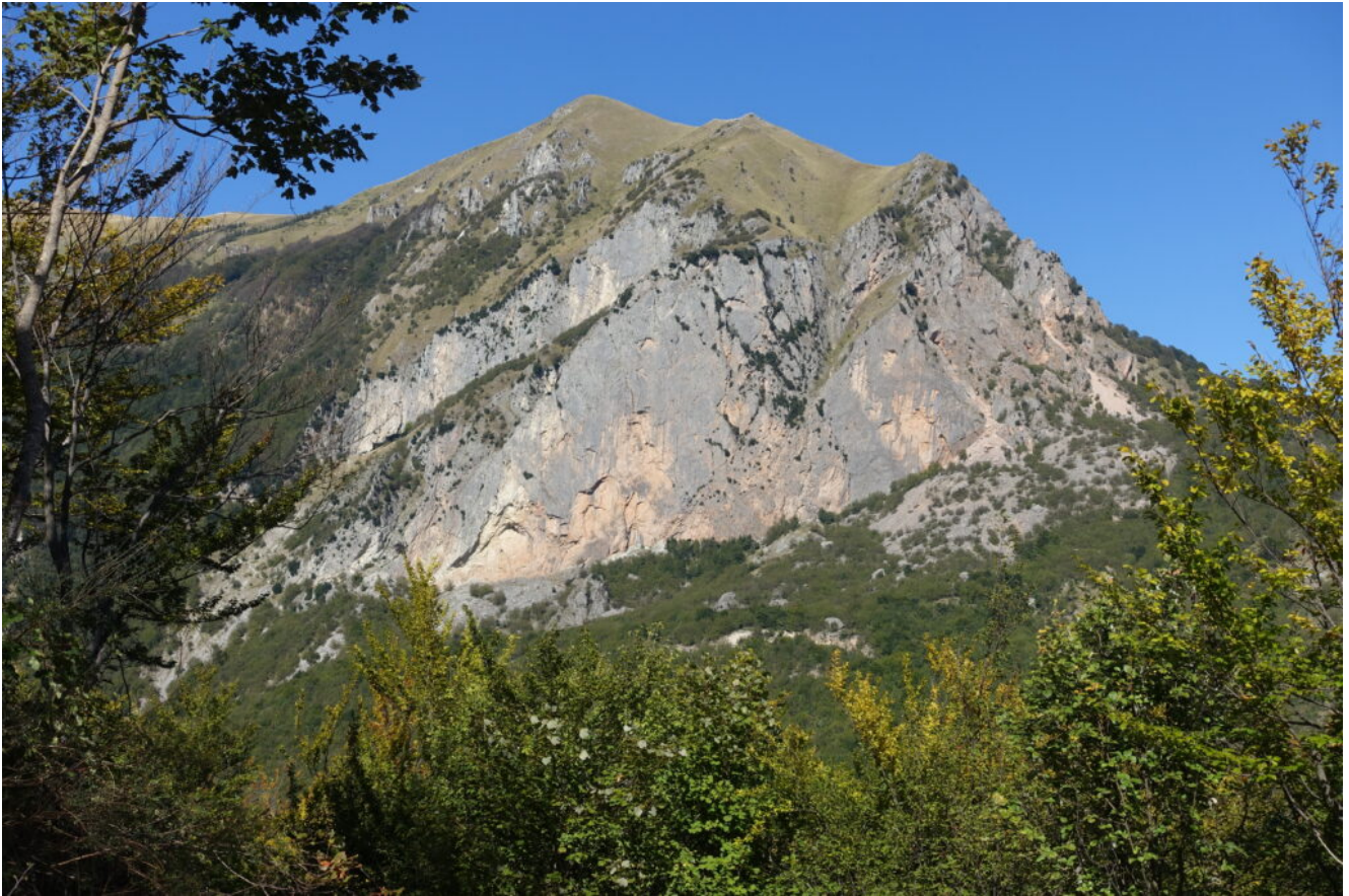
27- E di nuovo il Balzo Rosso.