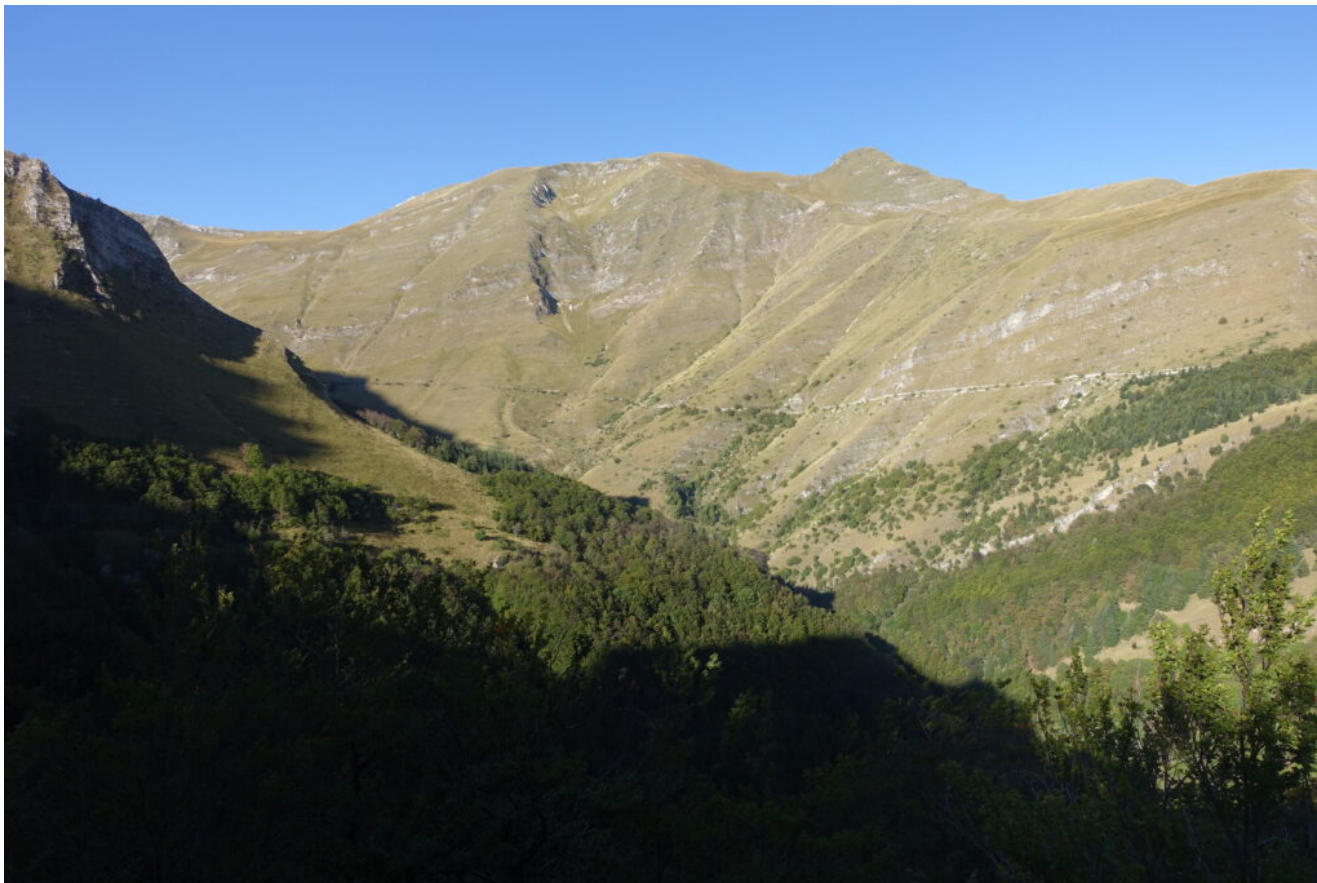
11- Il versante Est del Pizzo Tre Vescovi con la cresta in