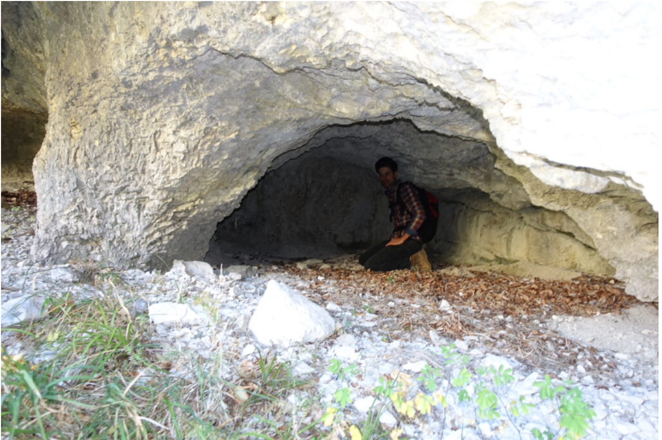
18- La seconda grotta più interna e profonda.