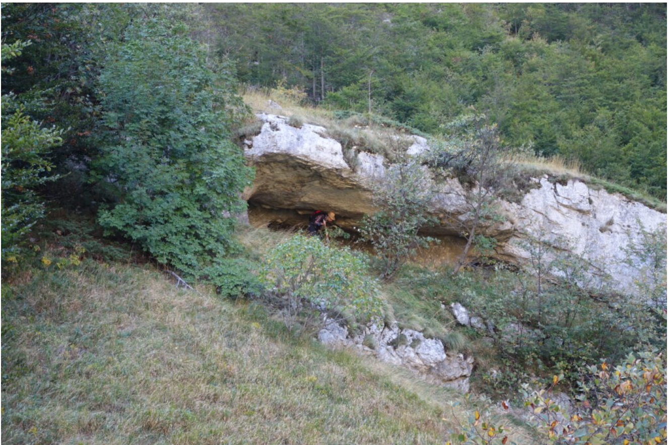
13 – 17- la Grotta de Lu Vallo'