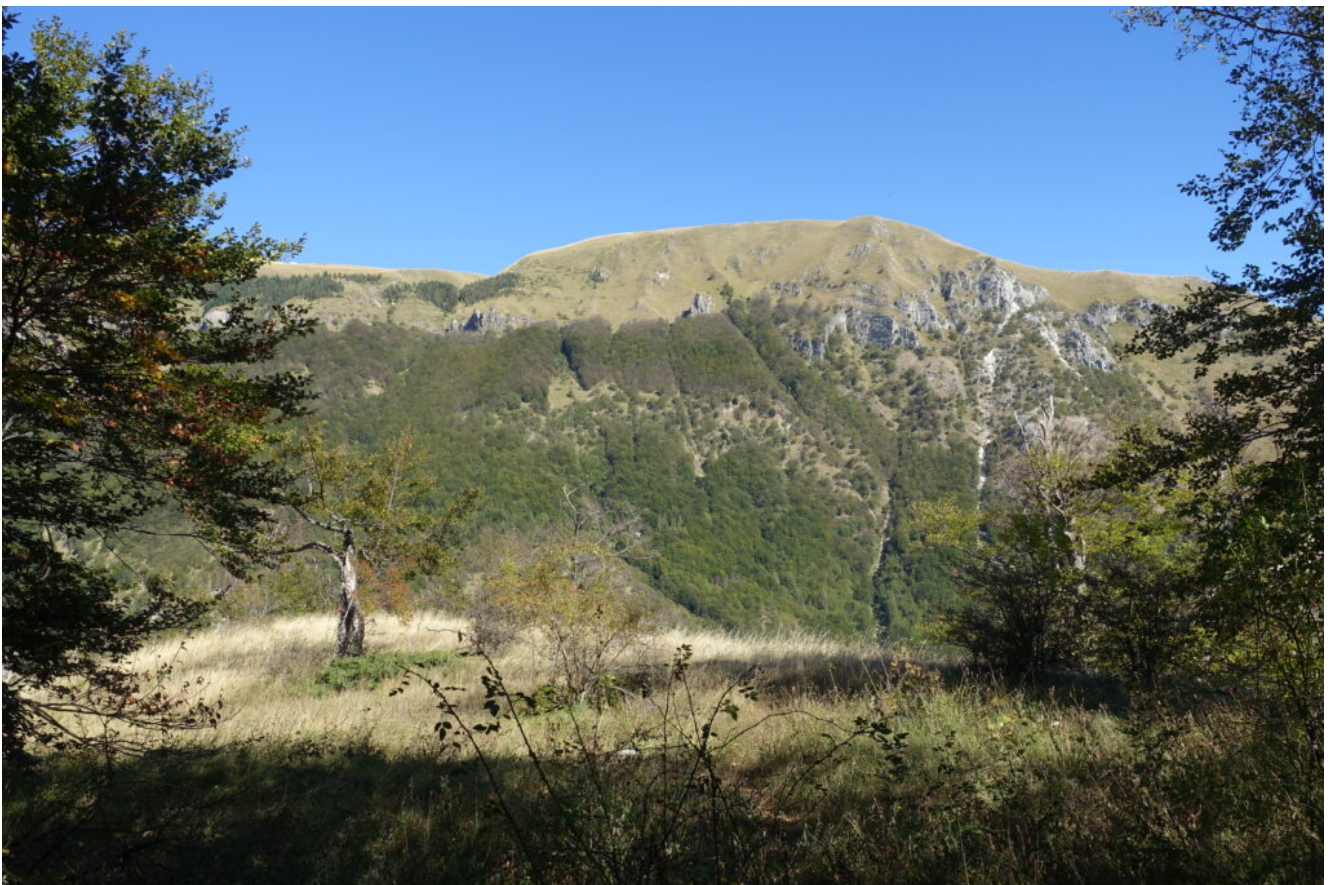
8- Il versante Sud del Monte Amandola.