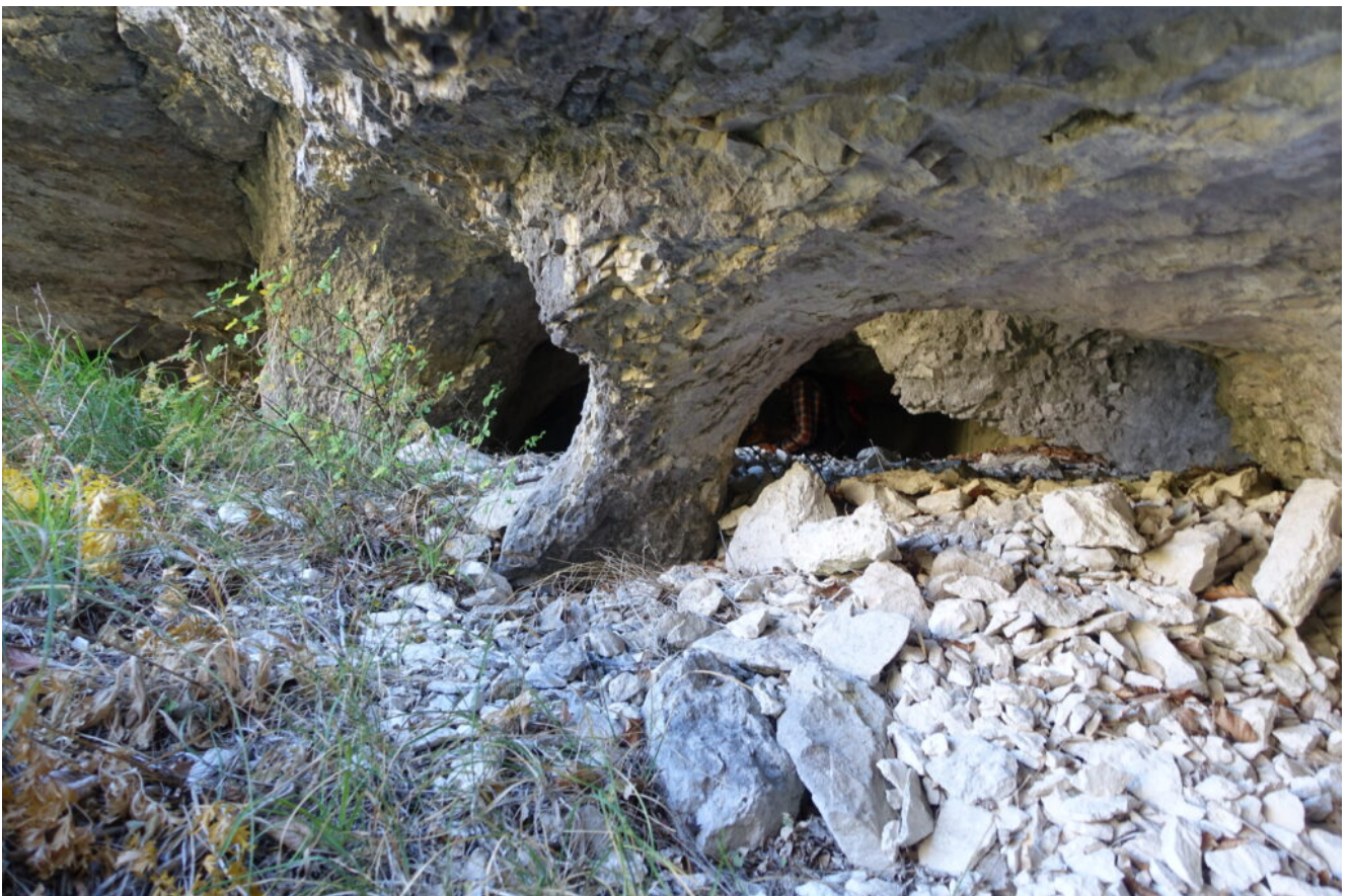
19 – 20 – a colonna di roccia che separa le due grotte.