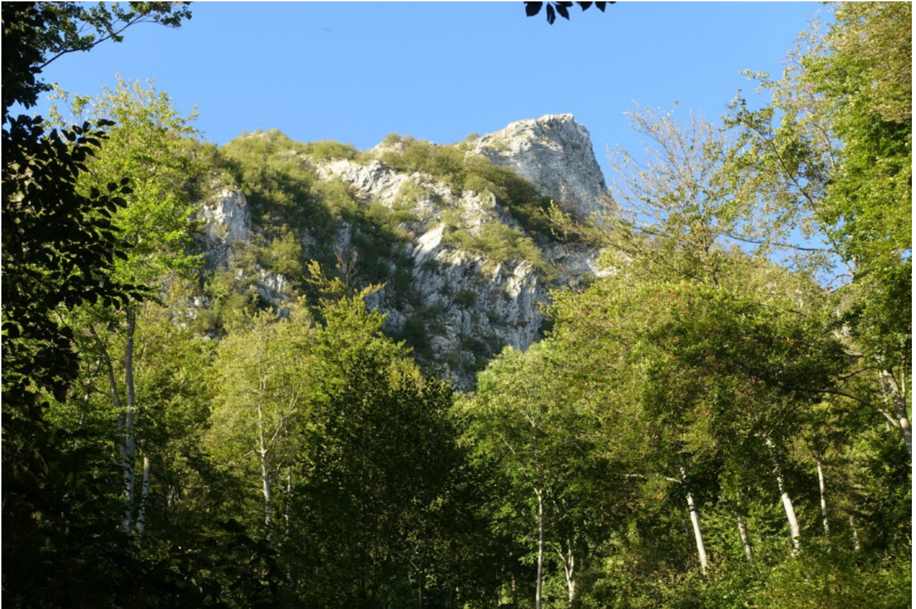
3- Il Poggio della Croce visto dal bosco sottostante