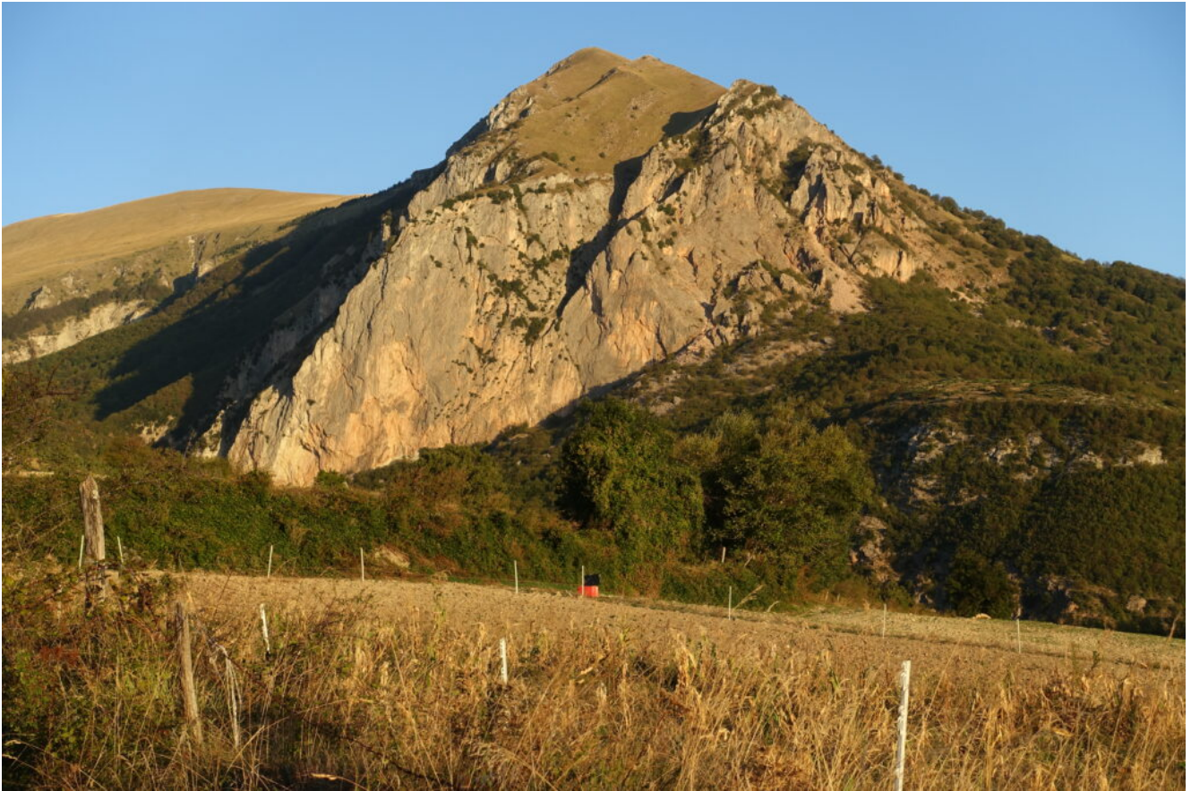
1- Il Balzo Rosso al primo mattino.