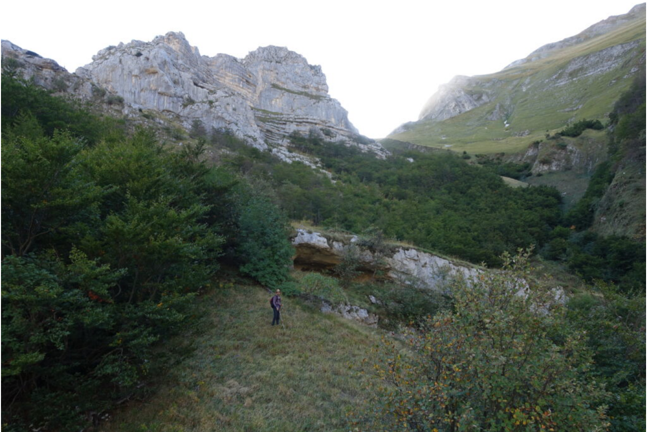
12- La Travertina e la Grotta de Lu Vallo' sottostante.

parziale ombra che abbiamo risalito anni fa (descritta nel sito) ed il Monte Acuto.