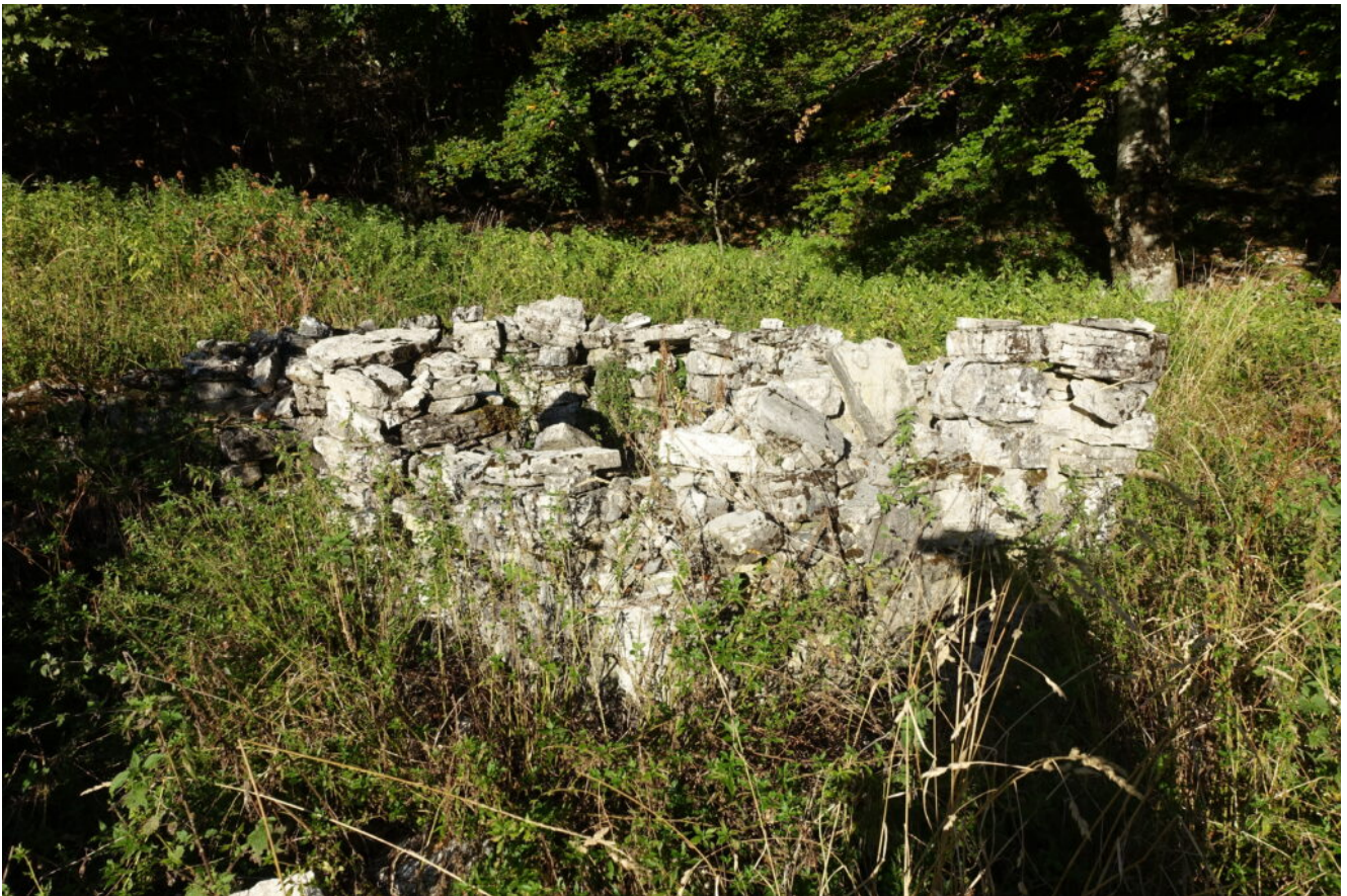
6 – 7 – I vecchi ripari di Prato Porfidia.