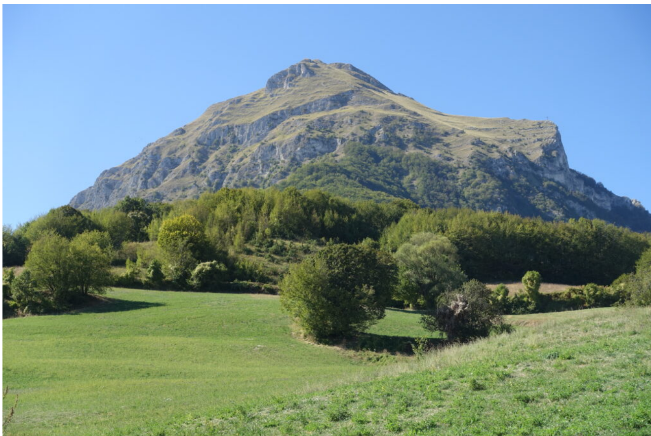
26- Ritorno a Vetice, il Pizzo e Poggio della Croce.