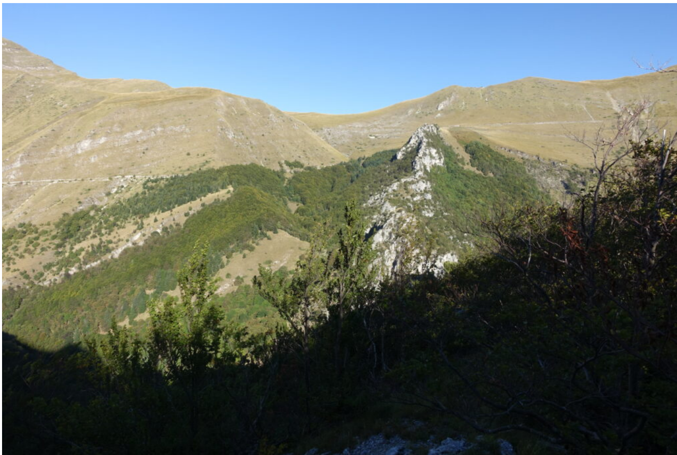
10 – Usciti dal bosco si apre l'alta Valle dell'Ambro, le Roccacce e la Forcella Bassete.