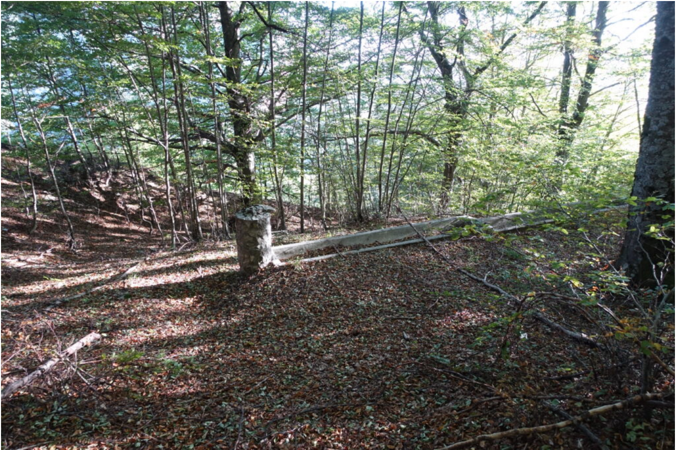
5- Un fontanile ormai asciutto da anni nei pressi di Prato Porfidia.