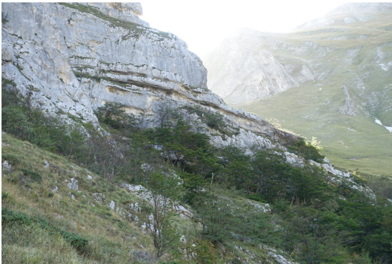
25- Altre cavità formate da tetti di roccia poco profondi si aprono alla base delle pareti rocciose, nascoste dagli alberi.