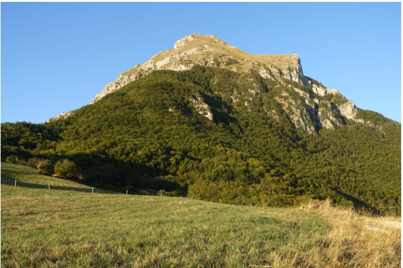
2- Il Pizzo con il Poggio della Croce.