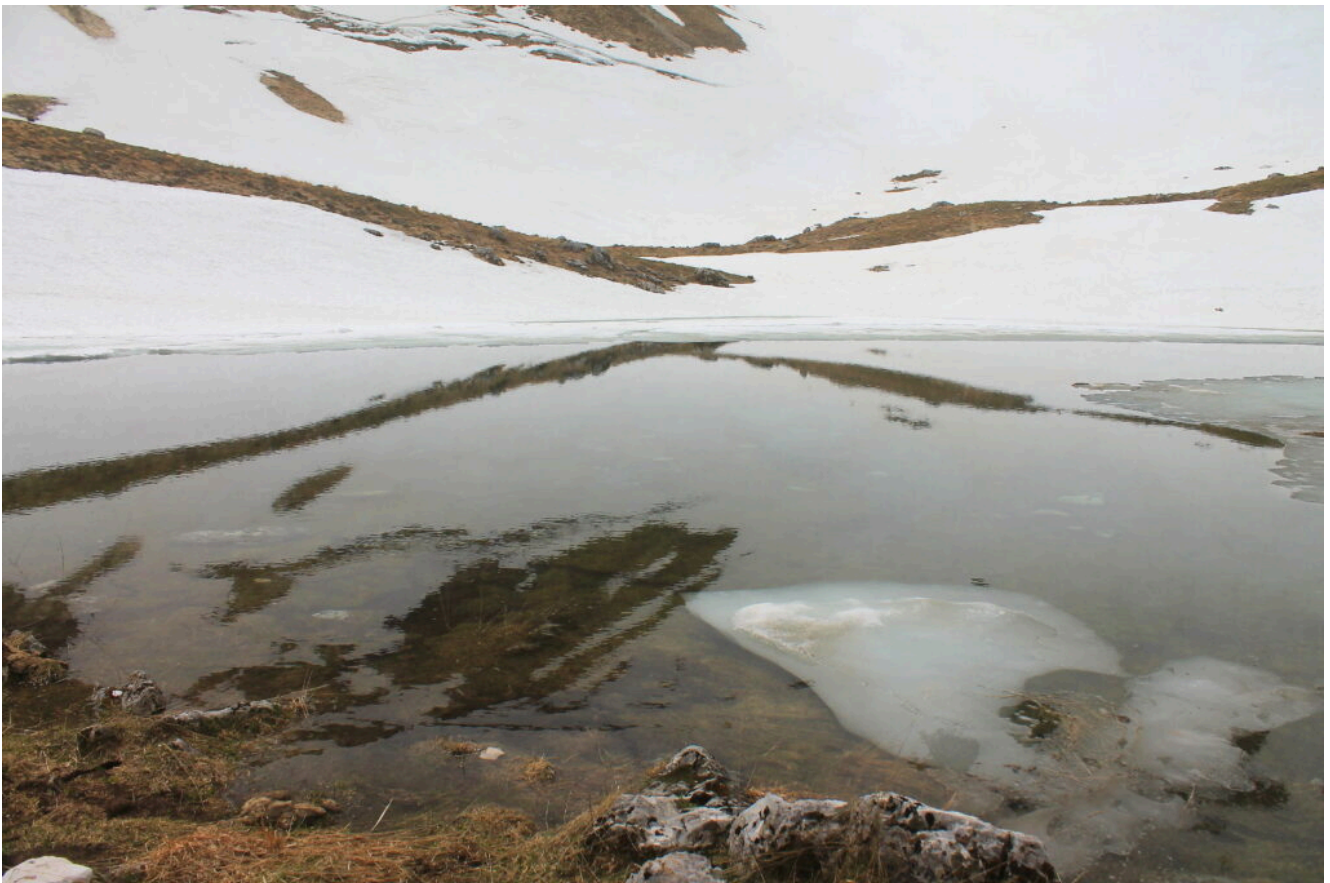
18- Riflessi sul Laghetto.