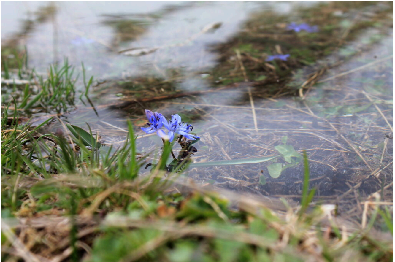
20- Una scilla emerge dall'acqua del Laghetto, di lato una ha fiorito anche sottacqua.