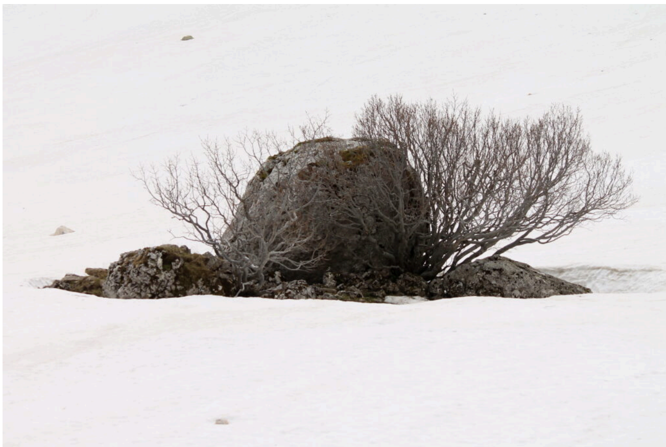
27- Masso caduto in tempi immemorabili è stato circondato da arbusti.