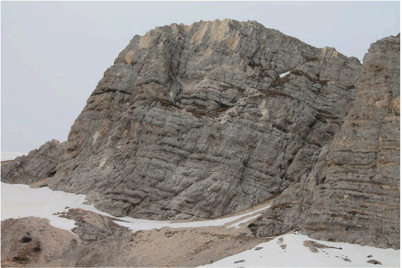
17- Lo scoglio a sinistra della parete Est di Sasso di Palazzo Borghese.