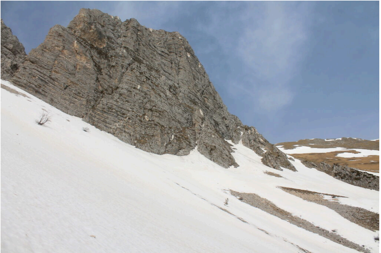
21- Salita verso la base della parete di Sasso di Palazzo Borghese