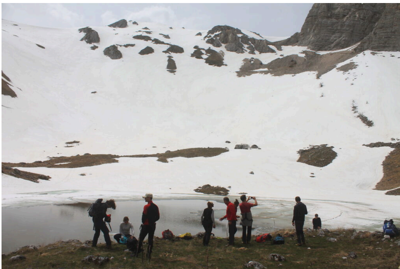
28- Aperitivo delle ore 12 al Laghetto con 15 persone.