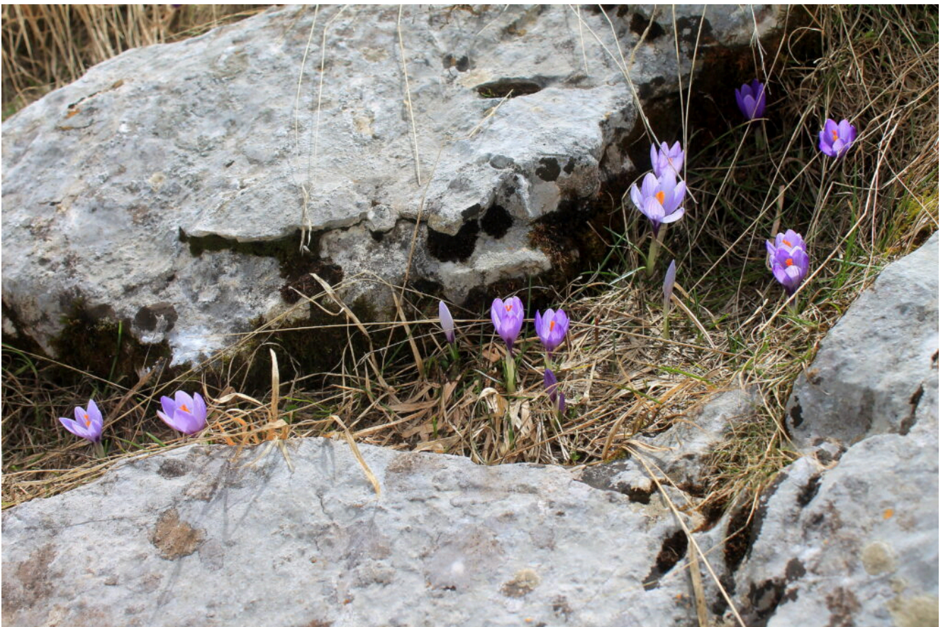
13 - 14- - 15- Fioritura di Crochi nei prati della meravigliosa conca del Laghetto.