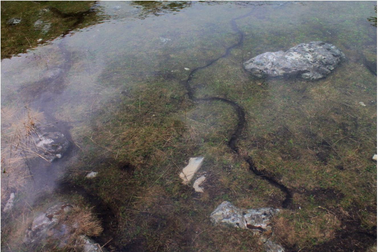
19- Roditori subacquei hanno scavato anche sotto l'acqua..... come avranno fatto senza affogare