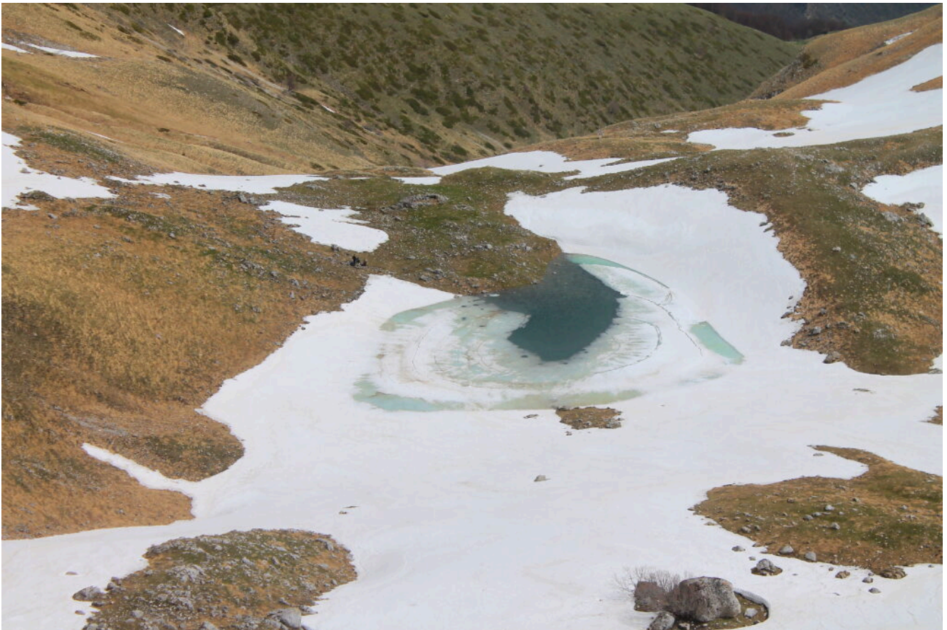
22- Il Laghetto visto dalla base della parete.