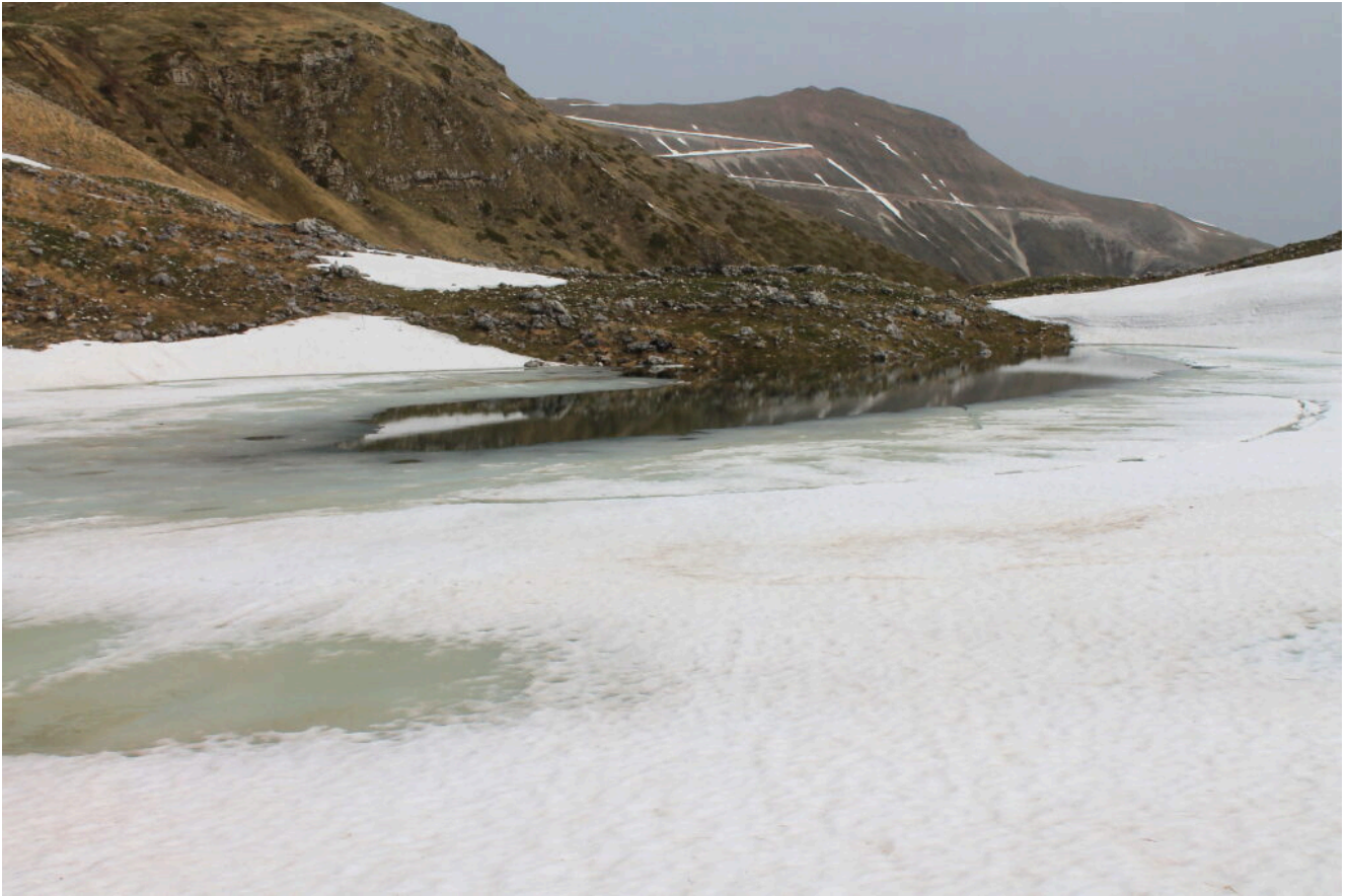
12- Il Laghetto con il Monte Sibilla sullo sfondo.