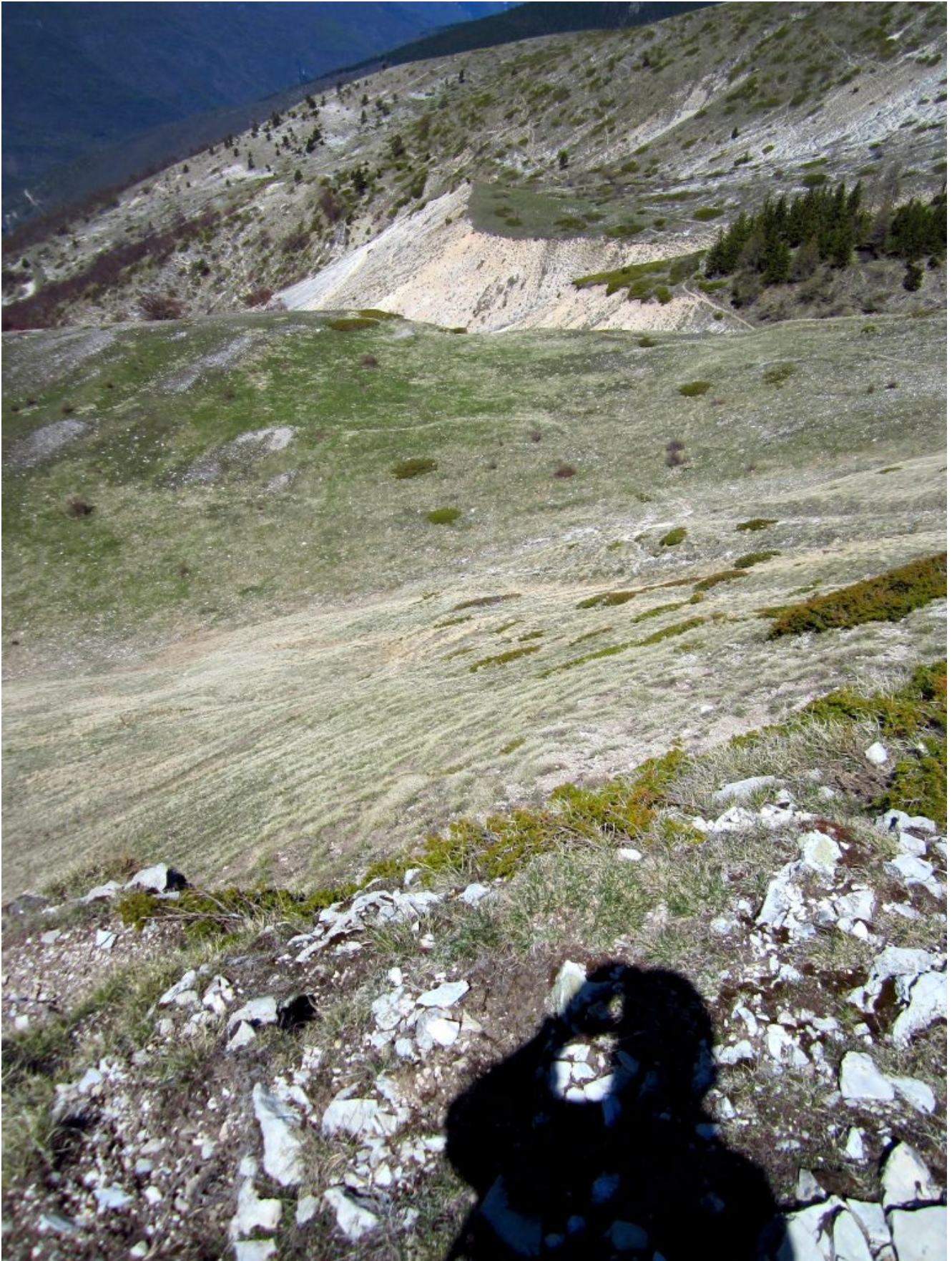
25- Il canale detritico e la spianata erbosa con il sentiero sotto al rimboschimento delle foto n.20-21-22, viste dal sentiero che sale verso la Cima di Vallinfante