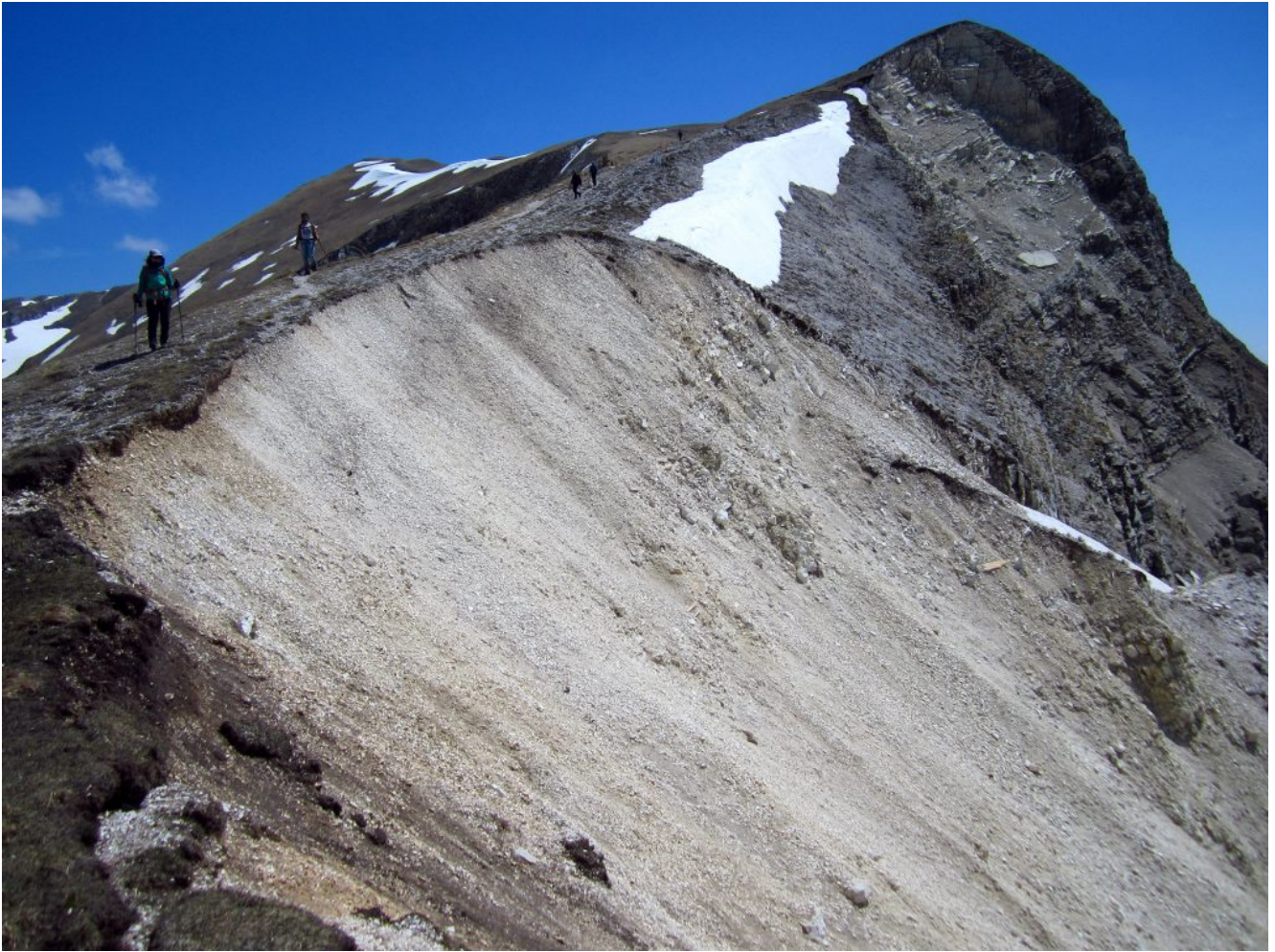
42 – 43- Le grandi frane del Passo Cattivo.