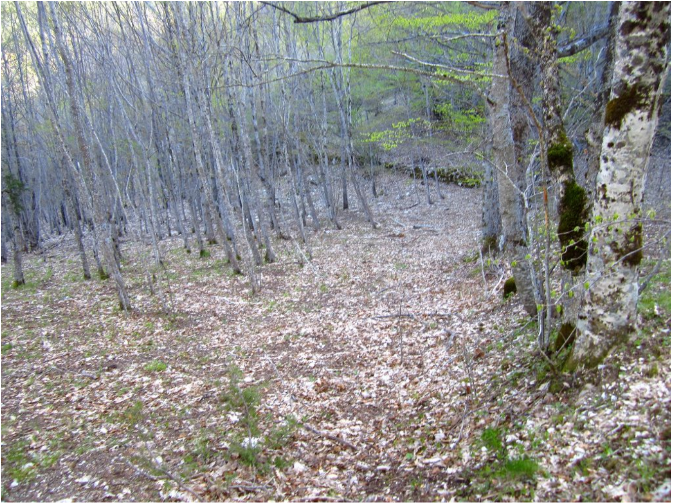
2- I vecchi campi di Macchie delimitati da muretti a secco e ormai ricoperti da alberi