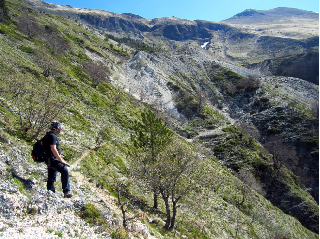
13- Il traverso fino alla Fonte delle Vene visibile nel canalone detritico.