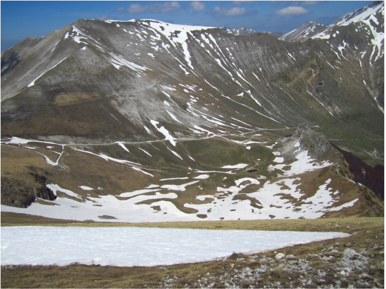
38- La zona denominata "Le Fosse" con il laghetto e la strada che da Passo Cattivo scende a Capotenna, sullo fondo il Monte Bove Sud.