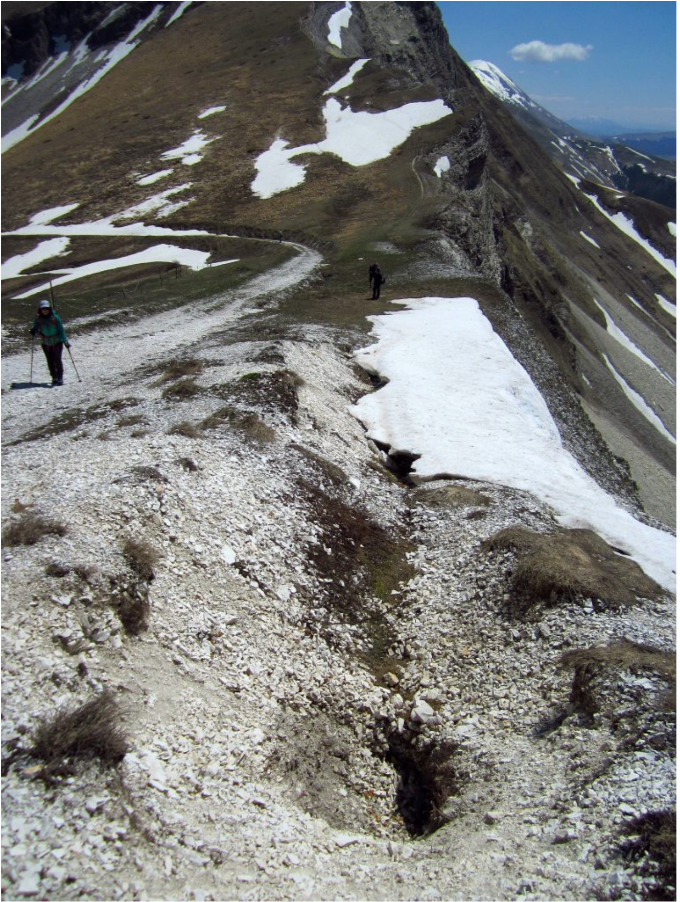
46- Una trincea prodotta dal terremoto del 2016, già fotografata nel 2017.