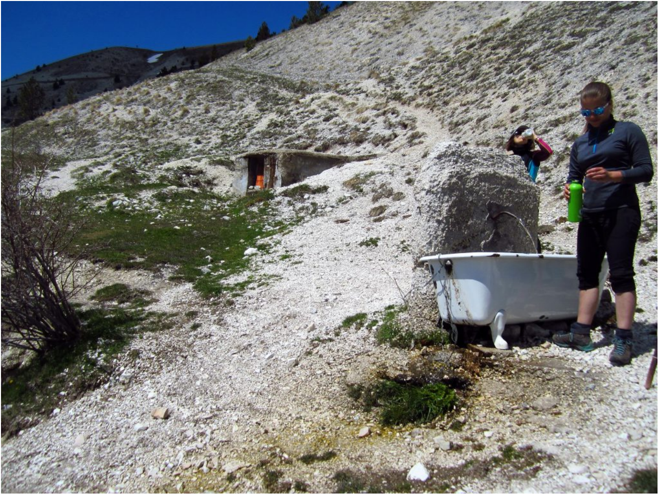
48- La Fonte del Lupo