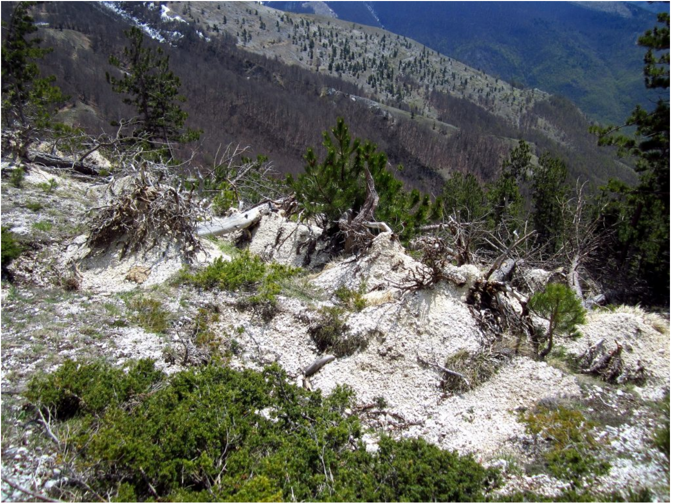
50- Pini sradicati dalle slavine nel rimboschimento a valle della strada Cornaccione-Passo Cattivo