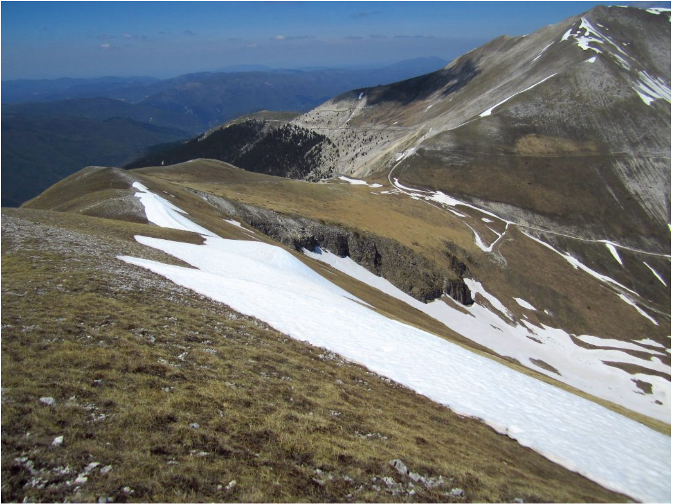
36- Il Passo Cattivo visto dalla cima omonima, a destra il Monte Bove Sud.