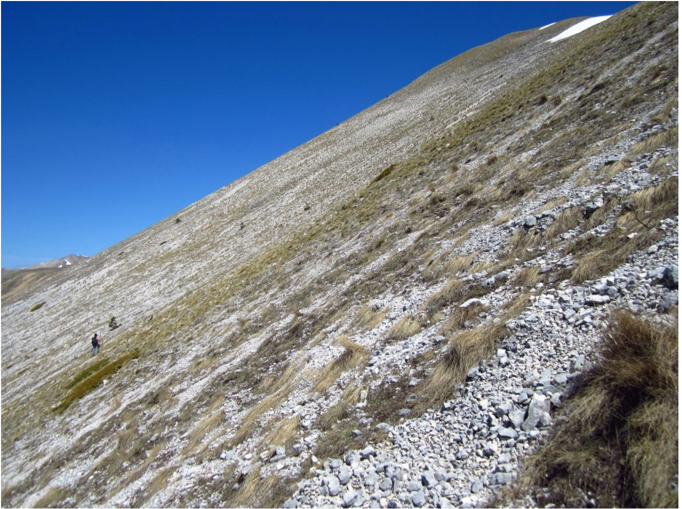
27- Risalita del pendio sulla verticale della Cima di Vallinfante, in alto in corrispondenza degli accumuli di neve.