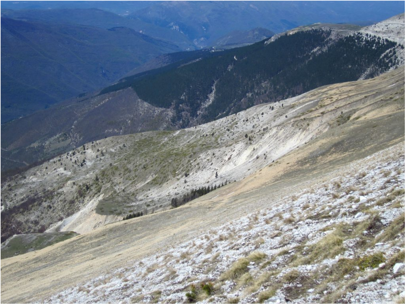
29-Il Colle La Croce ed il rimboscimento delle foto n. 23-24.