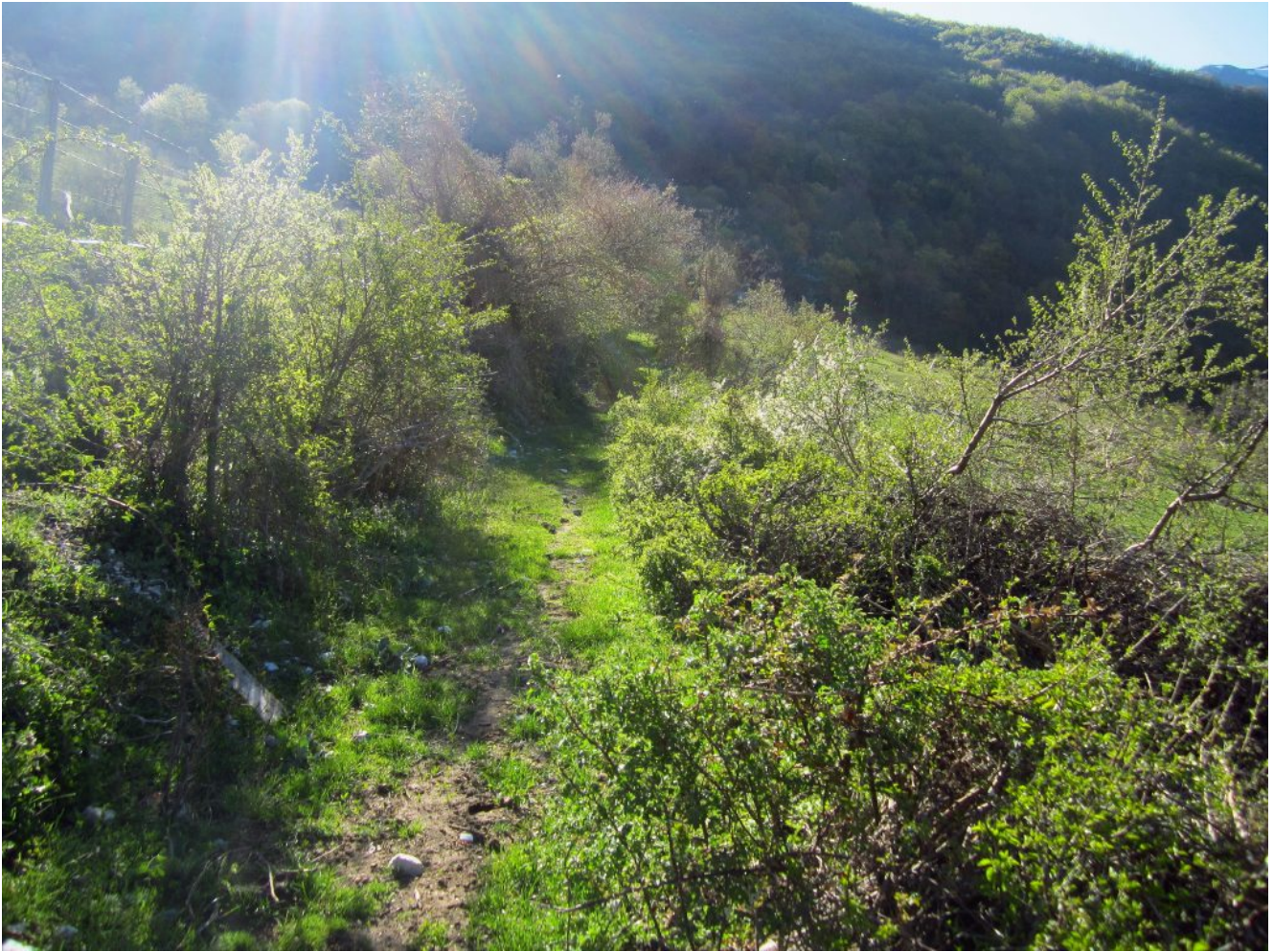
1- La deviazione a destra sotto allo stazzo recintato, a 50 metri dall'auto