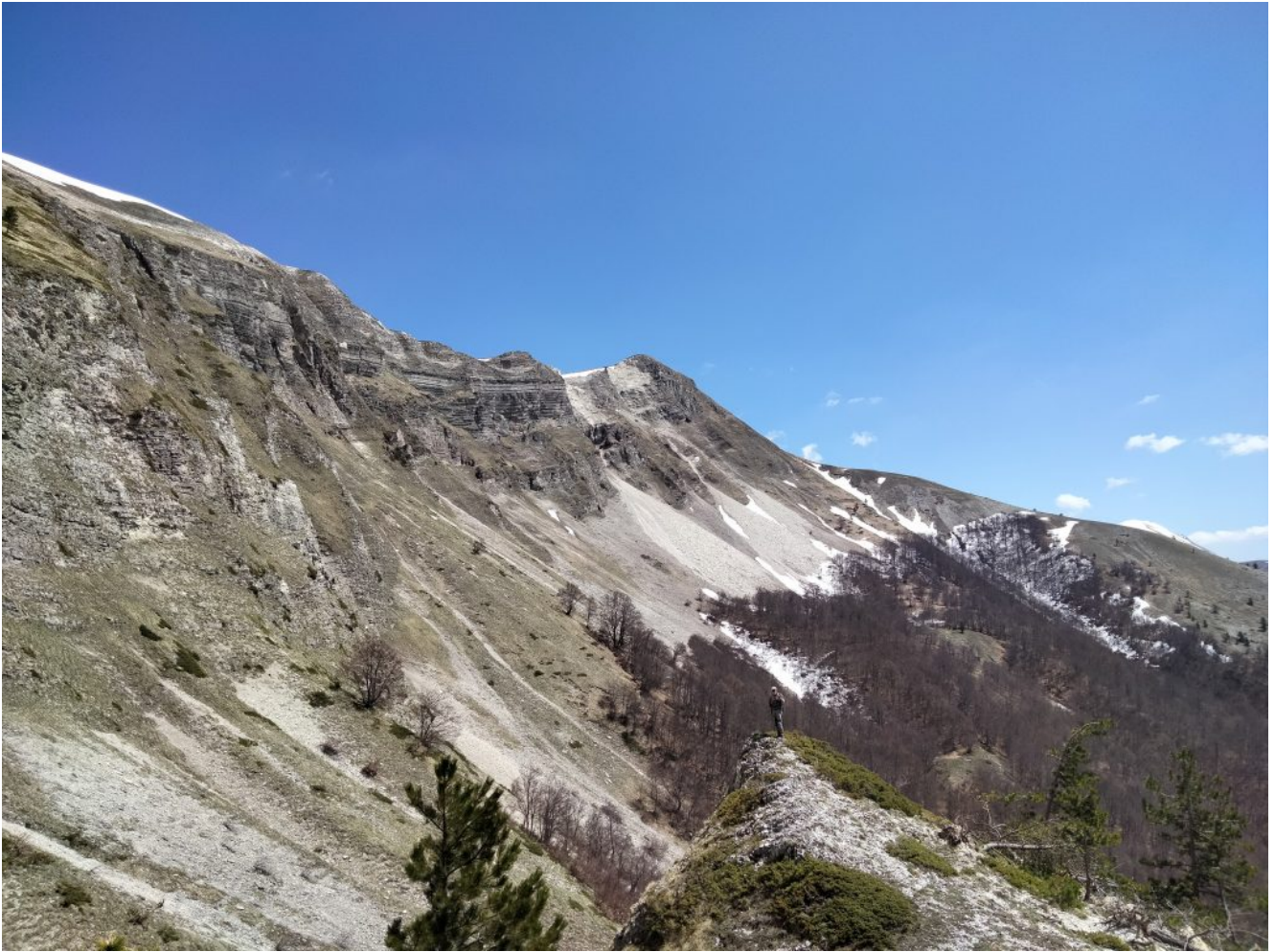
49- Lo spuntone roccioso da cui si scende dalla Fonte del Lupo verso Macchie di Vallinfante.