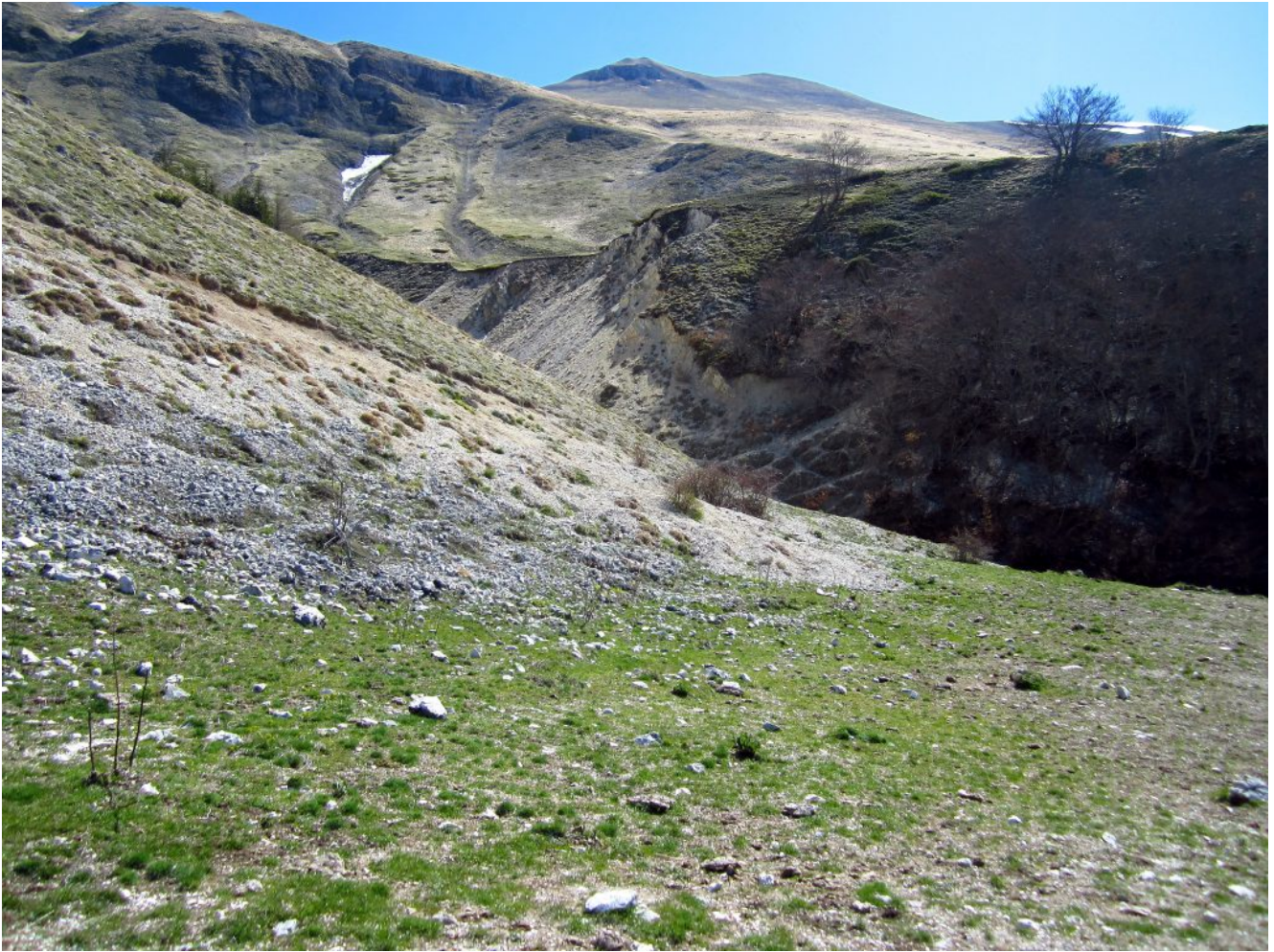
17- La spianata a monte della Fonte delle Vene, sul pendio di fronte sopra la canale detritico si nota il sentiero che sale in diagonale verso la Cima di Vallinfante in alto.