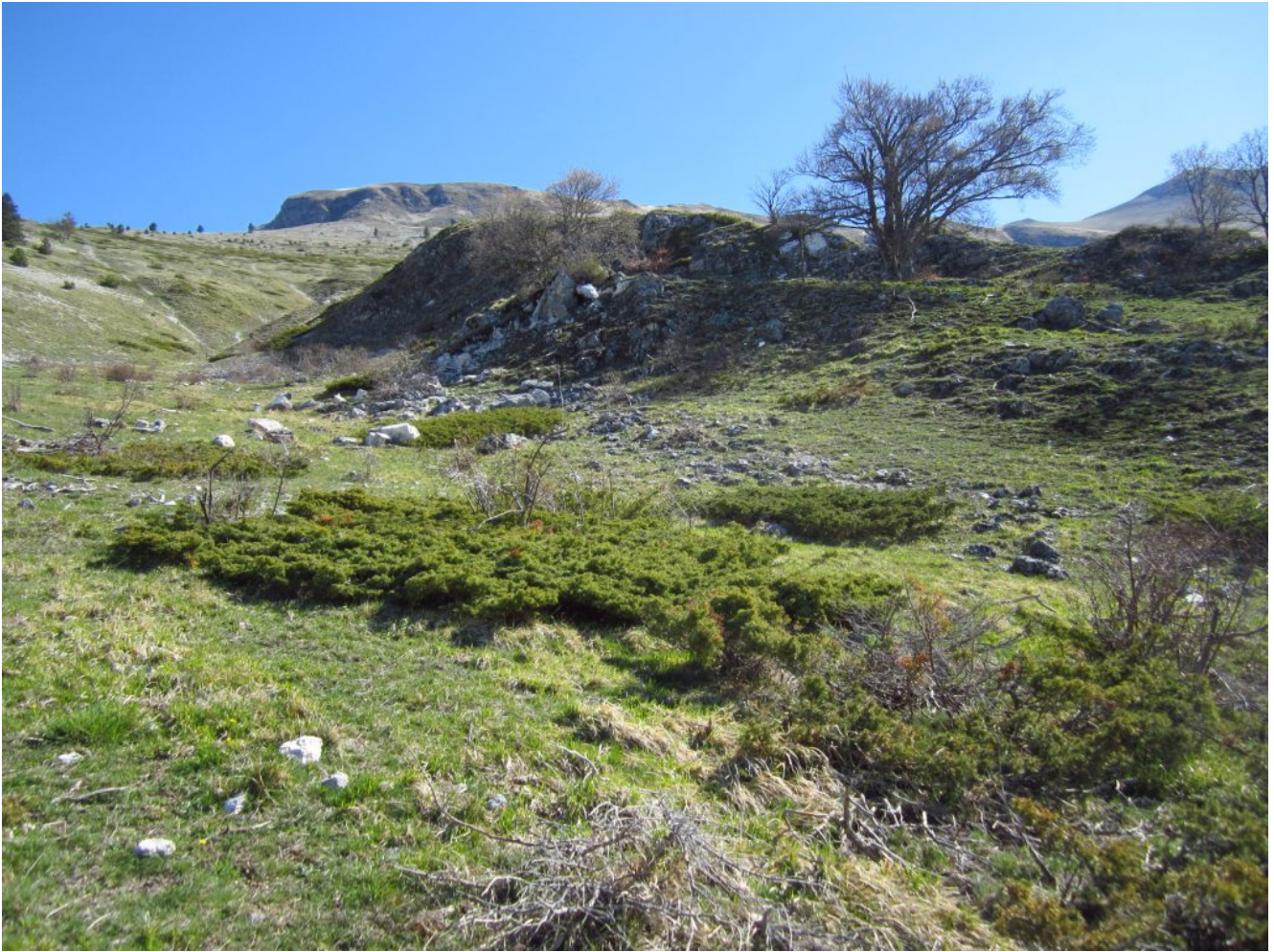
8- La cresta rocciosa sopra al tratto degradato dalle slavine con il grande faggio isolato sopra il quale si ritrova il sentiero, visibile alla sua destra.