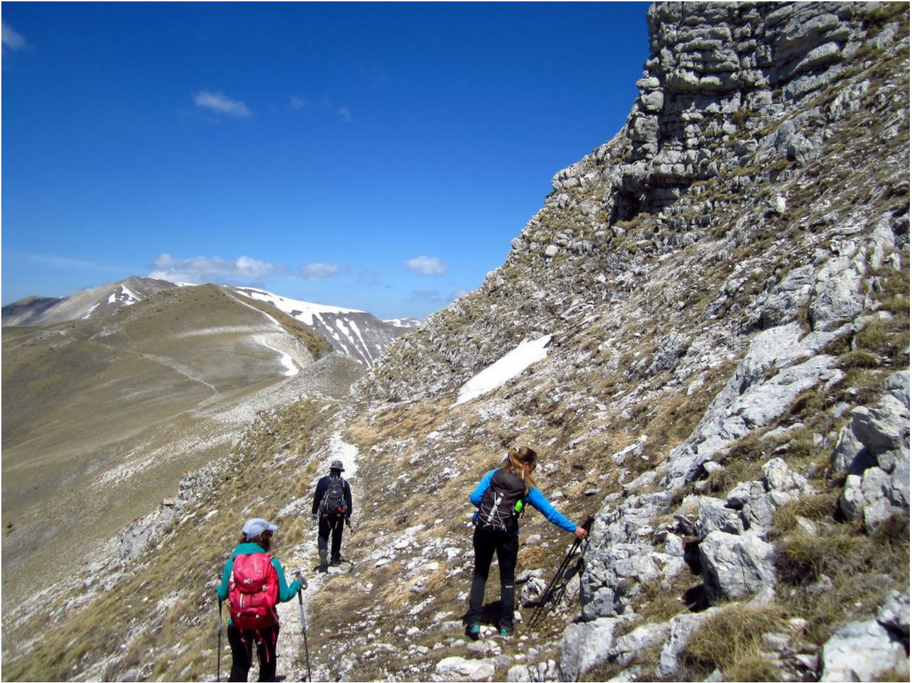
30- Le rocce sotto alla Cima di Vallinfante, a sinistra la Cima di Passo Cattivo.