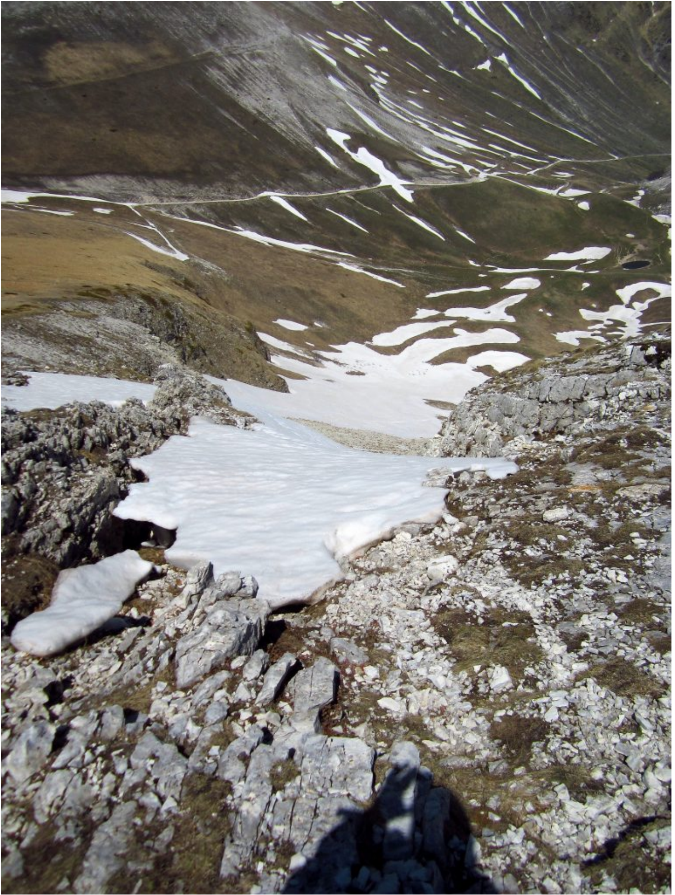
39- L'uscita del ripido canale di salita invernale de "Le Fosse" descritto a pagina 98 del mio libro IL FASCINO DEI MONTI SIBILLINI.