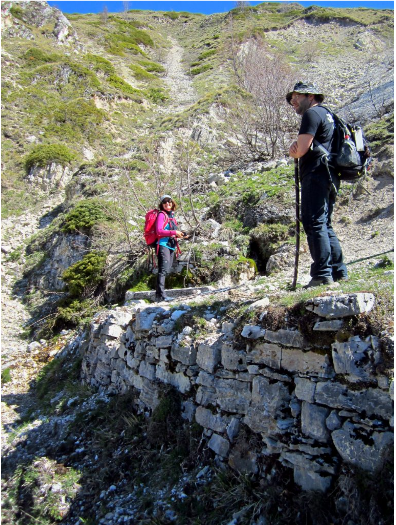
15- L'antico muretto a secco della Fonte delle Vene.