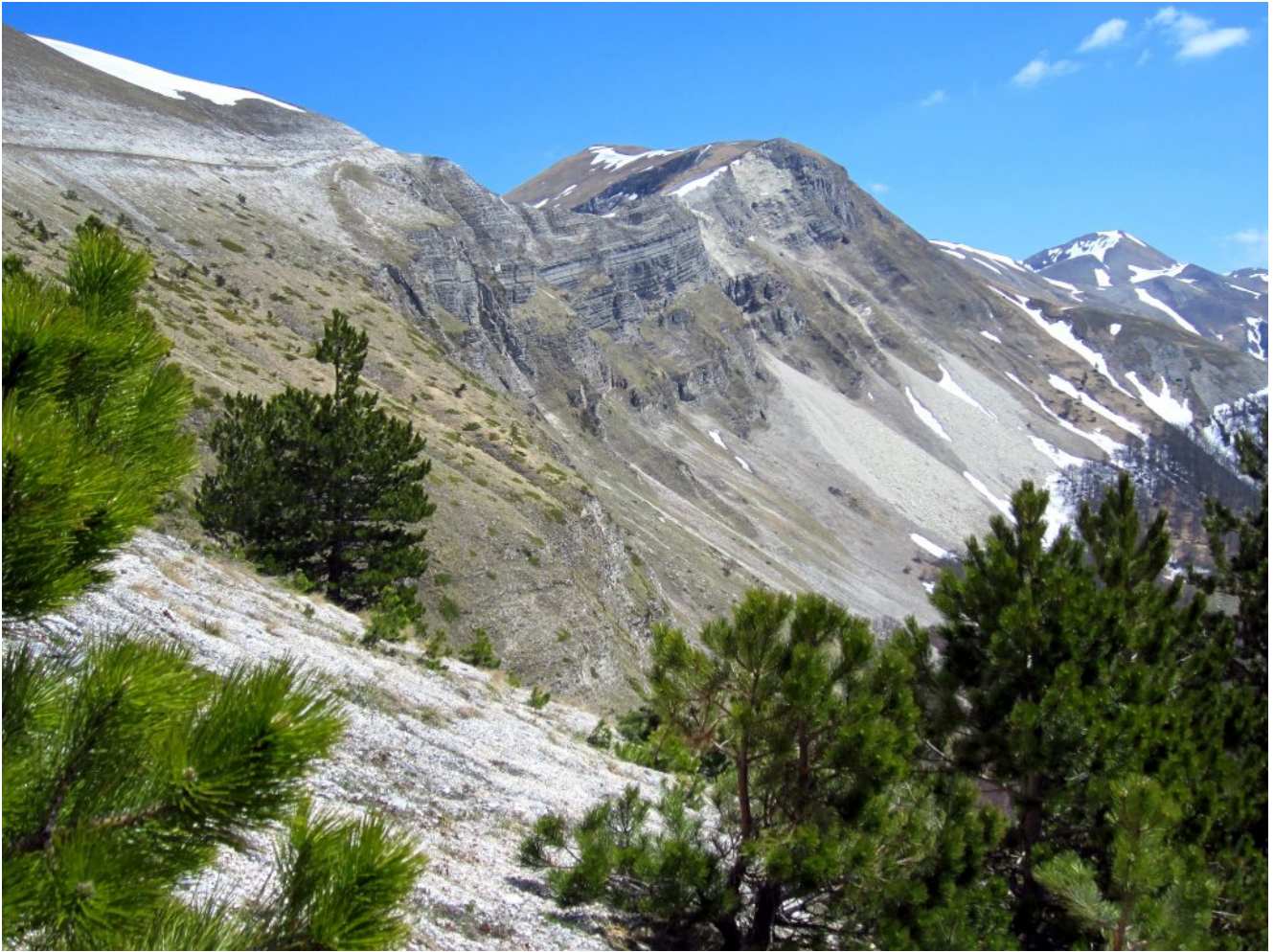
47- Il Passo Cattivo visto dal sentiero che dalla strada scende verso la Fonte del Lupo.