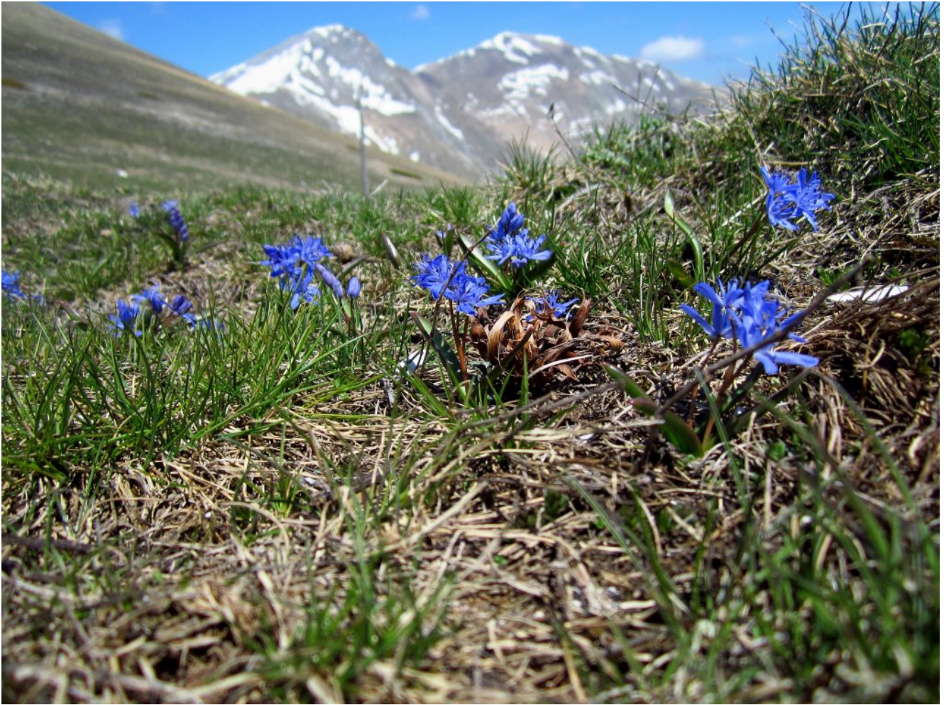
45- Scille ( Scilla bifolia VELENOSA) al Passo Cattivo, sullo sfondo il Pizzo Berro ed il Pizzo Regina.