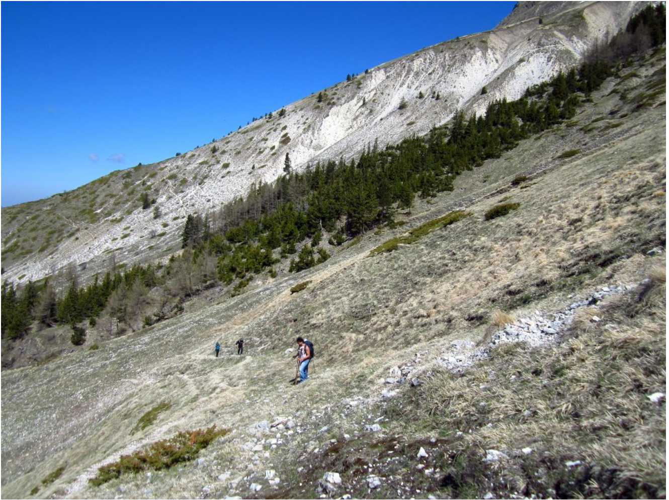
24- Il rimboschimento della foto n.23 con il sentiero che proviene da Colle La Croce, visibile nel pendio a sinistra sullo sfondo.