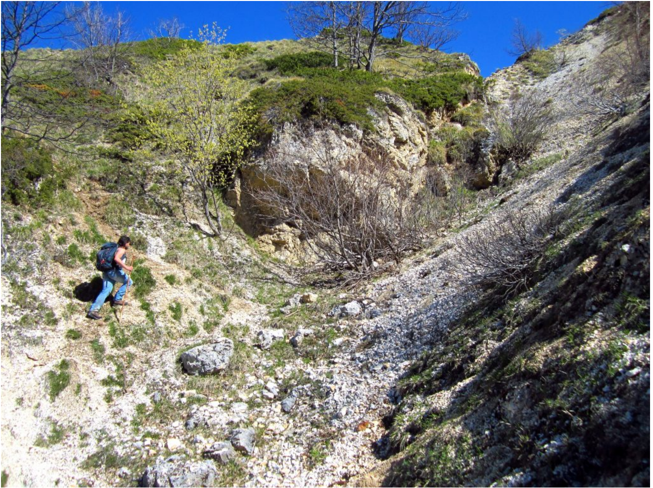
12- Il canale detritico con la grotticella, poco prima della Fonte delle Vene.