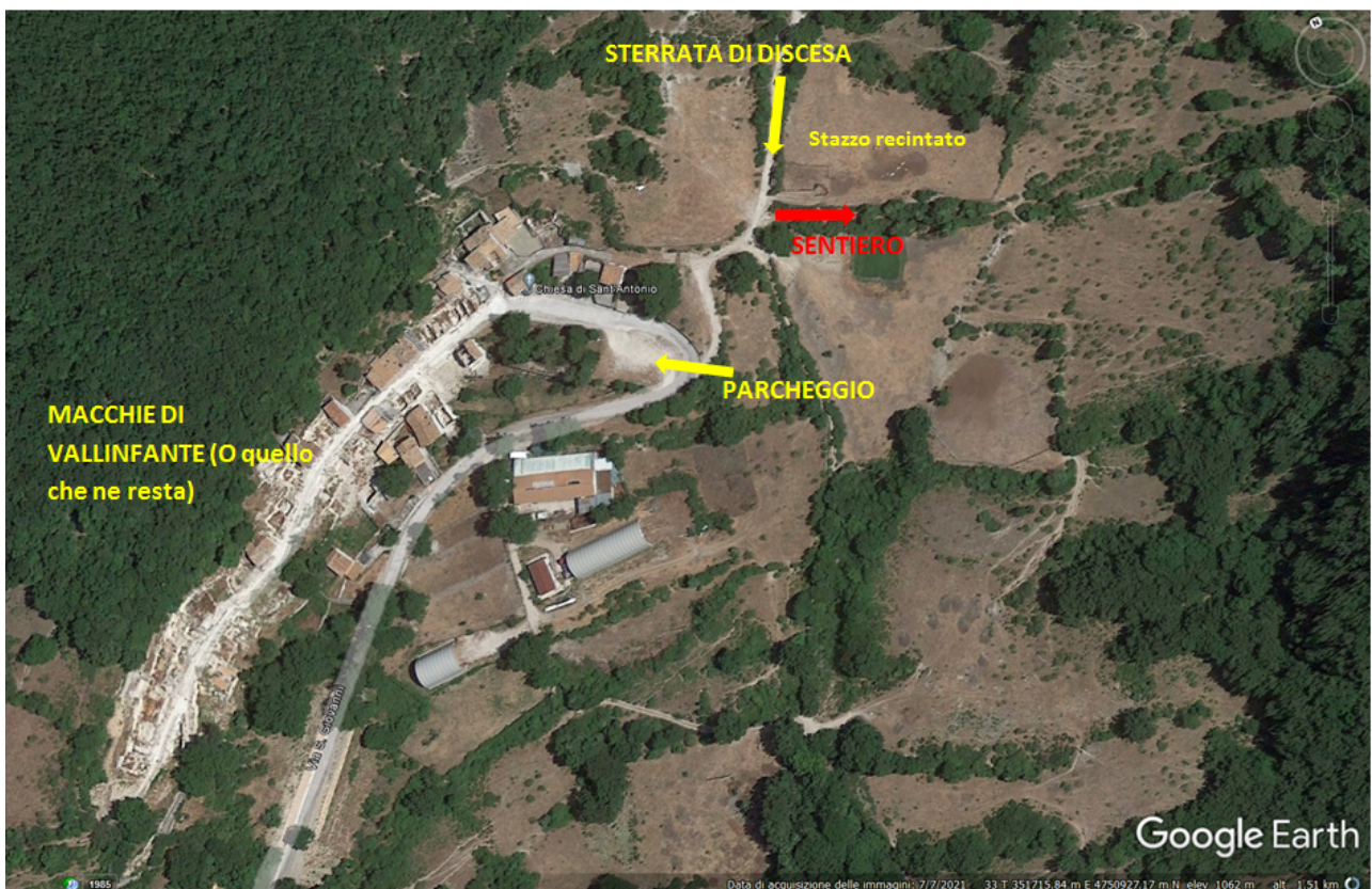
DETTAGLIO SATELLITARE DI MACCHIE DI VALLINFANTE con inizio percorso di salita e fine discesa