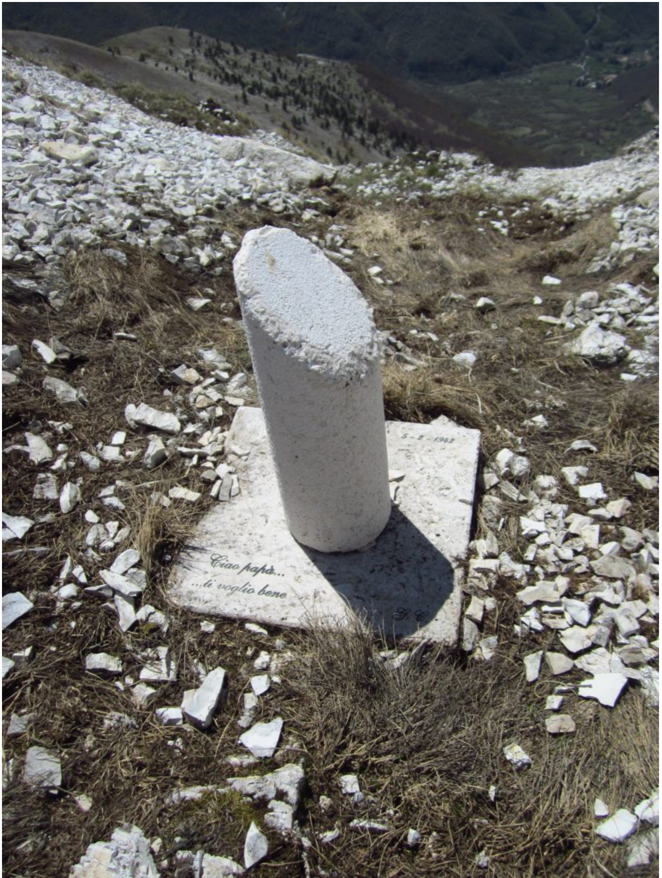
44- Al Passo Cattivo, proprio nei pressi di una frana, una lapide ricordativa di un amante dei nostri Monti scomparso.