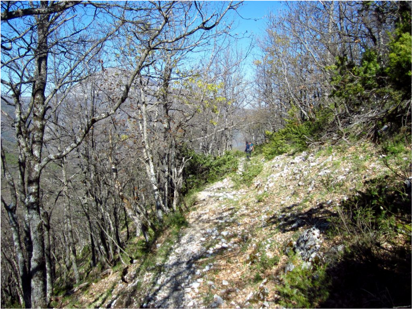
4- Il sentiero nel bosco dopo "le pianelle"