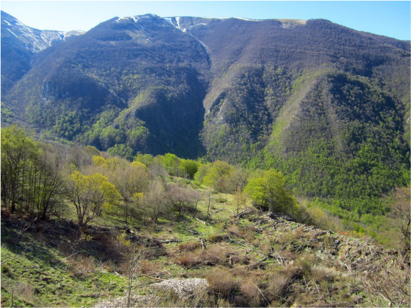
7- Il tratto di bosco degradato dalle slavine con il Monte Prata di fronte.