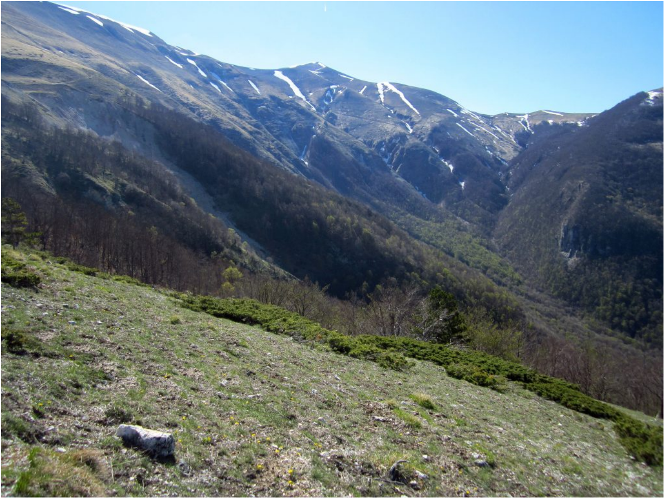
11- Il fondo il Monte Porche con i ripidi canali delle “Porche di Vallinfante”.