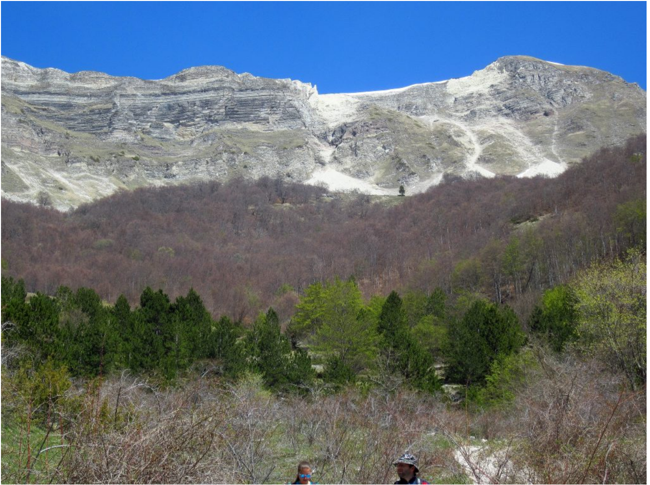
54- Le frane del versante Ovest del Passo Cattivo.