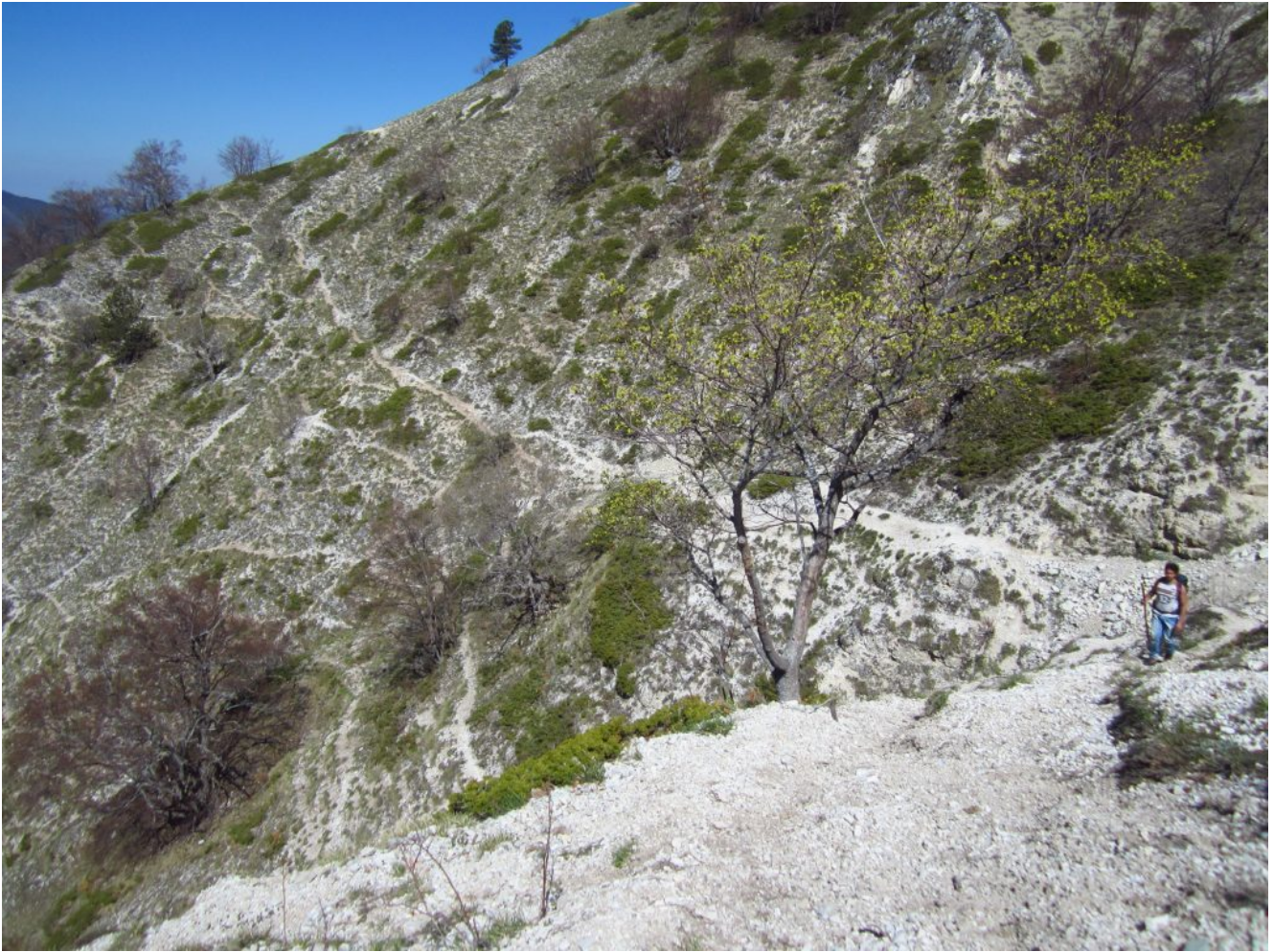
16- Il traverso della foto n. 13 visto da oltre la Fonte delle Vene.