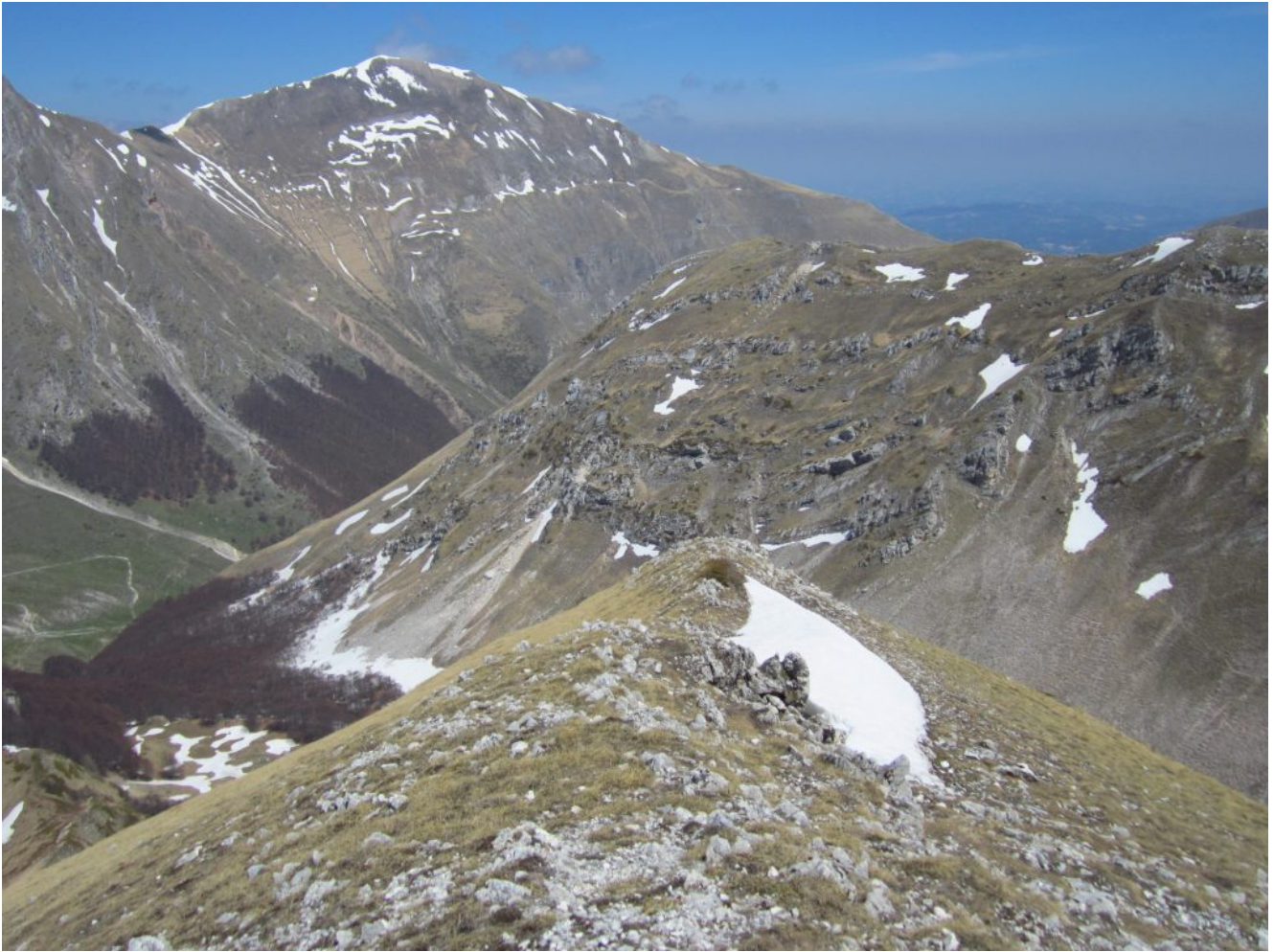
37- La Cima di Passo Cattivo con lo sfondo della Cima Cannafusto.