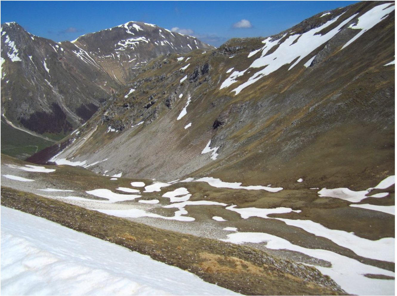
34- La Valle Orteccia e la Cima Cannafusto.