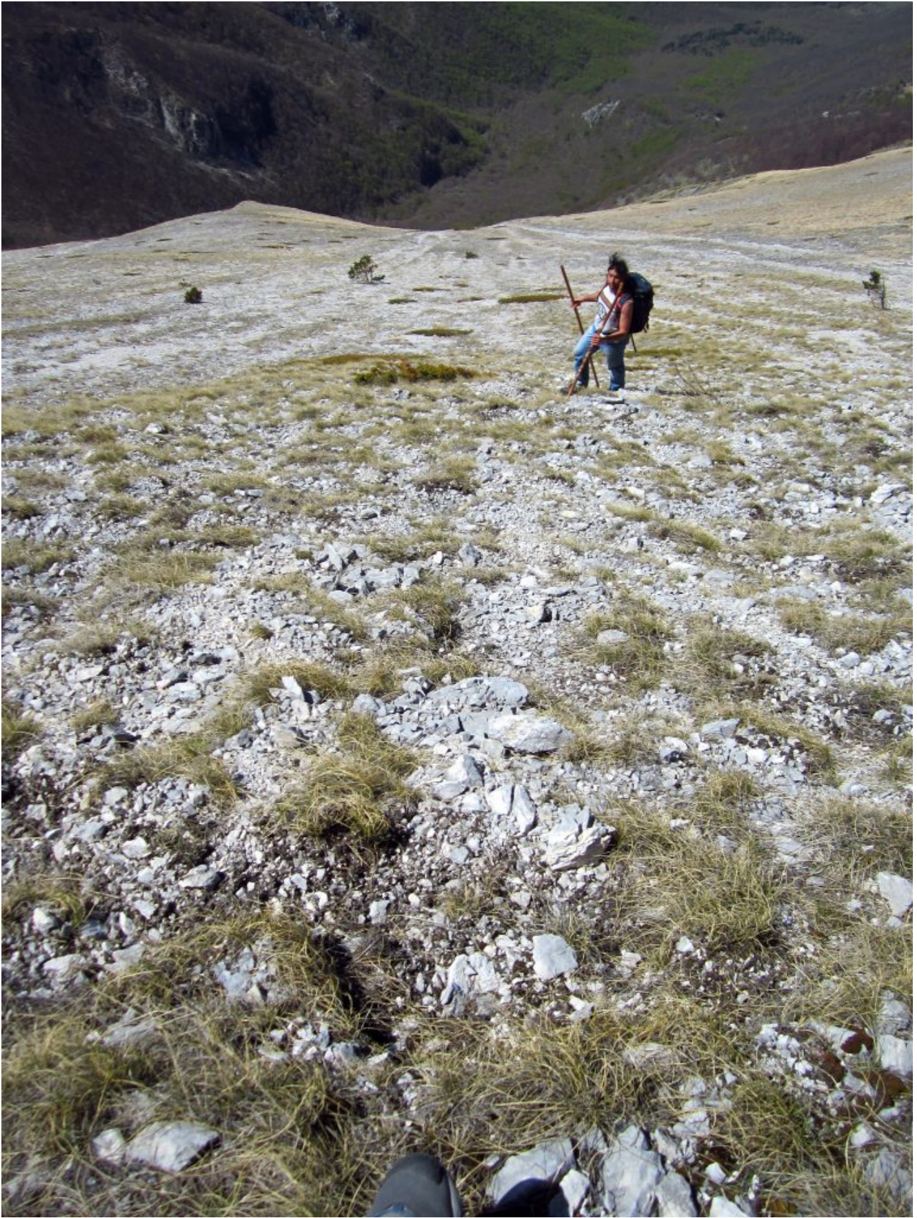
28- Il pendio di risalita nella zona delle Porche di Vallinfante.