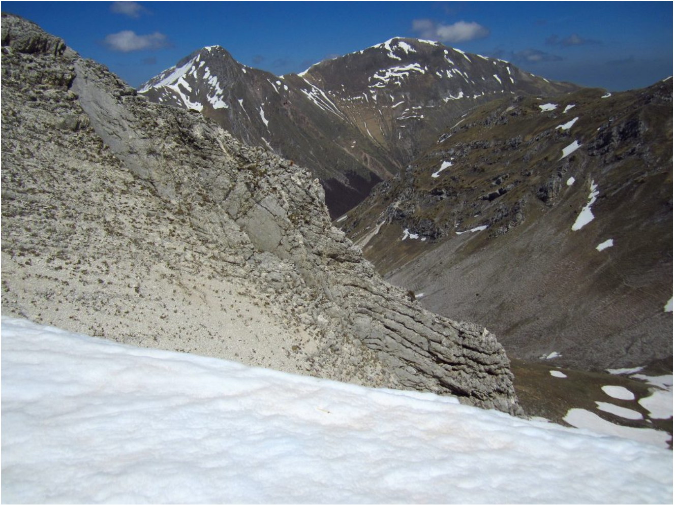
35- Il Pizzo Berro a sinistra e il Pizzo Regina (o Monte Priora) a destra.