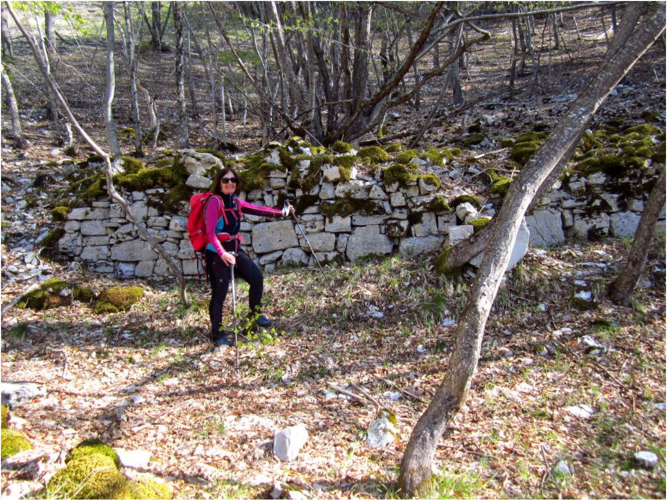
5- La radura con il grande antico muro a secco prima del tratto degradato dalle slavine.