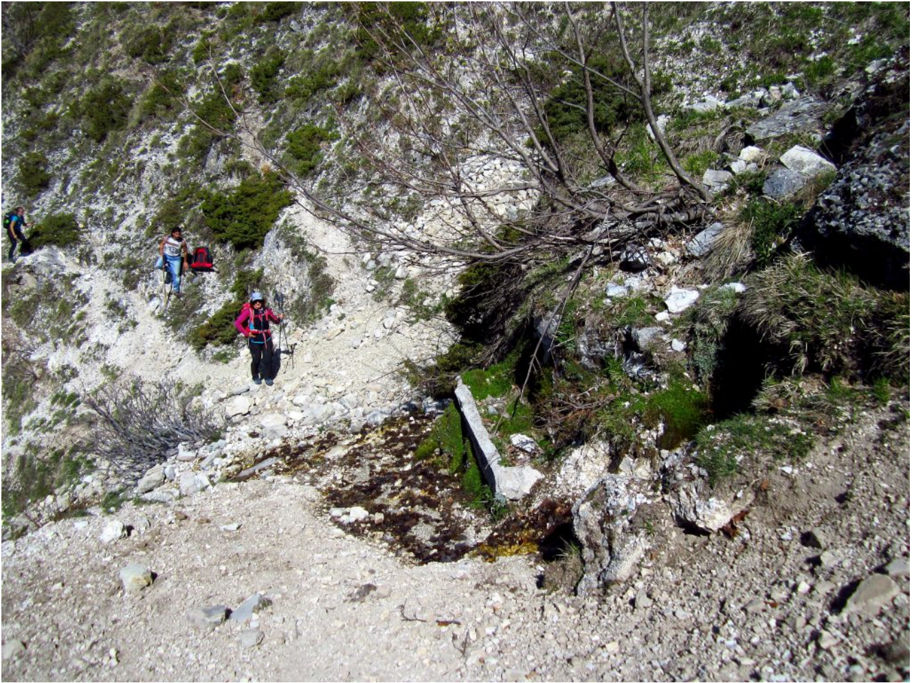
14- La Fonte delle Vene.