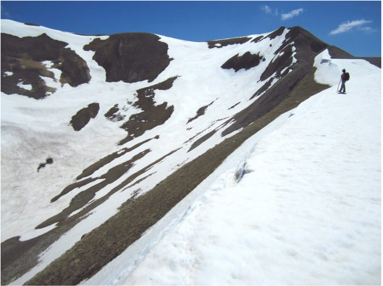
32 – 33- la cresta dalla Cima di Vallinfante (a destra) che prosegue verso la Cima di Passo Cattivo.