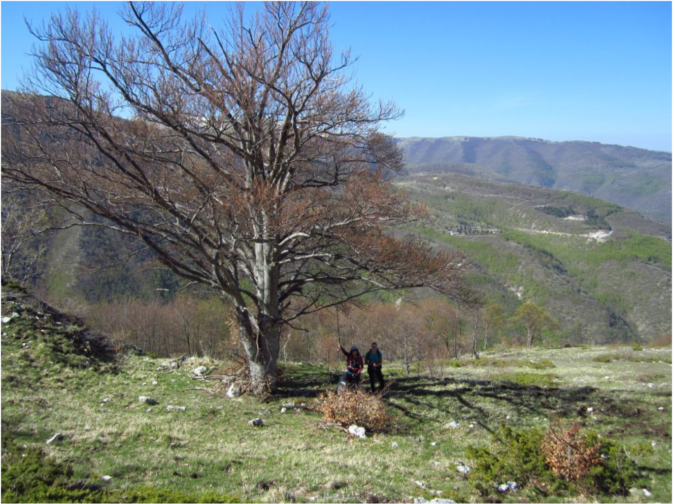
9- Il grande faggio isolato con il camping di monte Prata di fronte.