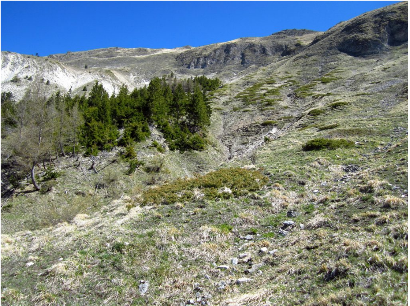
23- Il rimboscimento a pini e larici sotto alla Cima di Passo Cattivo visibile in alto.