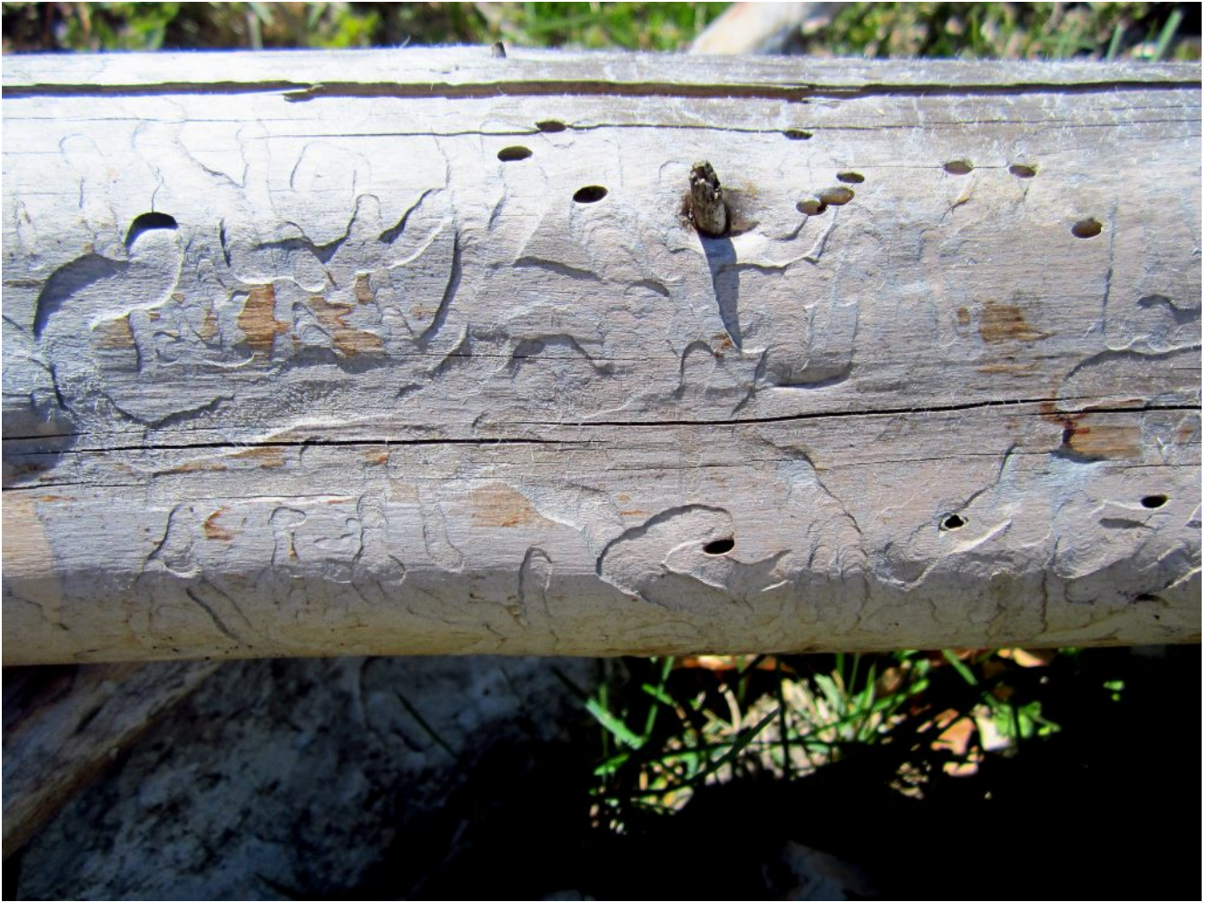
19- ramo di pino finemente lavorato dai tarli.