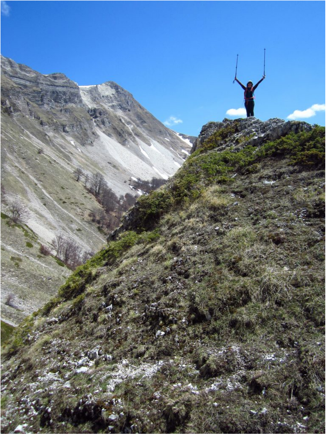
51 – 52- Lo spuntone della foto n.49