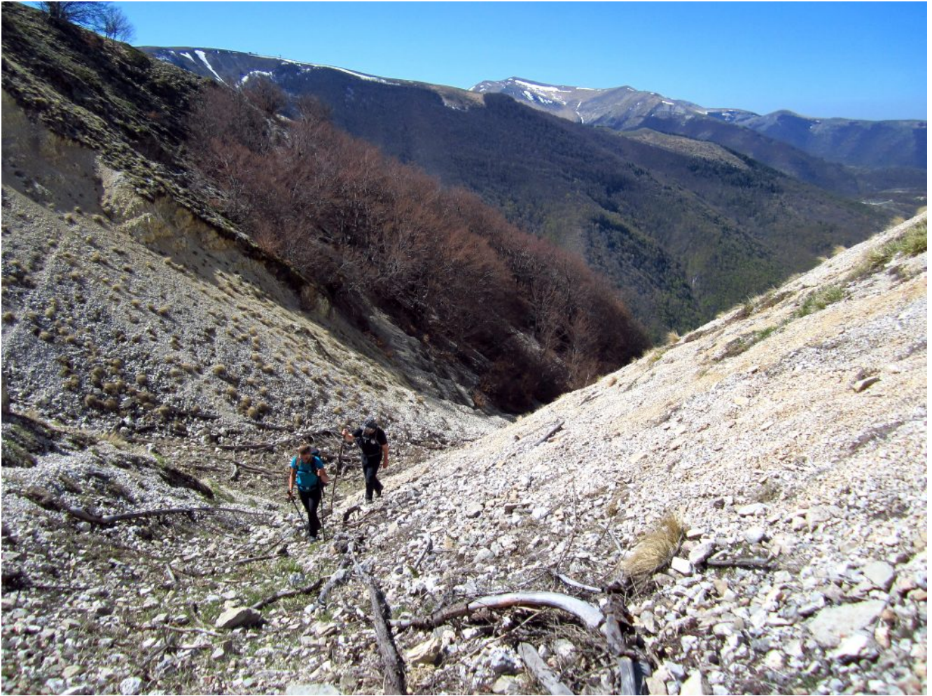
20- Il ramo sinistro del canale detritico sotto al rimboschimento.