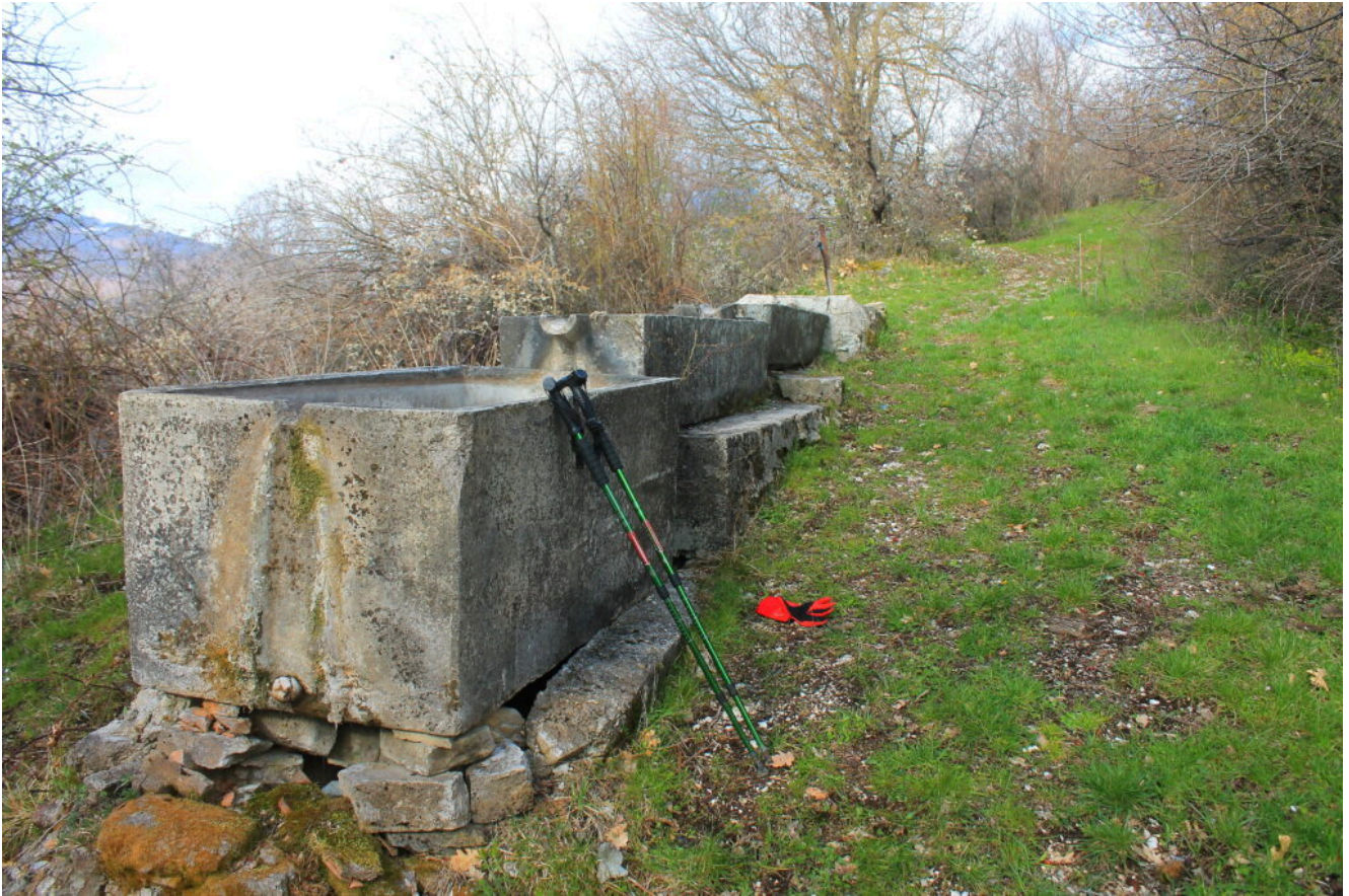
3- Il fontanile posto all'inizio del tratturo.