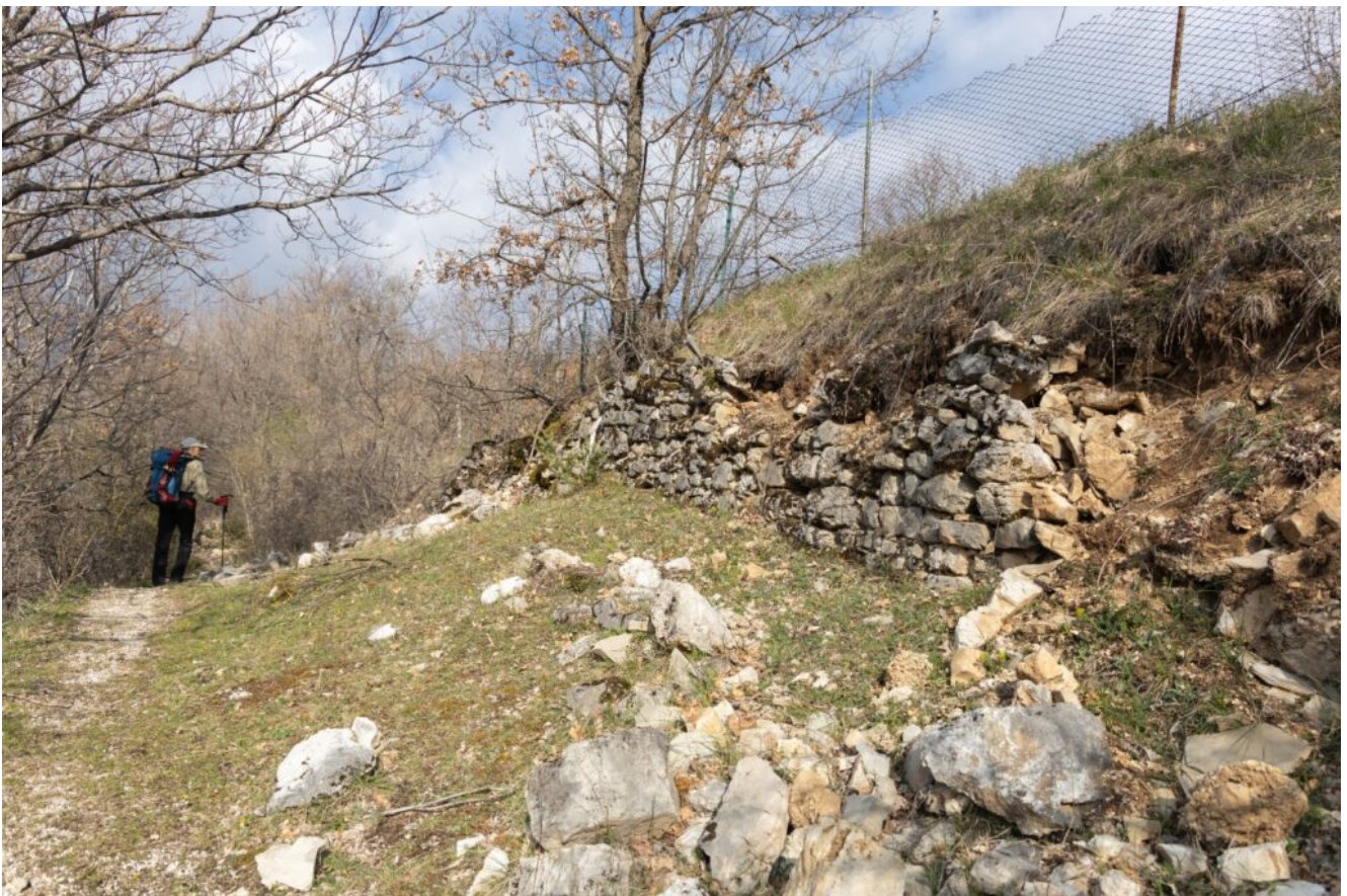
4- Gli antichi muretti a secco, ormai in parte crollati, posti a sostegno del pendio a monte del sentiero.