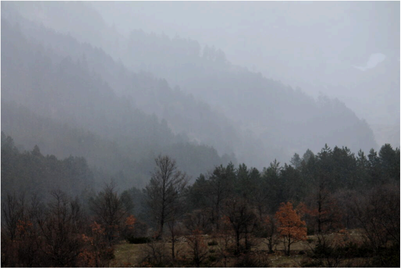
19- Ritorno verso Macchie, partiti con il sole e ritornati sotto una leggera nevicata.