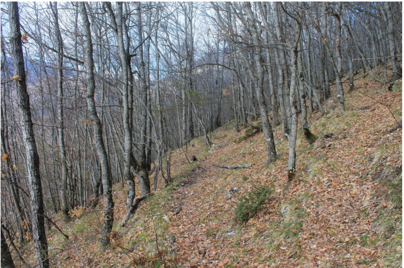
5- Il bellissimo bosco che si attraversa prima di giungere al