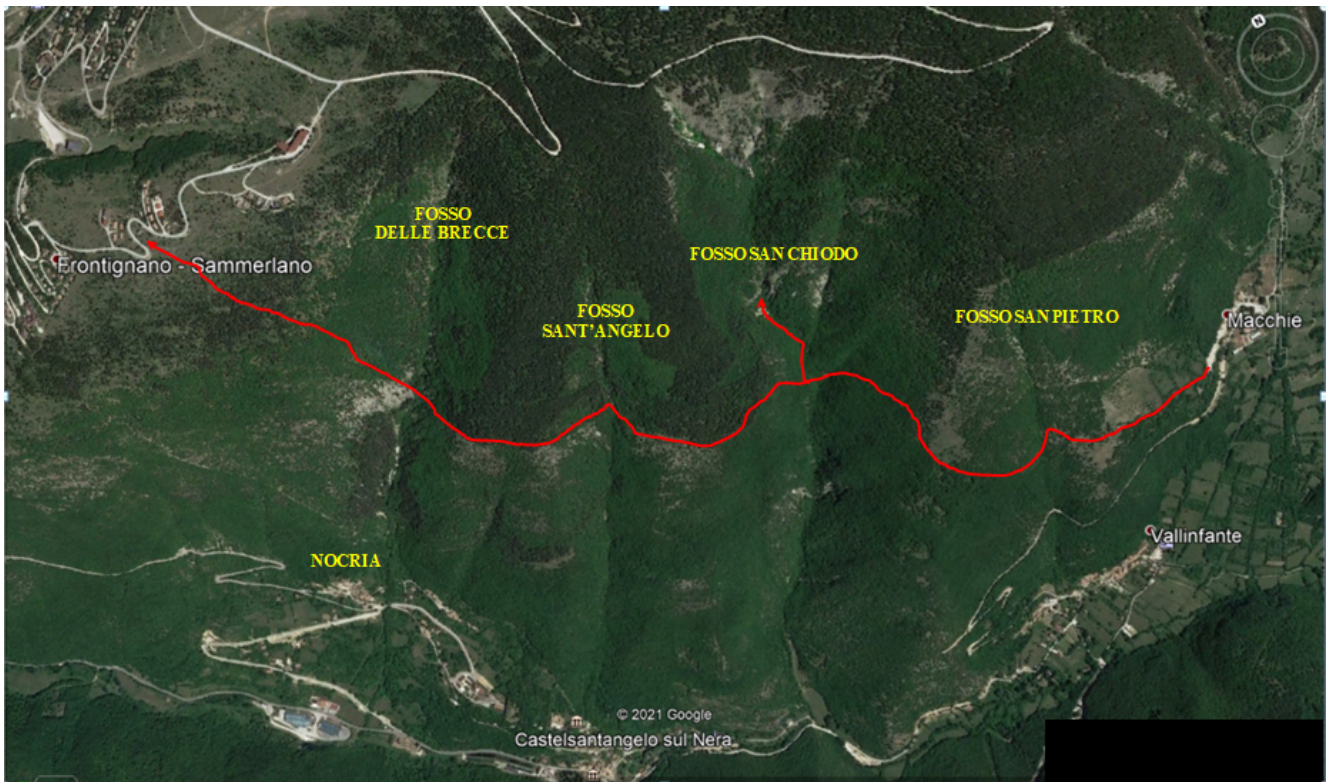
Pianta satellitare del percorso proposto.