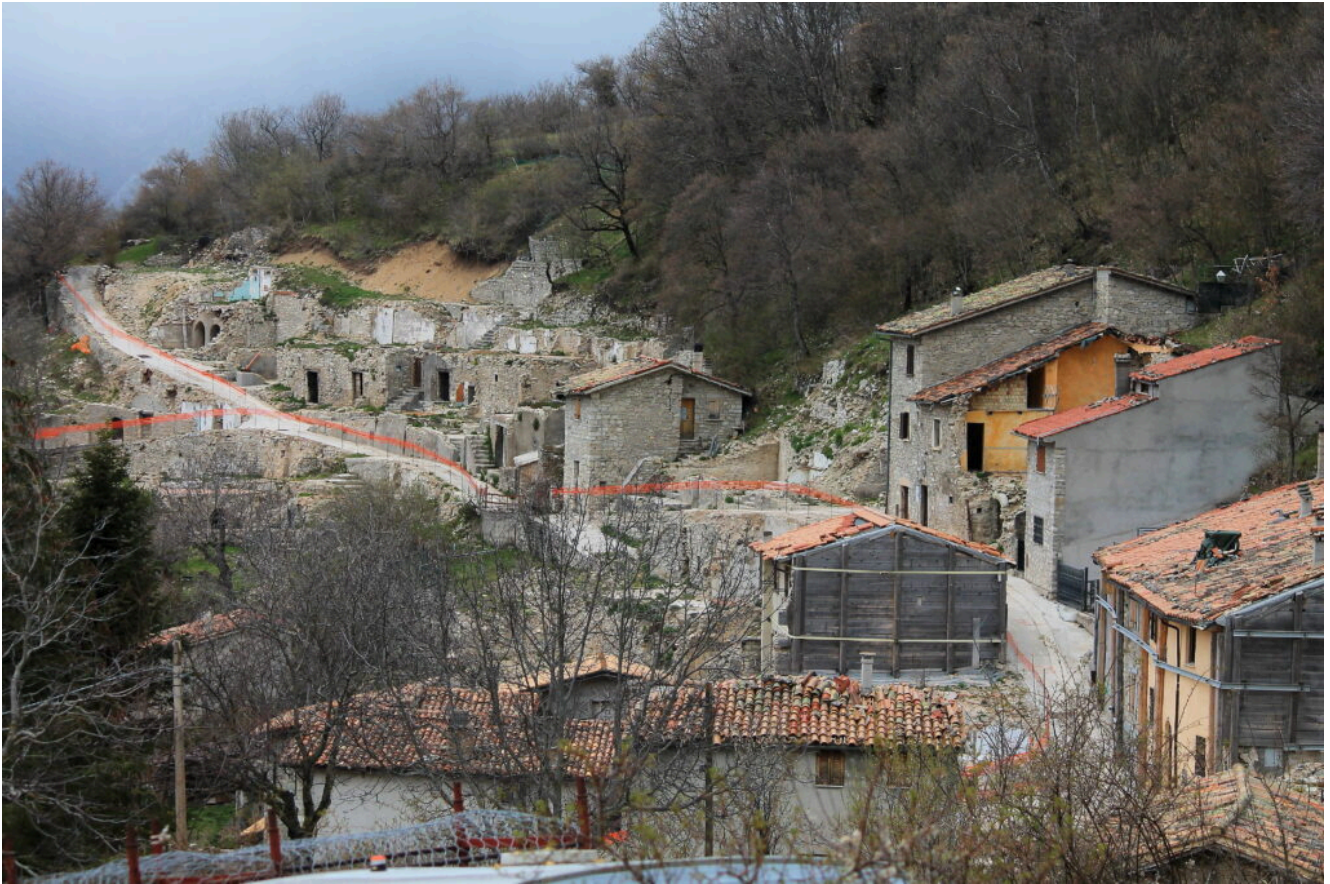
1- Ciò che rimane della frazione di Macchie, a sinistra, in fondo alla via, parte l'itinerario proposto.