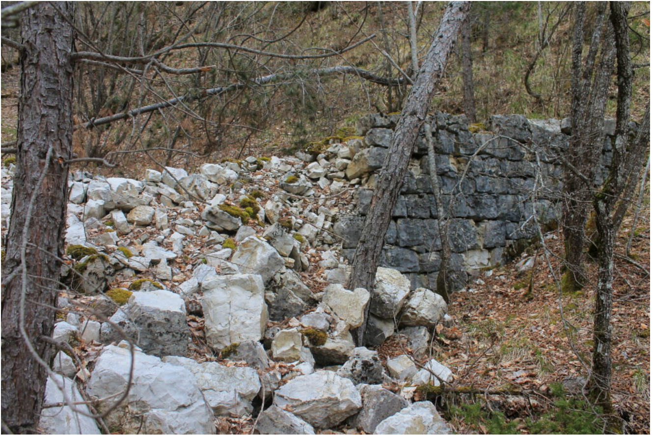
17- Un altro vecchio muretto di contenimento crollato al Fosso di Sant'Angelo