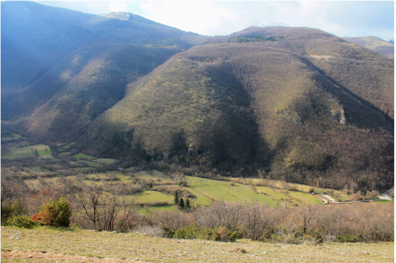
4- I campi di Vallinfante e le pendici di Monte Prata di fronte con il sentiero appena visibile che scende dal camping omonimo.