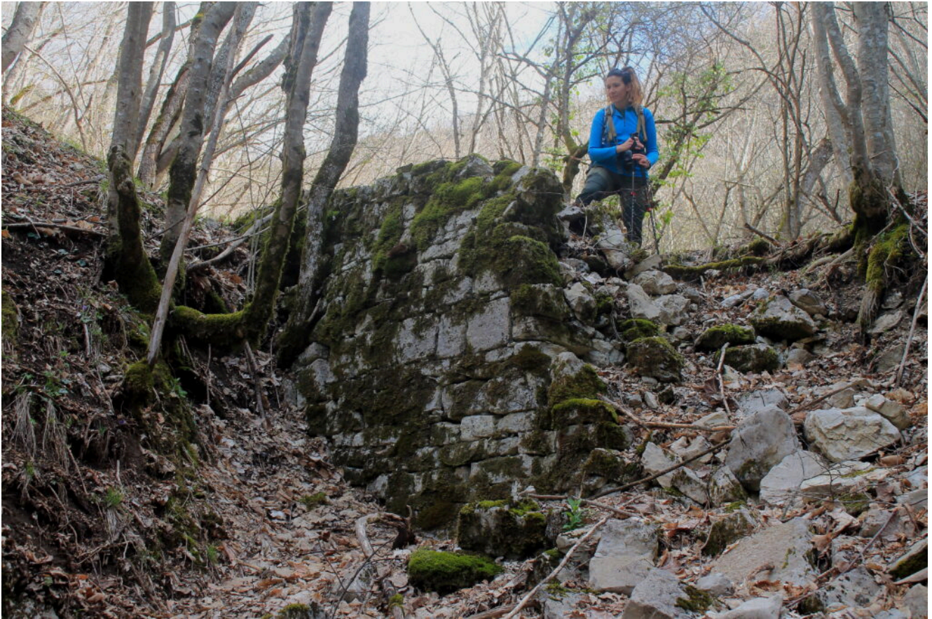
7 – 8- Il muretto di contenimento posto a valle del Fosso di San Chiodo anch'esso in parte crollato.