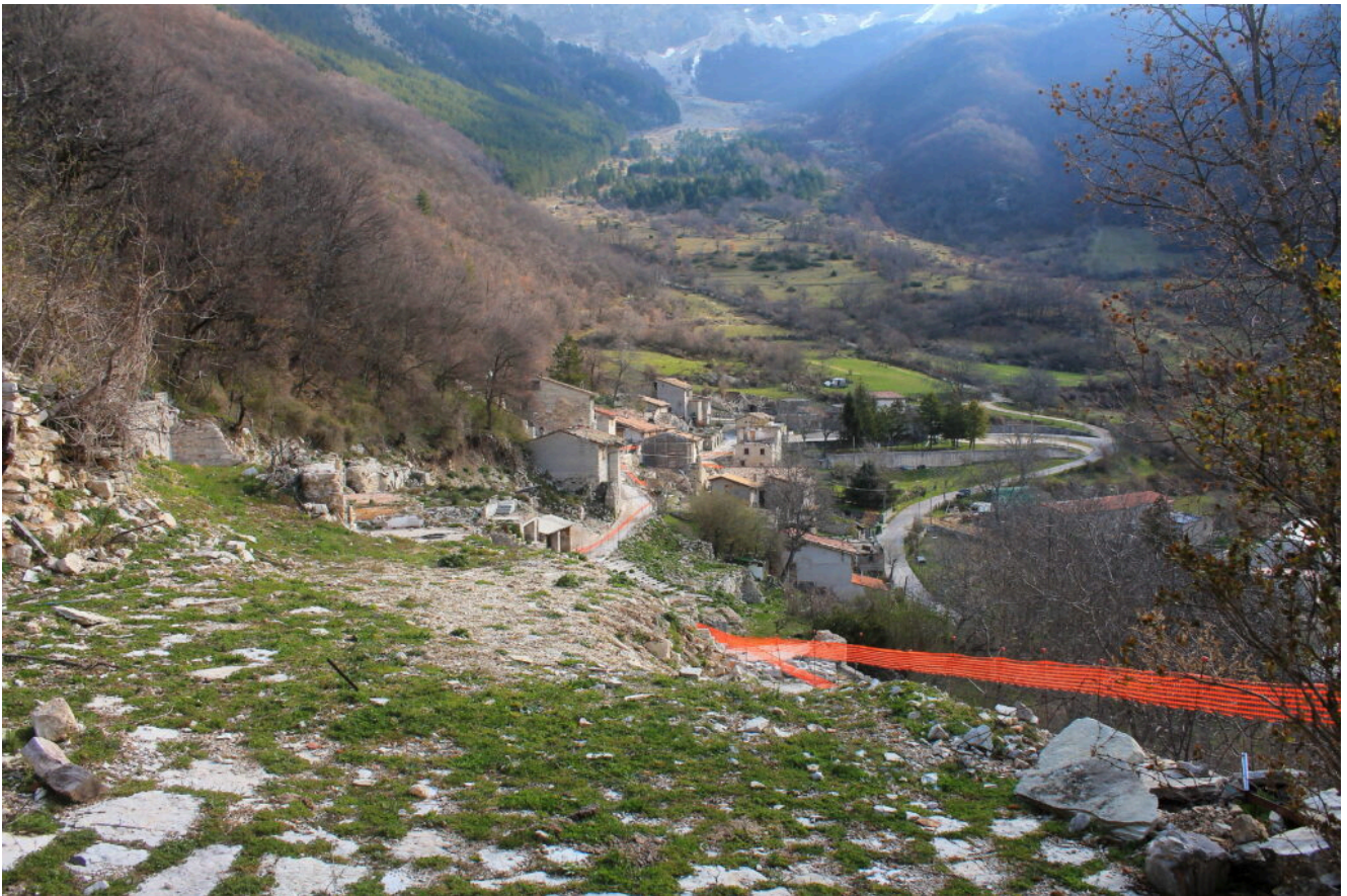
2- L'abitato di Macchie visto dall'inizio del tratturo