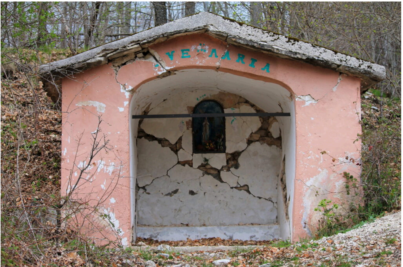
20 Edicola posta a valle di Macchie sul vecchio sentiero che