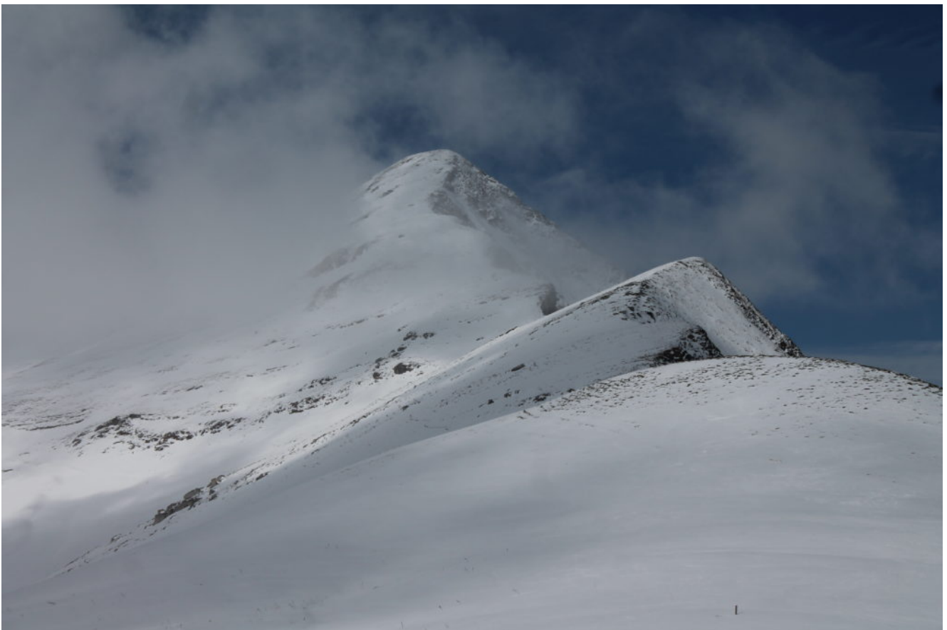
7- La Cima Acquario ed il Monte Acuto sullo sfondo.