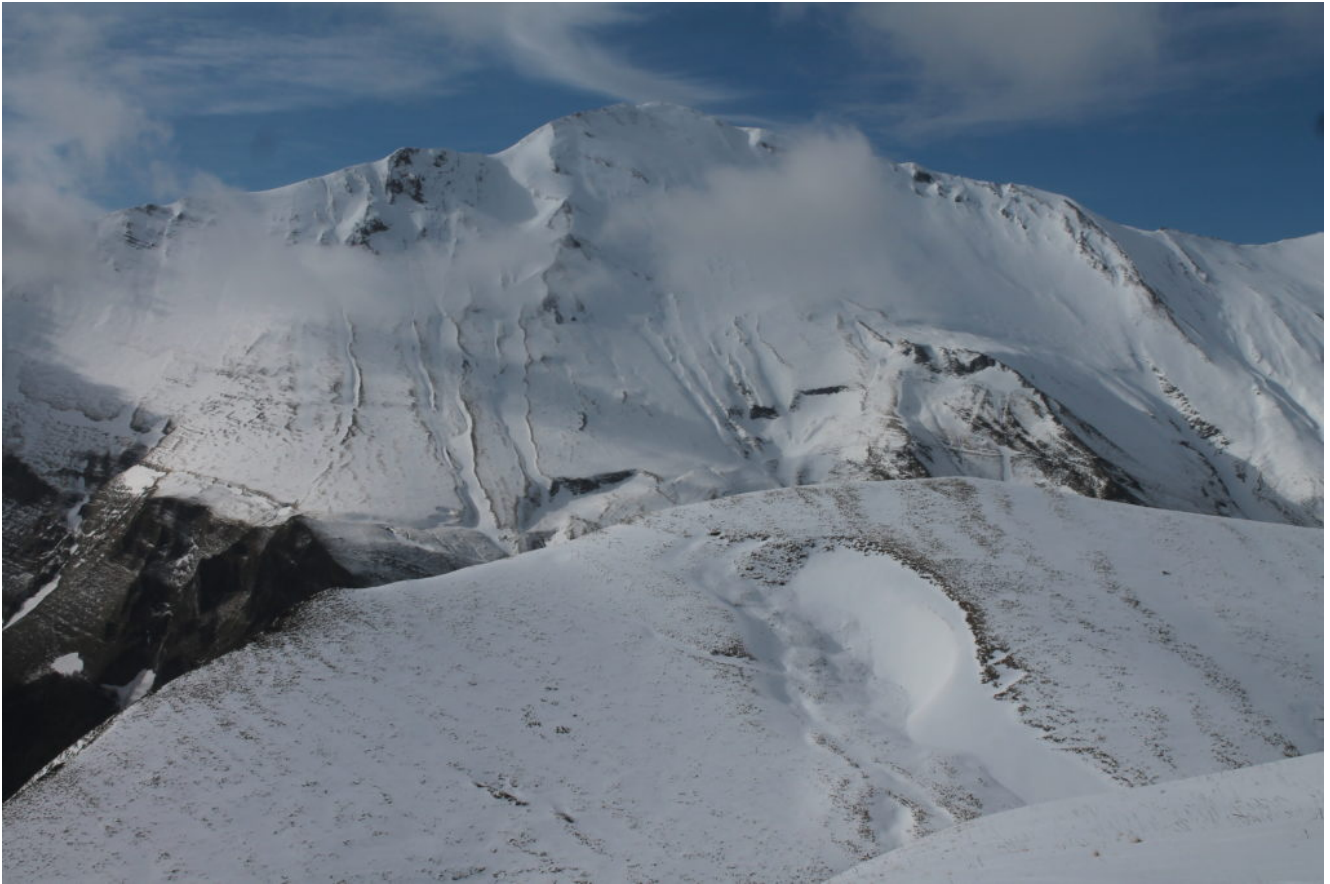
6- Il versante nord del Monte Priora o Pizzo Regina.