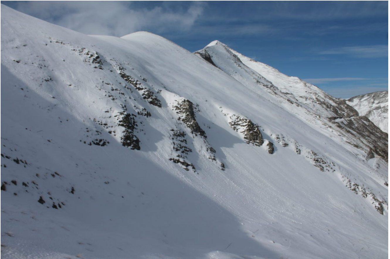
4- Salendo verso Forcella Bassete.