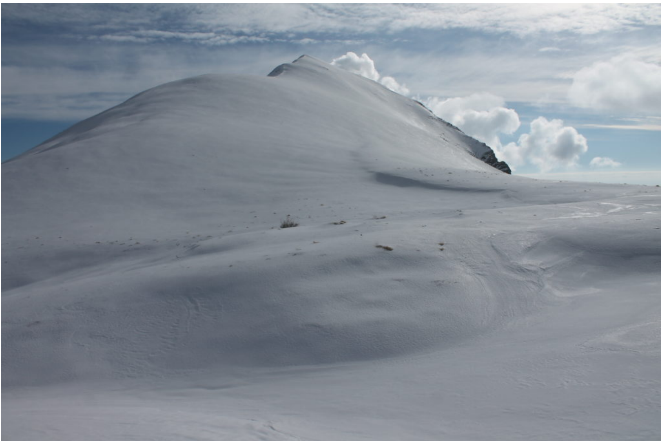
5- Il versante ovest del Monte Castel Manardo in versione nettamente invernale nonostante è il 17 maggio.