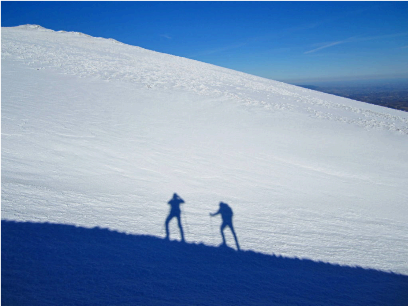
4- Le nostre ombre sulla sponda del canale