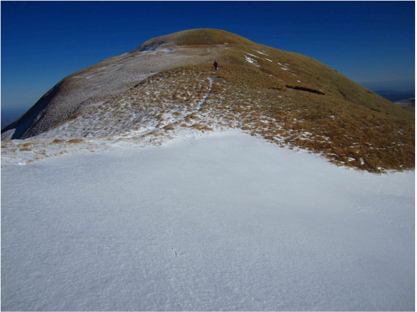
11- Il plateau sommitale tra la cima del M. Castel Manardo e lo Scoglio del Montone con la neve talmente gelata che non riuscivano a lasciare traccia.