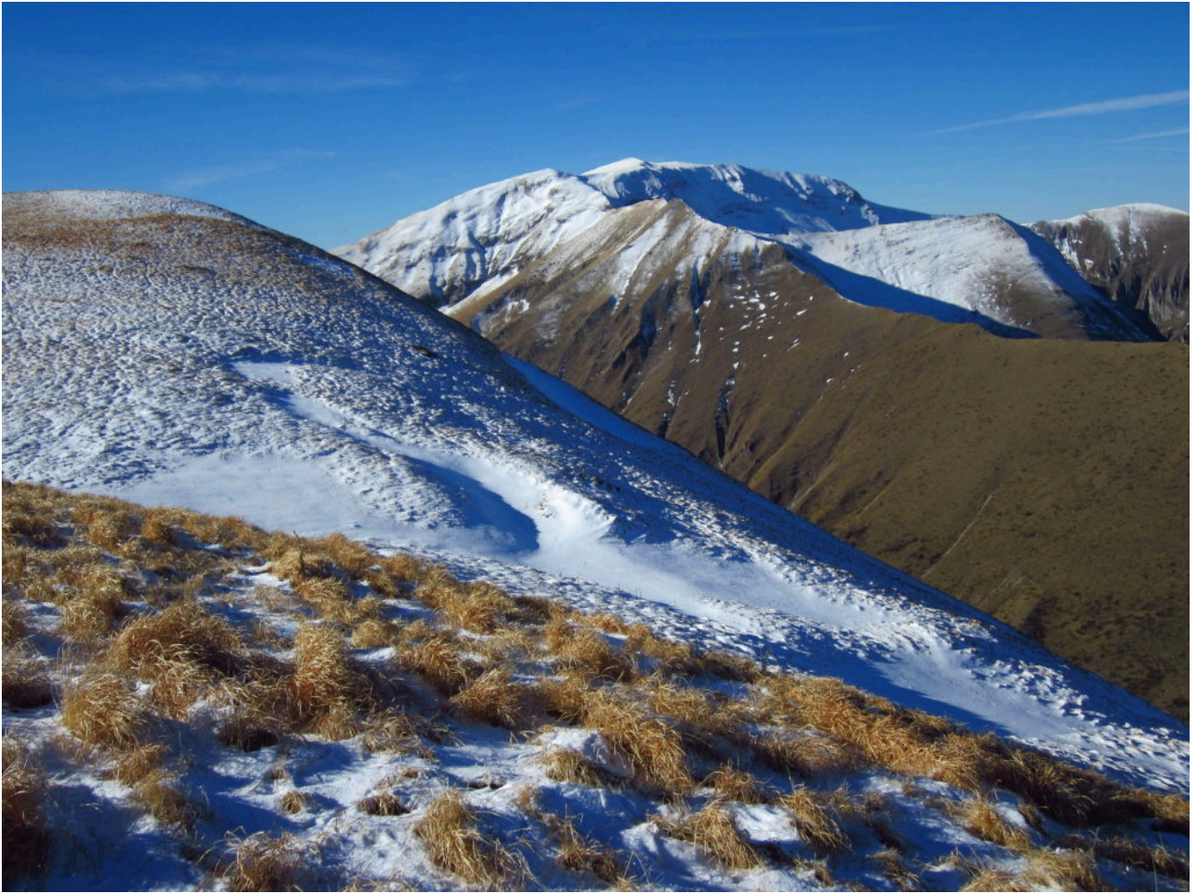
10- Sulla cima del M. Castel Manardo, il M. Rotondo sullo sfondo a destra