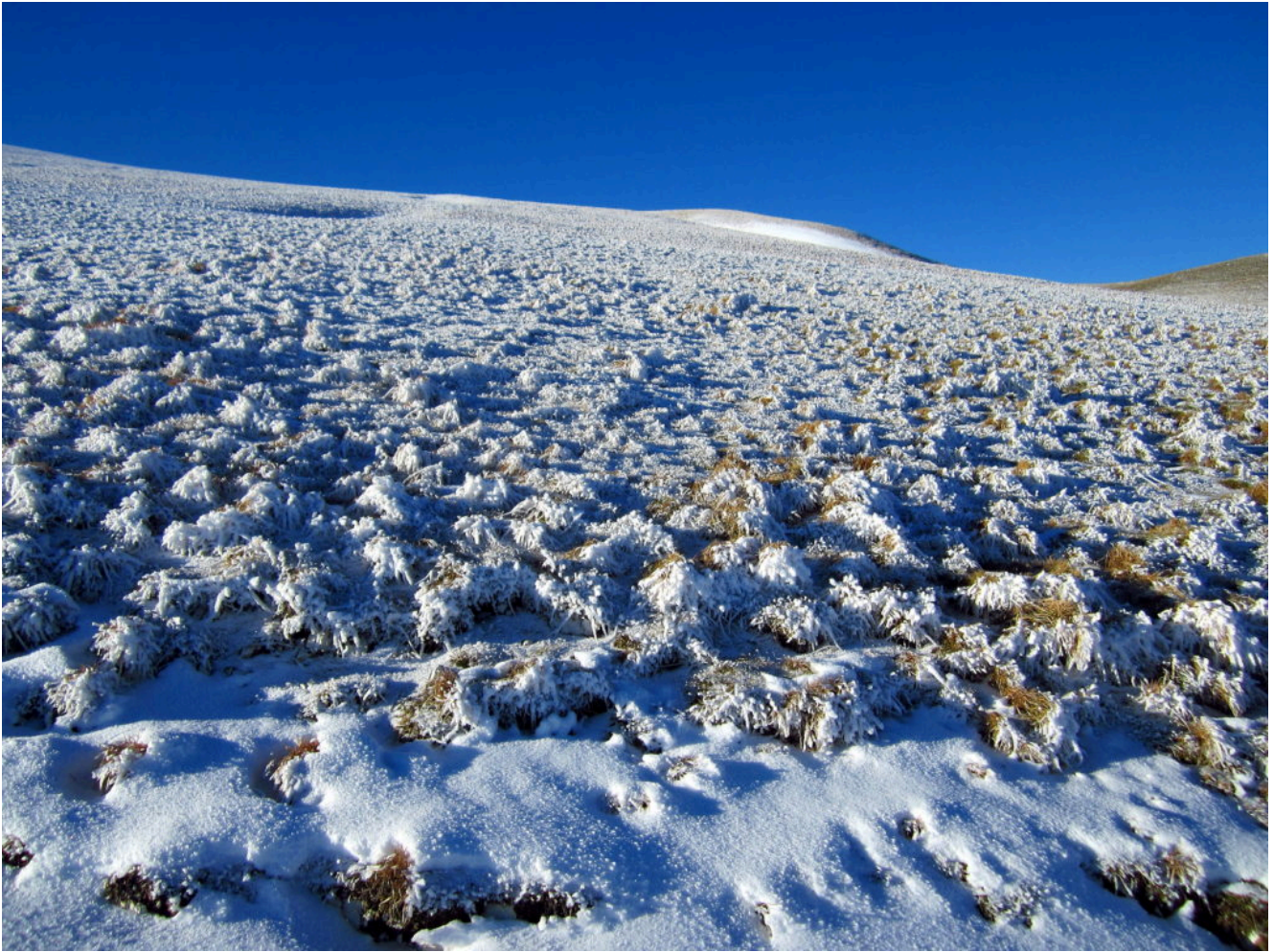
1- I prati leggermente imbiancati che salgono verso il M. Castel Manardo tra il M. Berro ed il M. Amandola