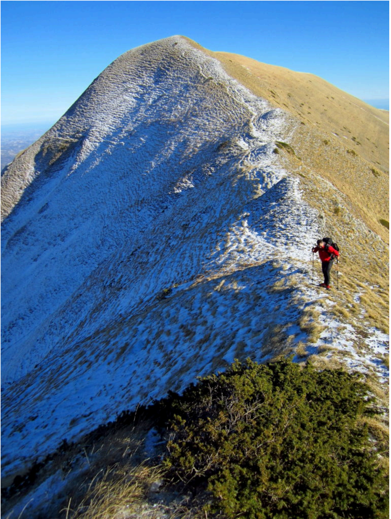
13- La cresta che scende dallo Scoglio del Montone verso Forcella Bassete con una spruzzata di neve solo sul versante Nord, gli anni passati grosse cornici di neve rendevano impegnativa questa discesa.