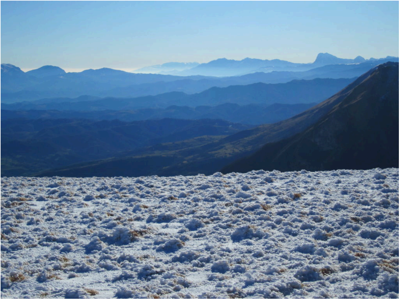
7- Veduta verso sud con il Corno Grande ed il gruppo del Gran Sasso, la Maiella sullo sfondo