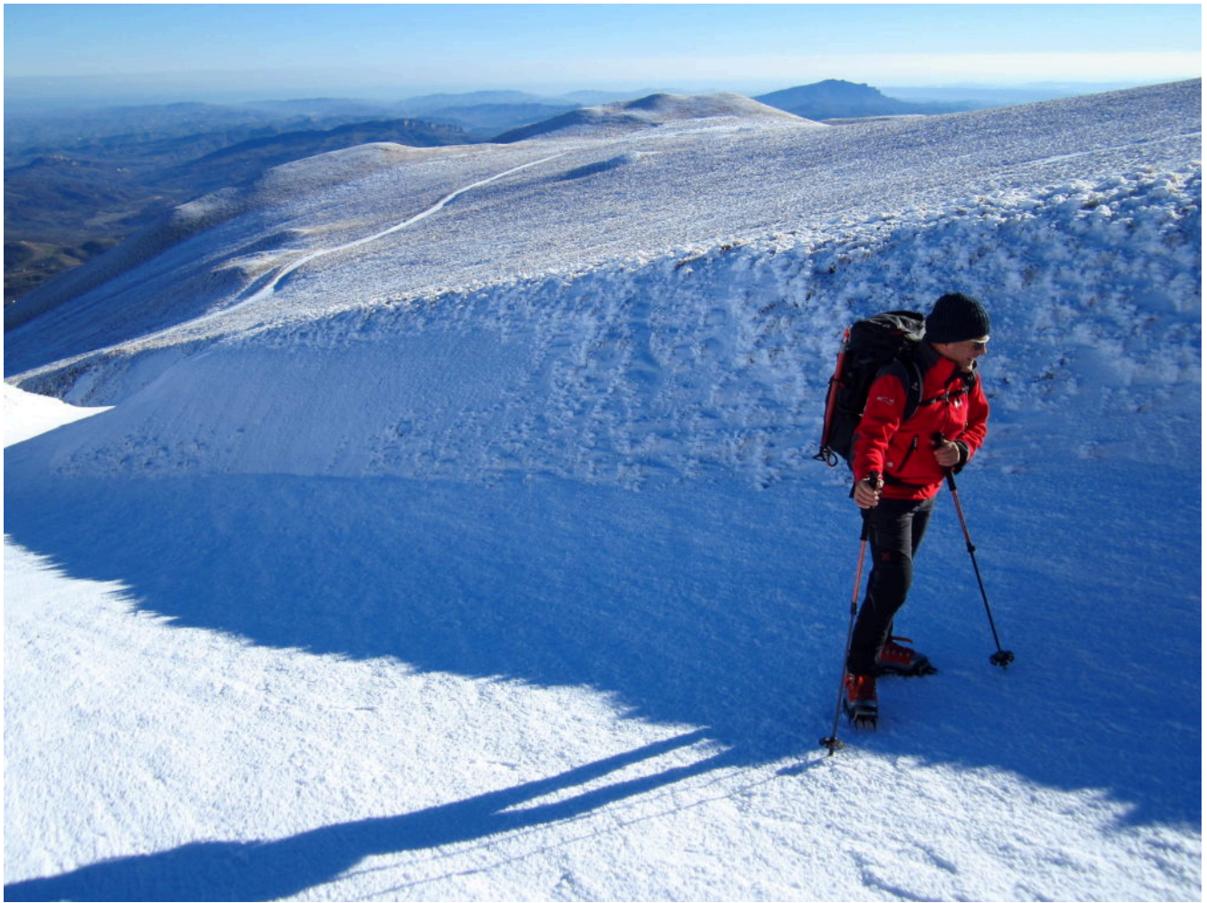
5- L'inizio del canale, in alto a destra il M. Amandola con la traccia della strada sterrata.