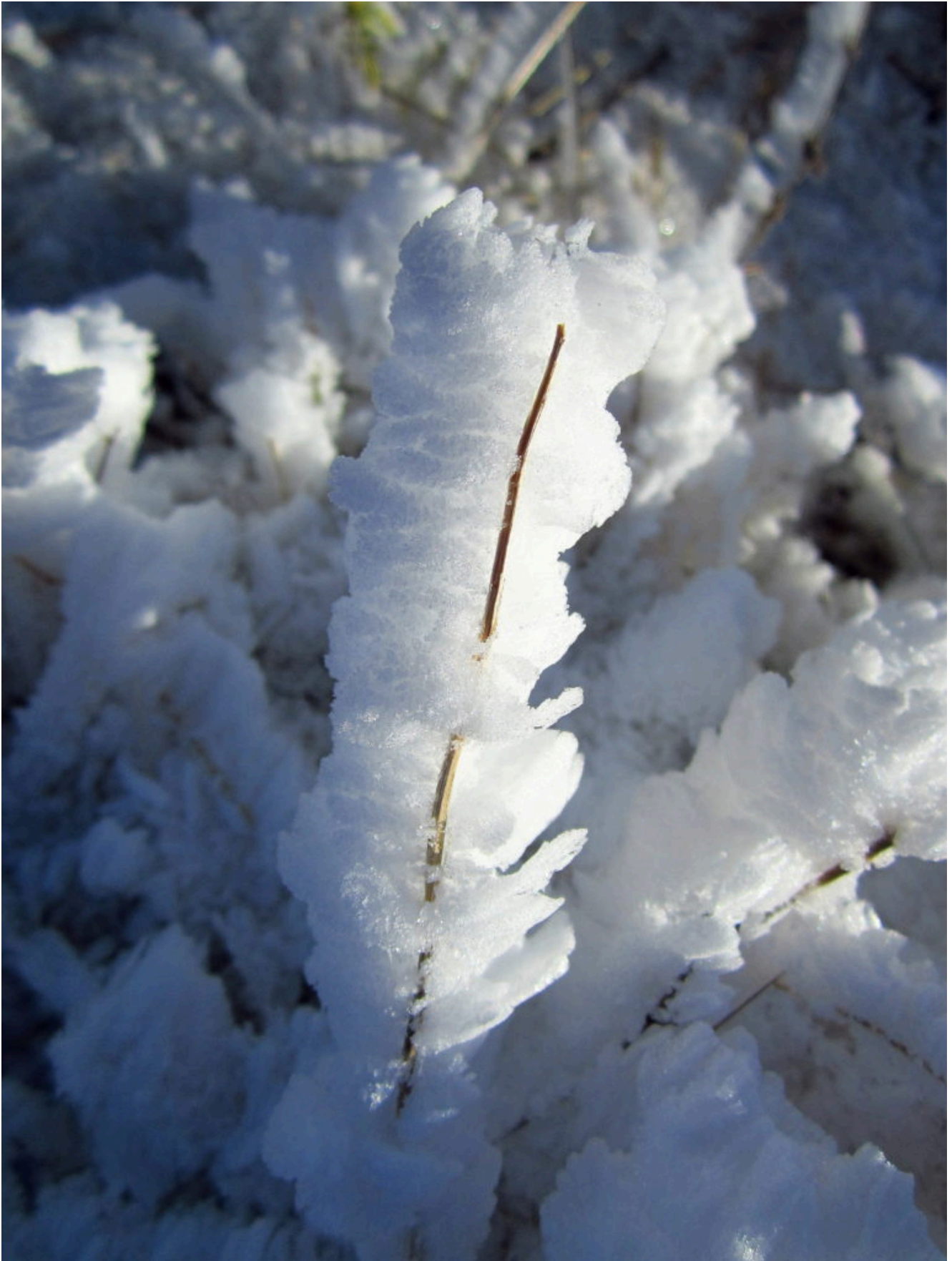
2- Filo d'erba glassato dalla galaverna.