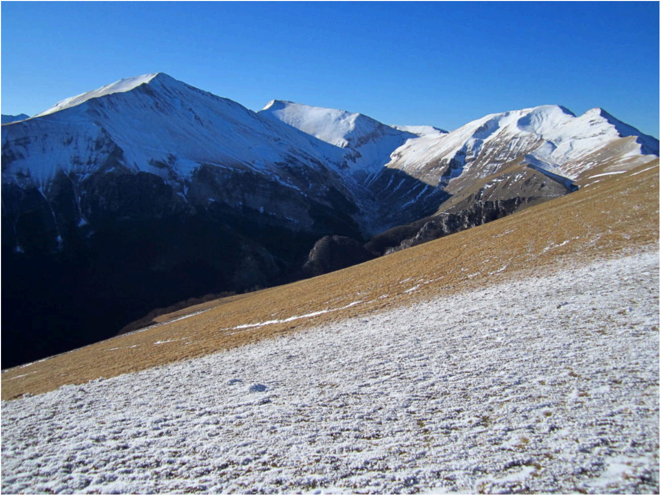
9- Da sinistra il Pizzo Regina, Pizzo Berro, Pizzo Tre Vescovi e M. Acuto.