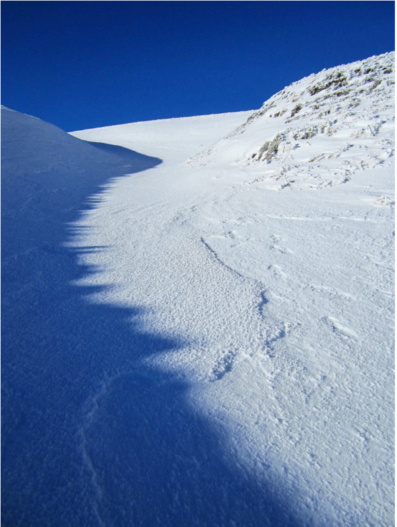
3- L'inizio del canale che conduce alla captazione dell'acquedotto con la luce radente del mattino presto.