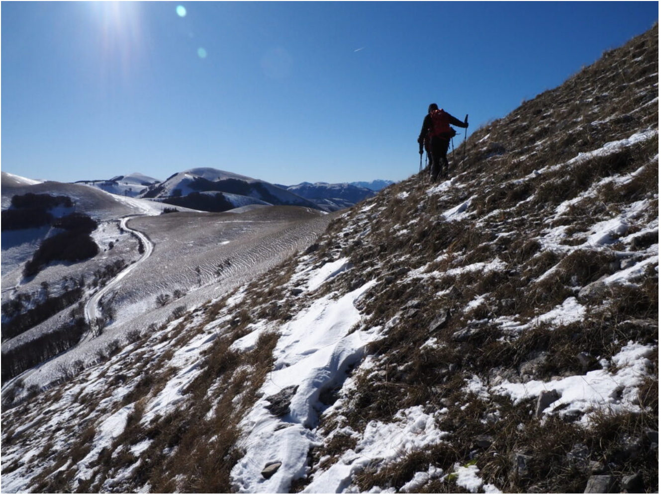
32- Il pendio di ritorno verso il valico di Castelluccio da dove siamo partiti.