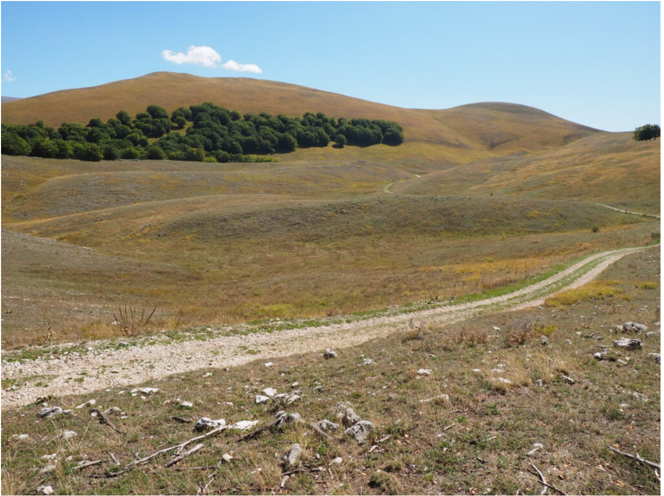
29-30- La sterrata che serpeggia verso le Coste I Valloni.