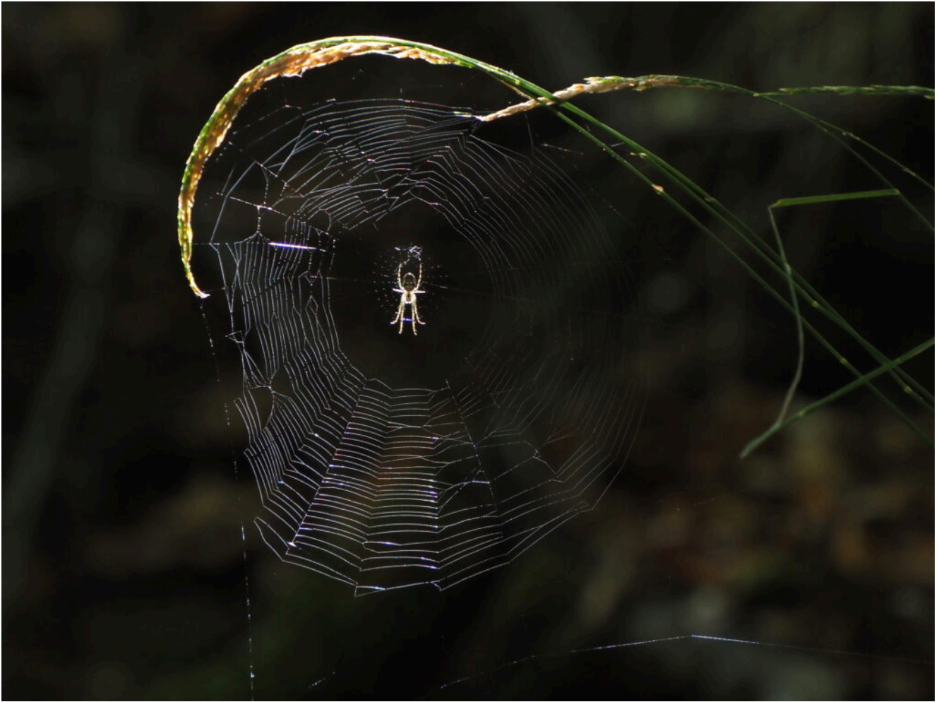
38- Ragnatela nel bosco di Coste I Valloni.