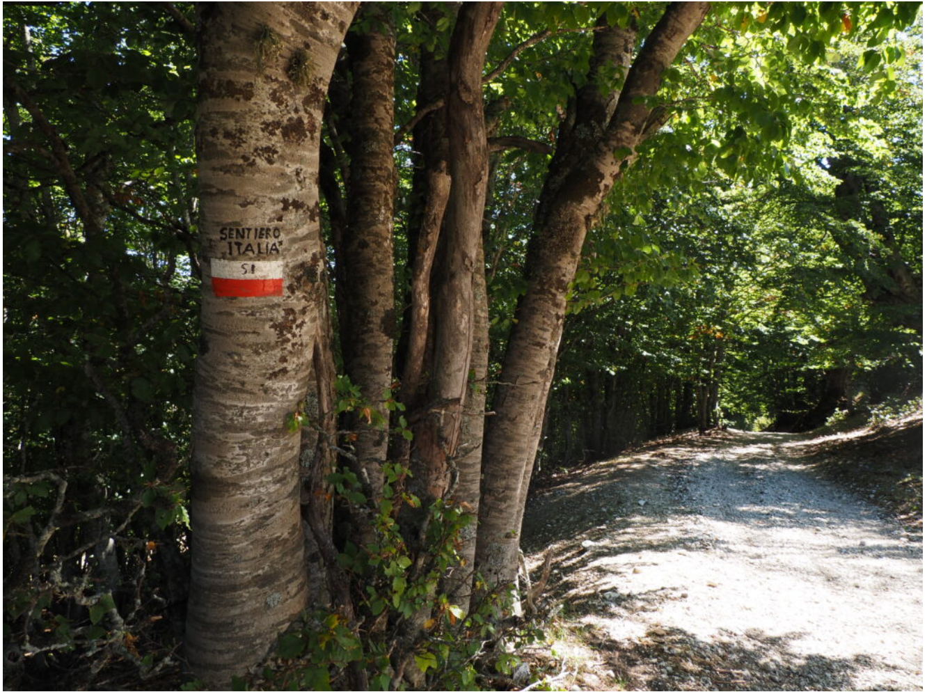
26- La sterrata della foto n.25 che si inoltra in bellissime e vetuste faggete è percorsa dal Sentiero Italia,