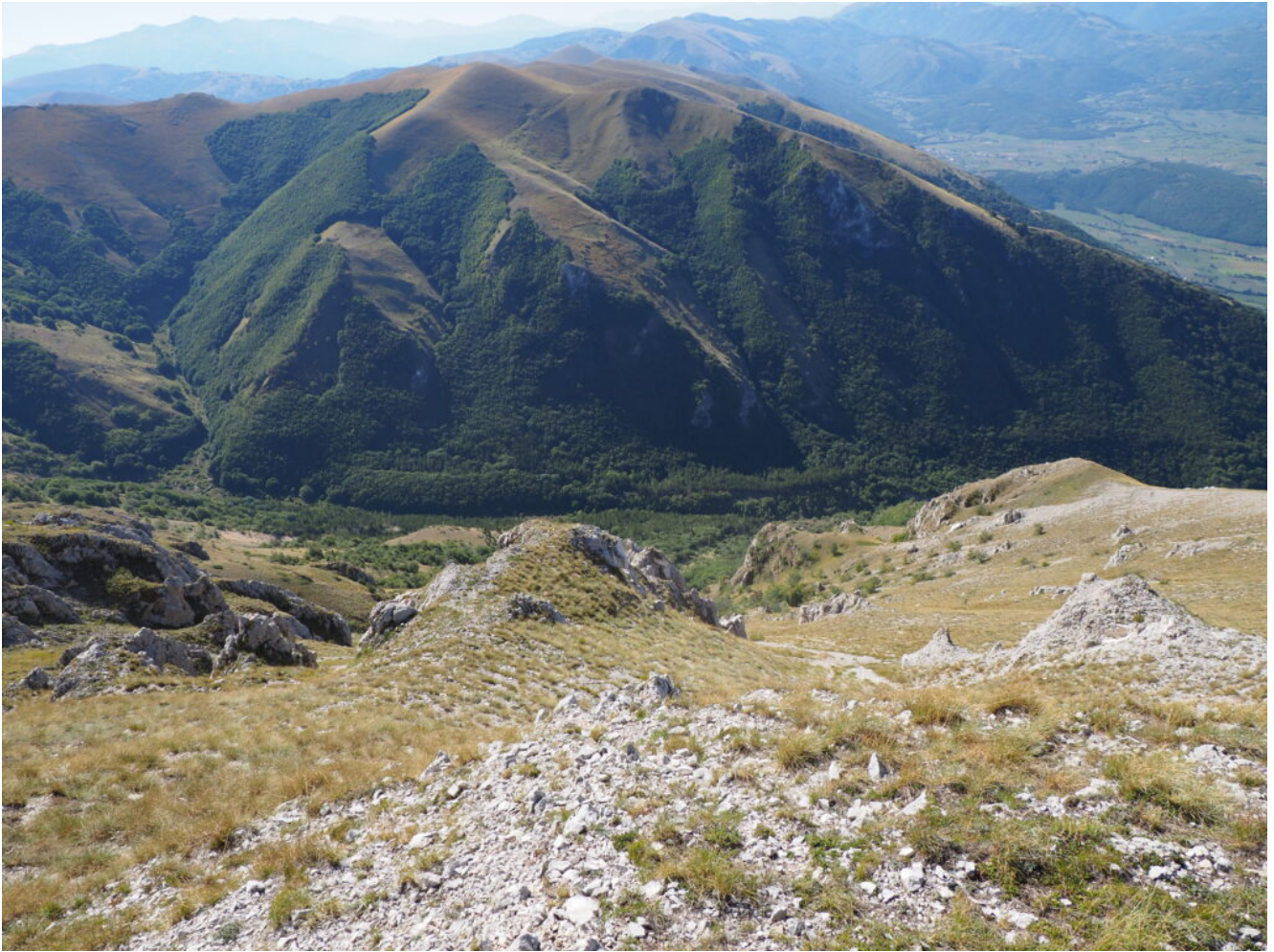
18- La Valle di Patino con la Montagna Fusconi.