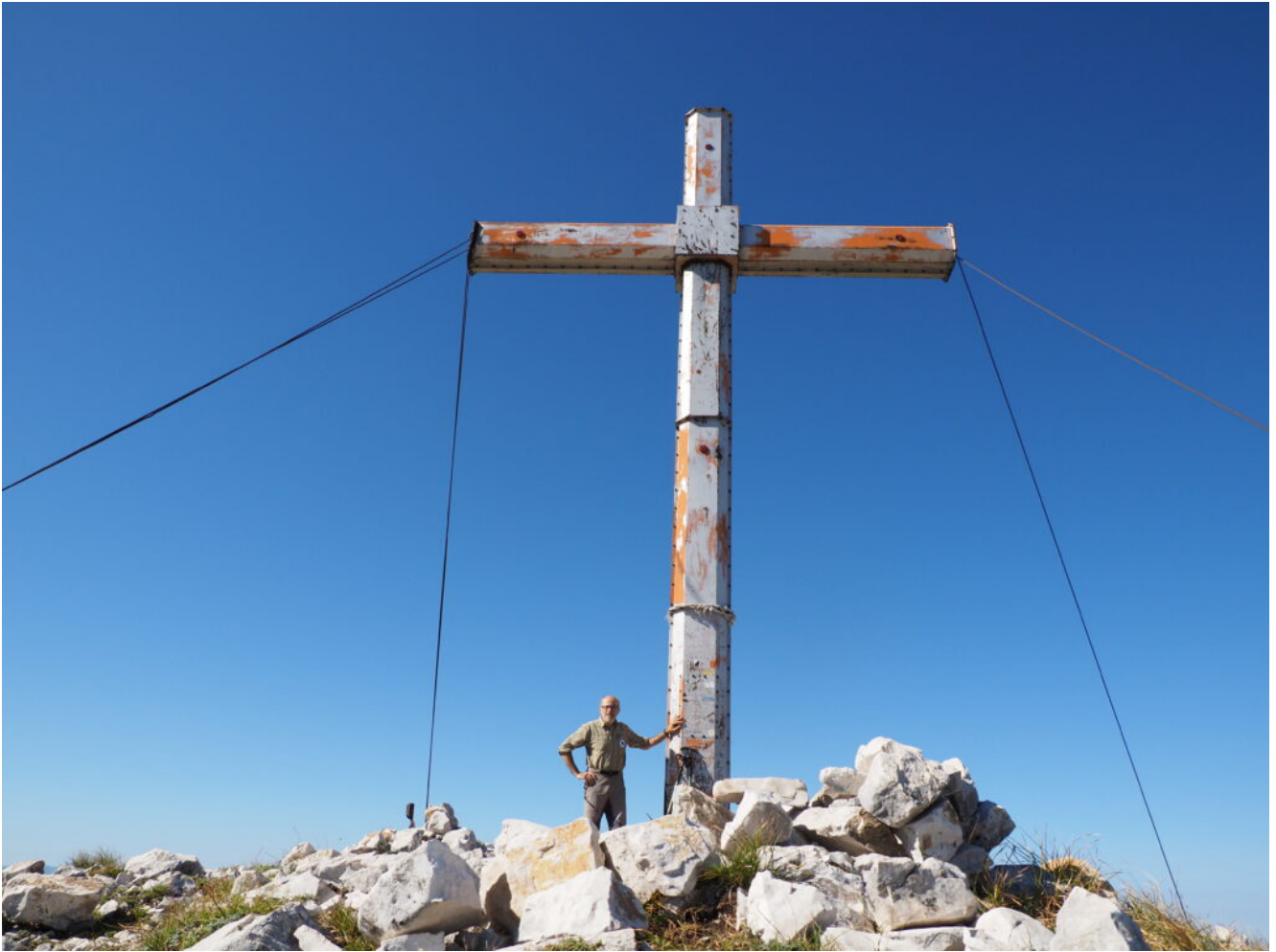
20- L'enorme croce del Monte Patino.