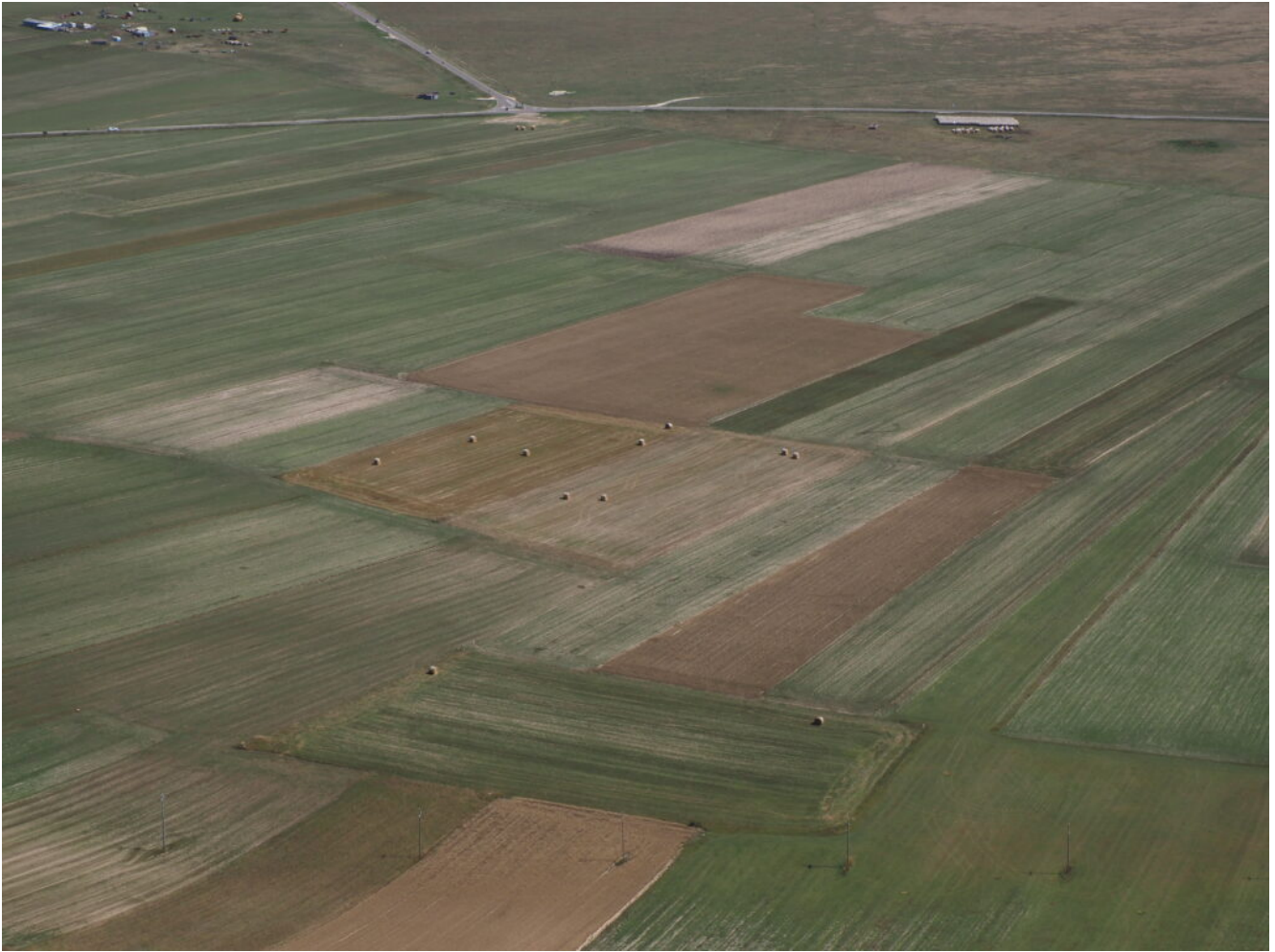
37- I campi coltivati del Piano Grande in versione di fine estate.