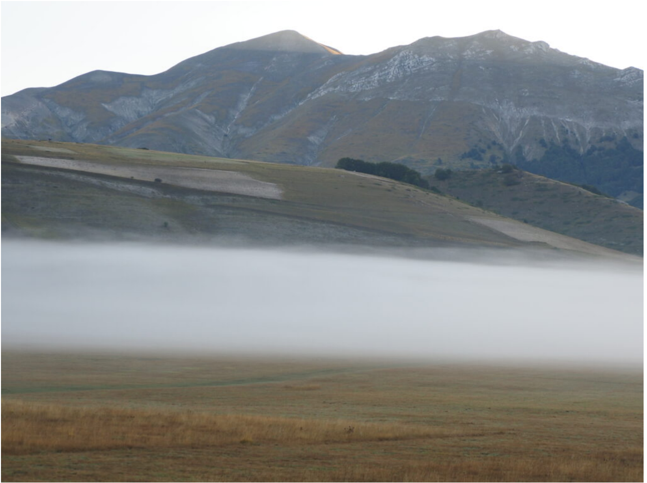
1- Nebbia mattutina al Pian Perduto, sullo sfondo il Monte Porche e il Monte Palazzo Borghese.