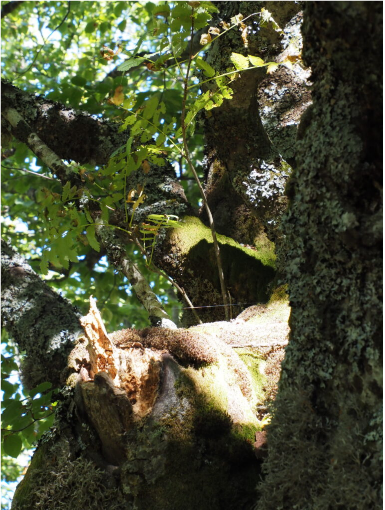
31- Un Sorbus aucuparia è cresciuto stranamente all'interno di un tronco cavo di Faggio