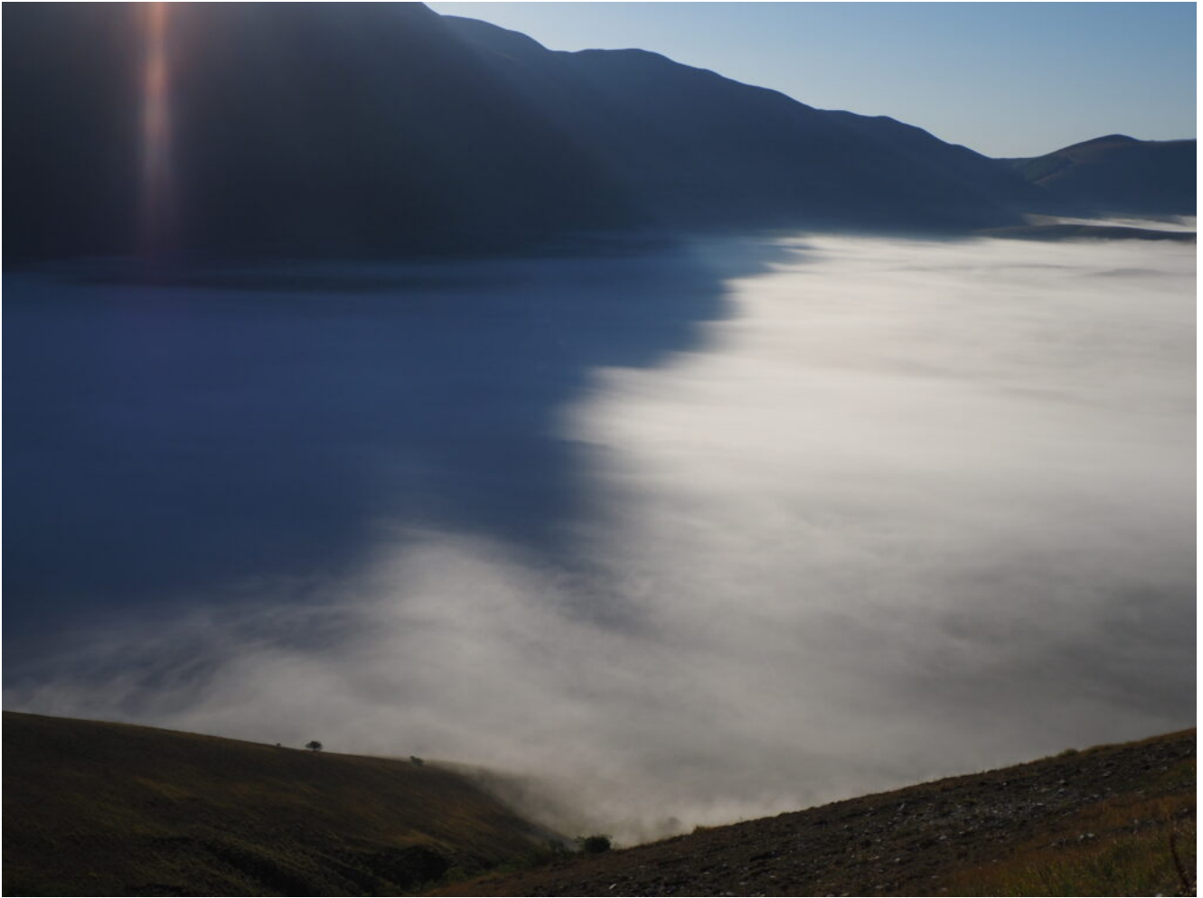
5- Lentamente il Piano Grande viene illuminato da sole.