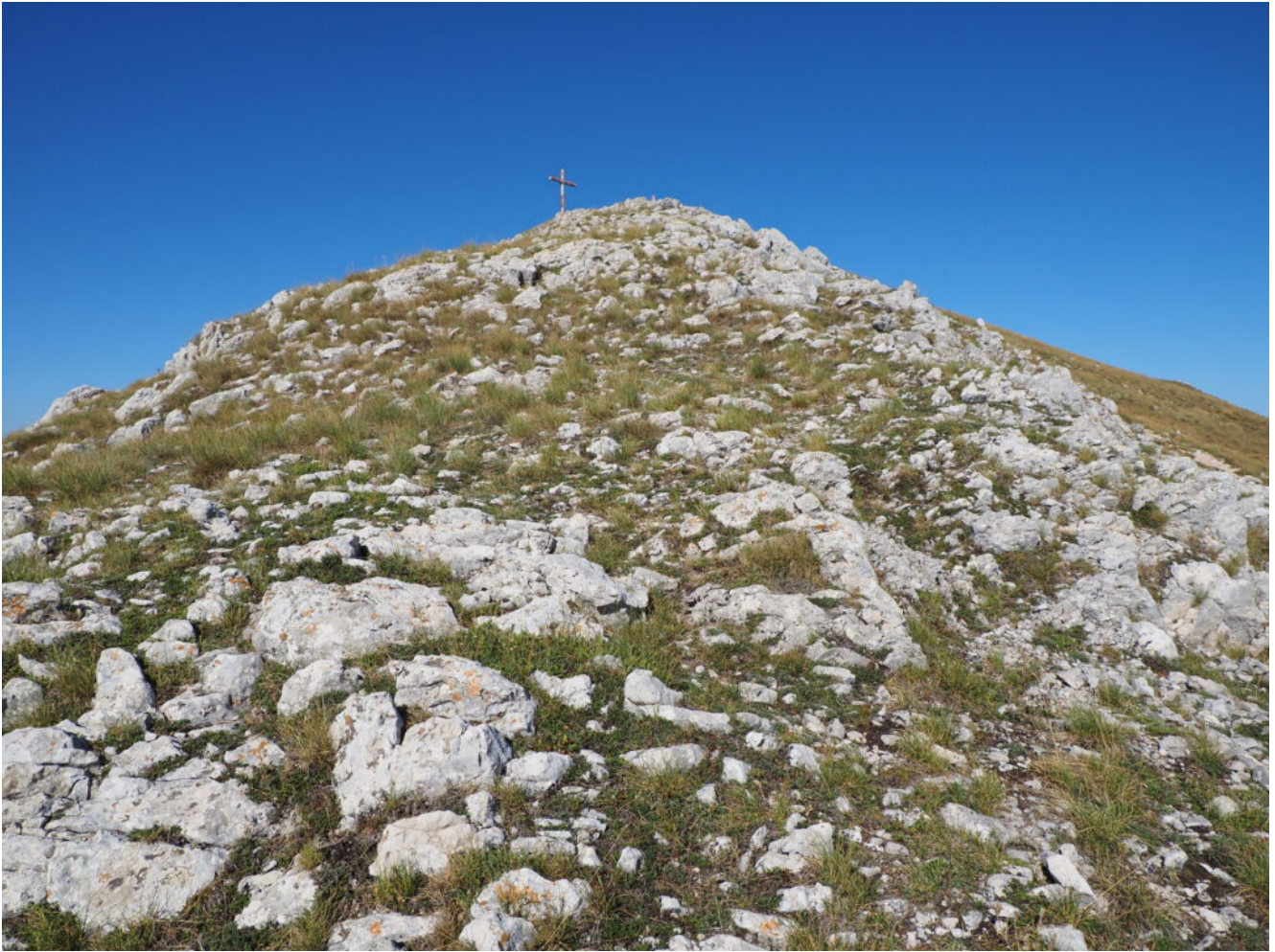
17- L'ultimo tratto di cresta rocciosa del Monte Patino.