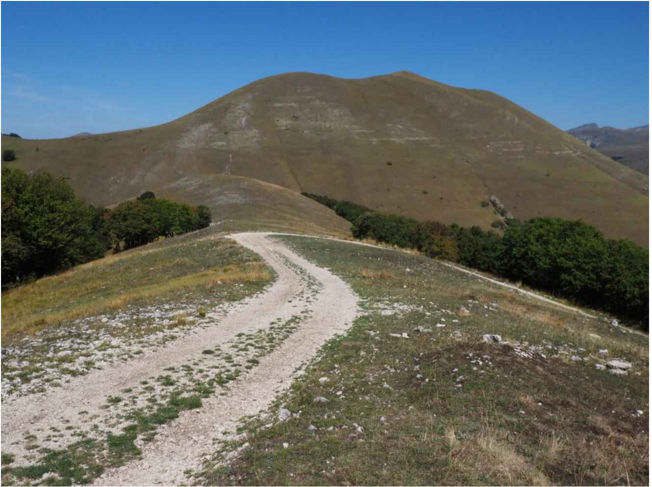
33- La sterrata curva sopra Colle Bernardo, sopra la Valle Canatra, per dirigersi verso Coste Le Prata, sullo sfondo il Monte Lieto..