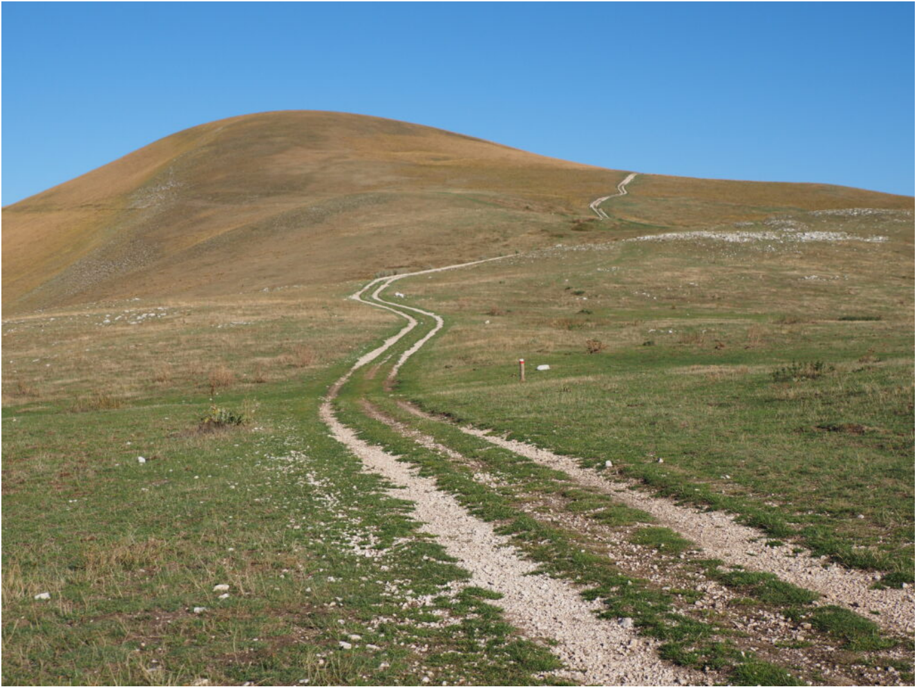
11- La sterrata che si snoda verso il Monte delle Rose, in alto si nota a sinistra il sentiero per Forca di Giuda.