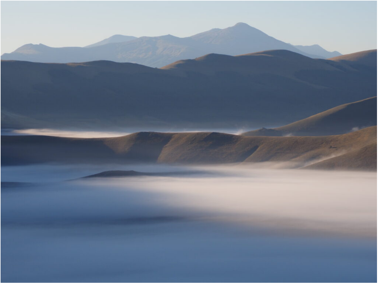
3- Veduta aerea del Paino Grande con i Monti della Laga sullo sfondo.