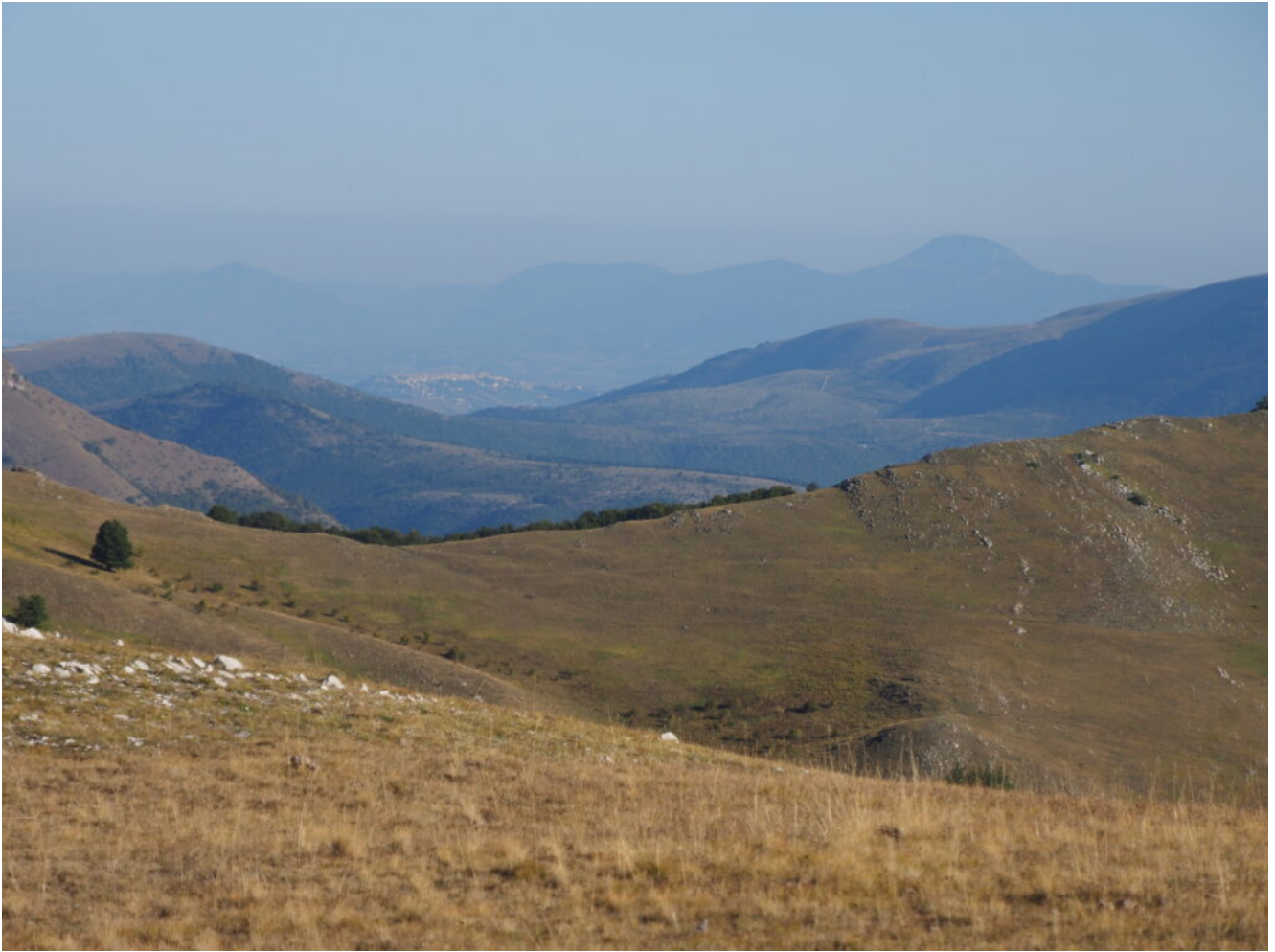
9- Veduta di Camerino dal Monte delle Rose, a destra il Monte San Vicino.