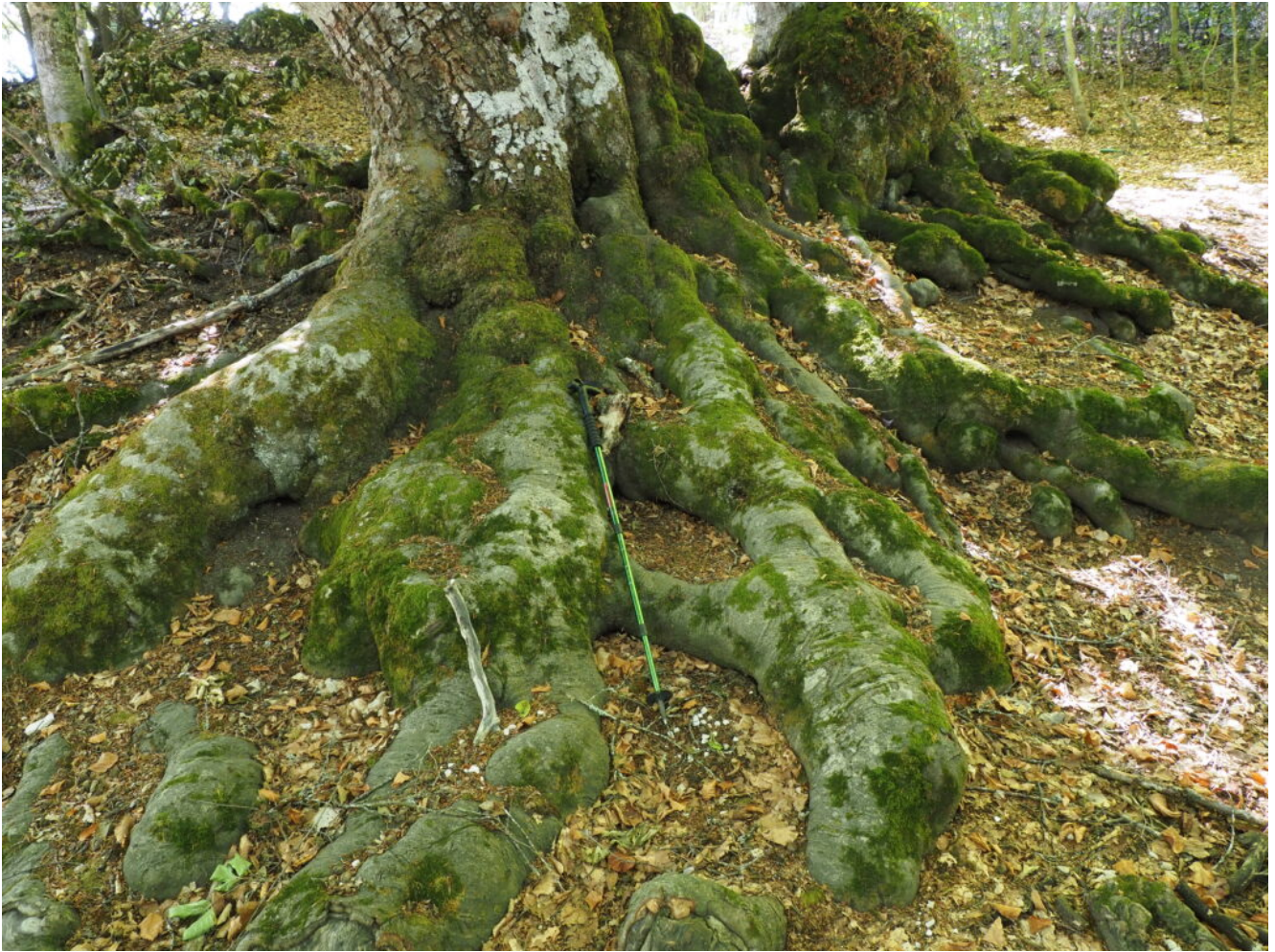
28- Vecchia ceppaia di Faggio con enormi radici.