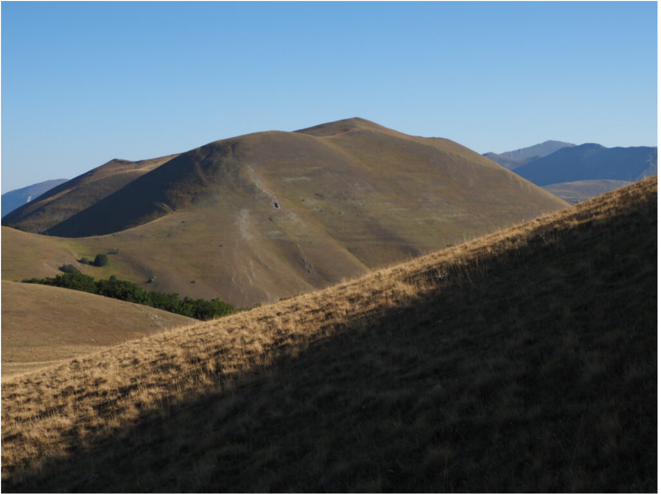
10- Il Monte Lieto visto dal Monte delle Rose.