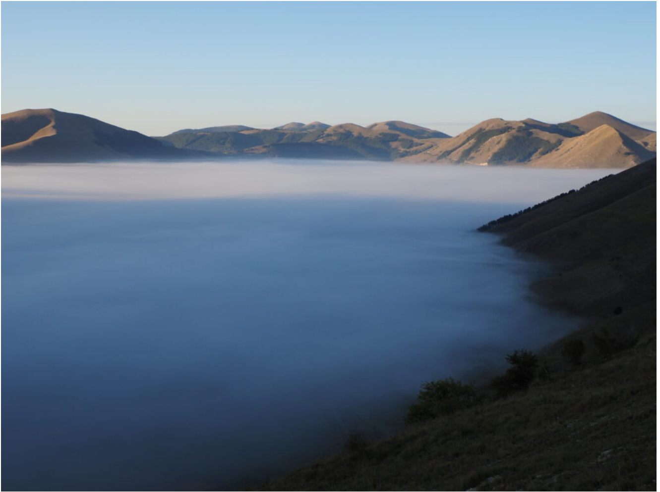
2- Nebbia al Piano Grande