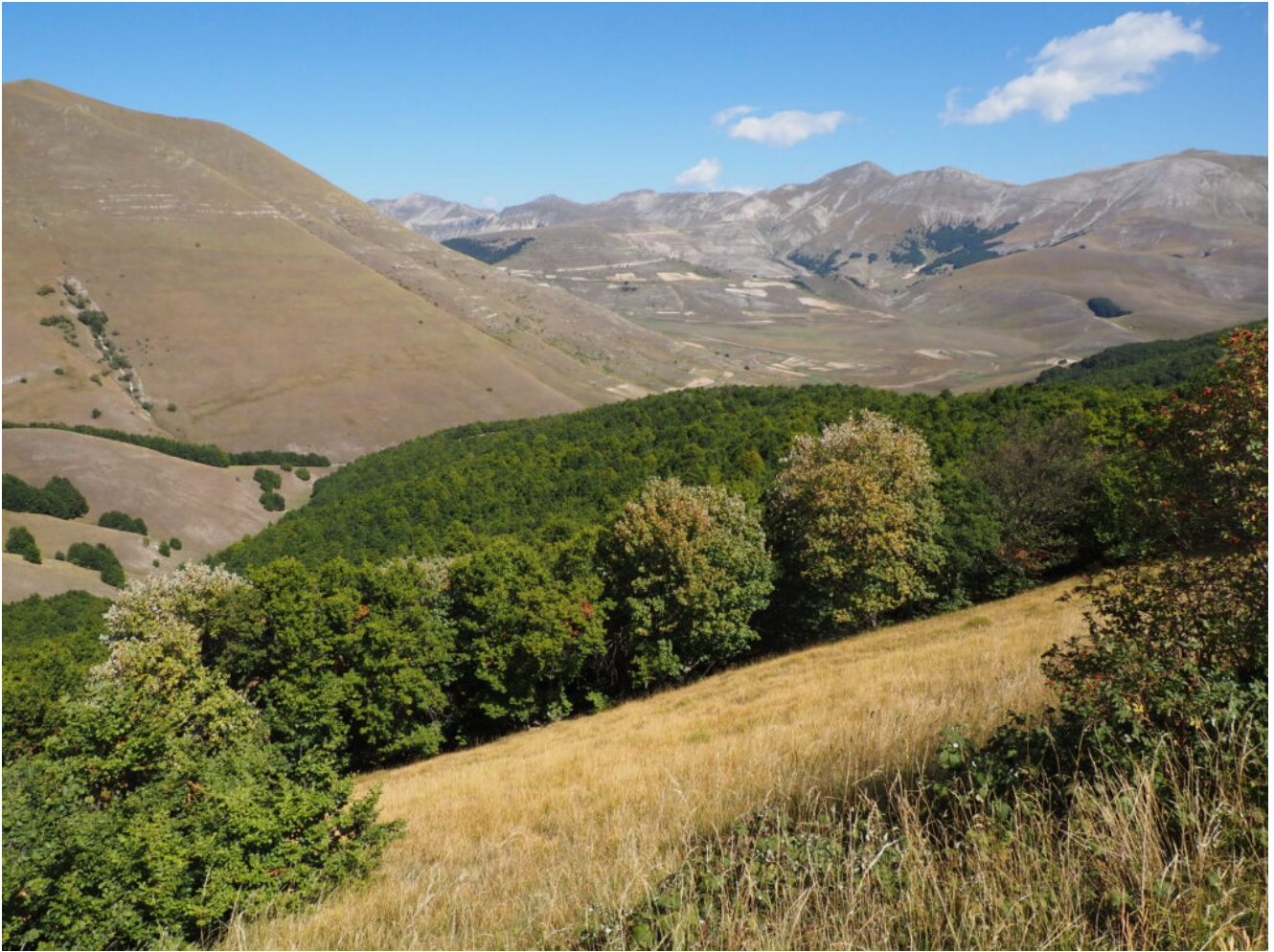
34- La Valle Canatra con il Pian Perduto e i boschi del San Lorenzo sullo sfondo, sotto al Monte Porche.