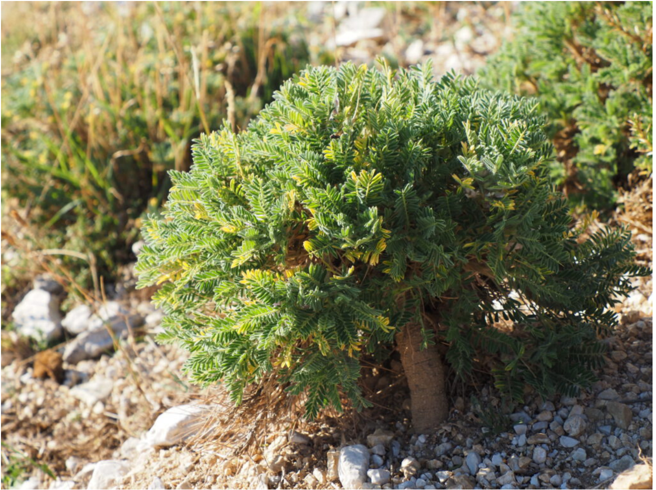
6- Bellissima pianta di Astragalus sempervirens ai lati della strada nel versante est del Monte Veletta