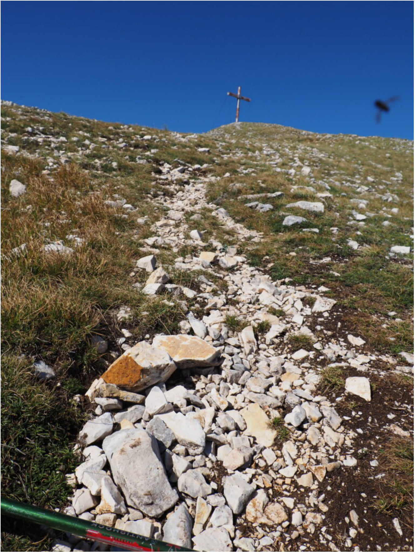
21- Affioramenti ad Ossidi di Ferro lungo il sentiero per il Monte Patino.