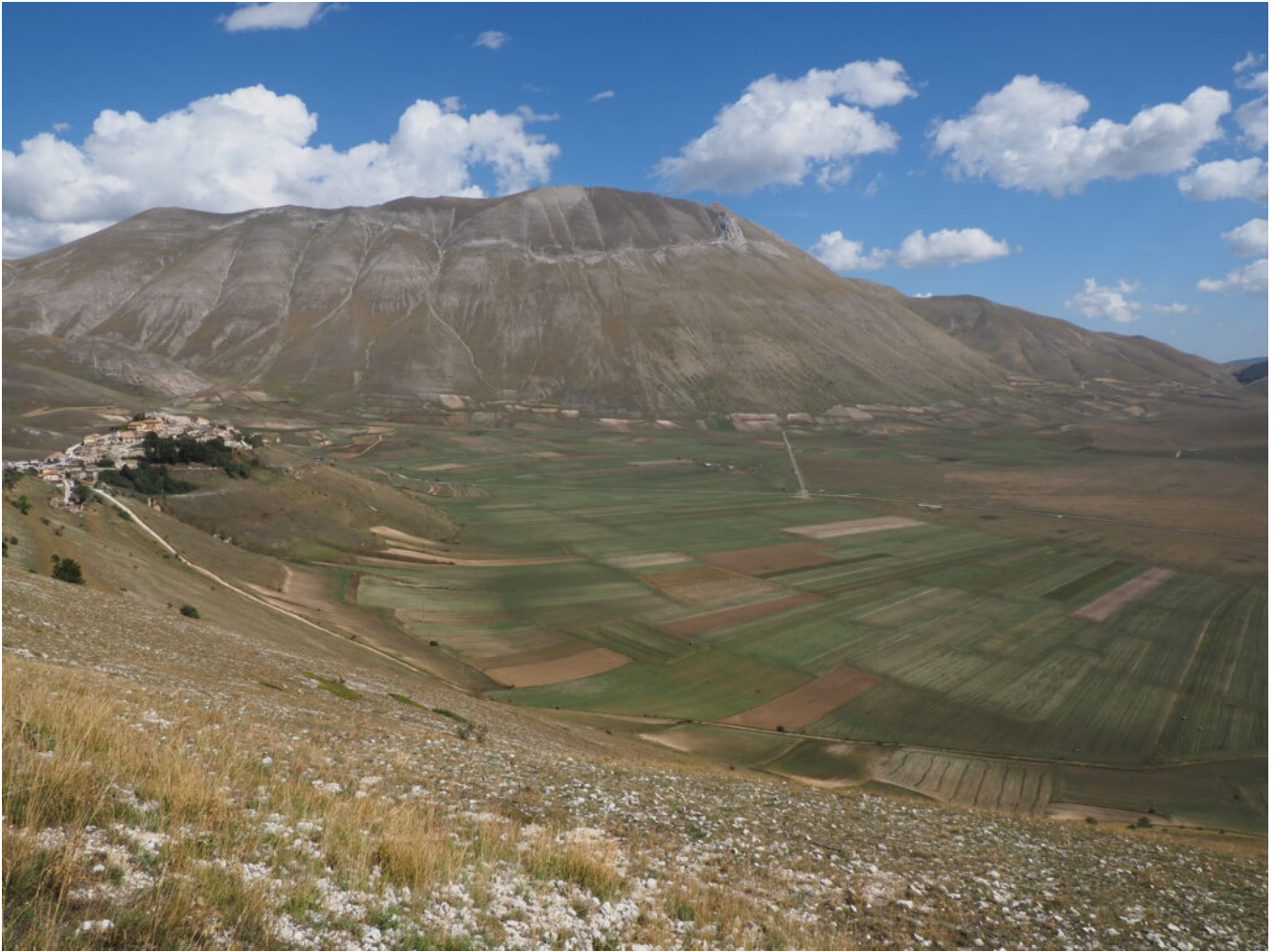
36- Veduta di Castelluccio e della Cima del Redentore dalla strada sotto a Monte Veletta.