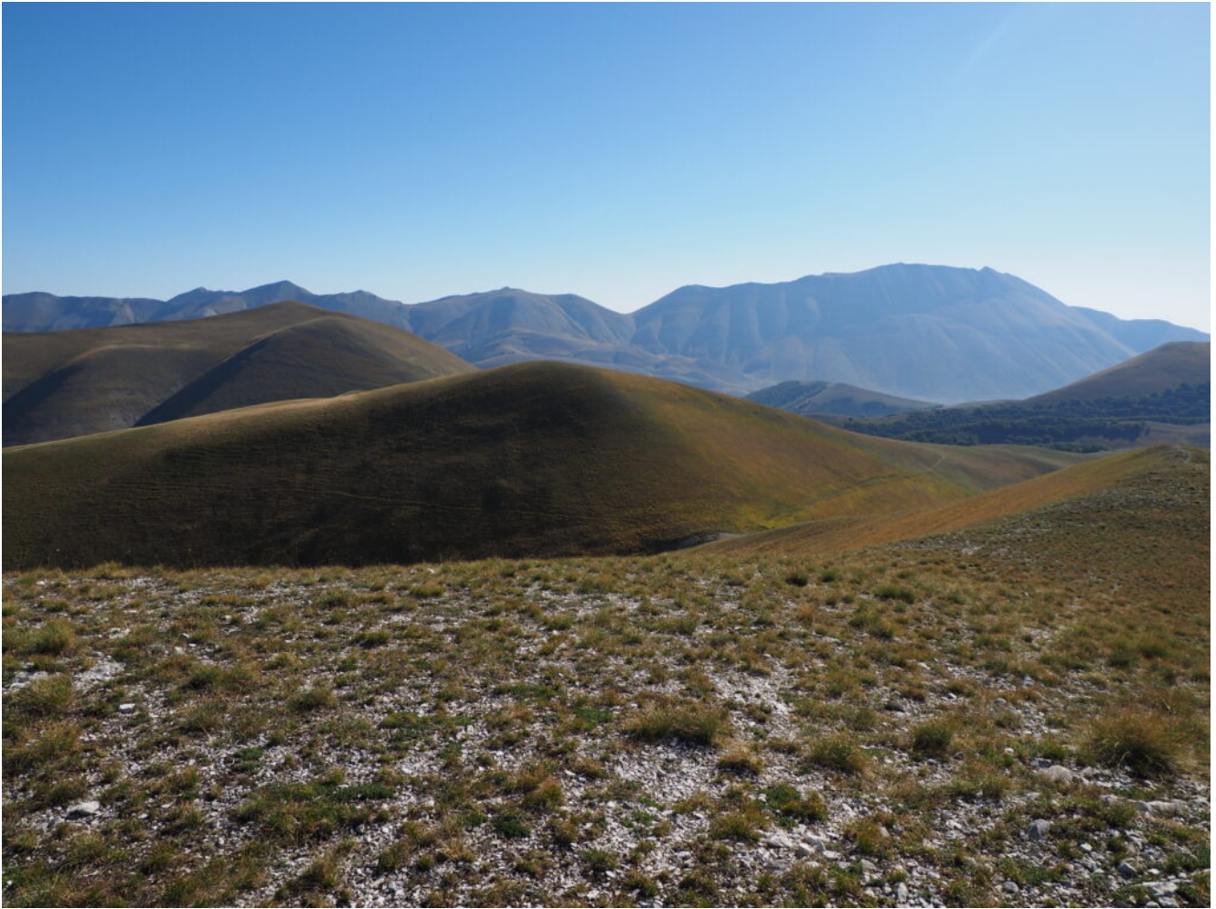
13- Veduta dal Monte delle Rose del versante Ovest dei Monti Sibillini, dal Monte Porche a sinistra fino alla Cima del Redentore a destra.