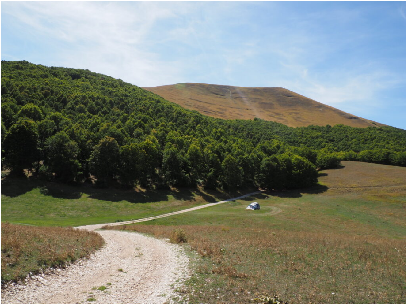
35- il Pianoro sotto Coste Le Prata