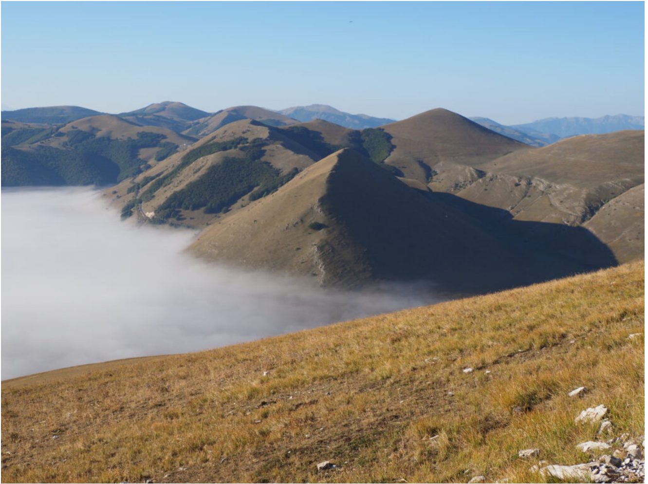
7- Il Monte Castello e, a destra, il Monte Ventosola