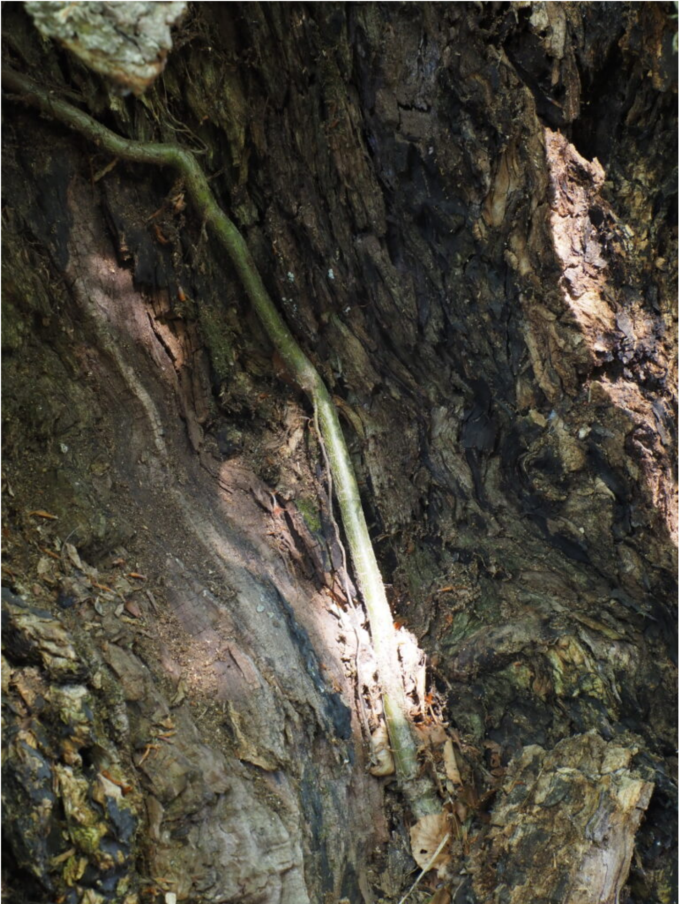
32- Il lungo fusto del Sorbus aucuparia della foto n.31 percorre tutto il tronco cavo del Faggio che lo ospita, fino al terreno.