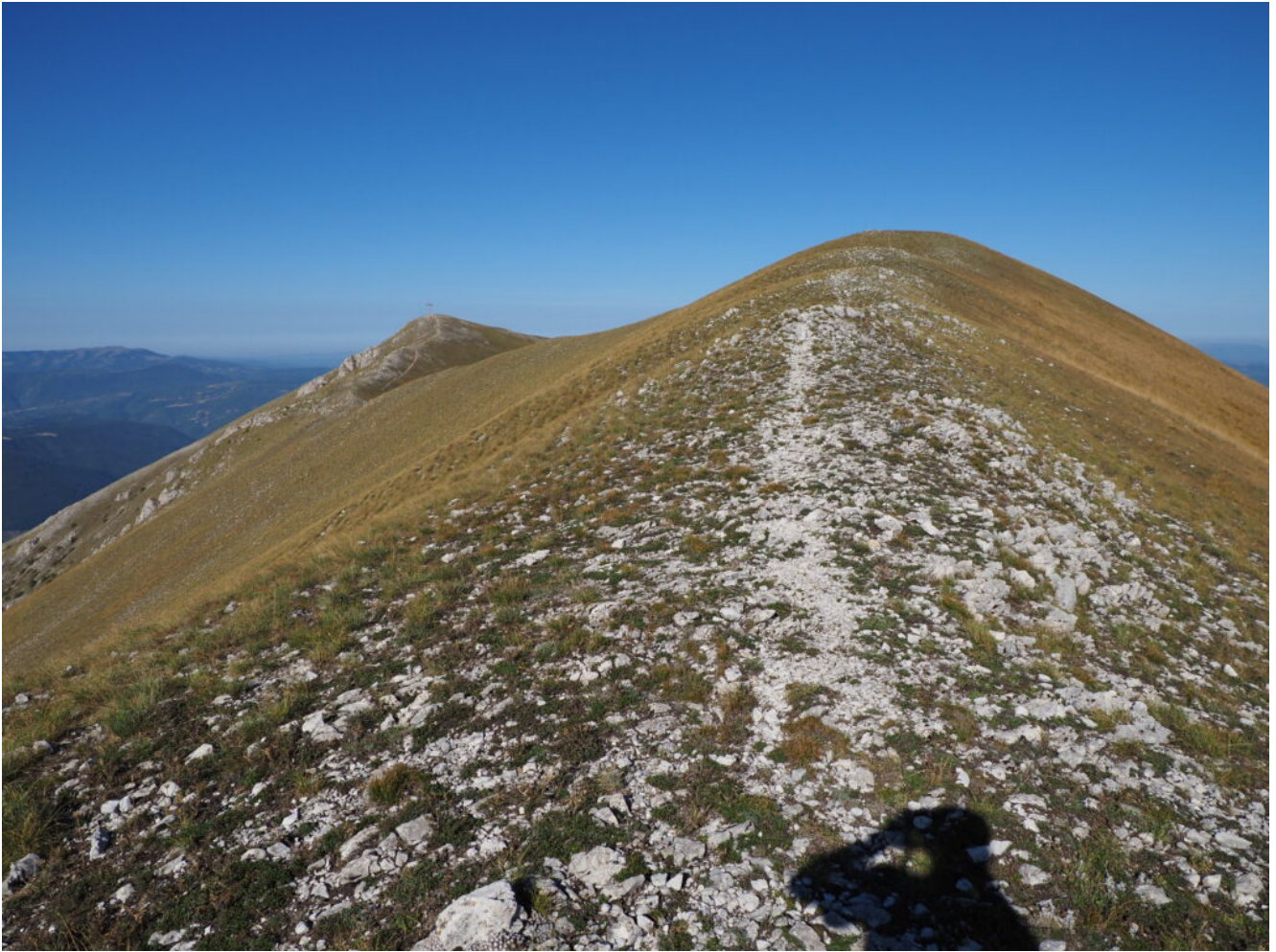
14- Il Monte delle Rose e, a sinistra, il Monte Patino con la grande croce.