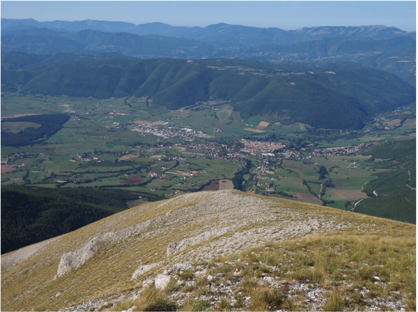
19- Veduta di Norcia e del Piano di Santa Scolastica dal Monte Patino.