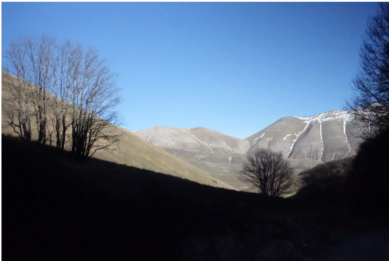
41- La Valle Canatra