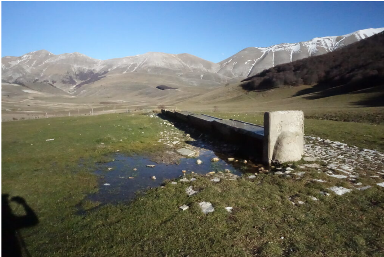
42- La Fonte di Valle Canatra con il Piano Grande sulla sinistra, sulla destra al margine del bosco c'è il tratturo