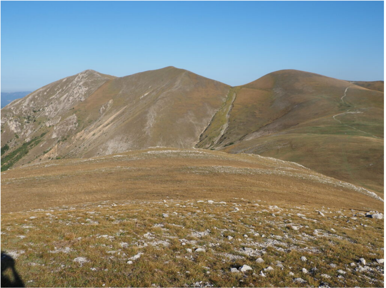
8- Il pianoro ad Ovest del Poggio di Croce con i Monte Patino a sinistra e il Monte delle Rose al centro.