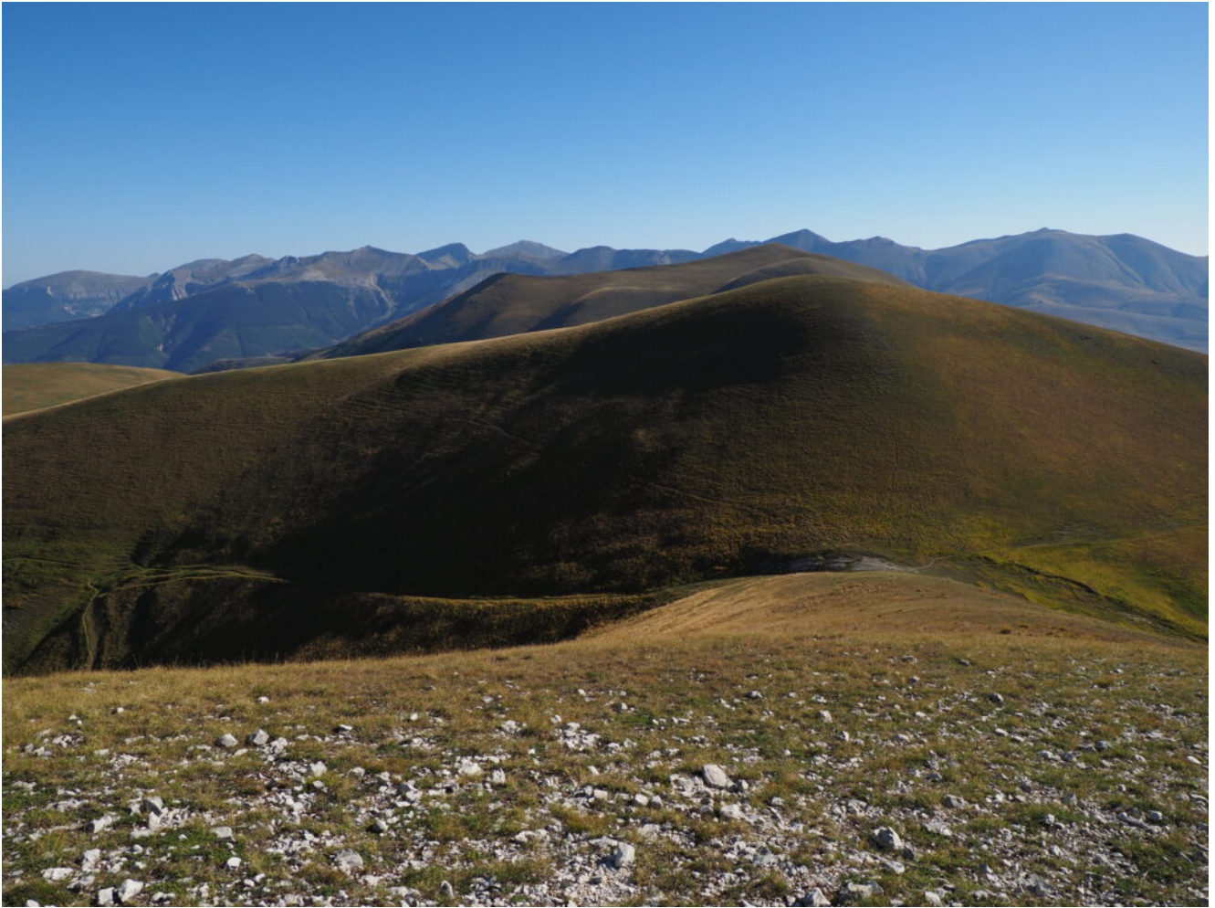
12- Veduta dal Monte delle Rose del versante Ovest dei Monti Sibillini, dalla Croce di Monte Rotondo a sinistra fino al Monte Argentella a destra.