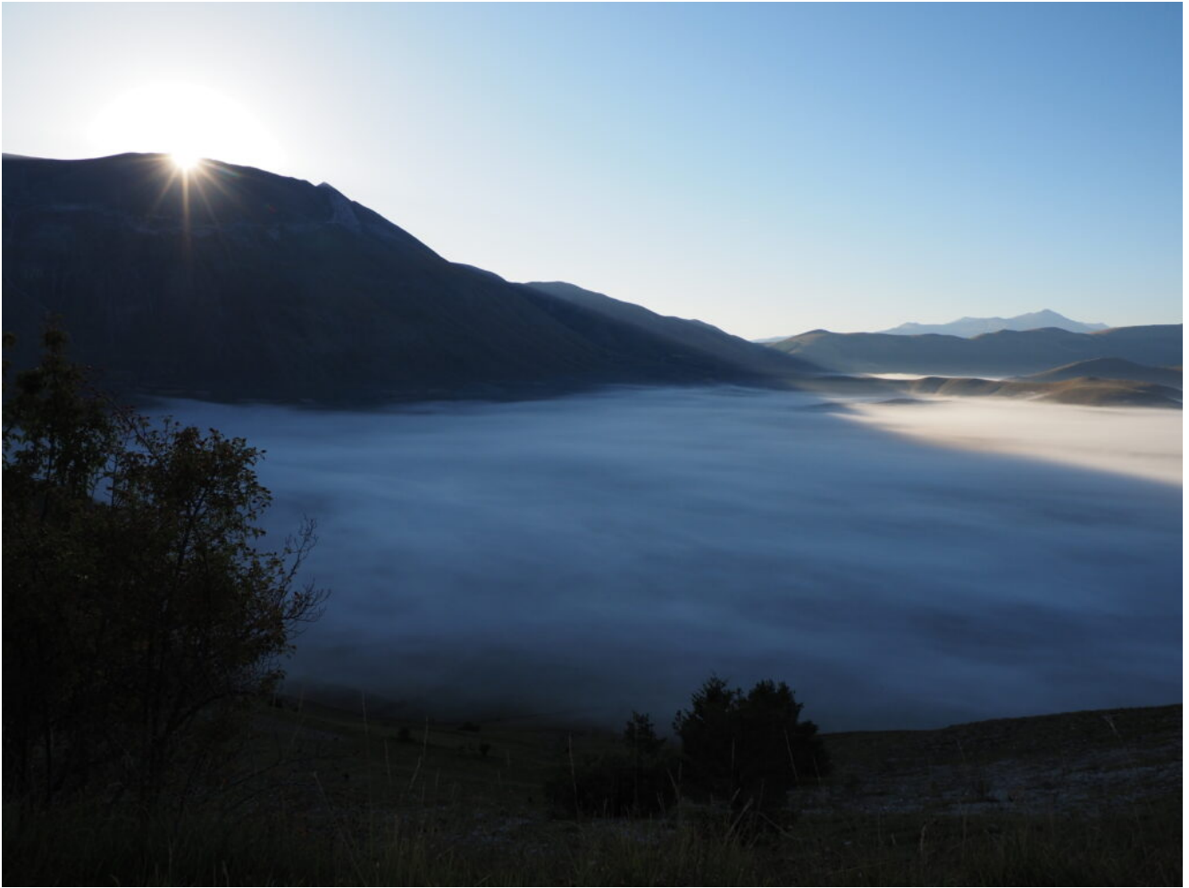
4- Il sole sorge dalla Cima del Redentore