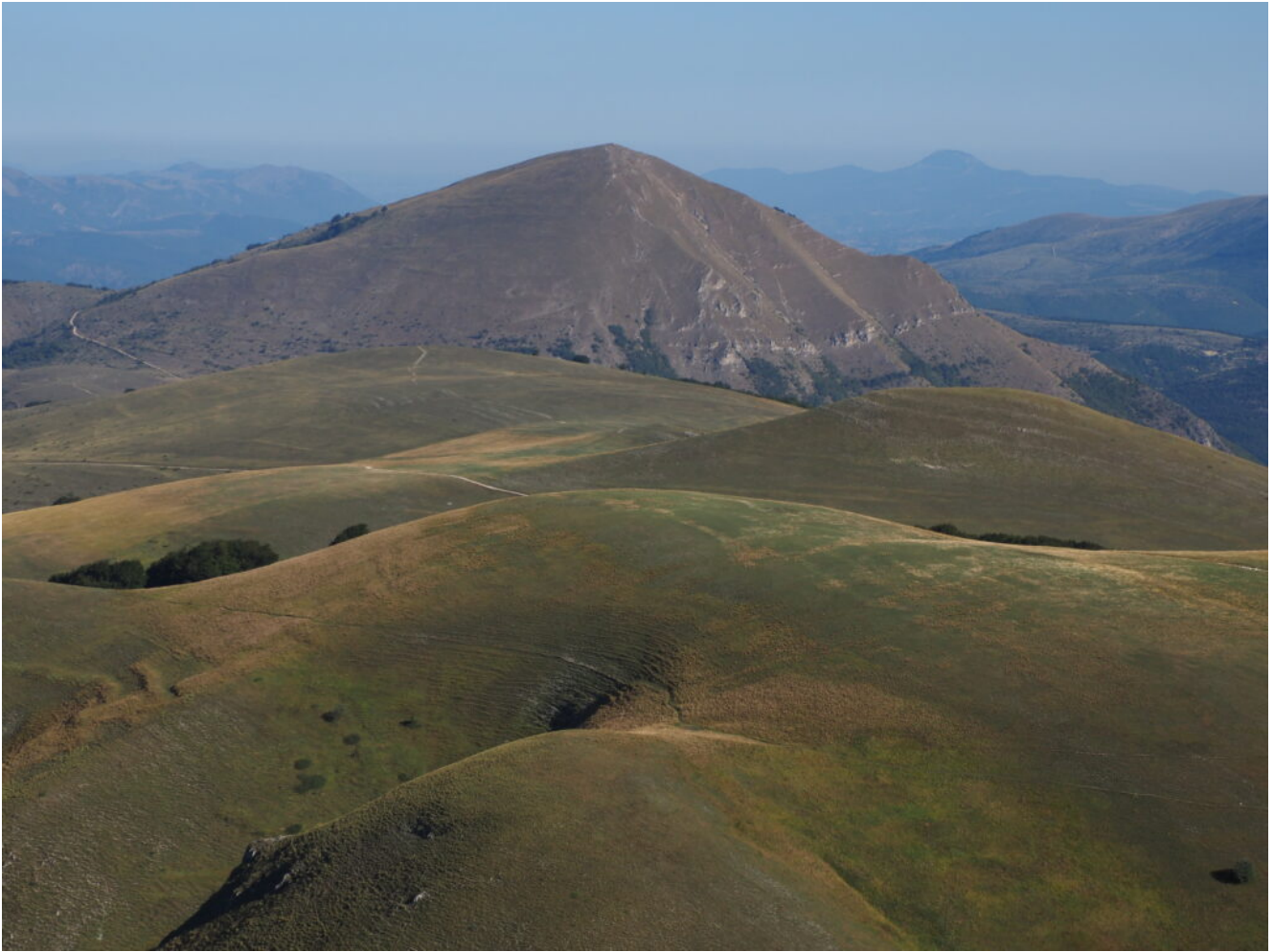
16- Veduta verso Nord con le cime arrotondate del Monte Fausole, Monte Colventoso, Monte Prata e Monte La Bandita con il Monte Cardosa che svetta sullo sfondo.