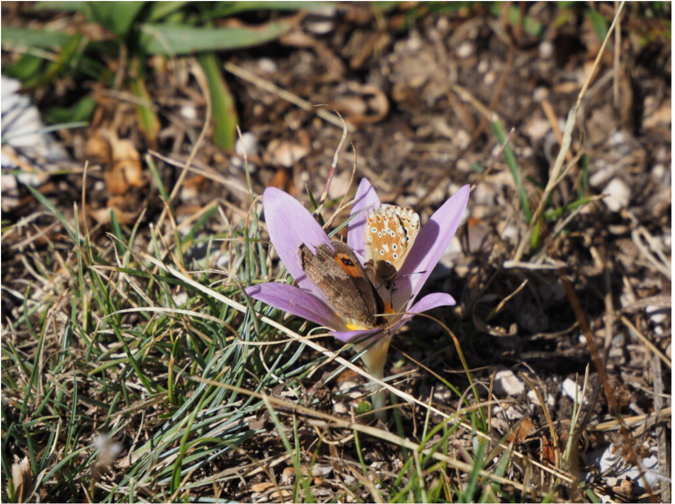
24- Colchicum alpinum con due lepidotteri