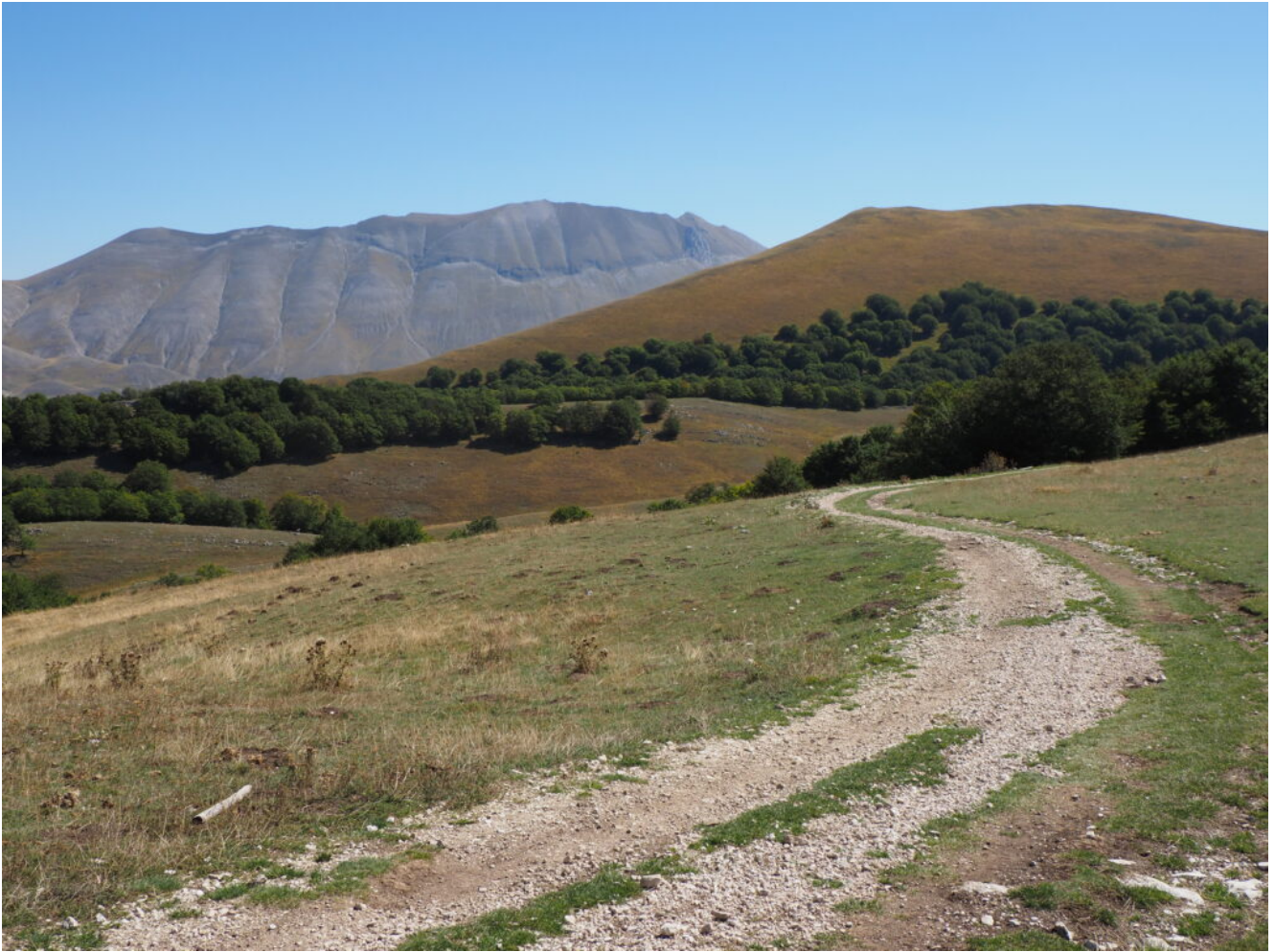
25- La sterrata che scende a Castelluccio passando le le Coste I Valloni.