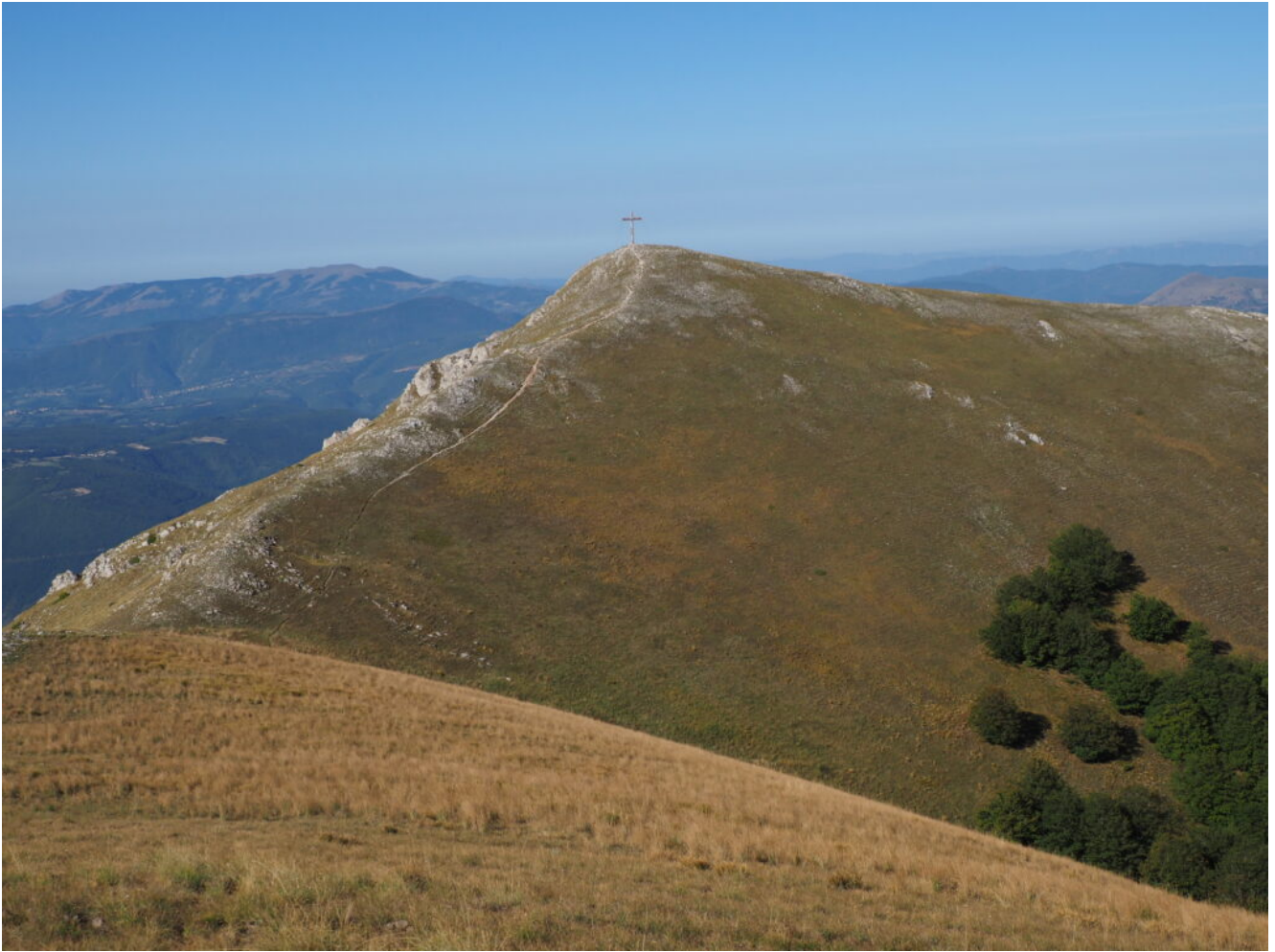
15- Il Monte Patino.