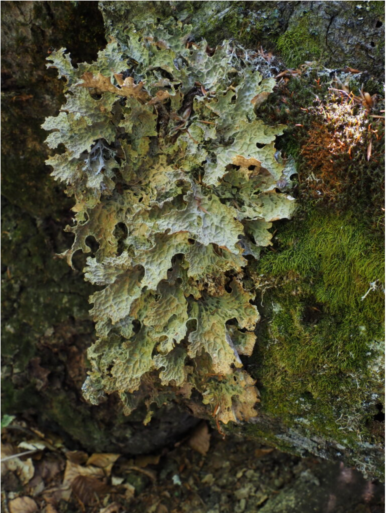
27- Nella vetusta faggeta delle Coste I Valloni sono presenti grandi formazioni del raro lichene Lobaria pulmonata .