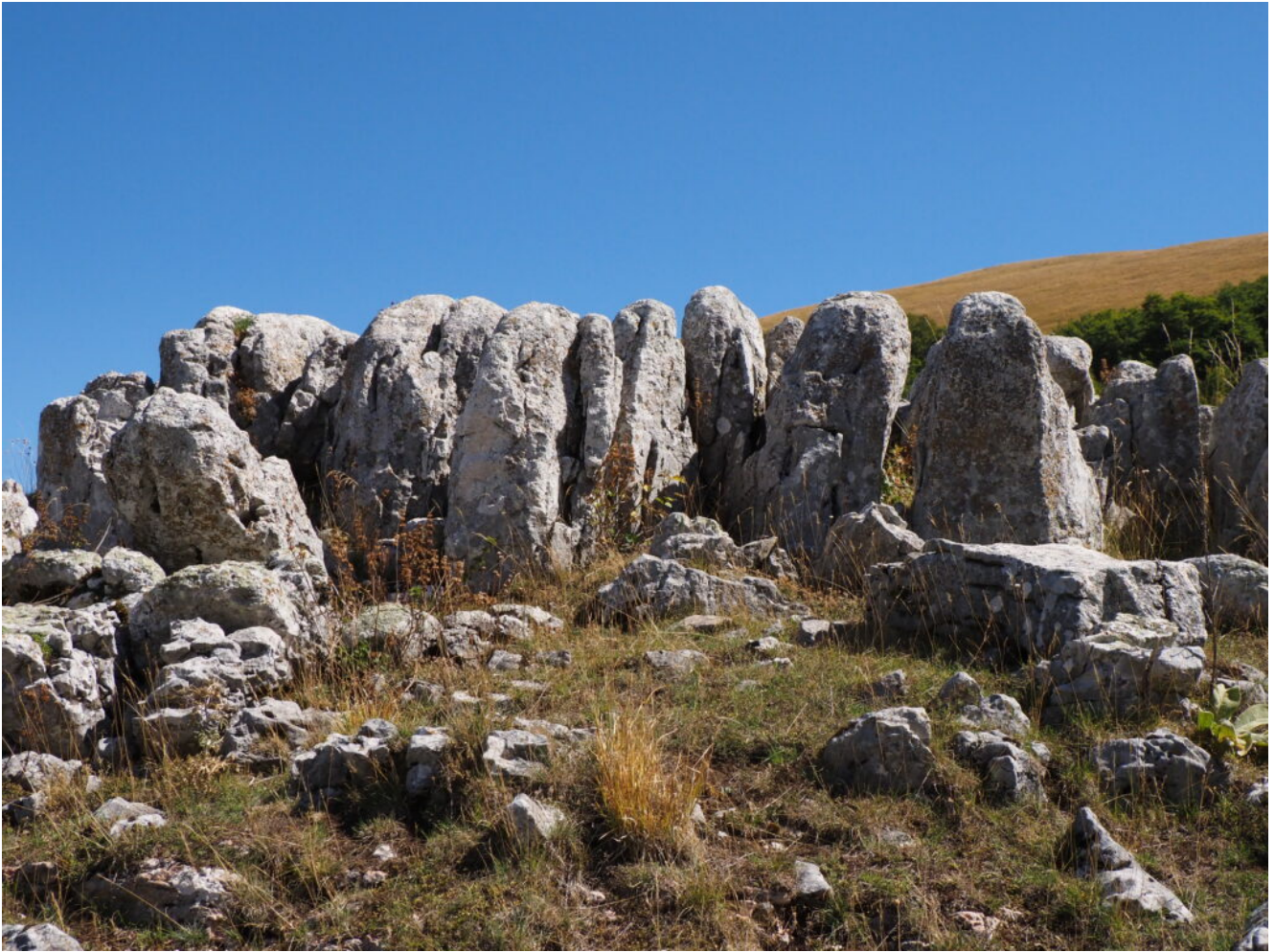
30- Strane formazioni rocciose assomiglianti a dei Menhir nella Costa I Valloni.