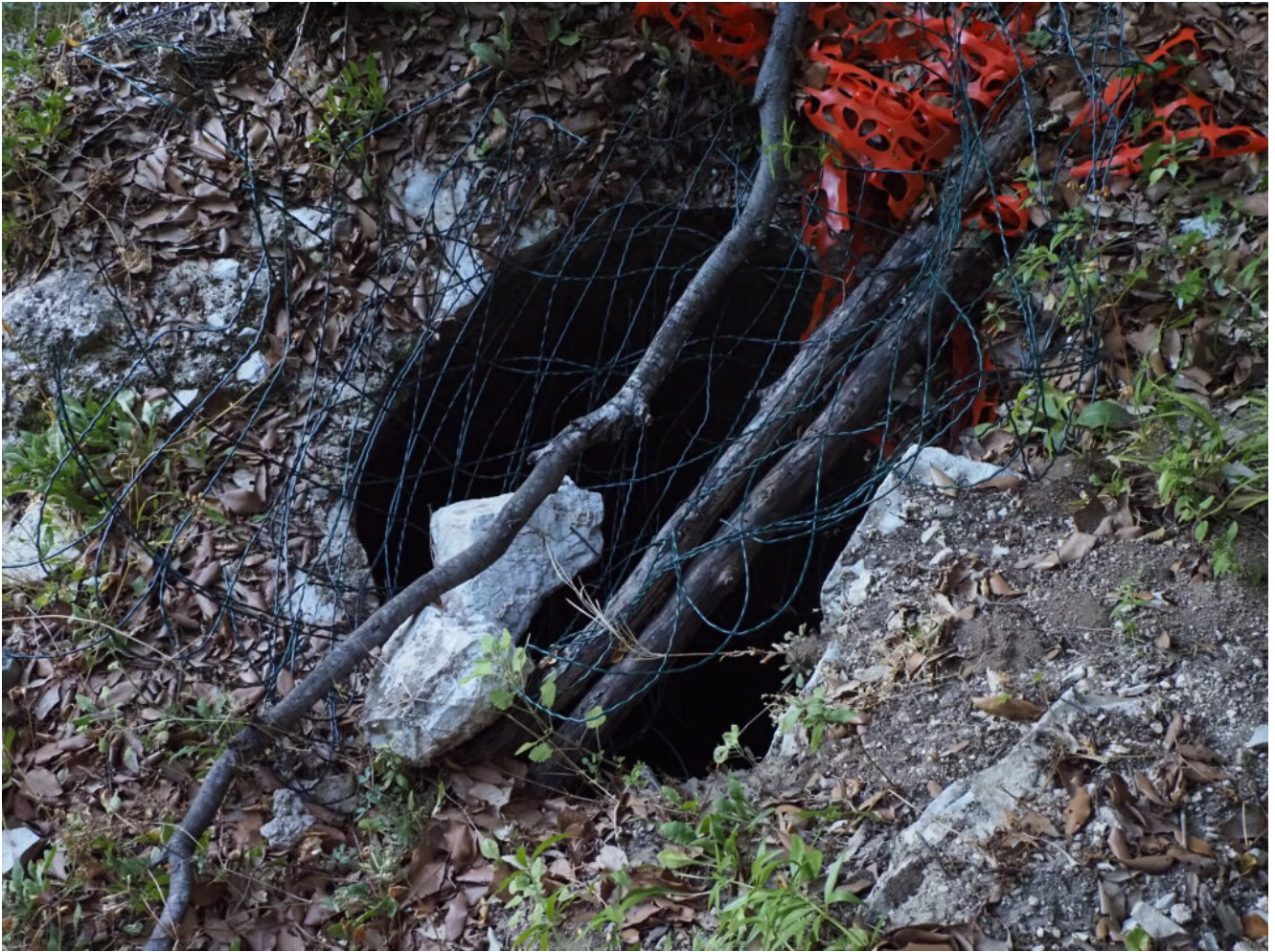
24- La cisterna di raccolta dell'acqua.