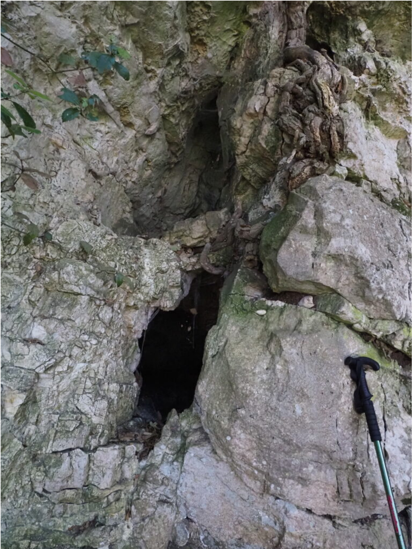
40 – 43 -La Fessura I della Ciarla, nella parete destra del canalone soprastante l'Eremo, più stretta della grotta ma si addentra per una decina di metri.