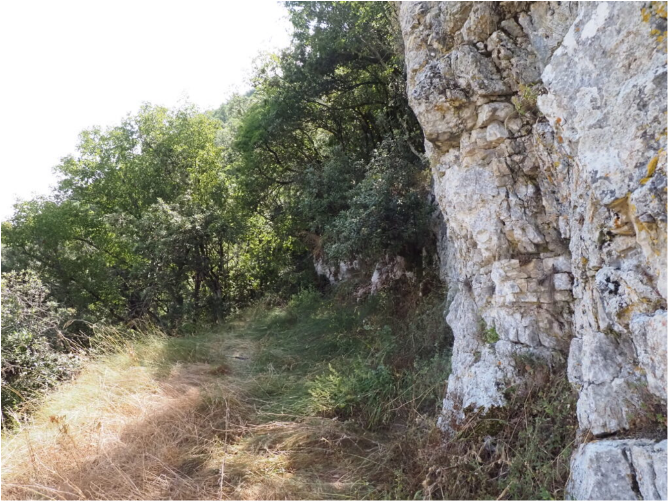
34- Il terrazzo roccioso poco prima dell'Eremo, per le fessure della Ciarla si sale nella rampa al suo fianco destro.