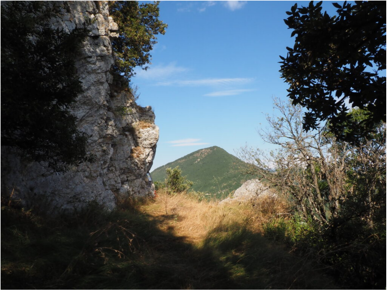
5- Il terrazzo roccioso sulla Valle del Chienti, a sinistra parte la rampa per raggiungere le Grotta e Fessure della Ciarla.