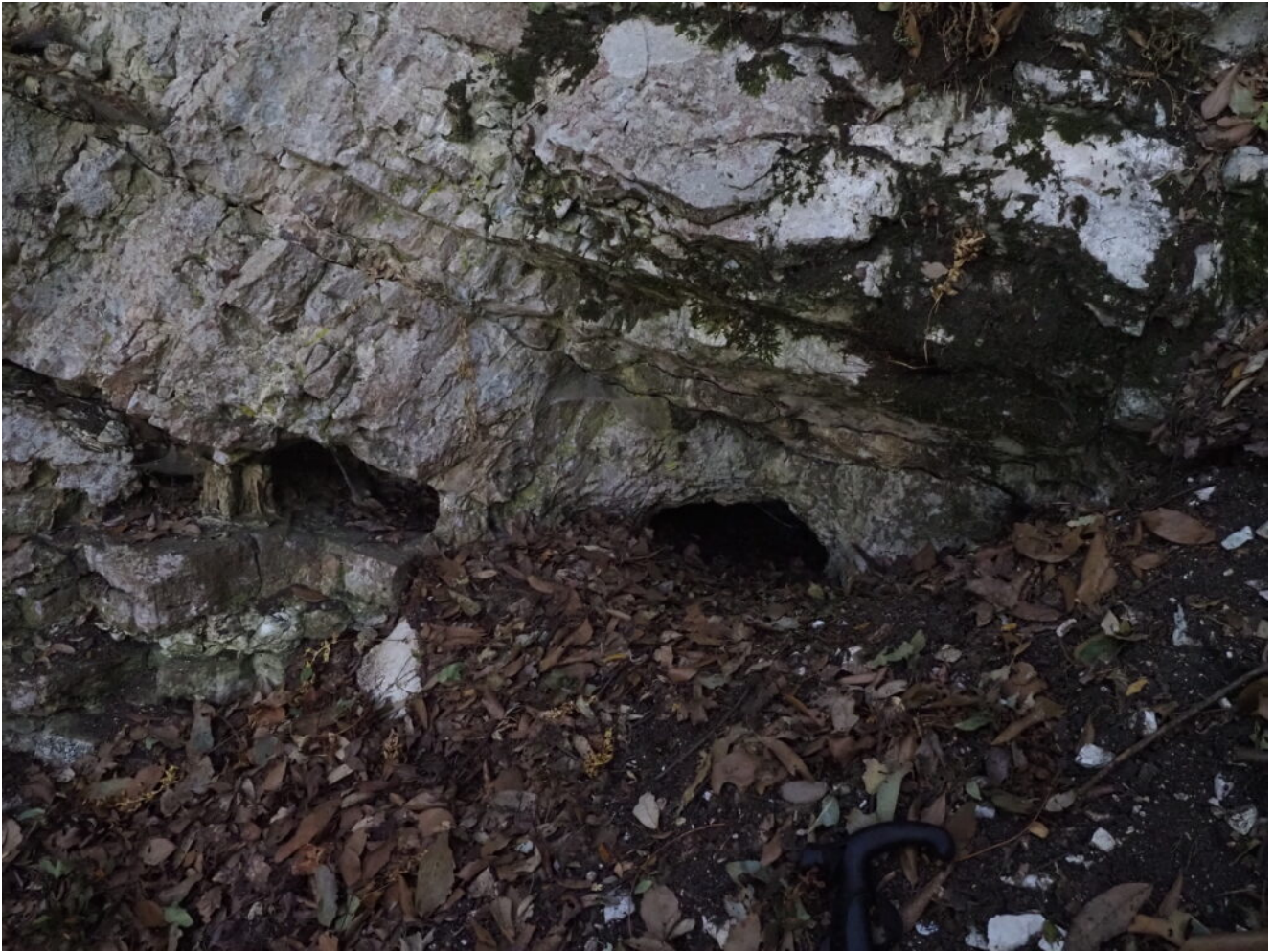
36 – 39 – La Grotta della Ciarla, profonda pochi metri.