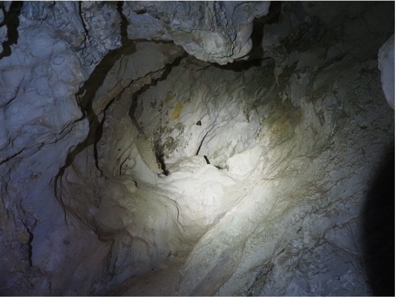
29- Il fondo della Grotta.