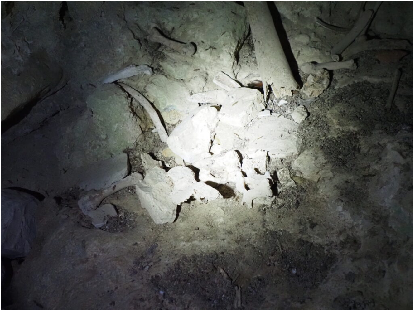
30- I resti umani ancora presenti nella Grotta.