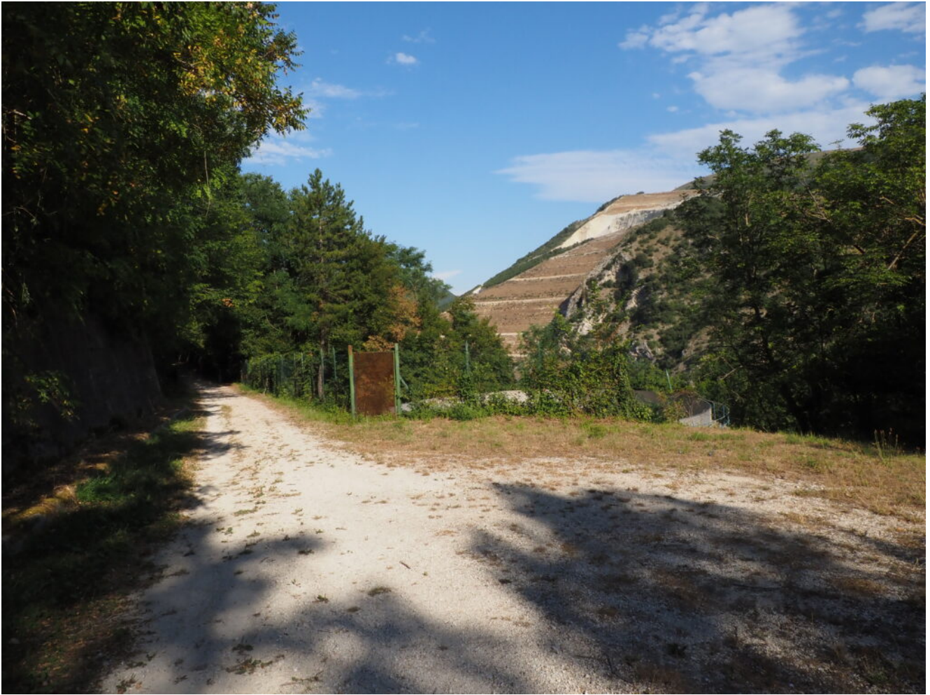
2- La strada prosegue in piano verso la condotta forzata della Centrale Idroelettrica di Valcimarra.