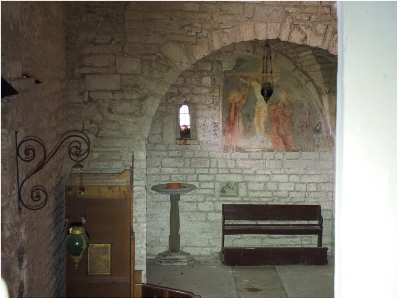
33- L'interno della chiesa, visibile dalla finestrella. GROTTA E FESSURA I e II DELLA CIARLA.