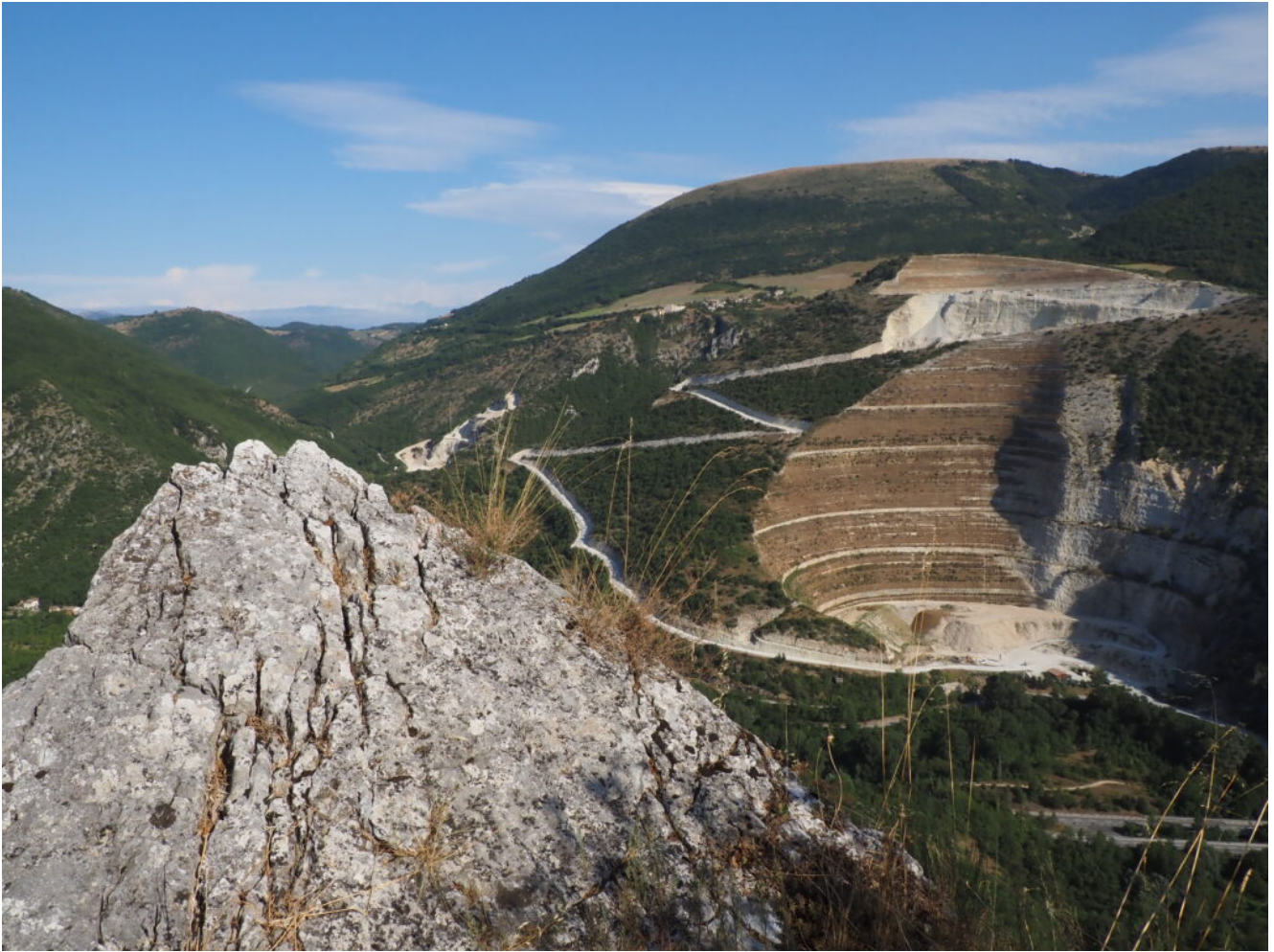
6 – 7- Dal Terrazzo si apre una visione aerea della Valle del Chienti, peccato l'orribile cava di Bistocco.