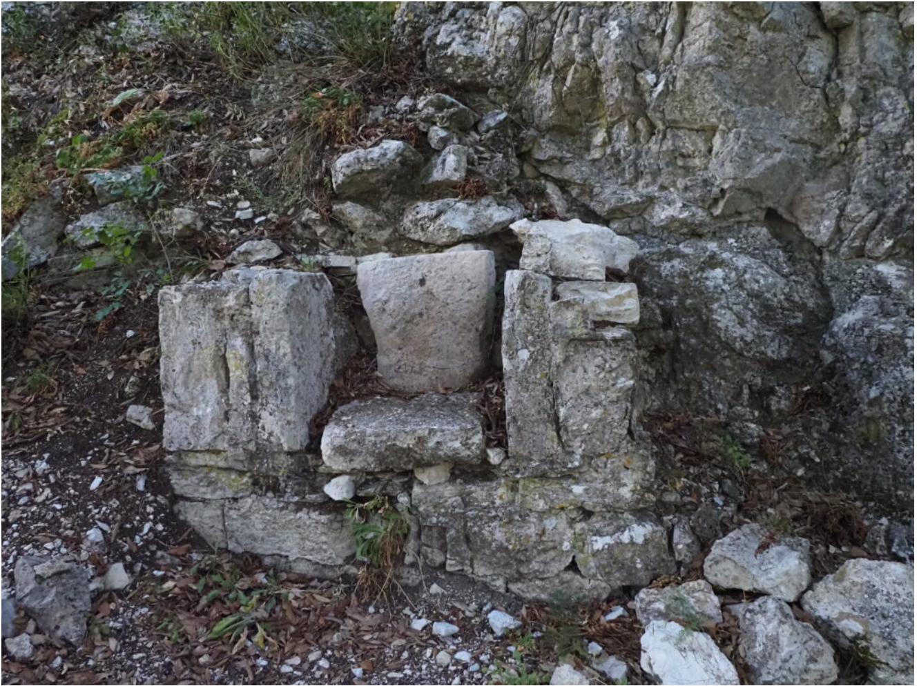
25- Il "trono" dell'Eremo.