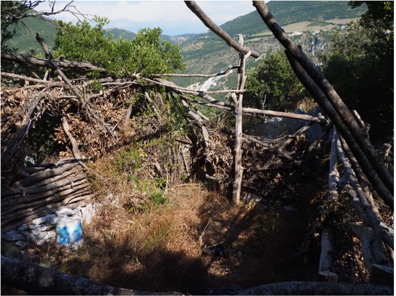
35- I resti di uno strano capanno in legna, forse di cacciatori.