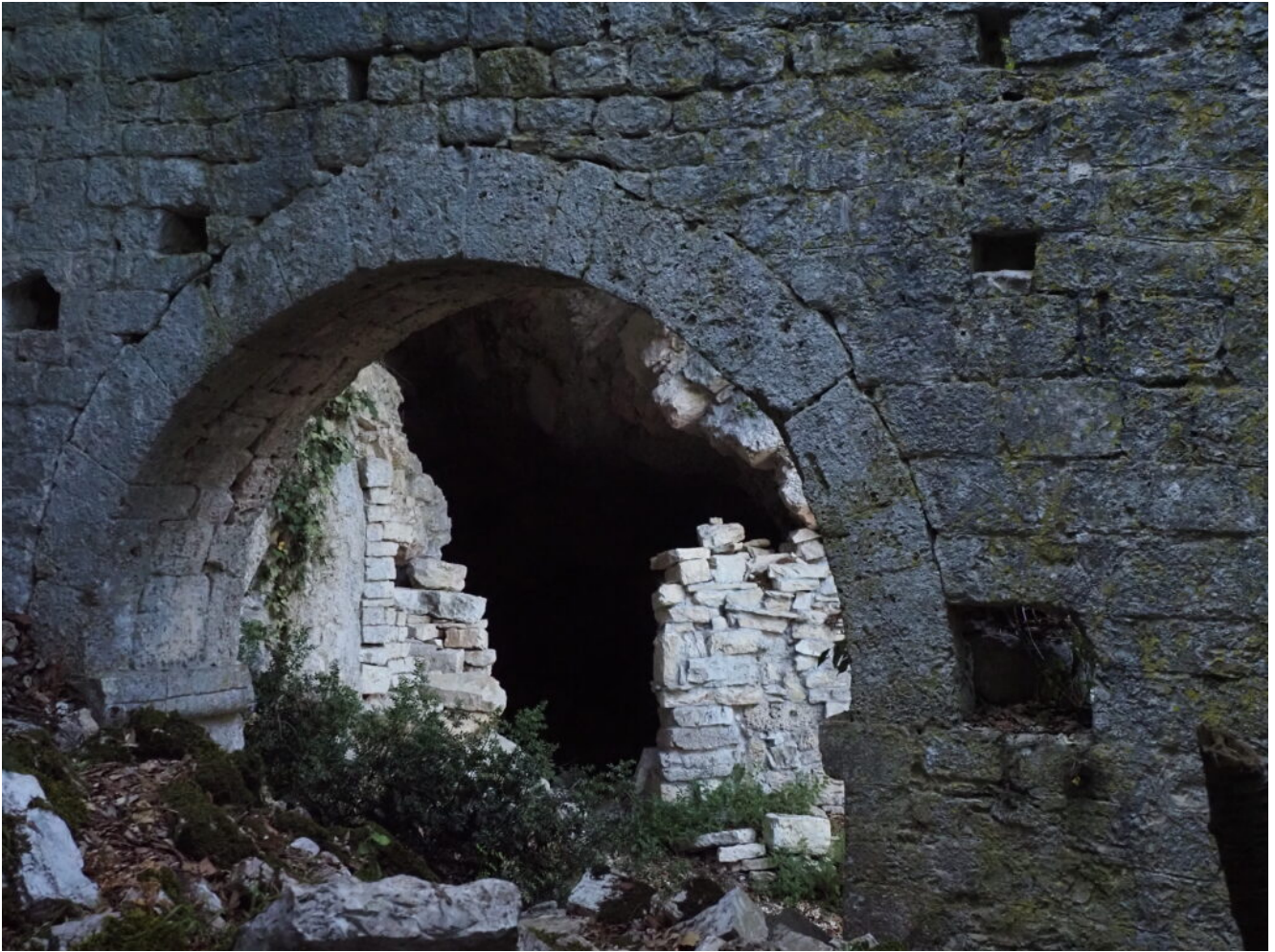
23- I ruderi nei pressi della grotta dell'Eremo.