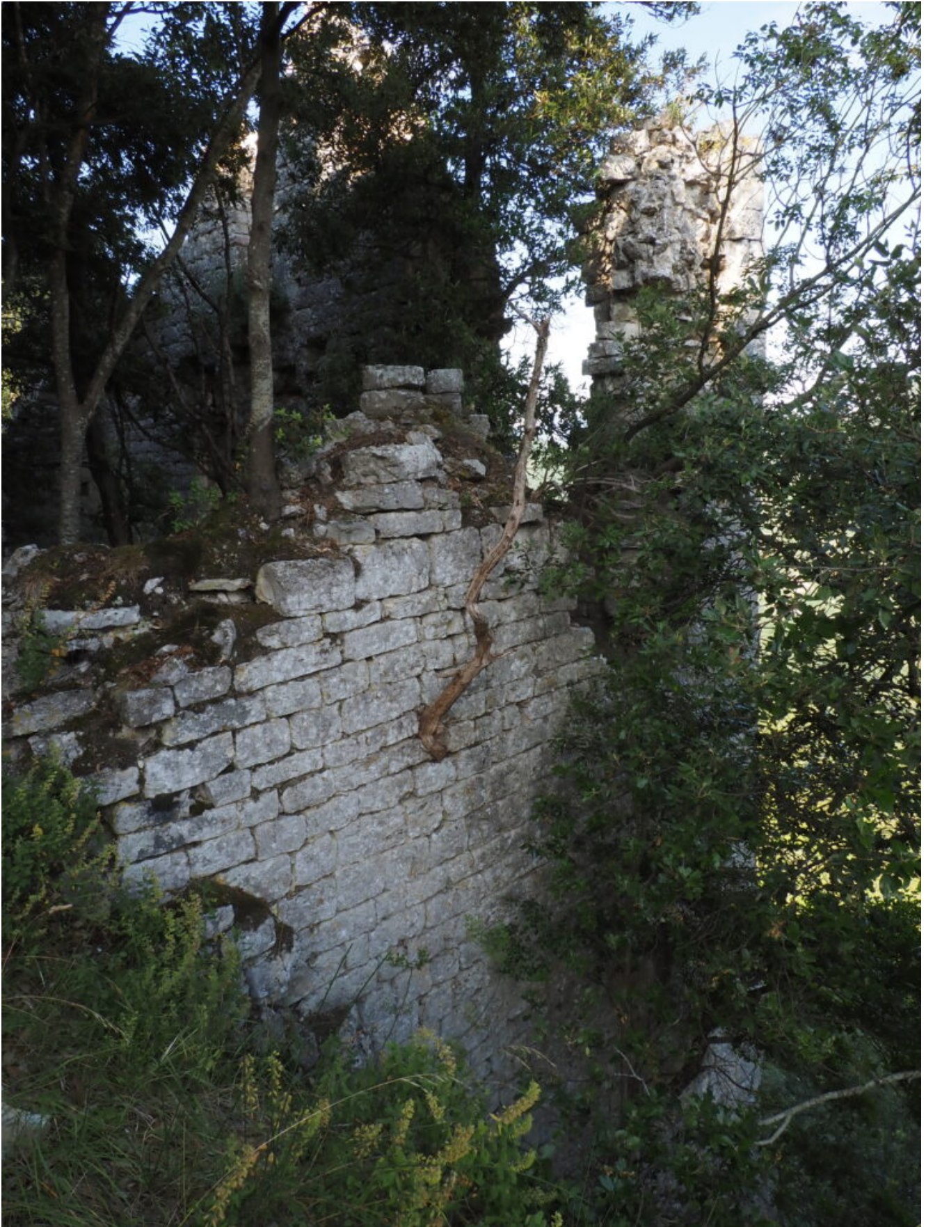
9- 12 -Gli imponenti ruderi dei diversi edifici dell'Eremo.