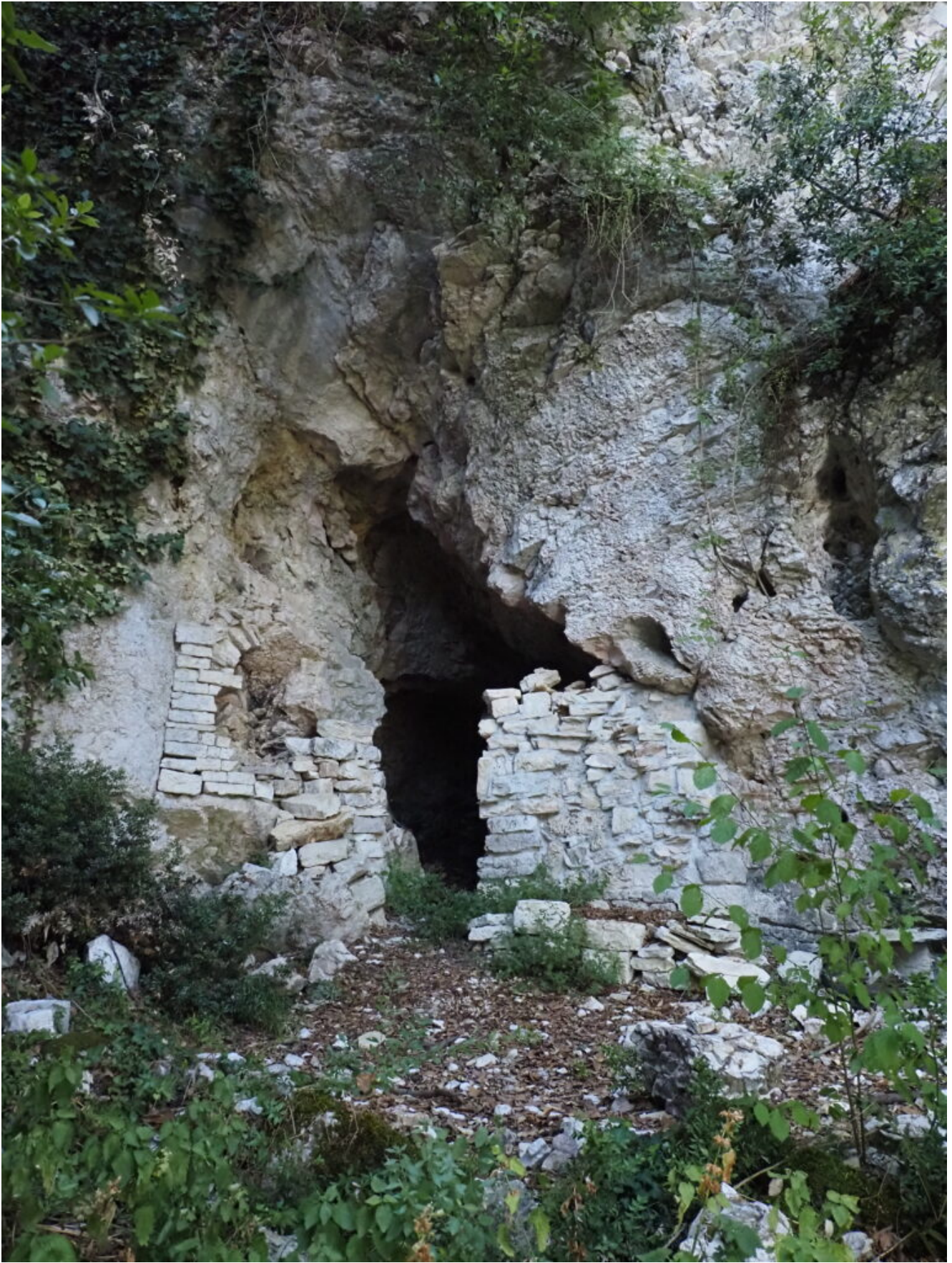
26- La grotta dell'Eremo.