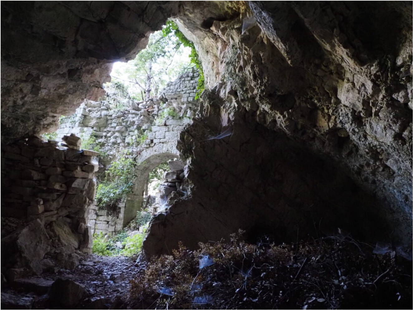
27- Veduta dall'interno della Grotta.