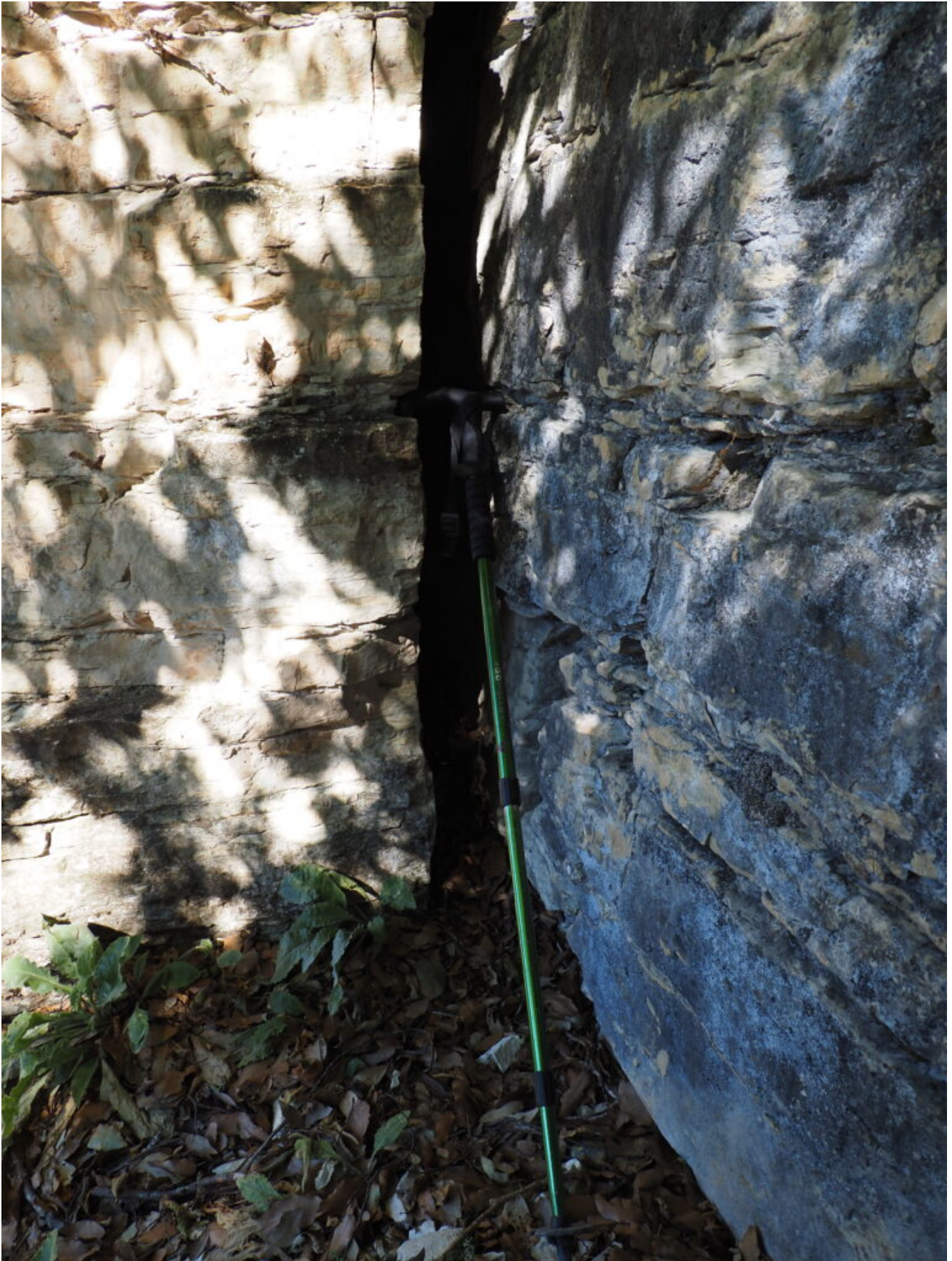
44- La Fessura della Ciarla II, a poche decine di metri dalla I, strettissima e molto profonda ma impossibile da entrare.