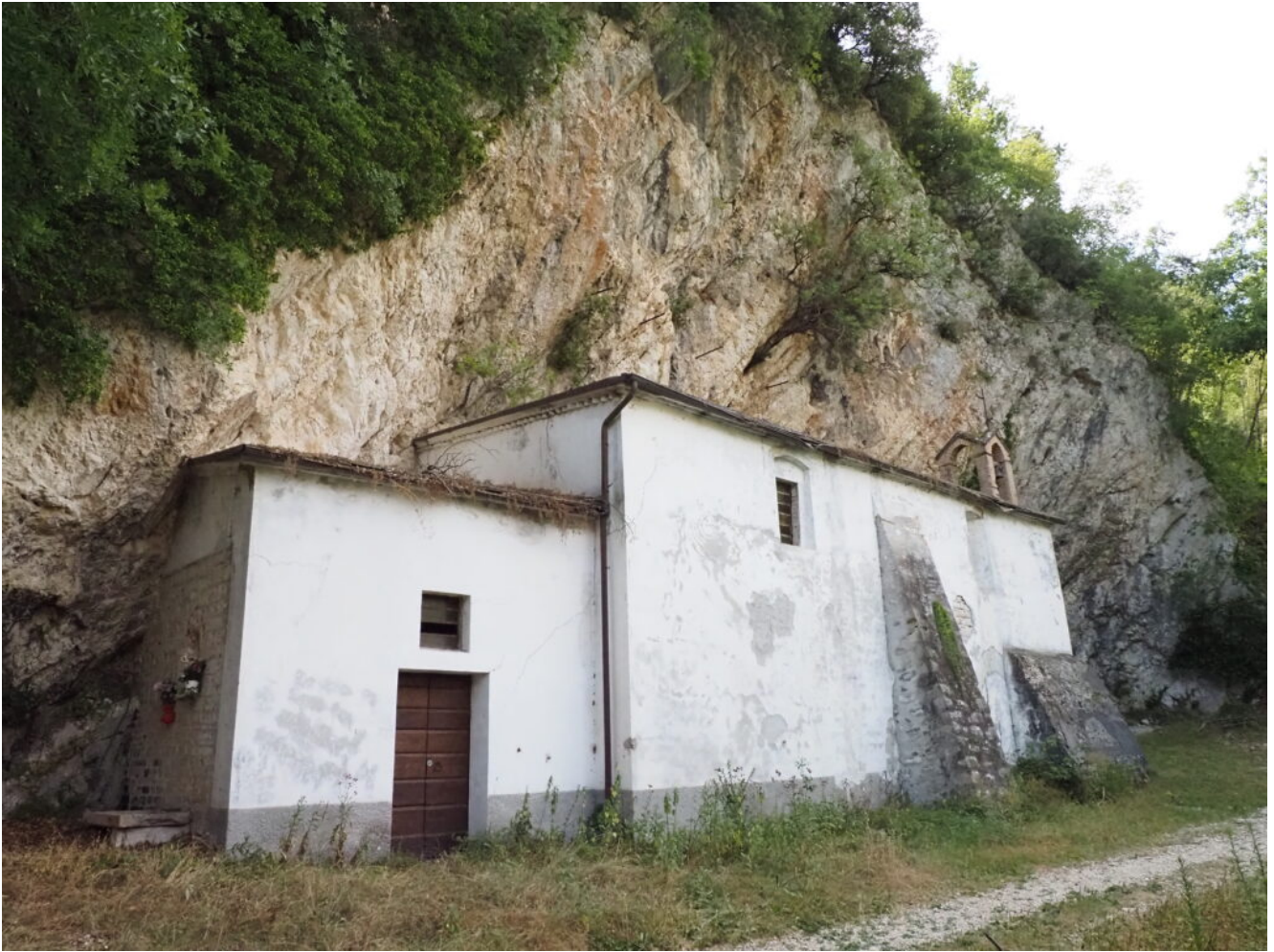
31- 32 -La Chiesa della Madonna del Sasso.