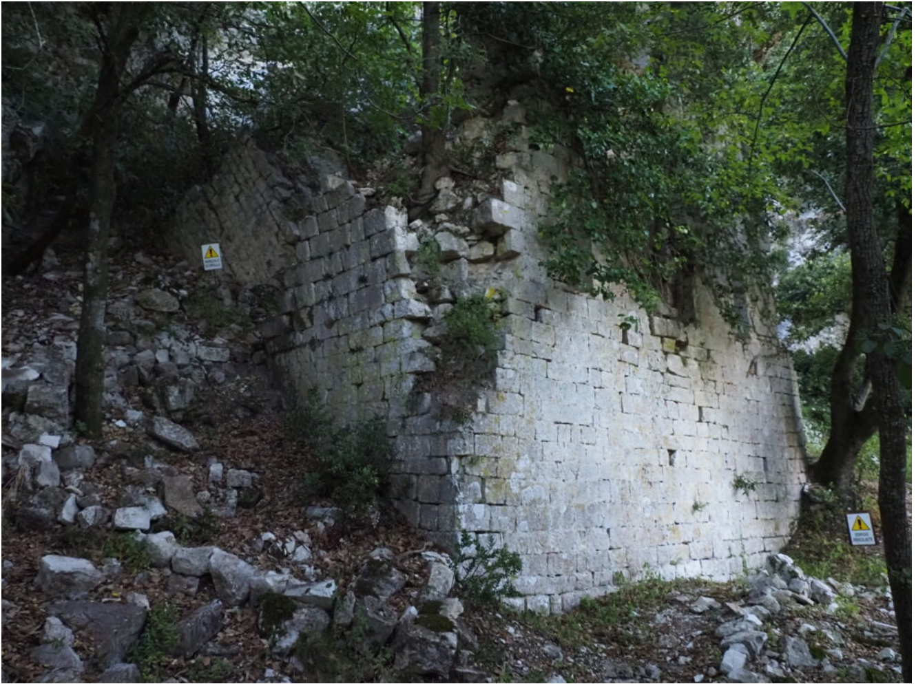
19 – 21 -I ruderi addossati alla parete rocciosa.