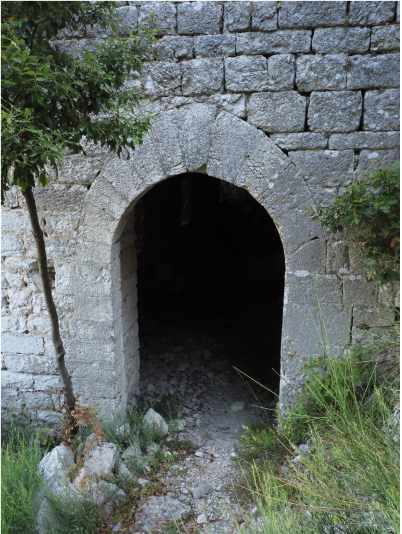
13- 18 – La porta del locale a piano terra ancora sorprendentemente intatto nonostante i secoli ed i terremoti.