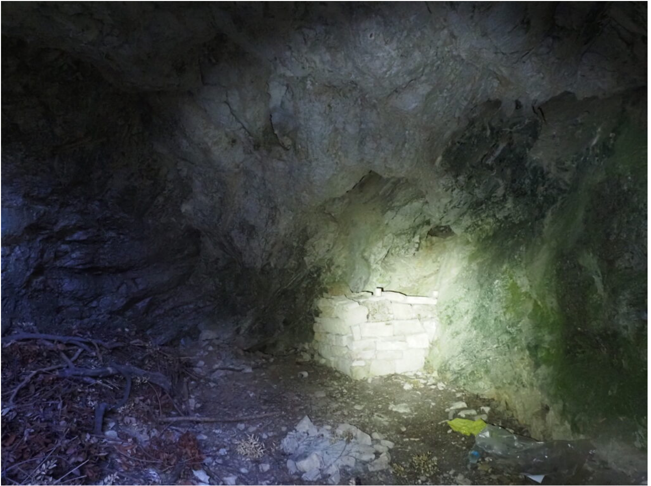
28- Il piccolo altare