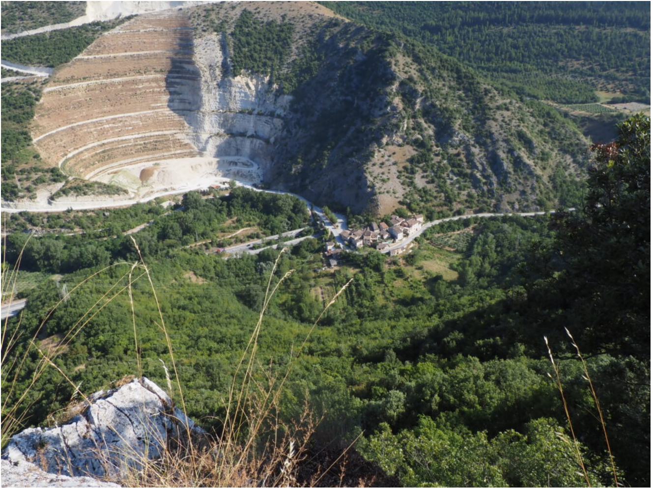
8- La Frazione di Bistocco di Caldarola con la grande cava.