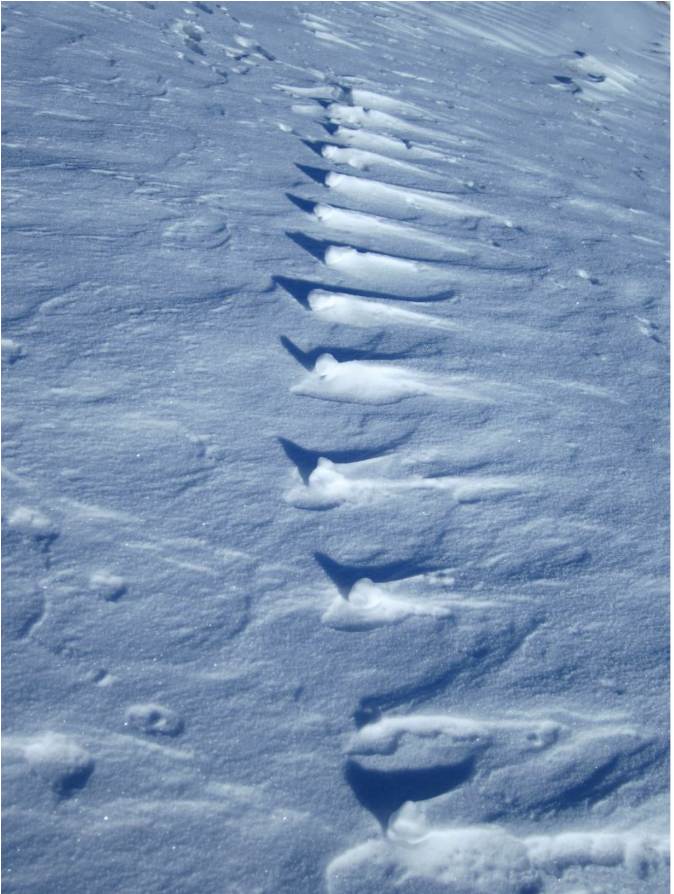
8- Orme di animale (forse volpe) in rilievo, quando l'animale è passato sopra la neve fresca l'ha compressa, successivamente il vento ha portato via la neve fresca lasciando le orme più compatte in paradossale rilievo anziché lasciarle infossate.