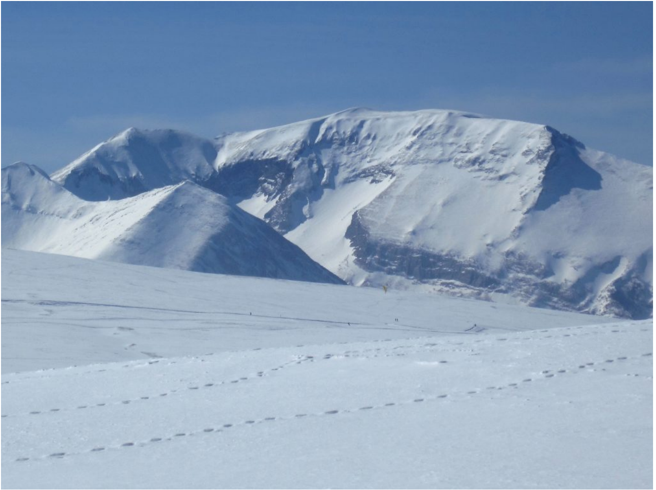
15- L'imponente versante est del Monte Rotondo con la Punta Bambucerta di fronte e la nascosta Val di Tela tra i due.