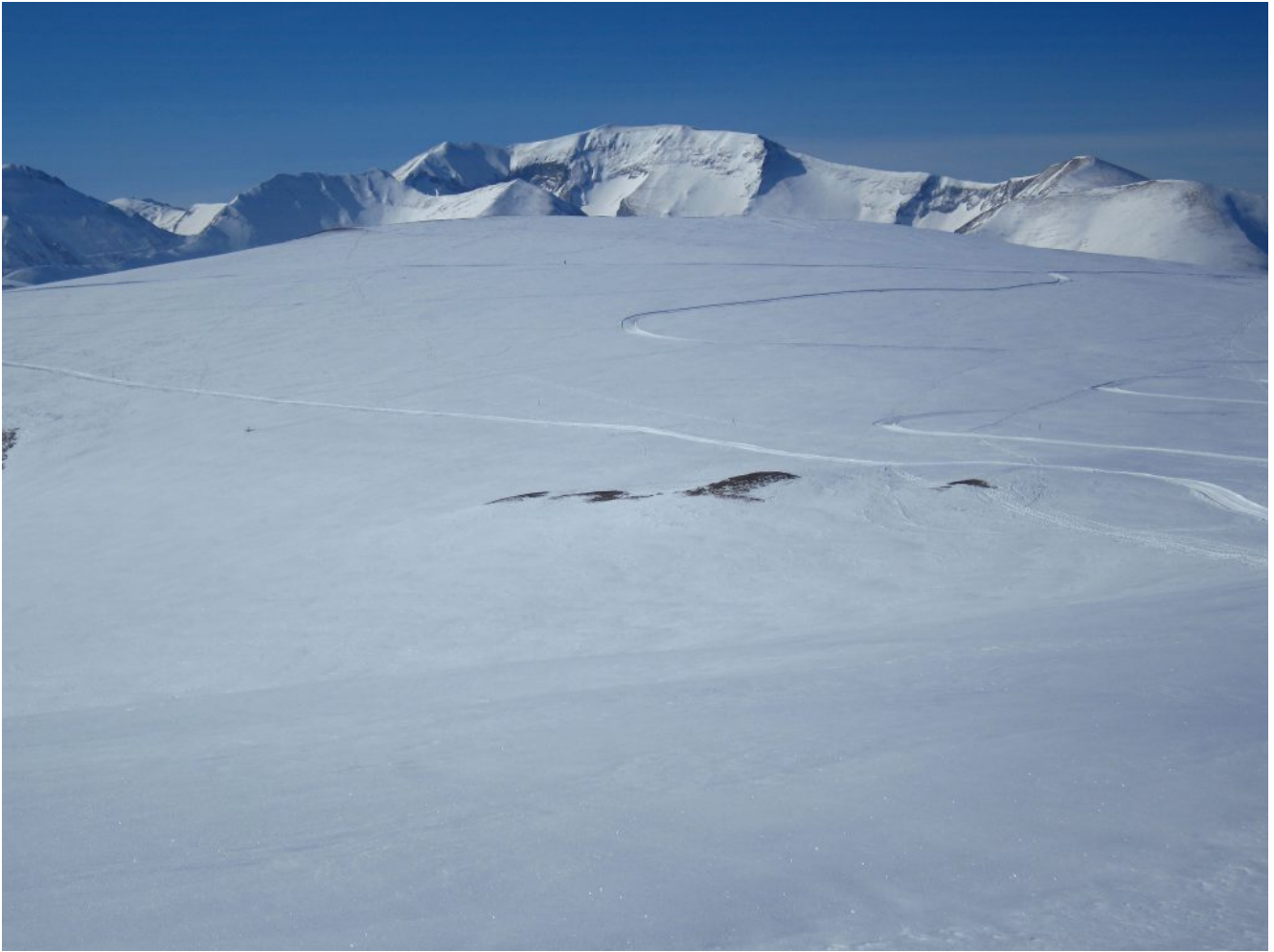
3-Panorama verso Ovest con il Monte Rotondo, a destra il Monte Pietralata e il Monte Cacamillo, di fronte gli ampi Piani di Ragnolo con la sinuosa la pista da fondo che solca l'appezzamento di prato di cui sono comproprietario.