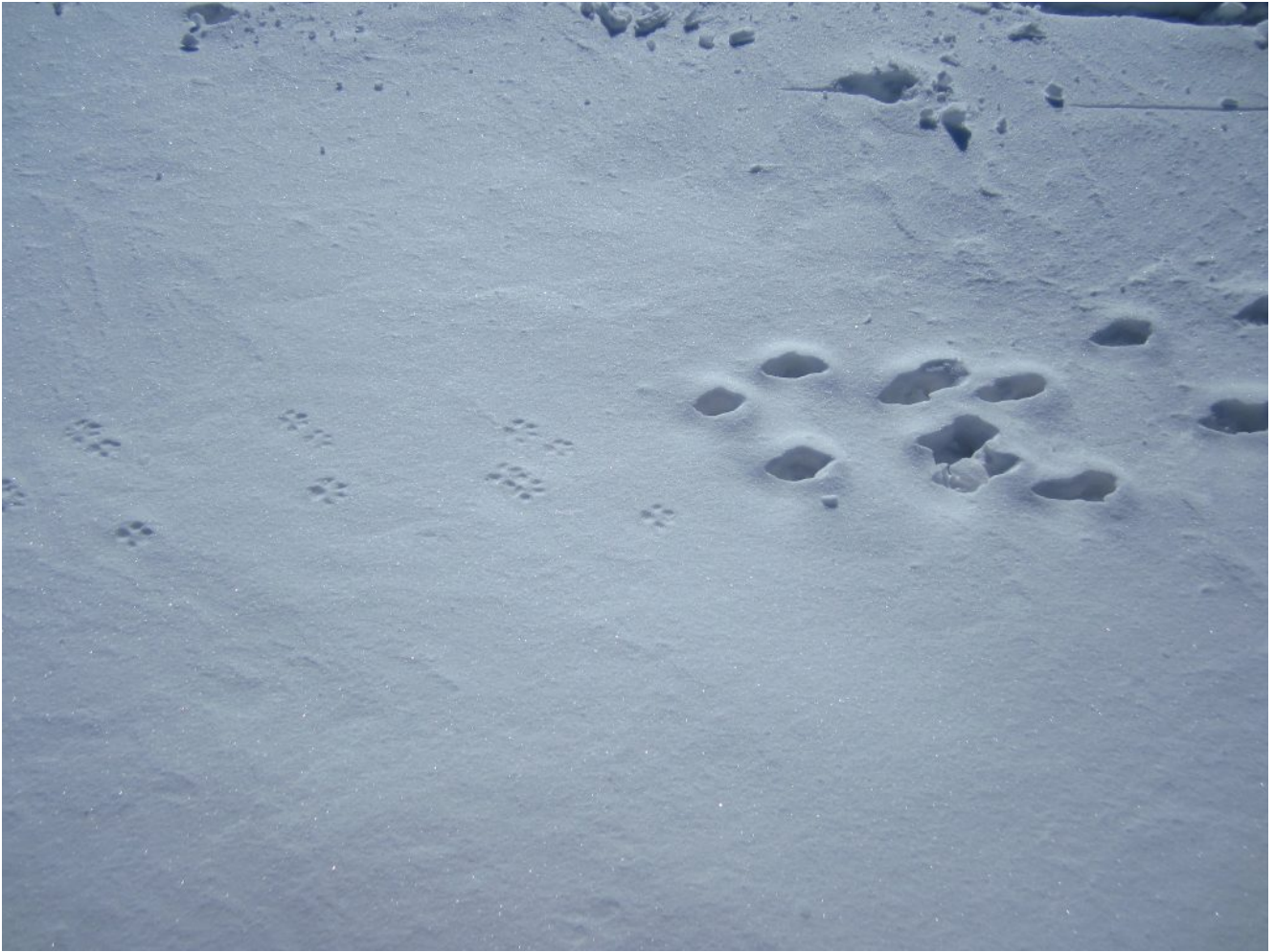
12- L'impercettibile confine tra neve dura e neve fresca.