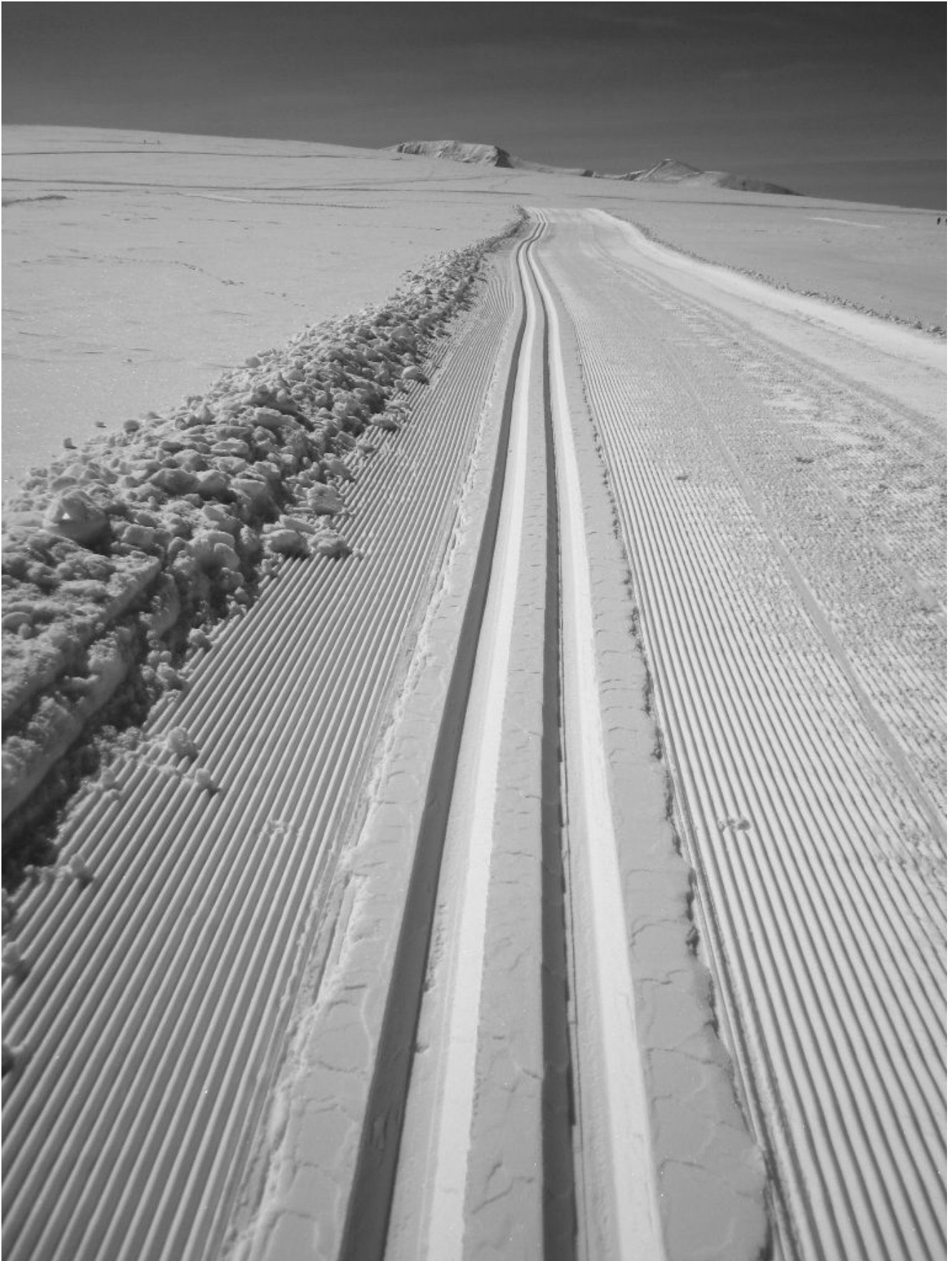
18-21- Texture artificiali sulla neve, pur essendo opera dell'uomo e sconvolgono l'aspetto della montagna hanno comunque il loro fascino fotografico.