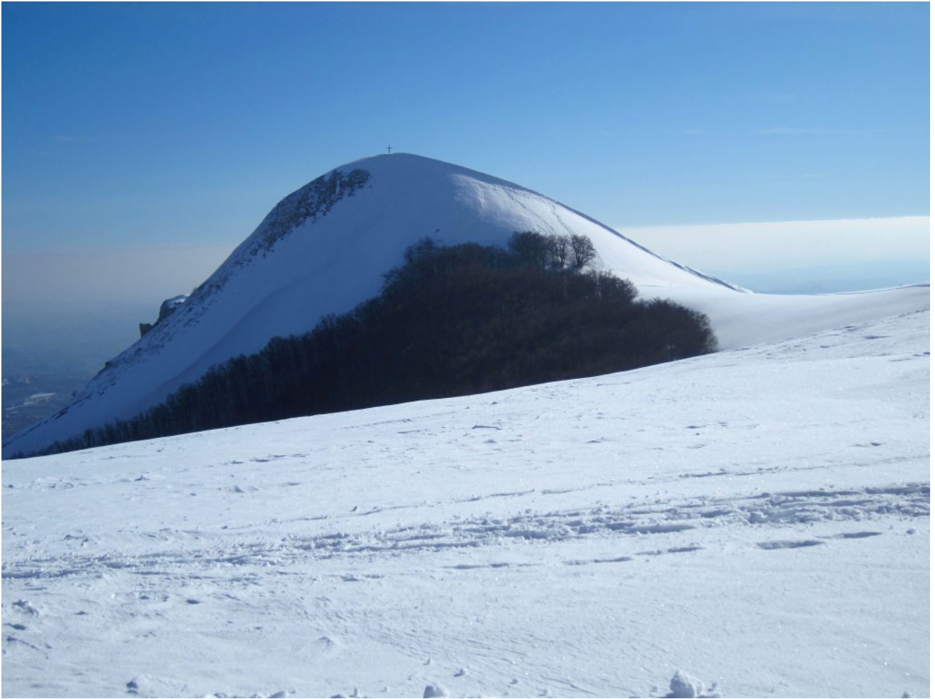
1- Il Pizzo di Mèta con la croce di vetta.