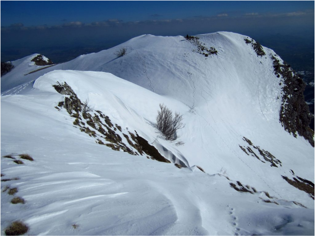
10- Accumuli di neve a vento nei pressi della cima di Monte Montioli.