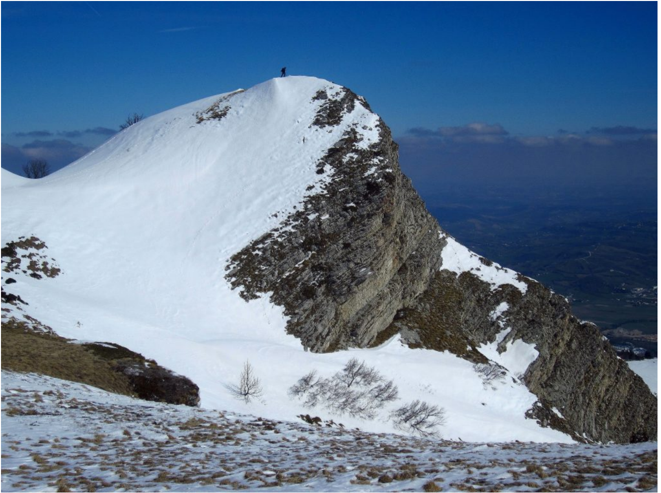
9- La cima di Monte Montioli, a destra nella vallata i Piani di Pieca, nei pressi di Sarnano.