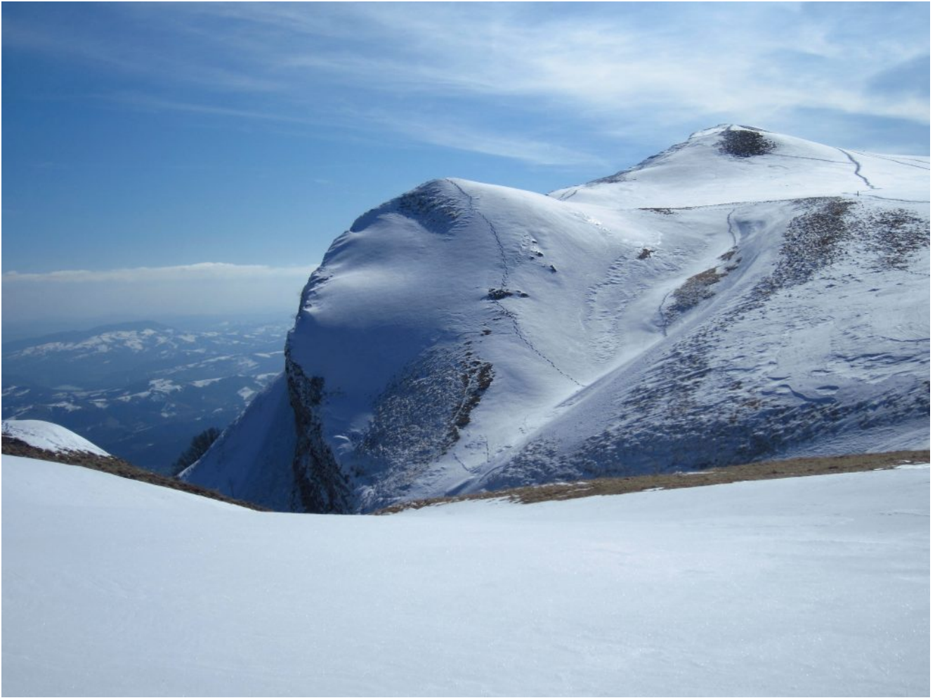
6- La cima di Monte Ragnolo, la più alta, 1557 m.