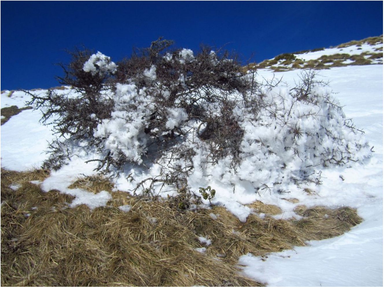
16- Biancospino a tutti gli effetti pur non essendo ancora fiorito.