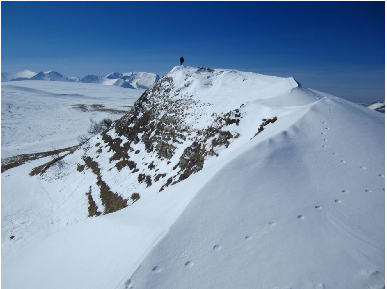
11- L'aerea cresta di Monte Montioli domina la distesa bianca dei Piani di Ragnolo con le cime del gruppo Nord dei Monti Sibillini sullo sfondo, indicate nelle foto n.2 e 3.