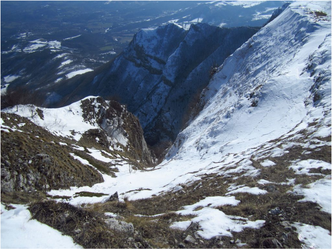
4- Il versante Est del Monte Ragnolo scende ripidissimo verso Rio Terro.