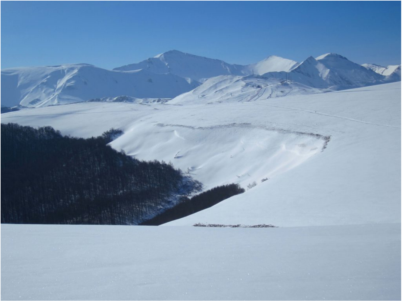
2- Panorama verso Sud dal Monte Ragnolo, a sinistra il Monte Castel Manardo, al centro svetta il Pizzo Regina, a destra il Pizzo Berro, Monte Acuto e Pizzo Tre Vescovi.