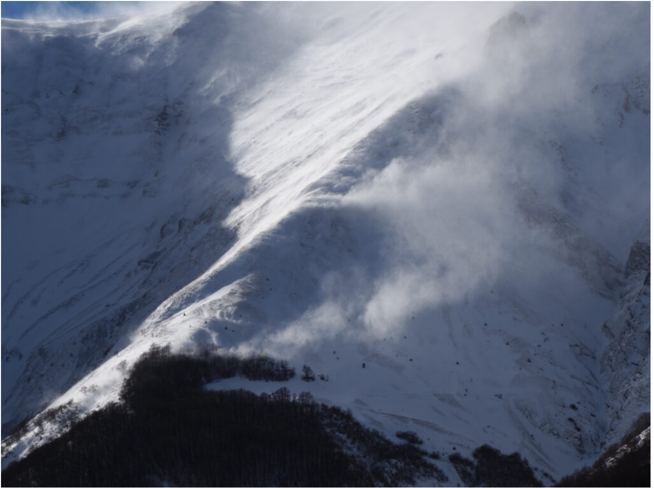
26- Forti folate di vento tra i due imbuto del Vettore.