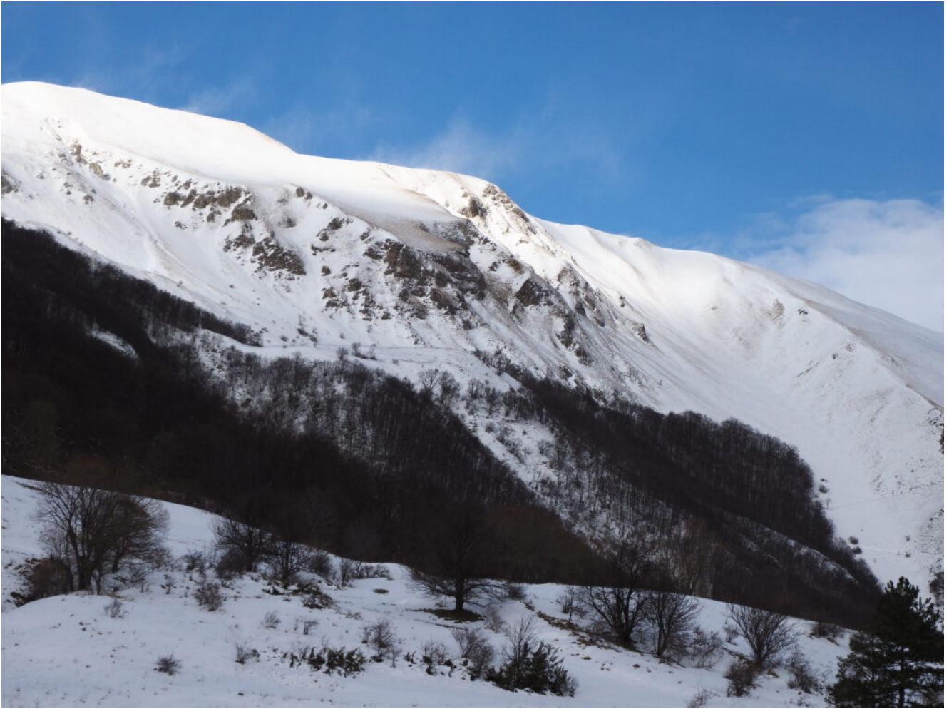
22- Il Monte Banditello e il pianoro sopra al bosco dove sorge il Casale de Le Pozze.