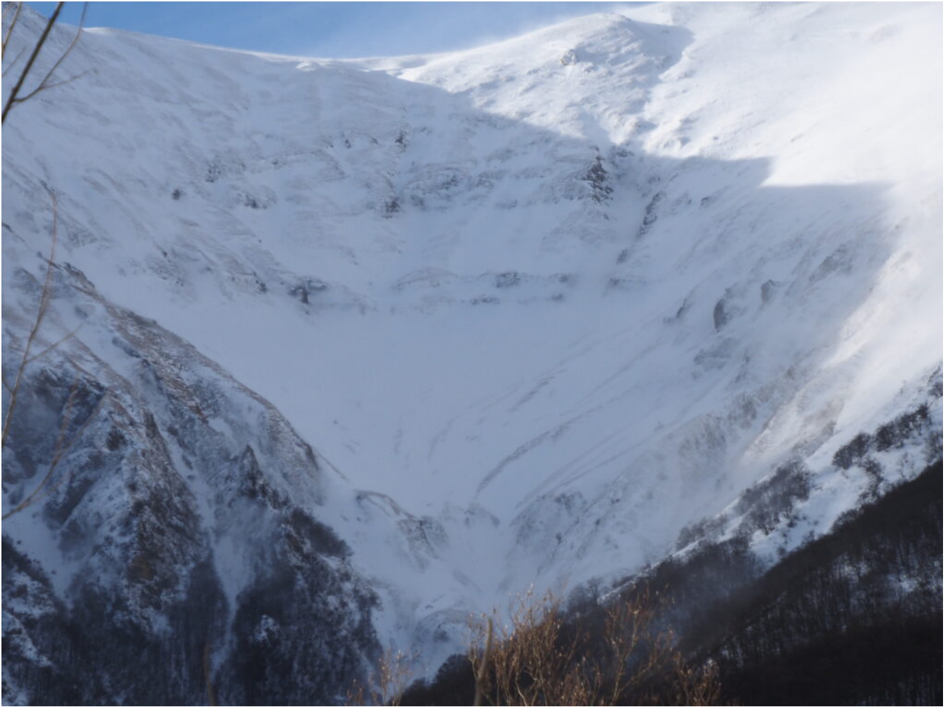
17- L'imbuto del Monte Vettore con i canali di salita invernali.