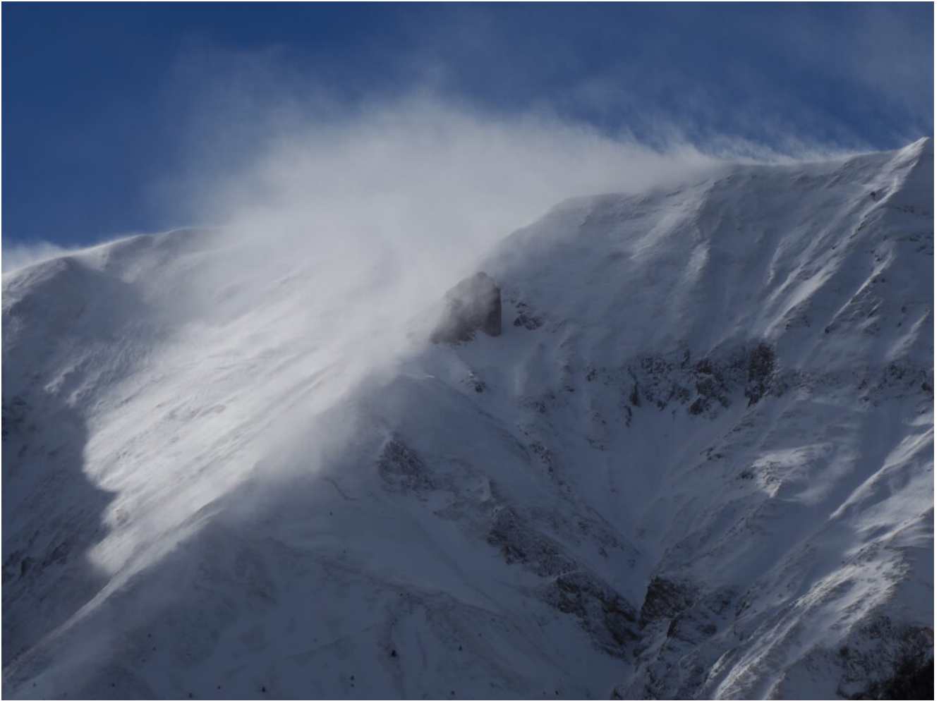
16- Il Sassone dopo due ore.