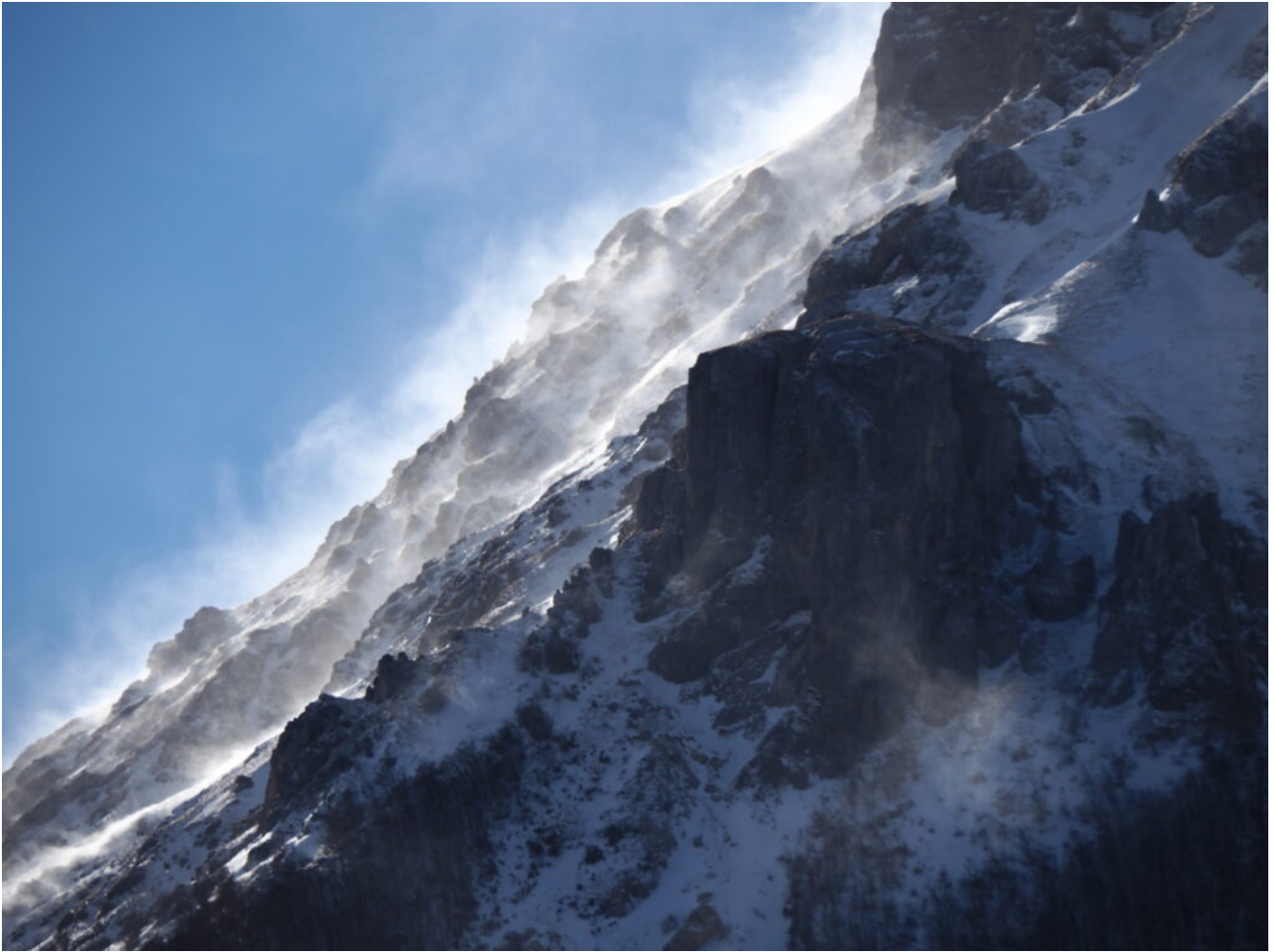
14- Il Sasso Spaccato rivestito di neve trascinata dal vento.