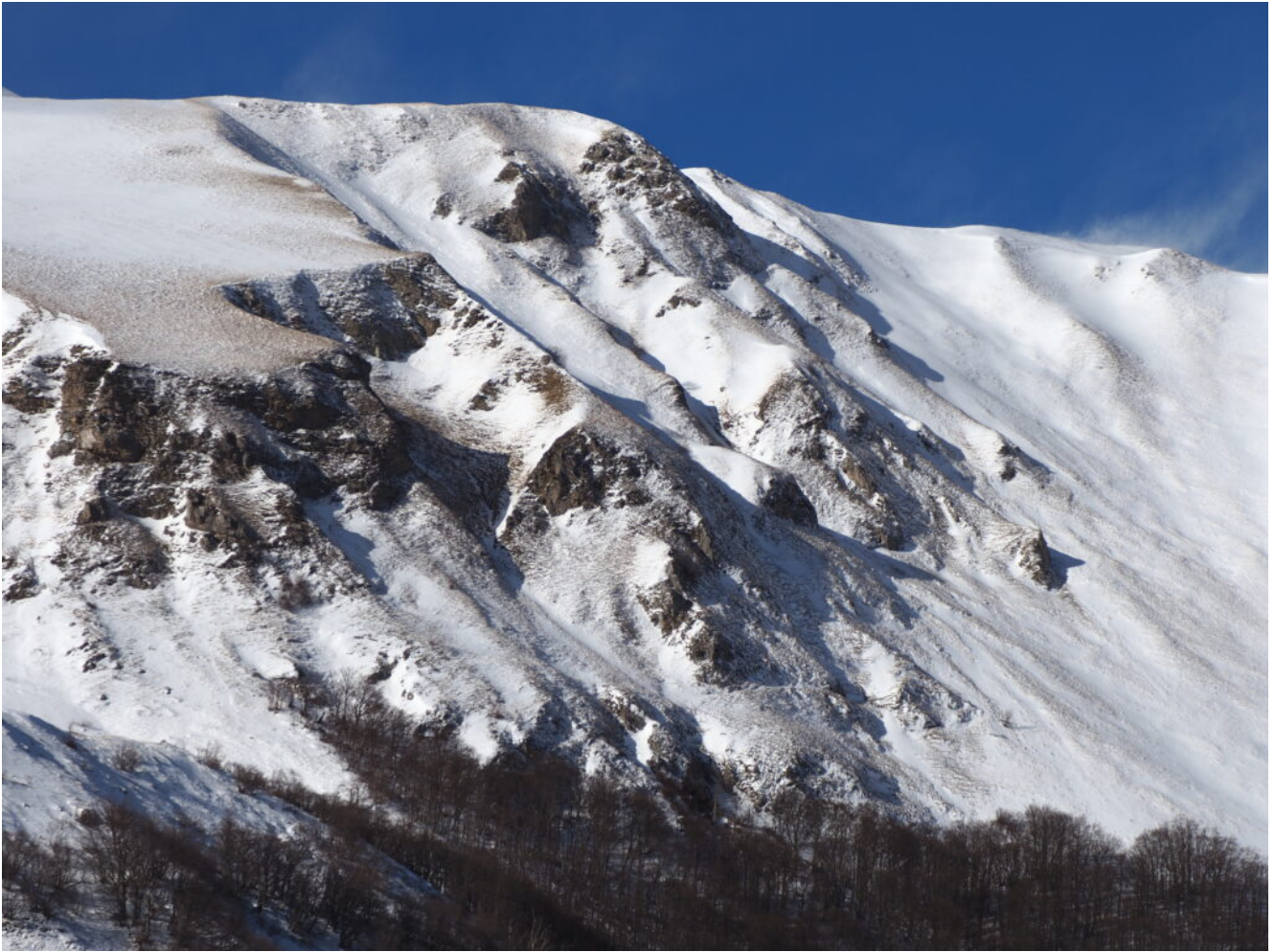
23- Le rocce sopra al Casale de Le Pozze.