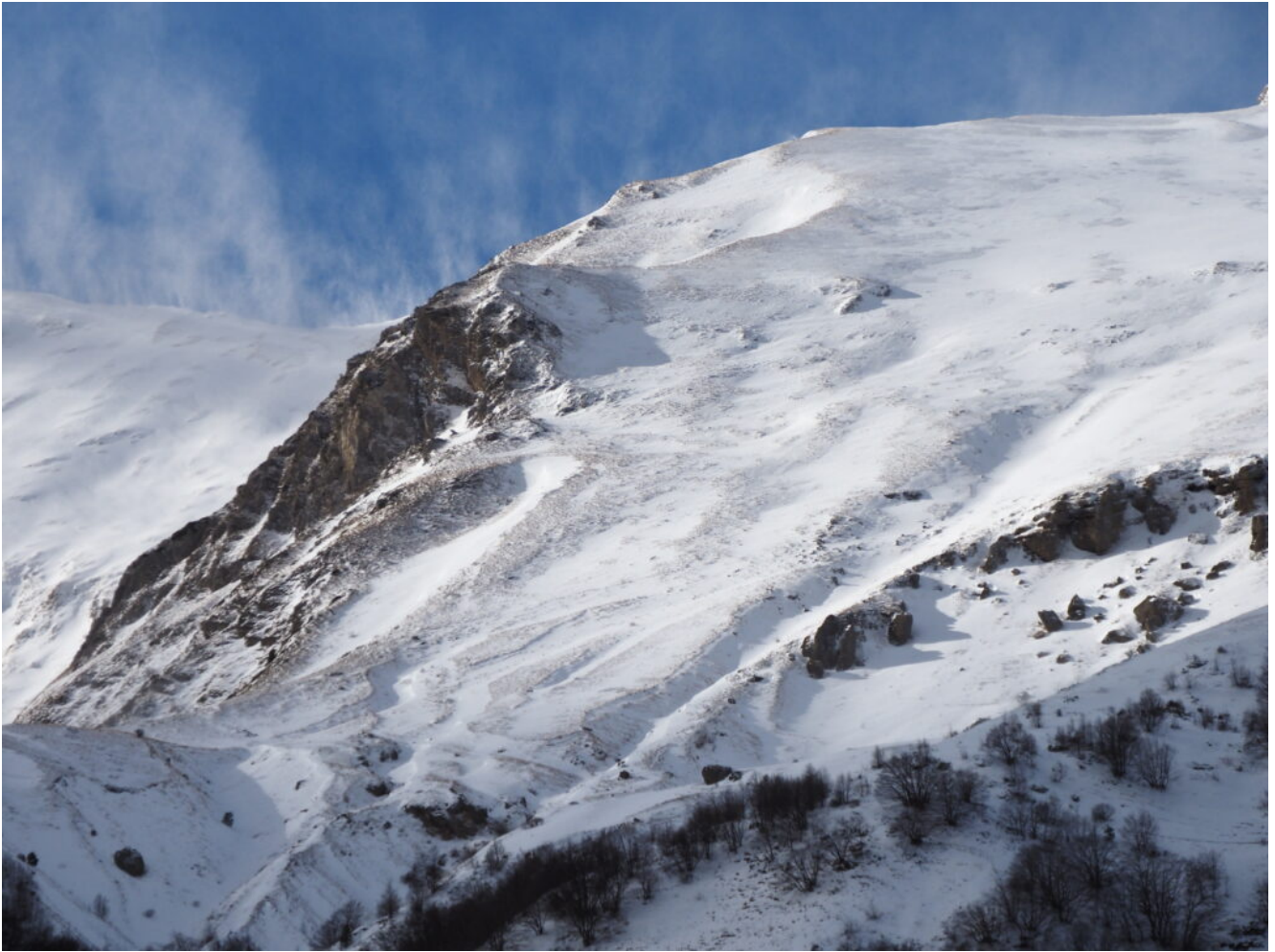
21- La rocciosa cresta Est del Monte Torrone già oggetto di una nostra salita.