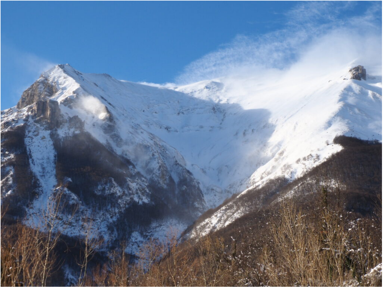
6- L'imbuto del Monte Vettore, la Cima di Pretare e Sasso Spaccato a sinistra ed il Sassone a destra.