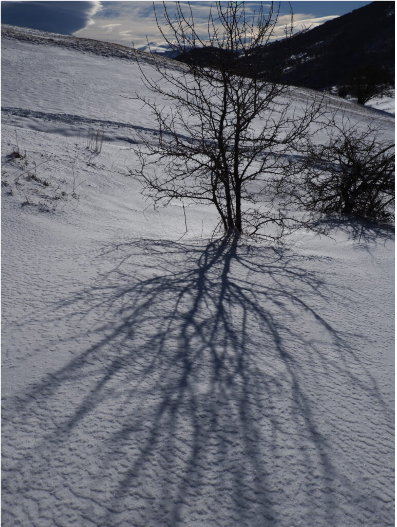
31- Lunghe ombre con il sole invernale.