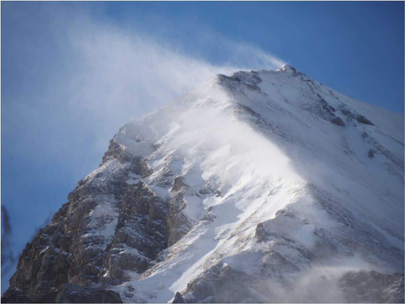
9- Dopo due ore, vento forte.