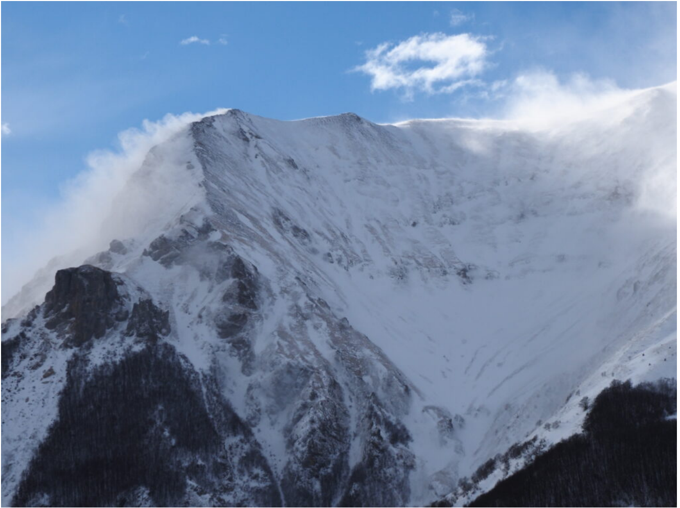
10- Nuvola circolare modellata dal vento sopra la cima del Monte Vettore.