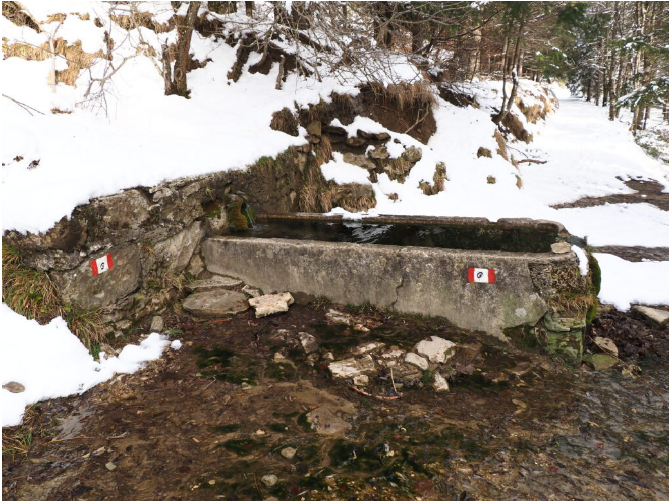
3- La Fonte Santa, poco prima della chiesa.