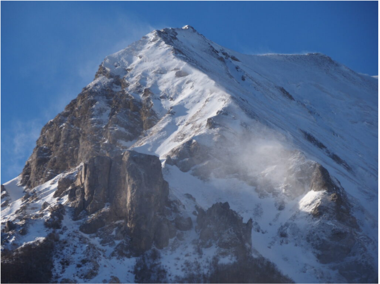
7- La Cima di Pretare al mattino presto, vento debole.