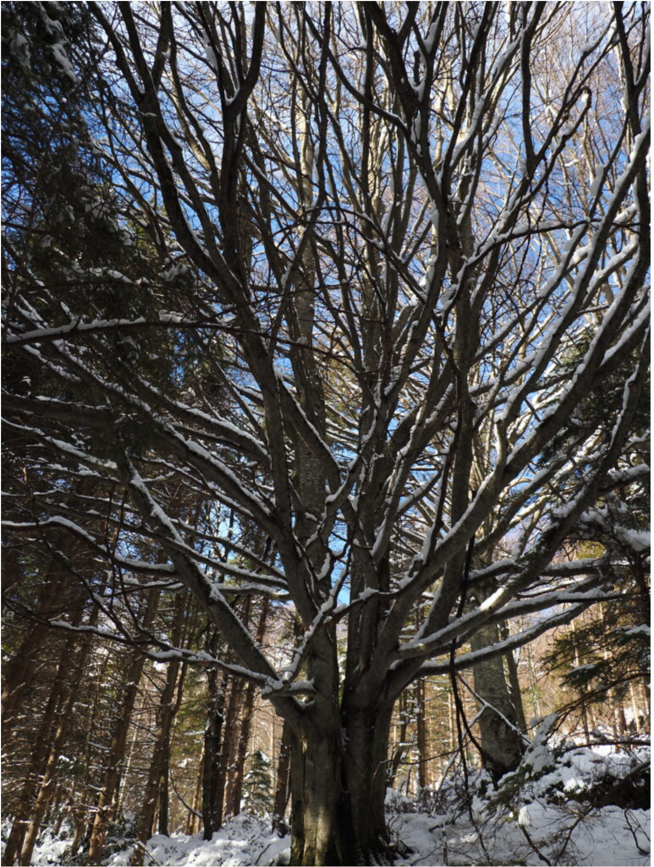
4- Grande faggio nel bosco intorno alla chiesa.