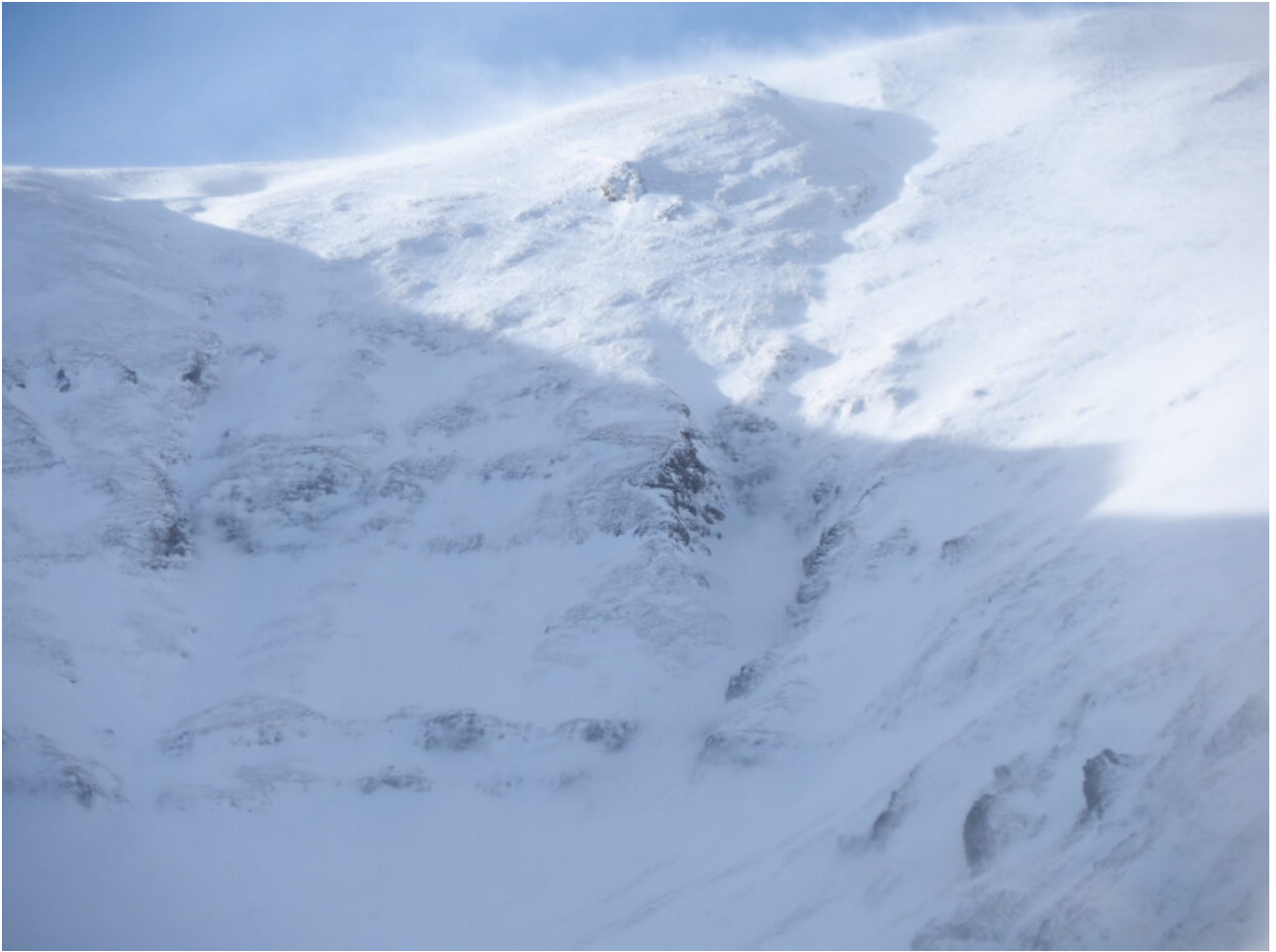
18- Zoom nell'imbuto nel tratto più ripido.