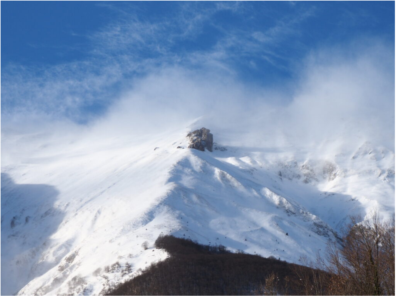
15- Il Sassone al mattino presto.