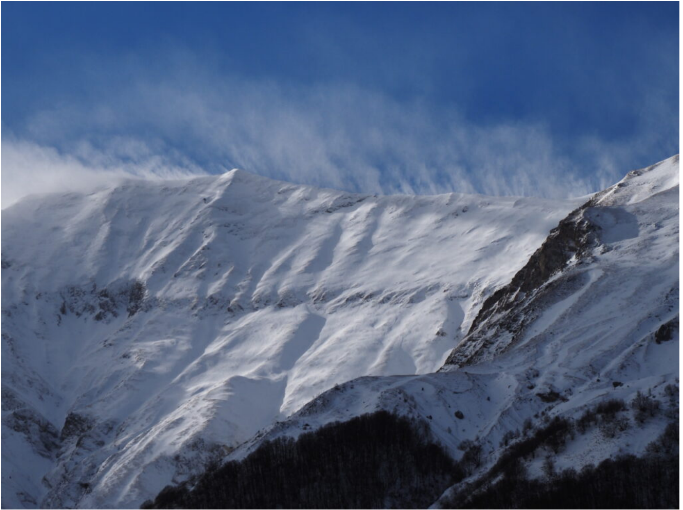
25- La cresta dell'Anticima Nord del Monte Vettore, battuta dal vento.