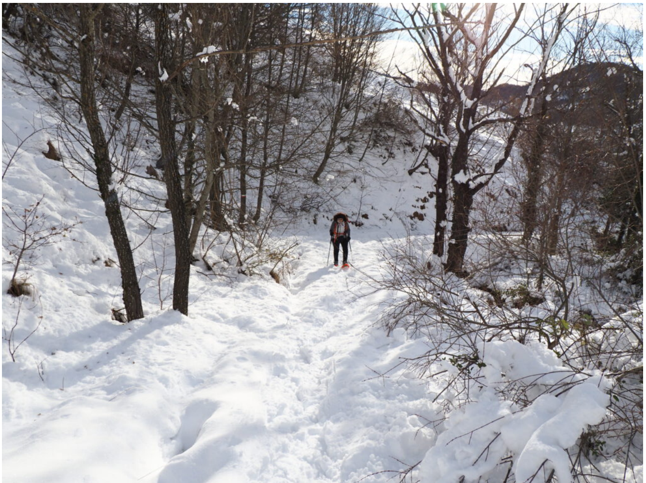
1 – 2 – Il sentiero che da Colle di Montegallo sale verso Santa Maria in Pantano