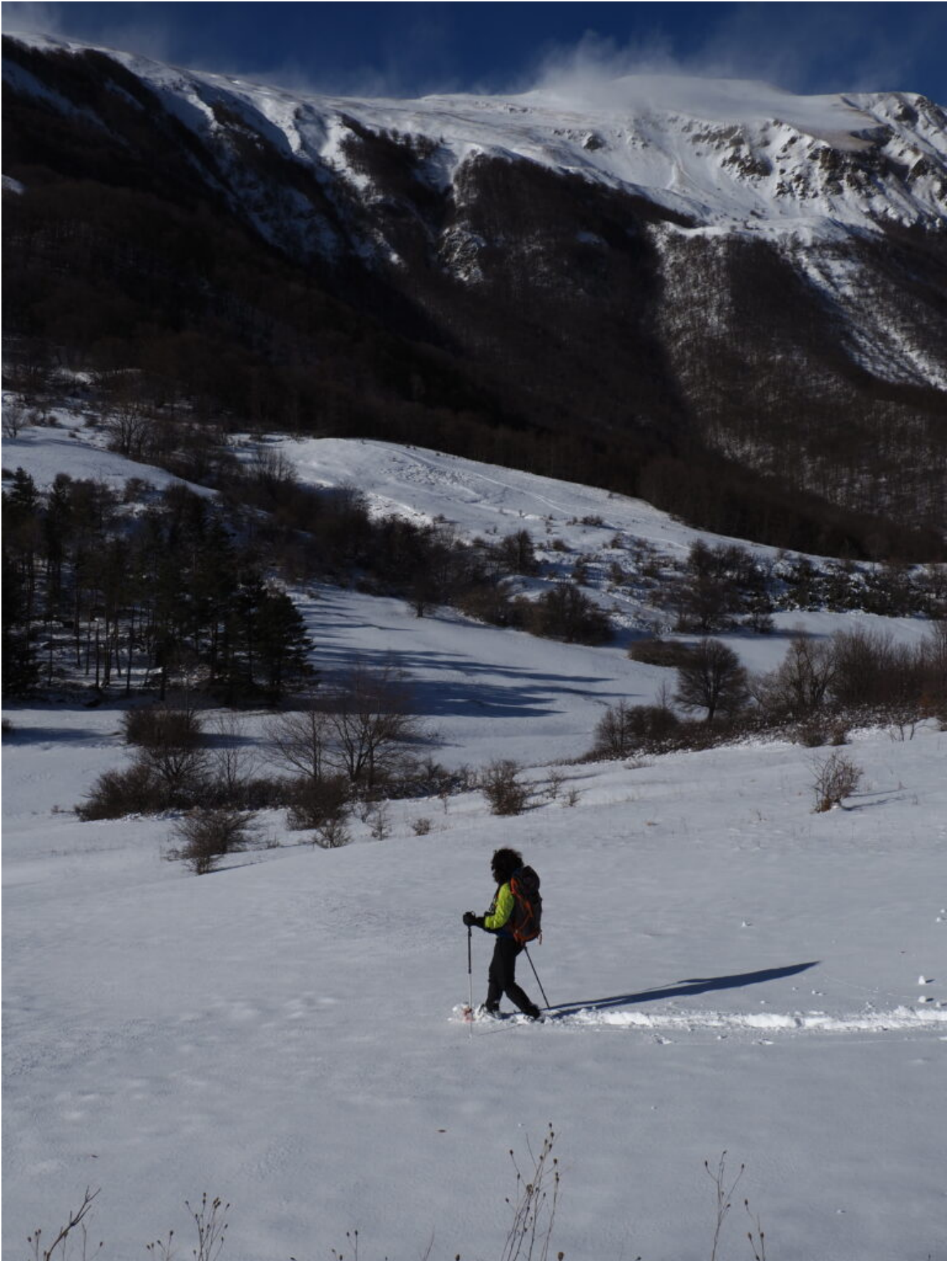
28- 30 – Raggiunto il Monte Oialona ritorniamo verso Santa Maria in Pantano.