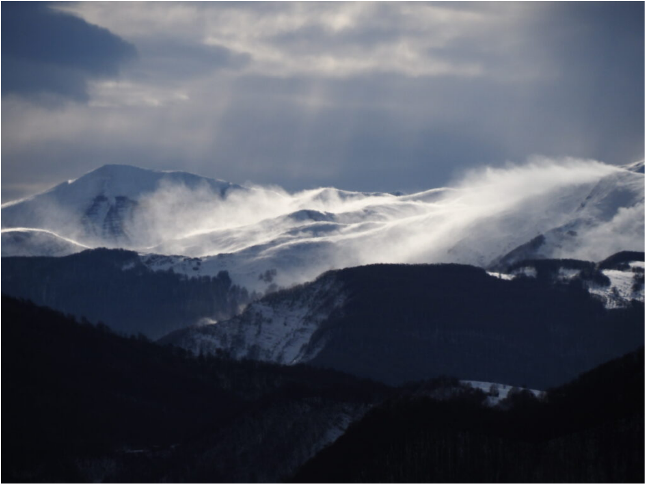
19- Forte vento anche nei Monti della Laga.