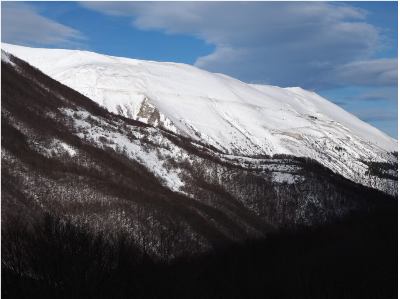
27- Il Monte Sibilla visto dal Monte Oialona.