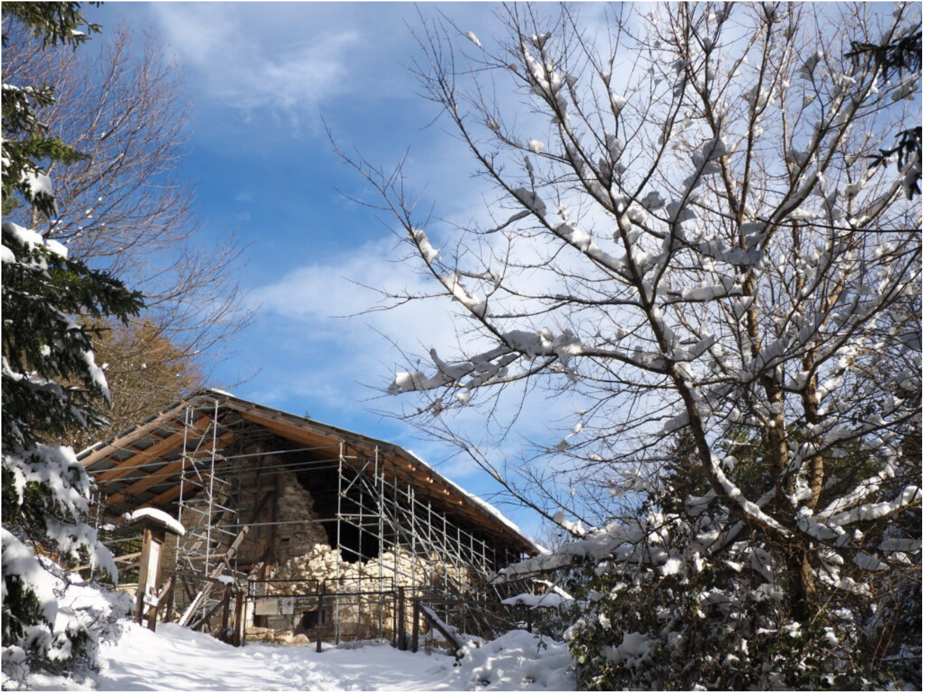
5- I ruderi della chiesa di Santa Maria in Pantano, crollata con il terremoto del 2016, protetta con una tettoia metallica.