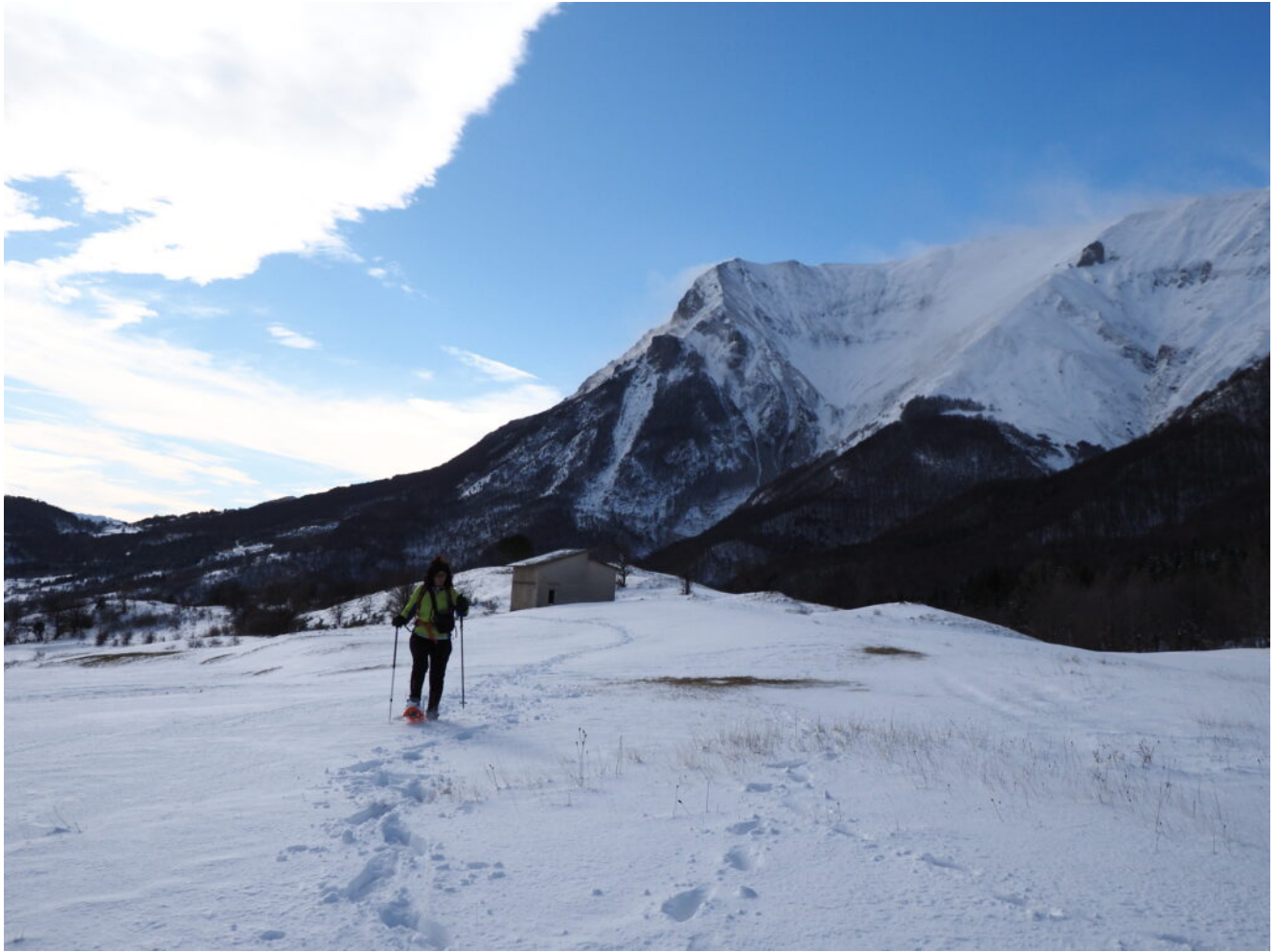
24- Il Casale Iachini, nel pianoro verso il Monte Oialona.