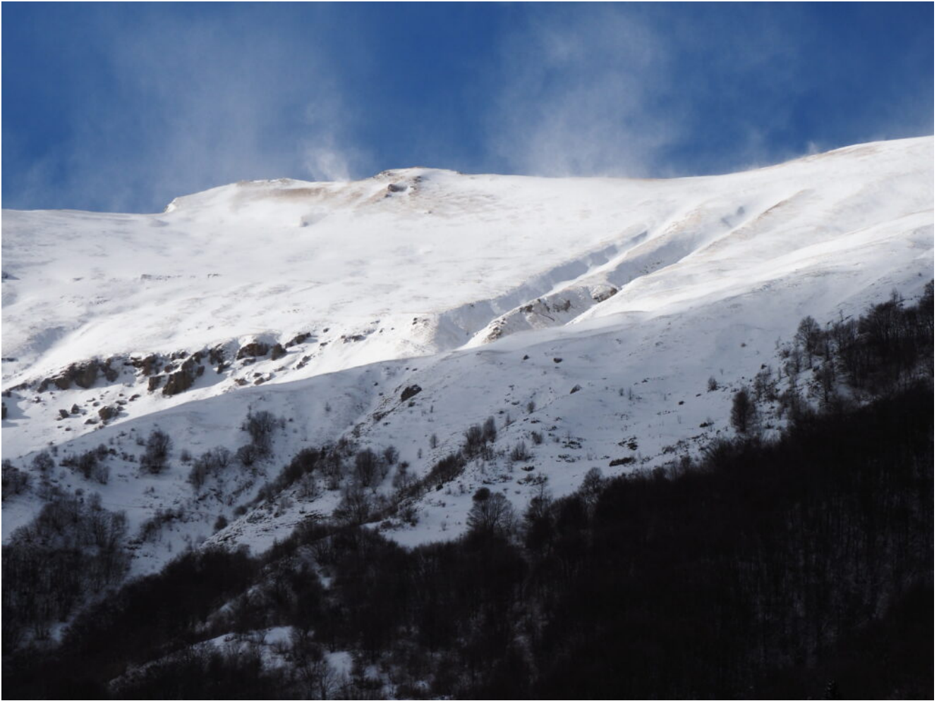
20 – La zona della Fonte del Pastore.