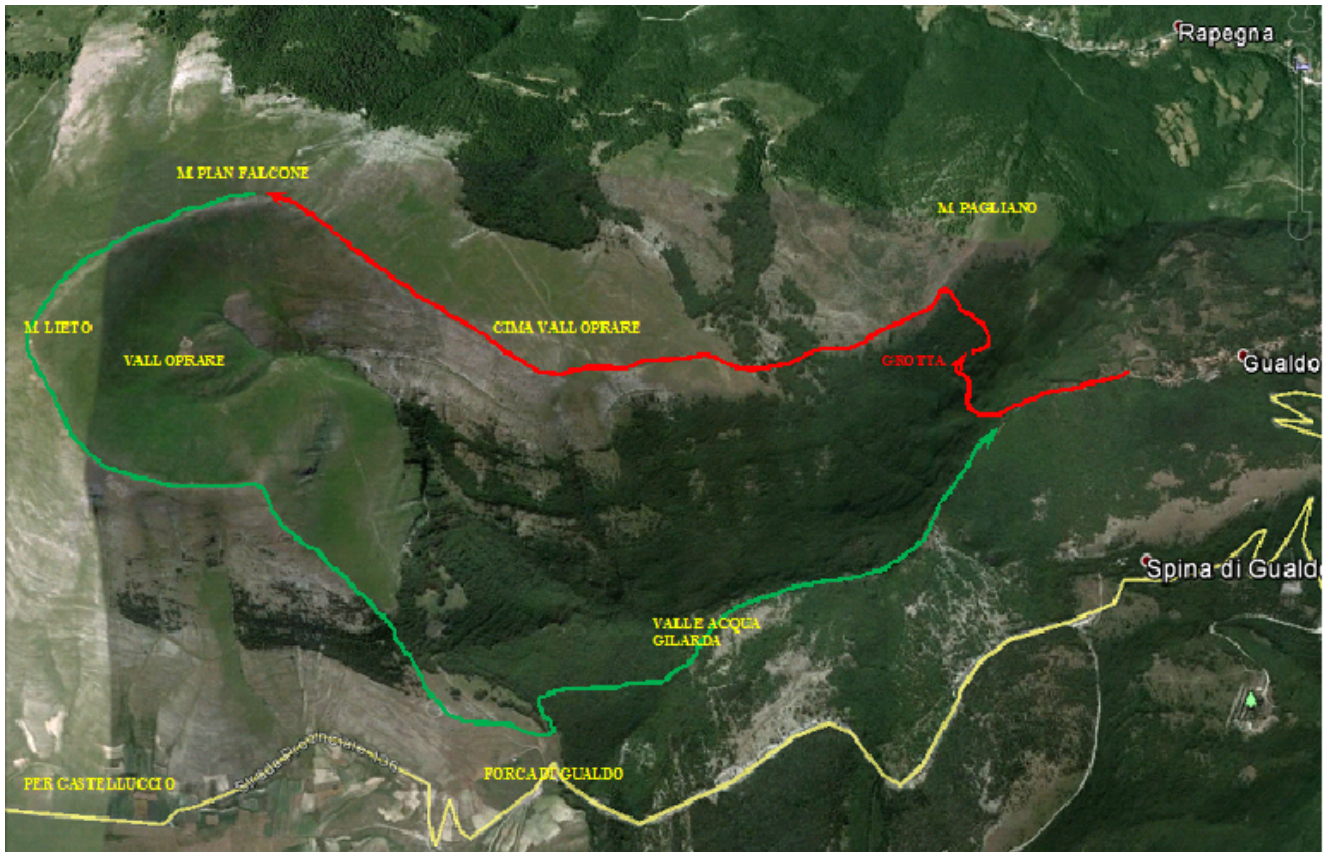
Pianta satellitare della valle dell'Acqua Gilarda con i percorsi per raggiungere la Bocca Larga e Monte Pagliano – Cima di Valloprare.