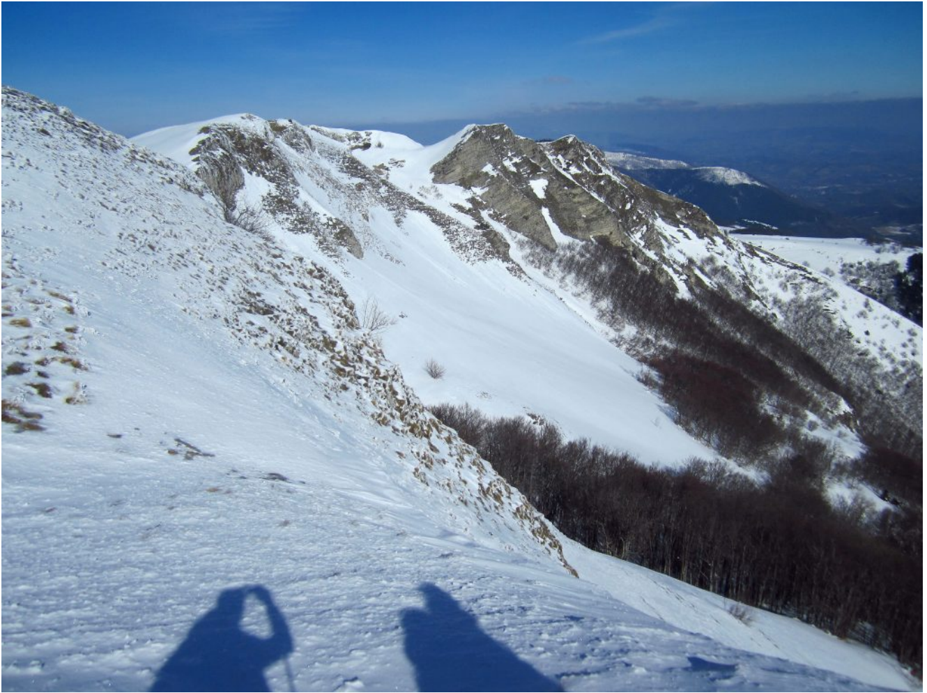
5- Il versante Est di Pizzo di Chioggia e Monte Montioli, nel bosco sullo sfondo a ridosso delle pareti è presente una rigogliosa stazione di Iris marsica a fioritura primaverile.