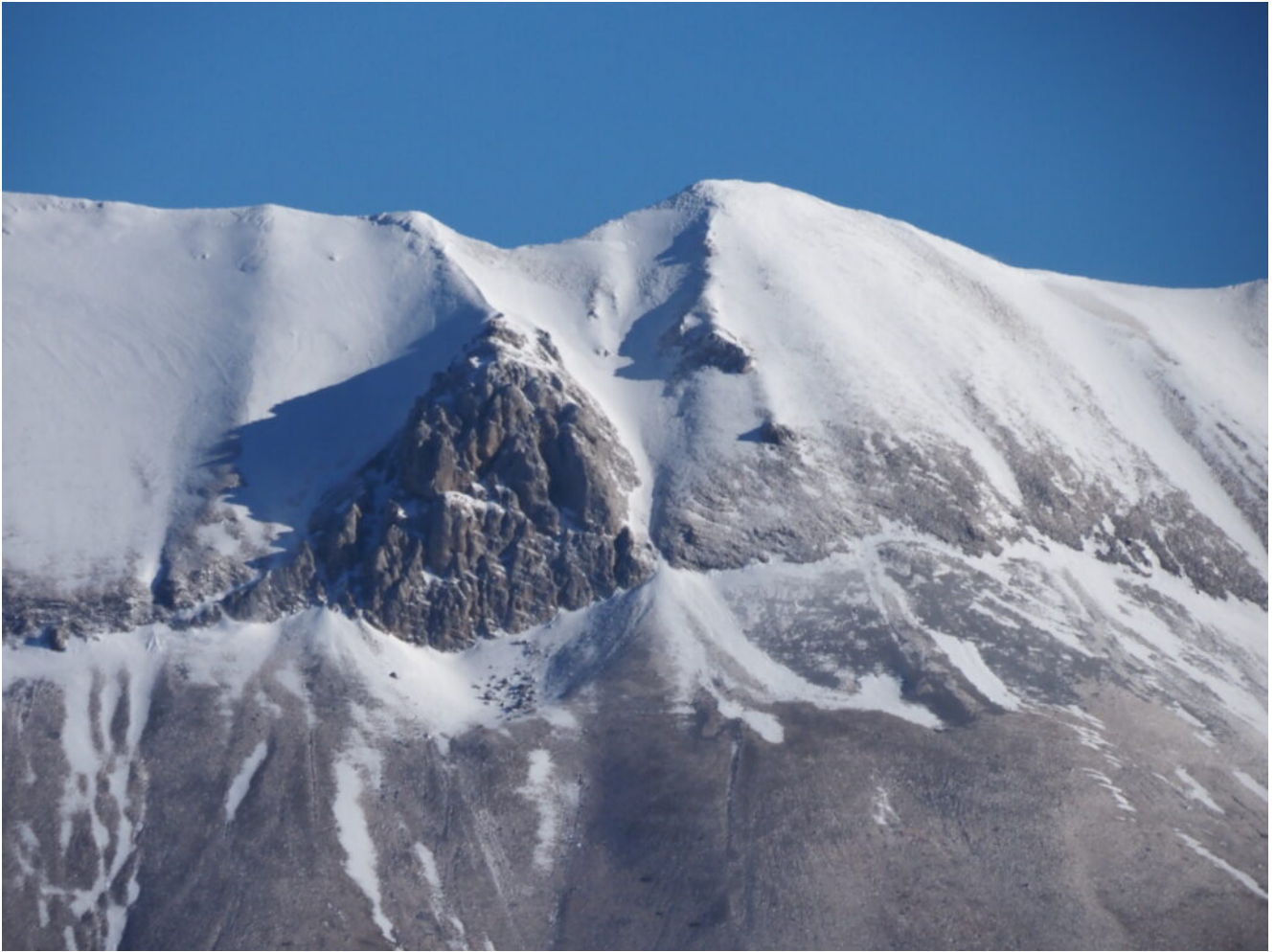
17- Lo Scoglio dell'Aquila visto dal Monte Castellaccio.