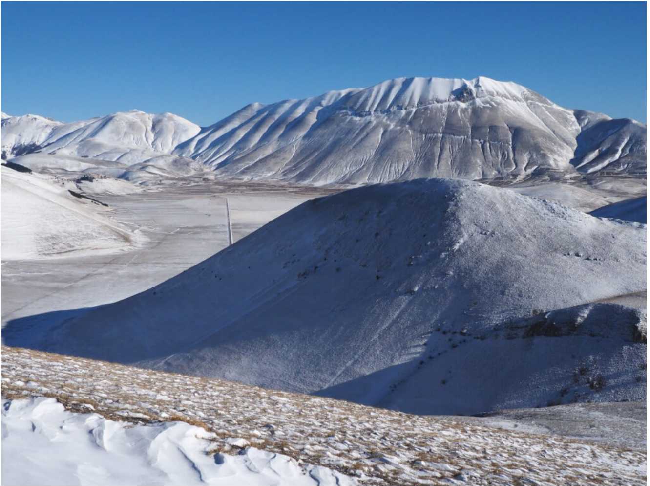
16- Il Monte Castello in primo piano.