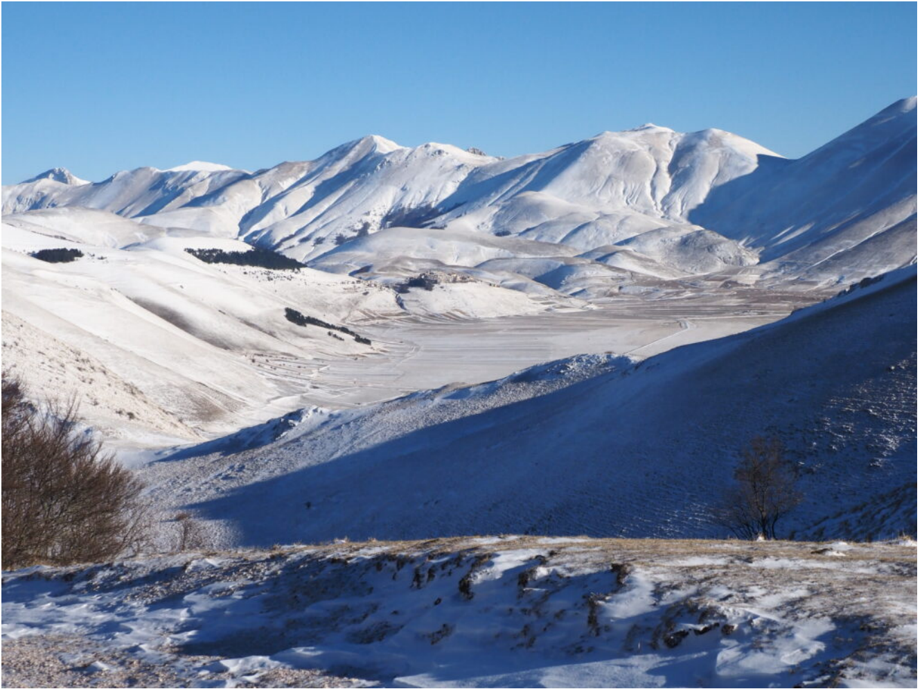
3- Veduta del Piano Grande, Castelluccio e i Monti Sibillini dal Pizzo Berro a sinistra fino al M. Argentella a destra.