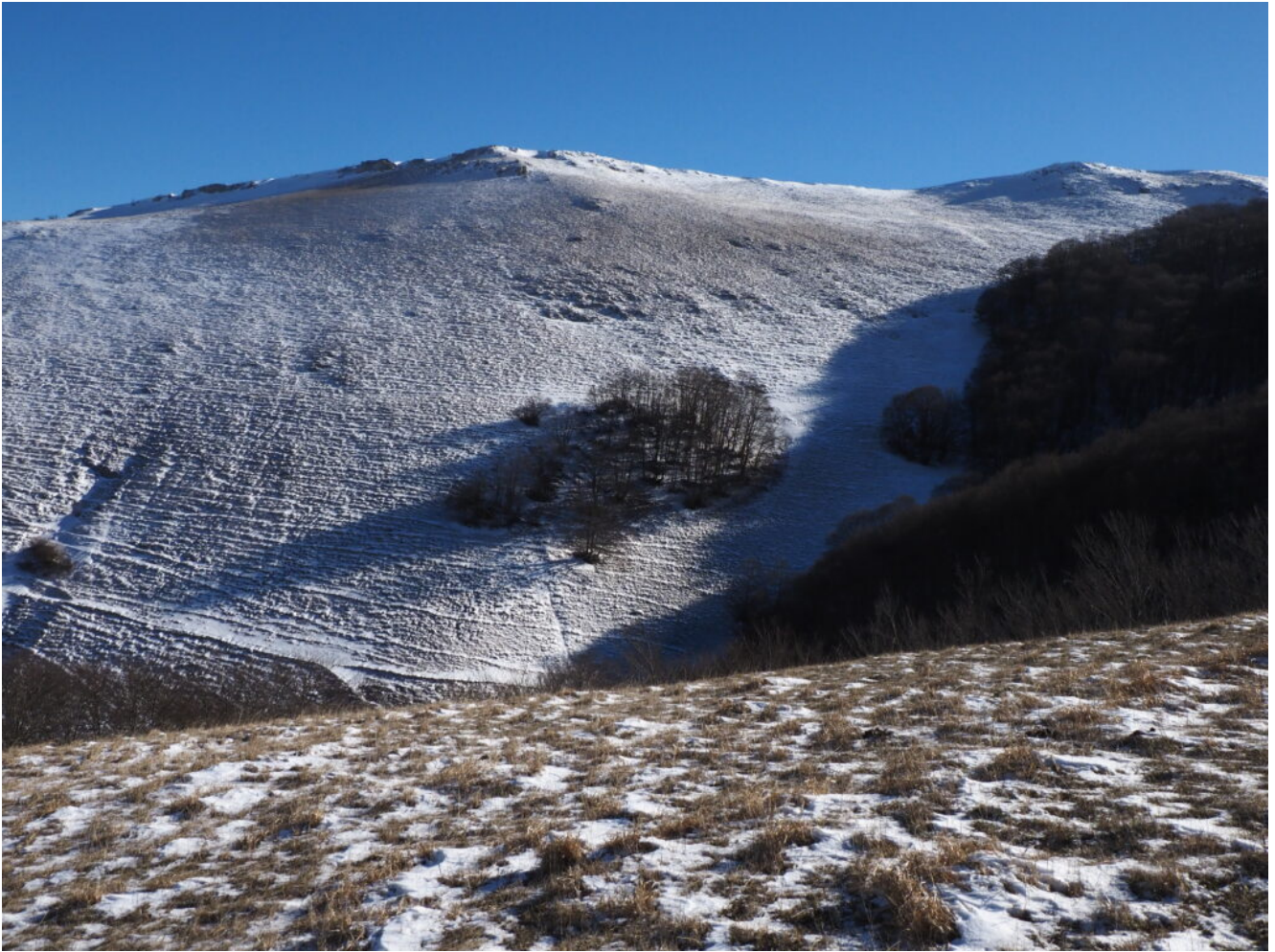
26- Il versante Nord del Monte Castellaccio.