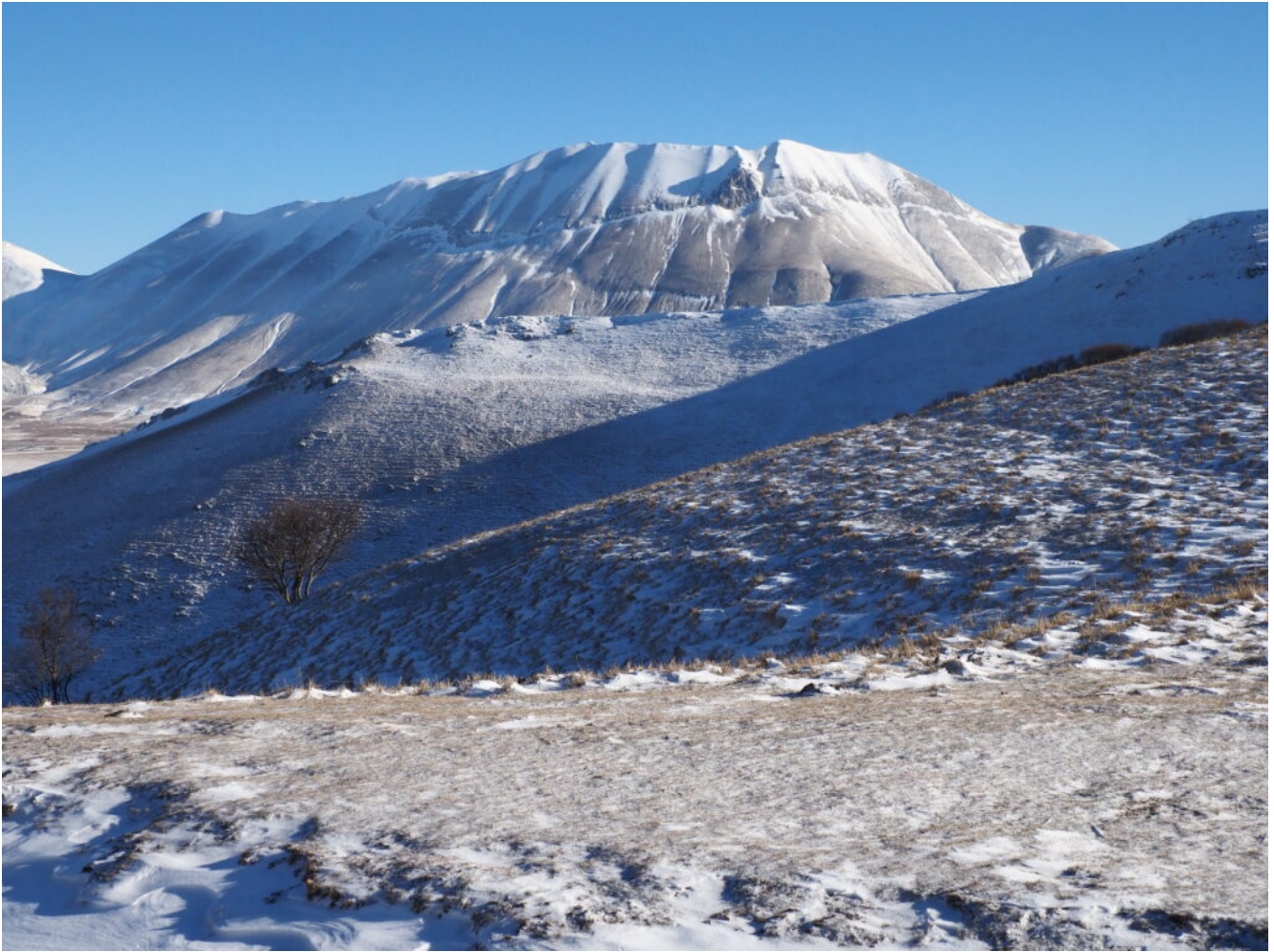
4- E la Cima del Redentore che svetta dietro alla cresta M.Castello-M. Castellaccio