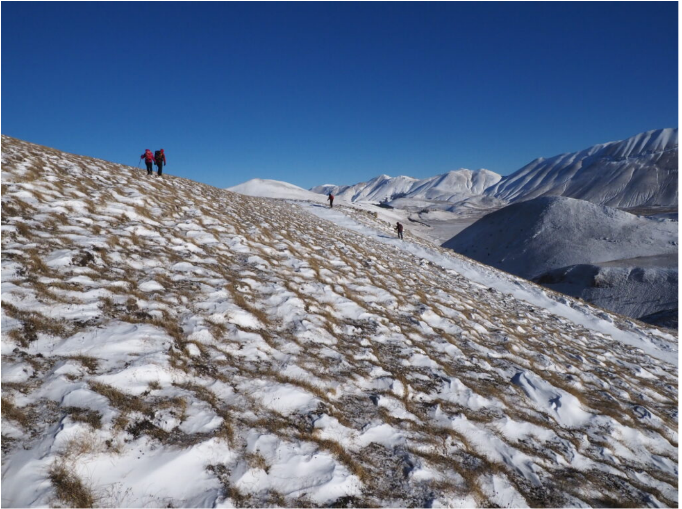
13- Discesa da Monte Callarelle.