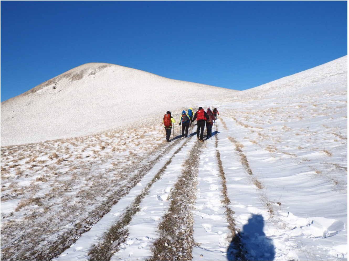
1- Il tratturo che dal Valico di Castelluccio conduce verso il Monte Ventosola a sinistra.