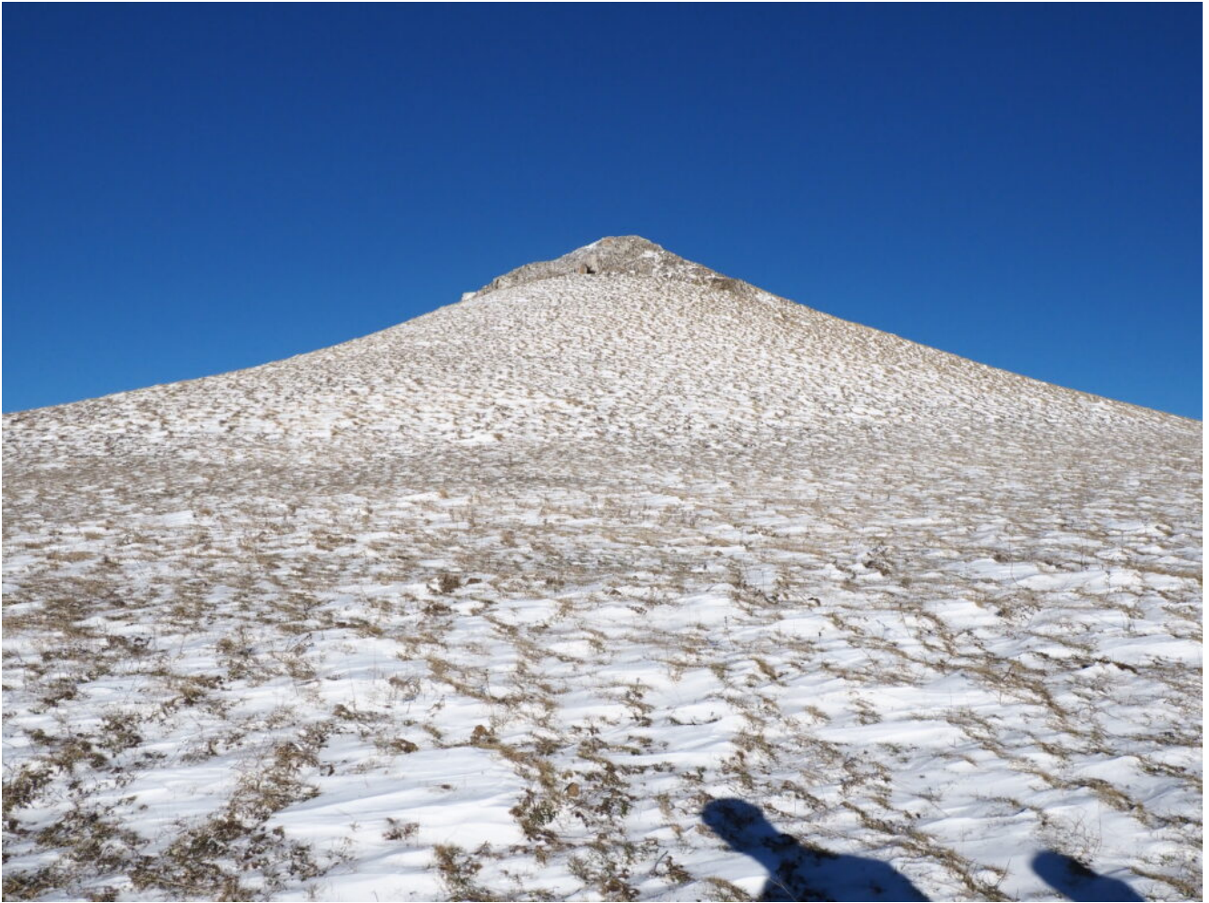
6- Il Monte Callarelle con la Grotta Lalla che già si vede poco sotto alla cima.