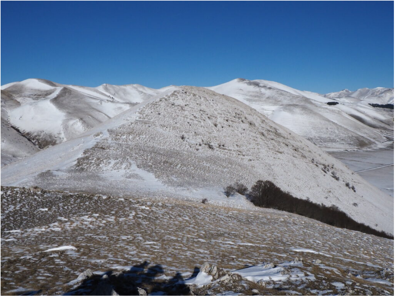
30- Il Monte Castello visto dal Monte Castellaccio.