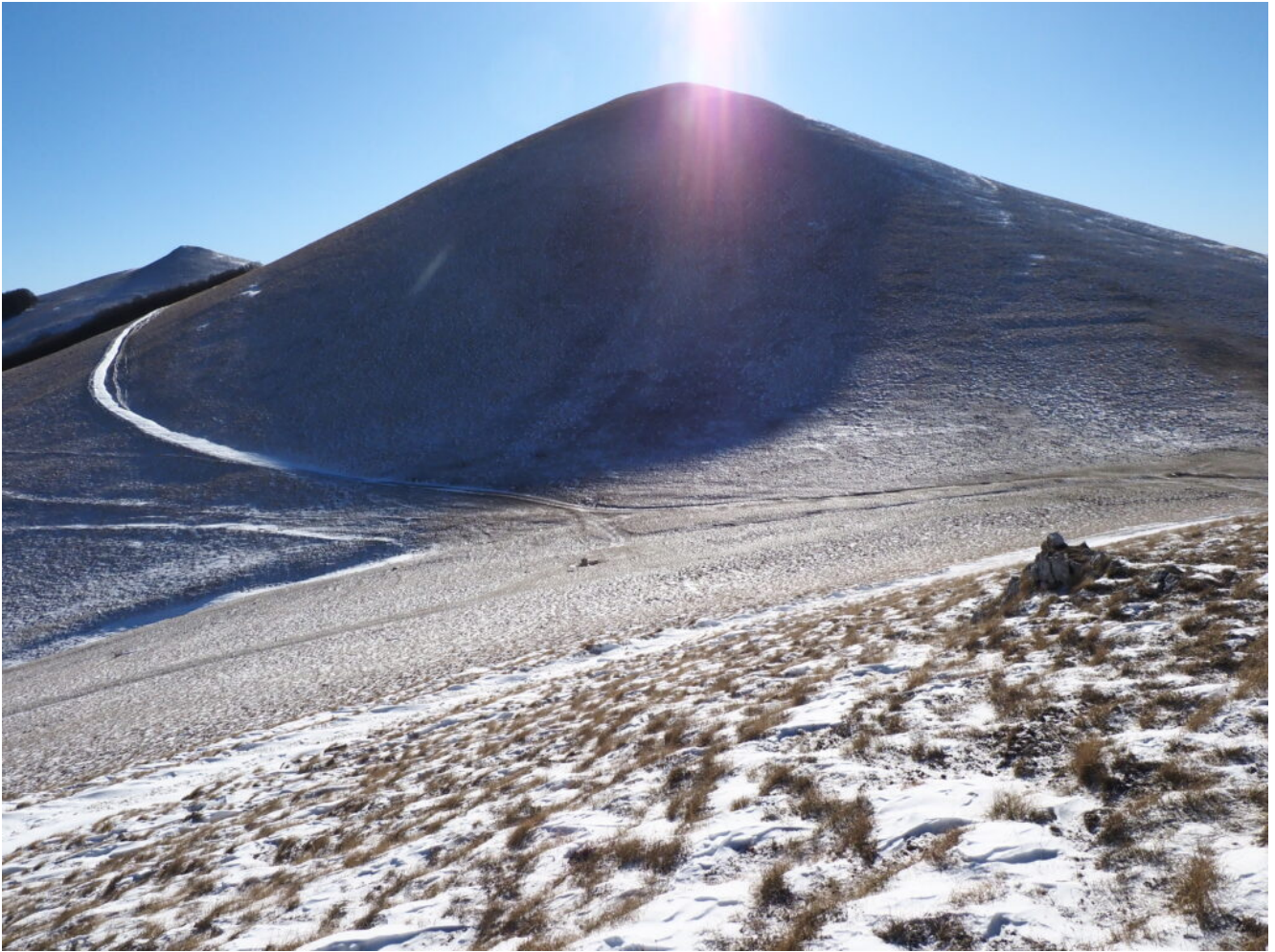
14- Il Monte Ventosola visto dal Monte Callarelle.