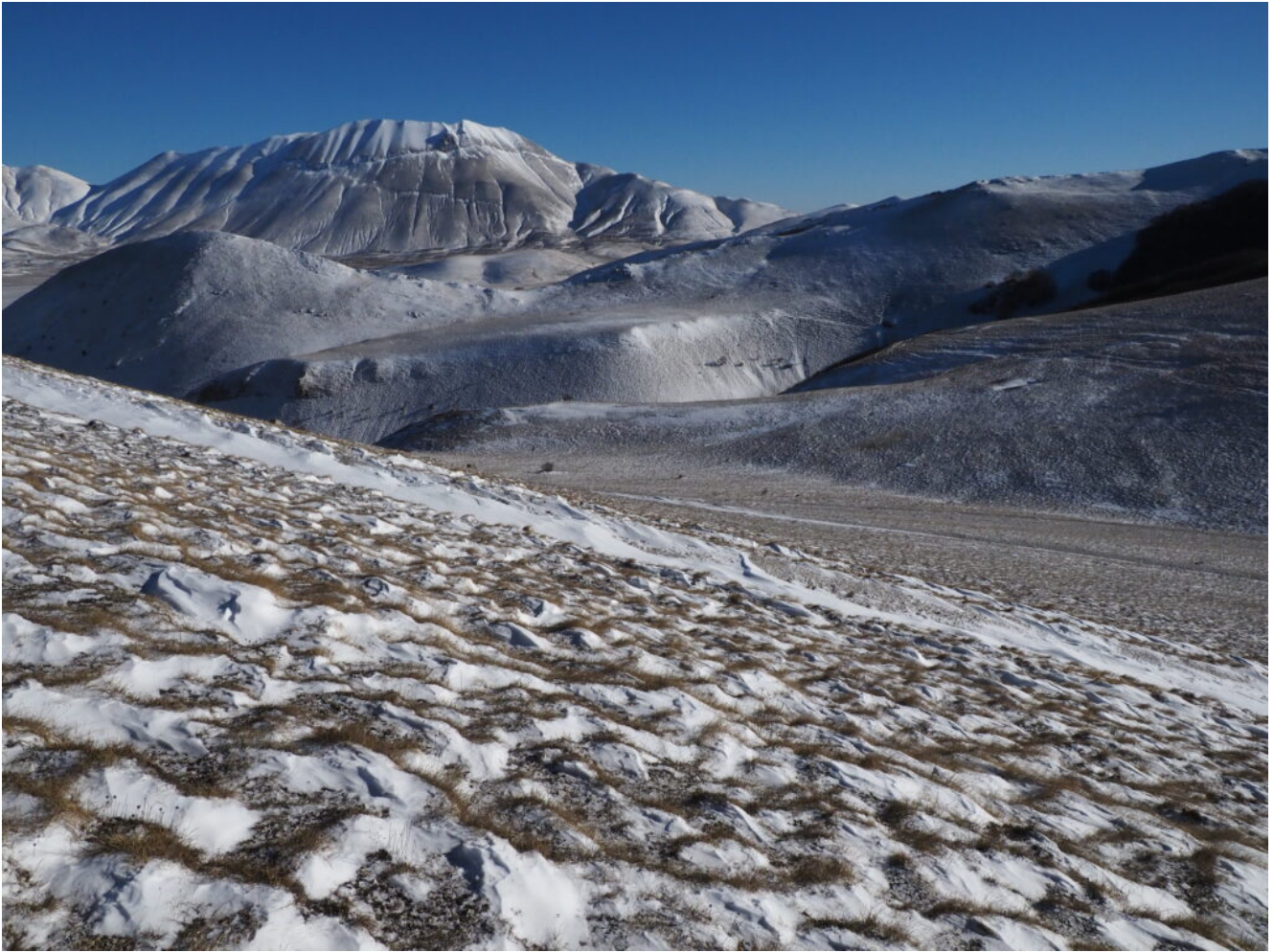
15- La valletta del versante Nord del Monte Castellaccio, più riparata dal vento.