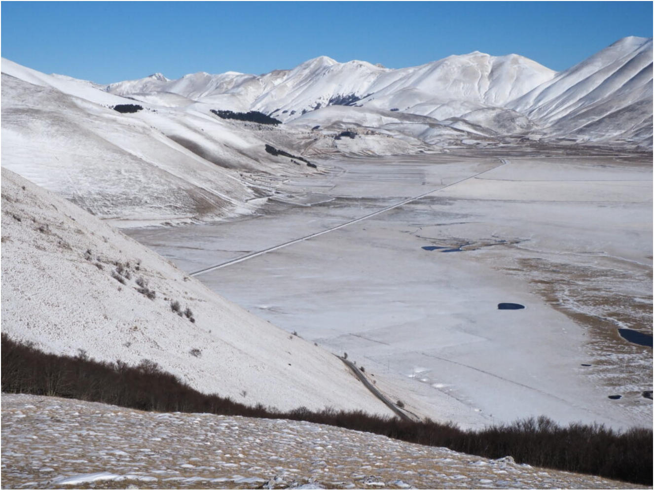
28- La catena dei Monti Sibillini visti dal Monte Castellaccio