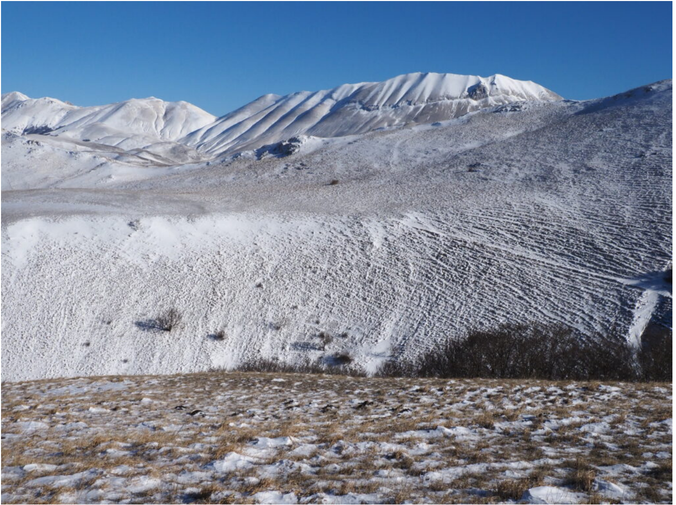
25- La cresta Nord che collega Monte Castello al Monte Castellaccio.