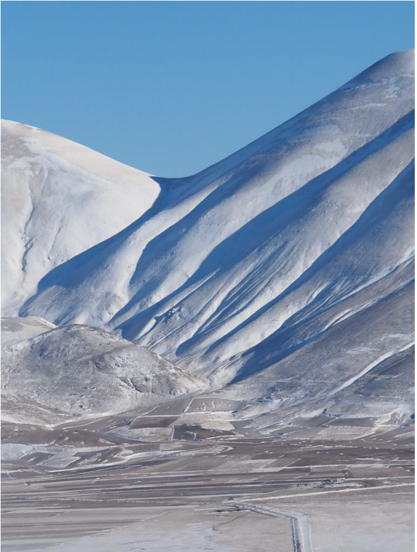
21- Luci ed ombre a Forca Viola .