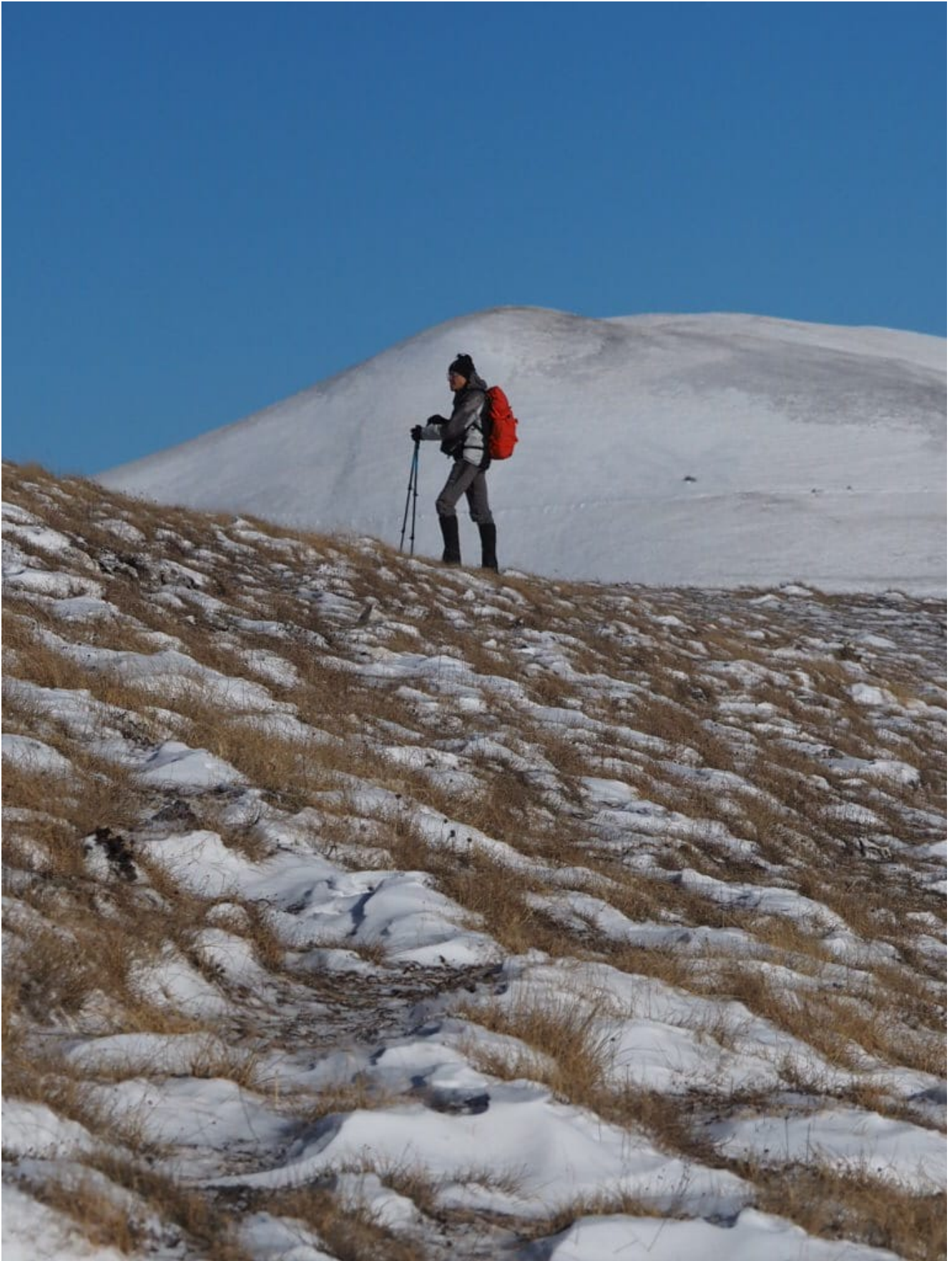
12- Proseguiamo verso il M. Vetica ma il vento è troppo forte, ripieghiamo verso il Monte Castellaccio.