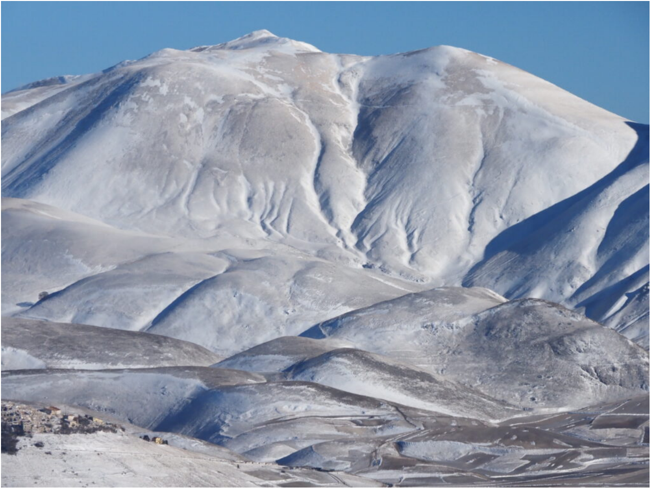
19- Zoom sul Monte Argentella con i canali gemelli.