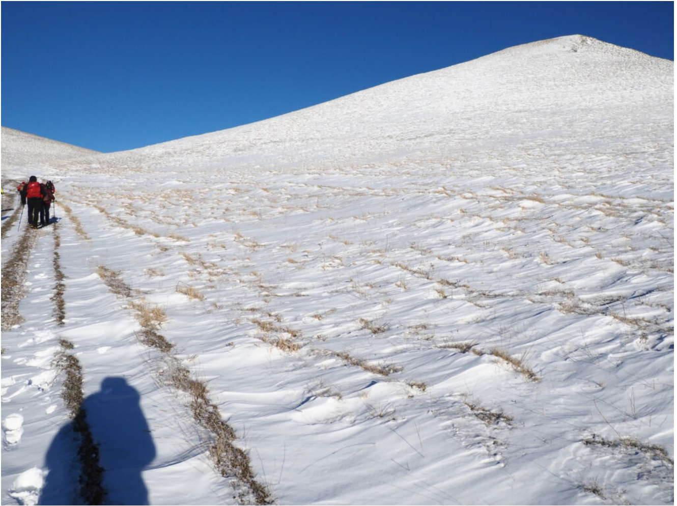
2- A destra invece si innalza il Monte Castellaccio.