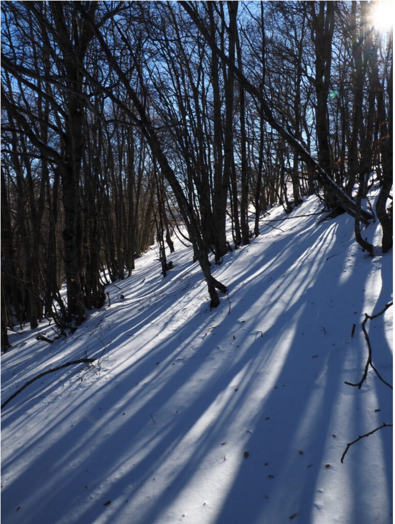
31- La faggeta del versante Nord.