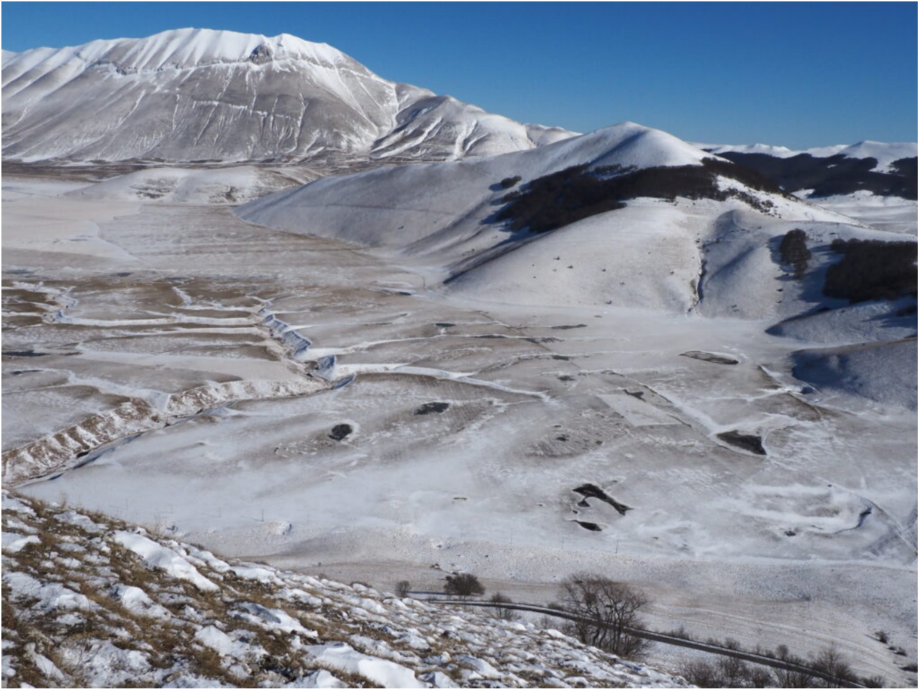
29- Veduta aerea del Fosso Mergani del Piano Grande.