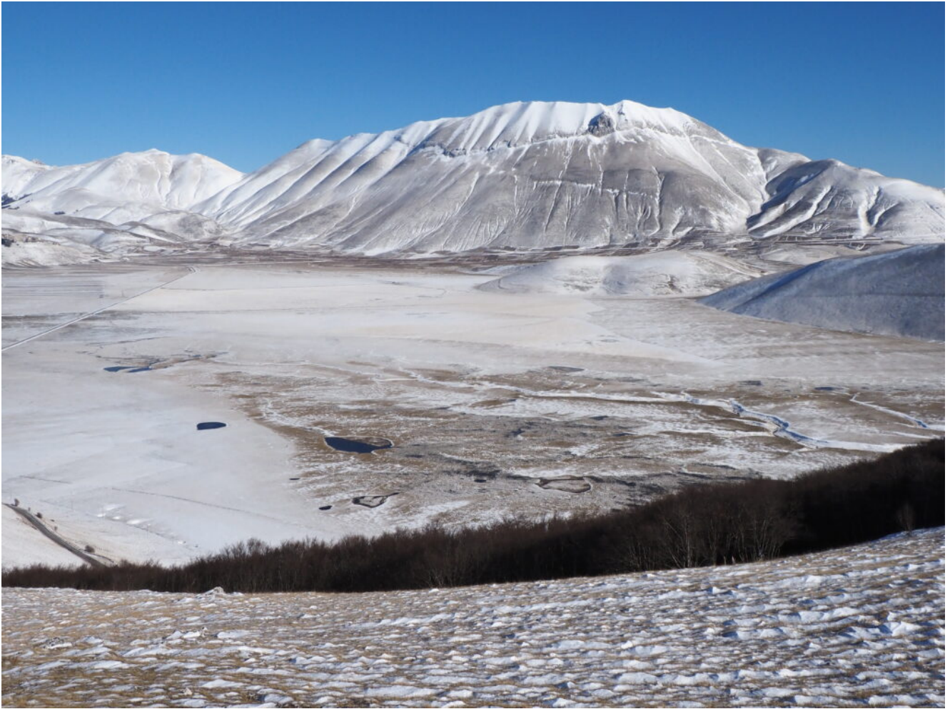
27- Il Piano Grande e la Cima del Redentore visti dal Monte Castellaccio.