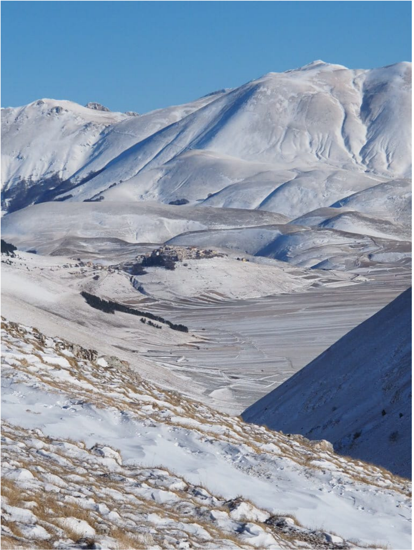
20- Castelluccio emerge dalla valle sottostante il Monte Castello.