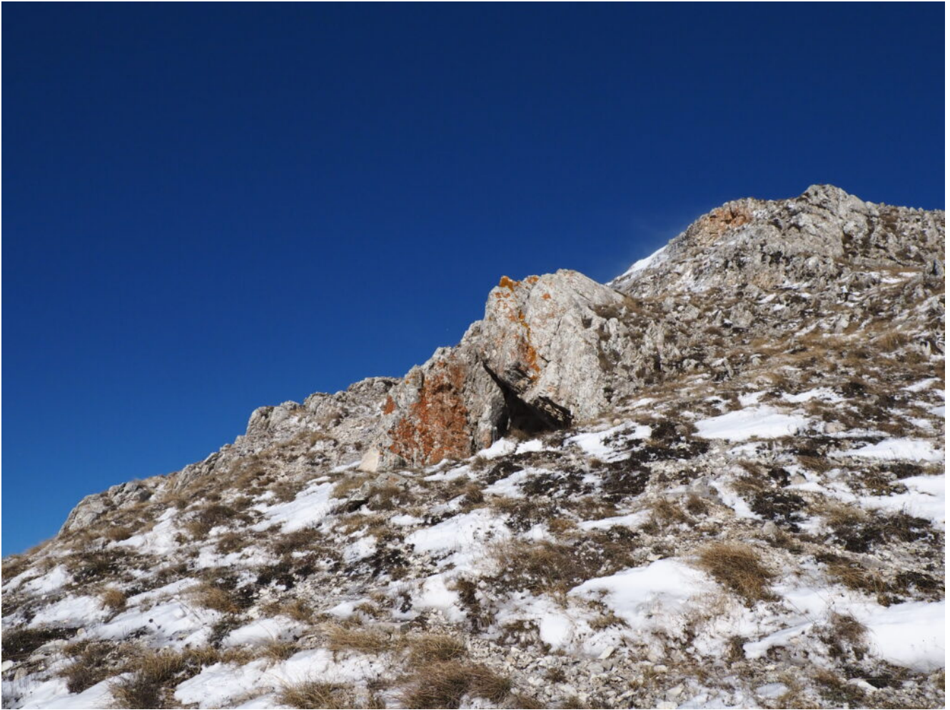
7 – 11 -La piccola Grotta Lalla