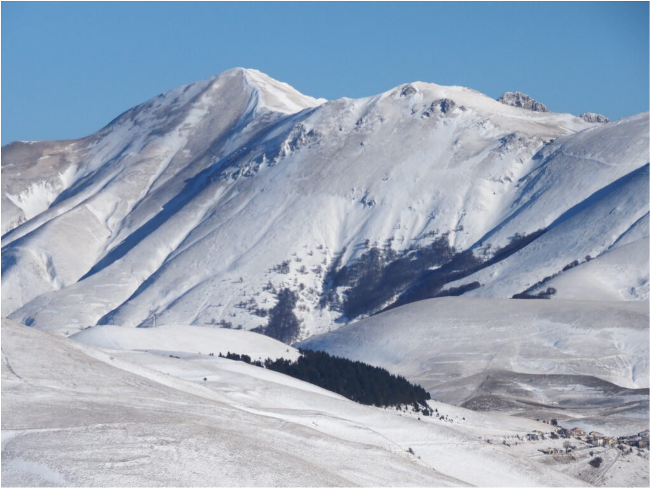
18- Zoom sul Monte Porche e Monte Palazzo Borghese.