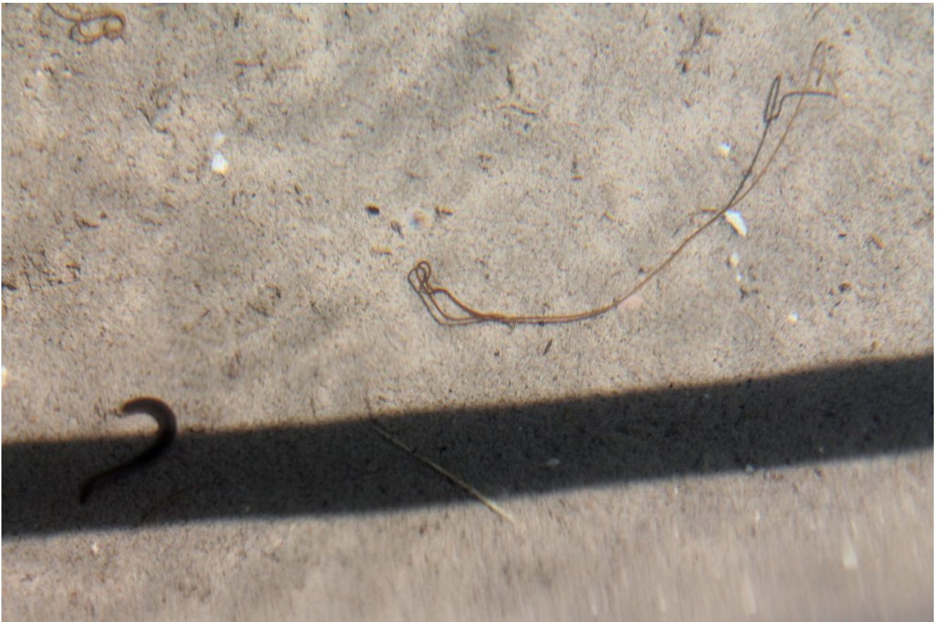
42- Verme filiforme e sanguisuga nella vasca di abbeveramento per le pecore alla Fonte Bassete