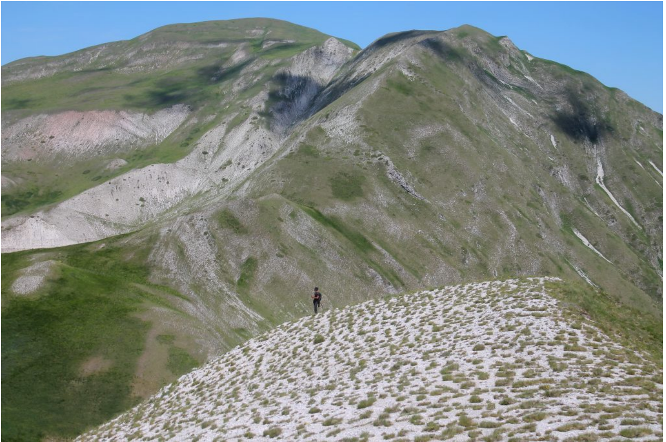
19- Il poggio erboso posto poco sopra il Rifugio del Fargno con il Monte Rotondo di fronte.