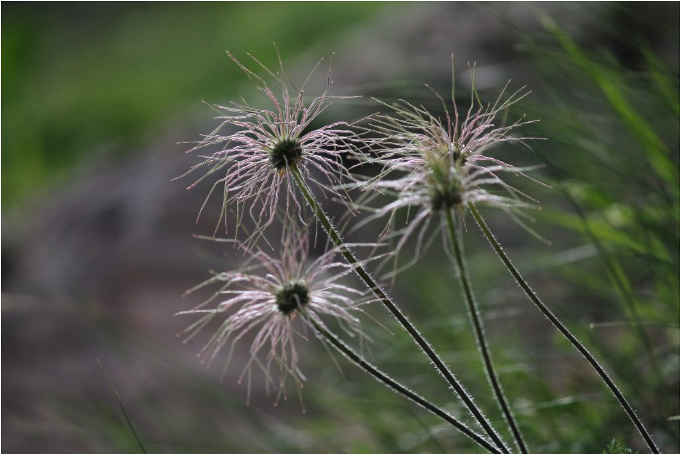
24- Frutti di Pulsatilla alpina subsp. millefoliata dai candidi fiori bianchi primaverili.