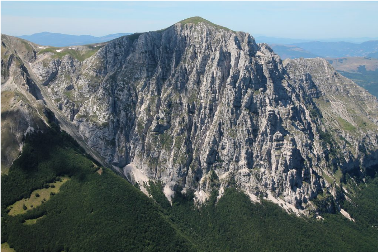
17- Il Monte Bove Nord visto dal Pizzo Tre Vescovi.