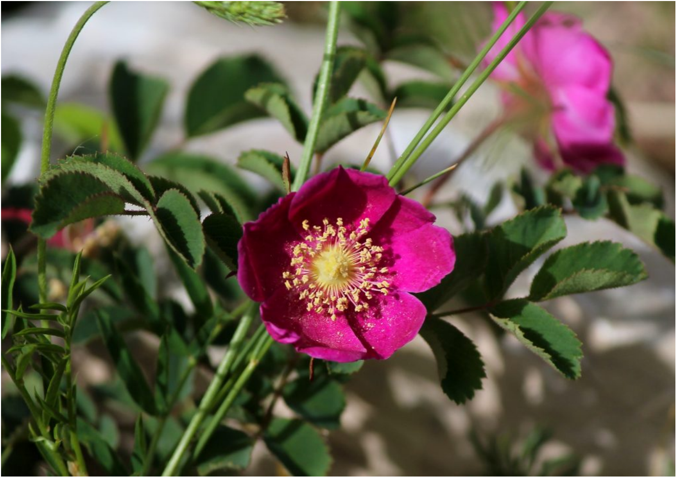
26- Rosa pendulina .