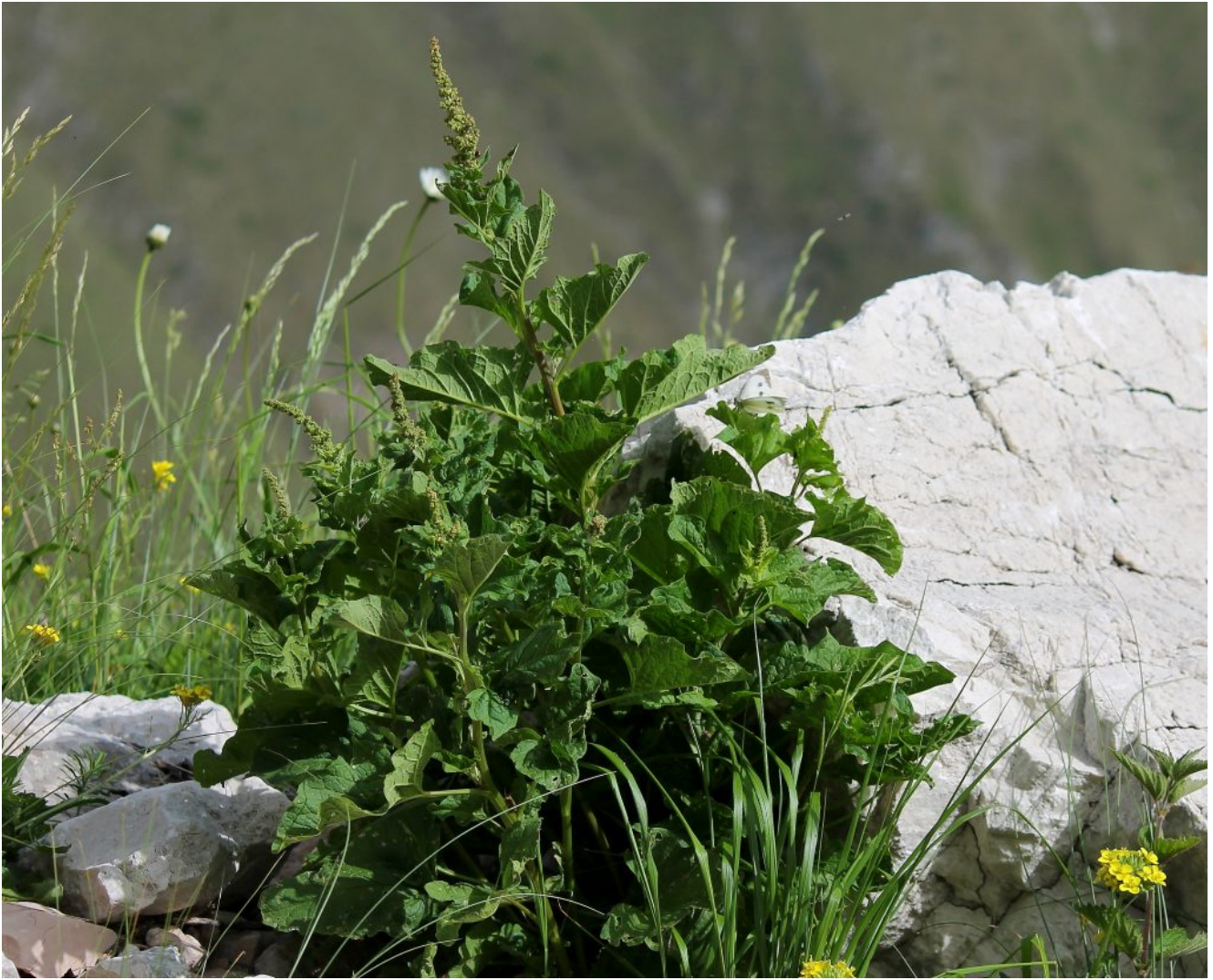
23- Chenopodium bonus-henricus sul bordo della strada, in altre parole lo spinacio selvatico detto anche Olabri, Orapi o Olibri, ottima pianta commestibile.