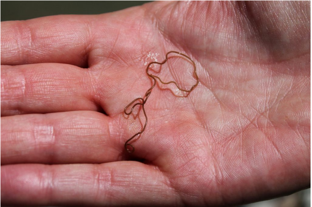
41 – Verme filiforme della classe Nematomorpha alla Fonte Bassete