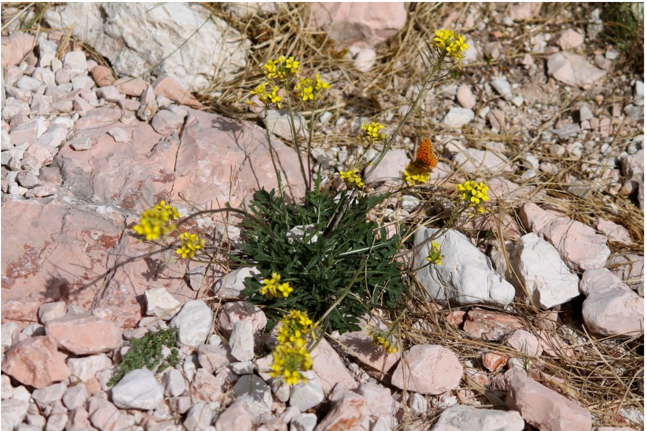
20- Brassica gravinae , endemismo dell'Appennino, vegeta direttamente sulla carreggiata della strada del Fargno