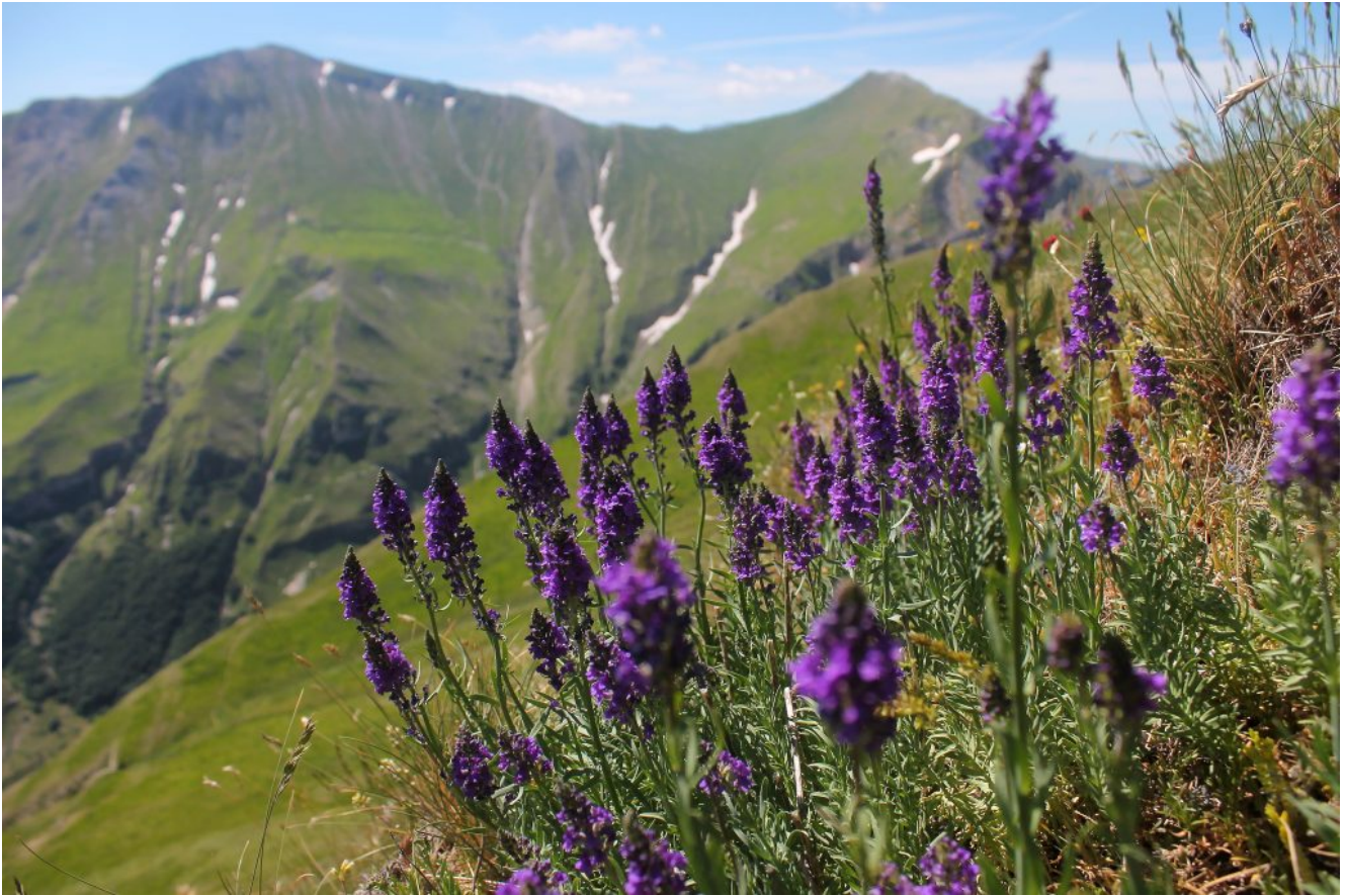
10- Linaria purpurea colora la cima del Monte Acuto.