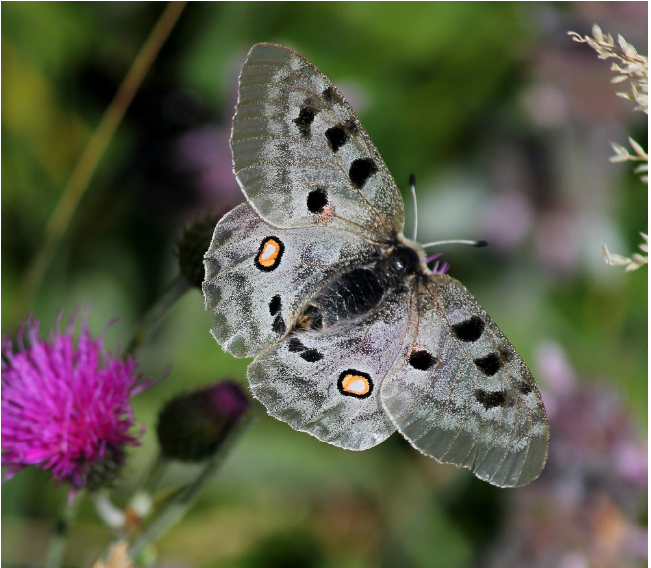
38- 39 – 40- Parnassius apollo sui cardi nel versante Est del Pizzo Tre Vescovi