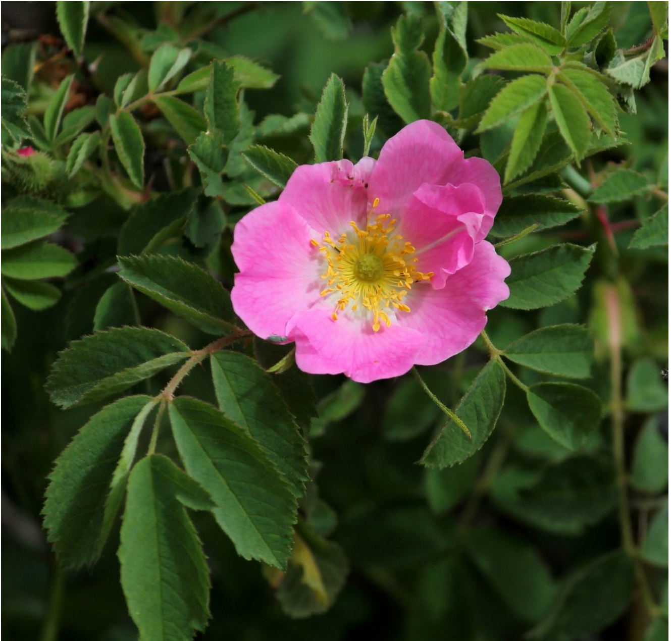
27- Rosa canina spp.