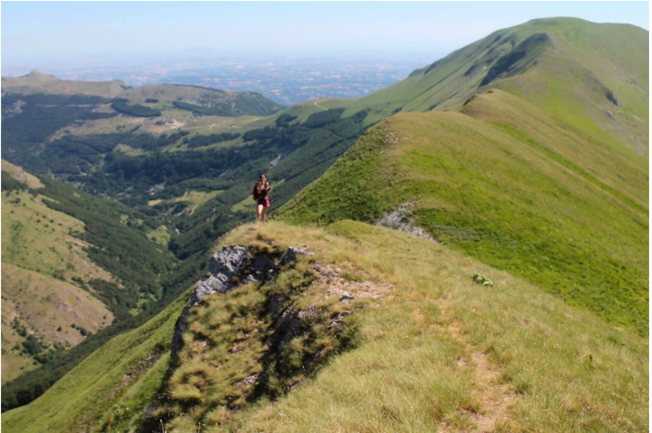
4- La aerea cresta già percorsa che sale da Cima Bassete, sullo sfondo il Monte Castel Manardo.