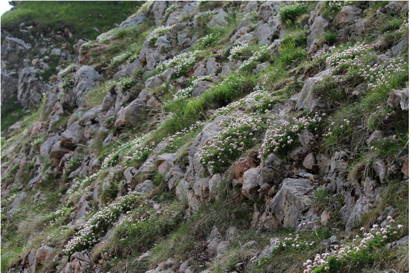
21- Le pareti della strada tappezzate di Trifolium thalii in piena fioritura.