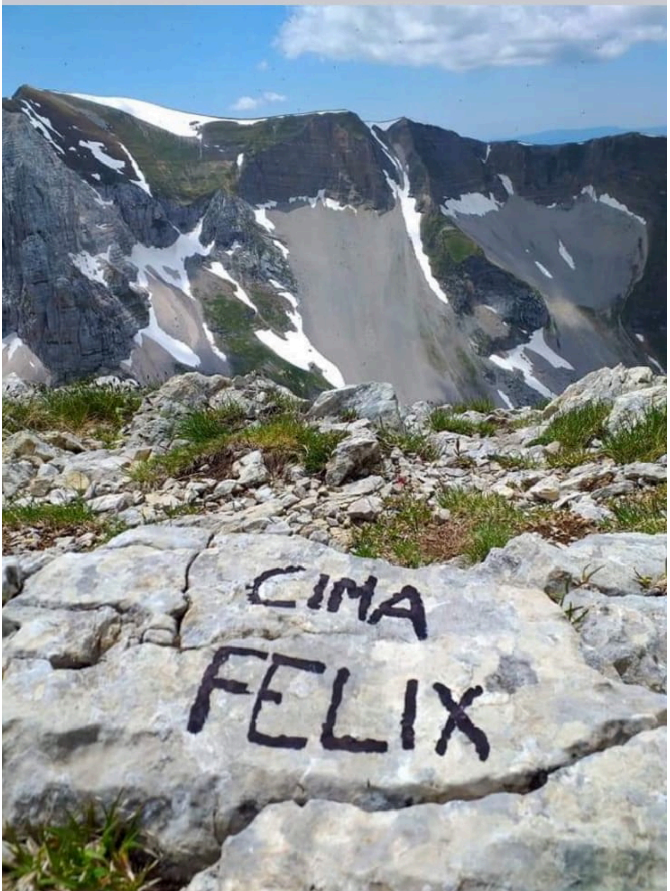
16- L'inesistente Cima Felix segnata tra il Monte Vettore ed il Monte Torrone riportata invece sulle carte come Antecima Nord del M.Vettore.