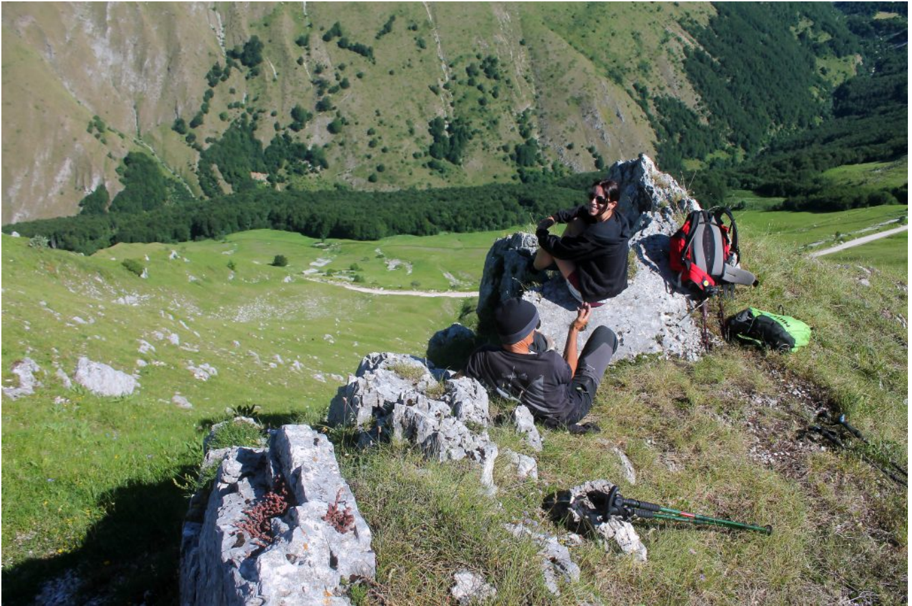
2- Sosta sulla cima della zona denominata "Acquario", a picco sulla sottostante strada del Fargno.