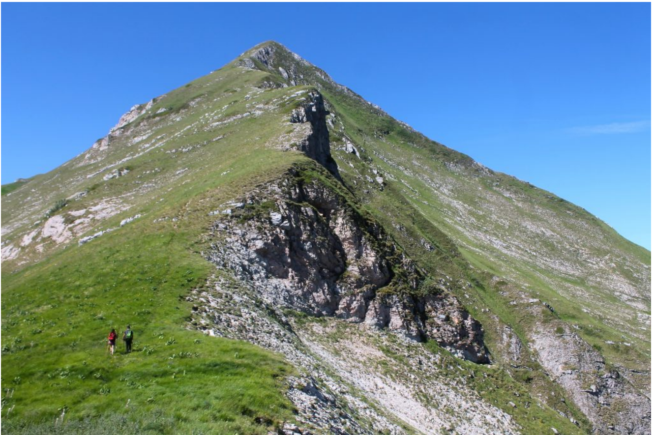
3- La cresta Est del Monte Acuto.