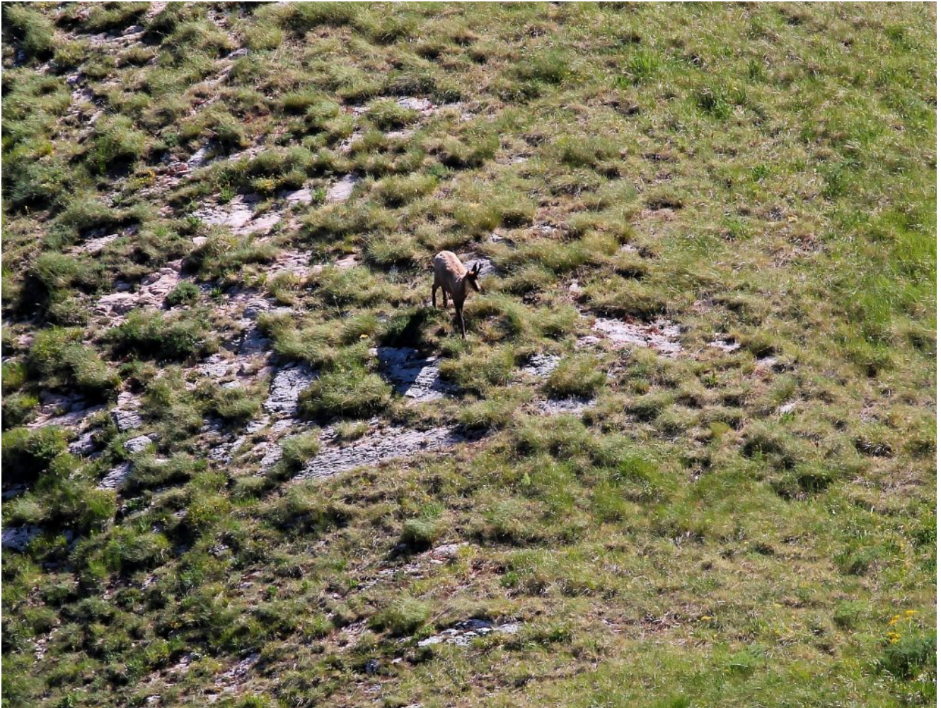
5- Un Camoscio solitario ci ha seguito per tutta la cresta fino alla base del Monte Acuto.