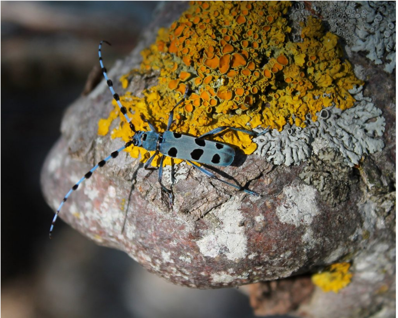
37- Rosalia alpina su un vecchio tronco di Faggio