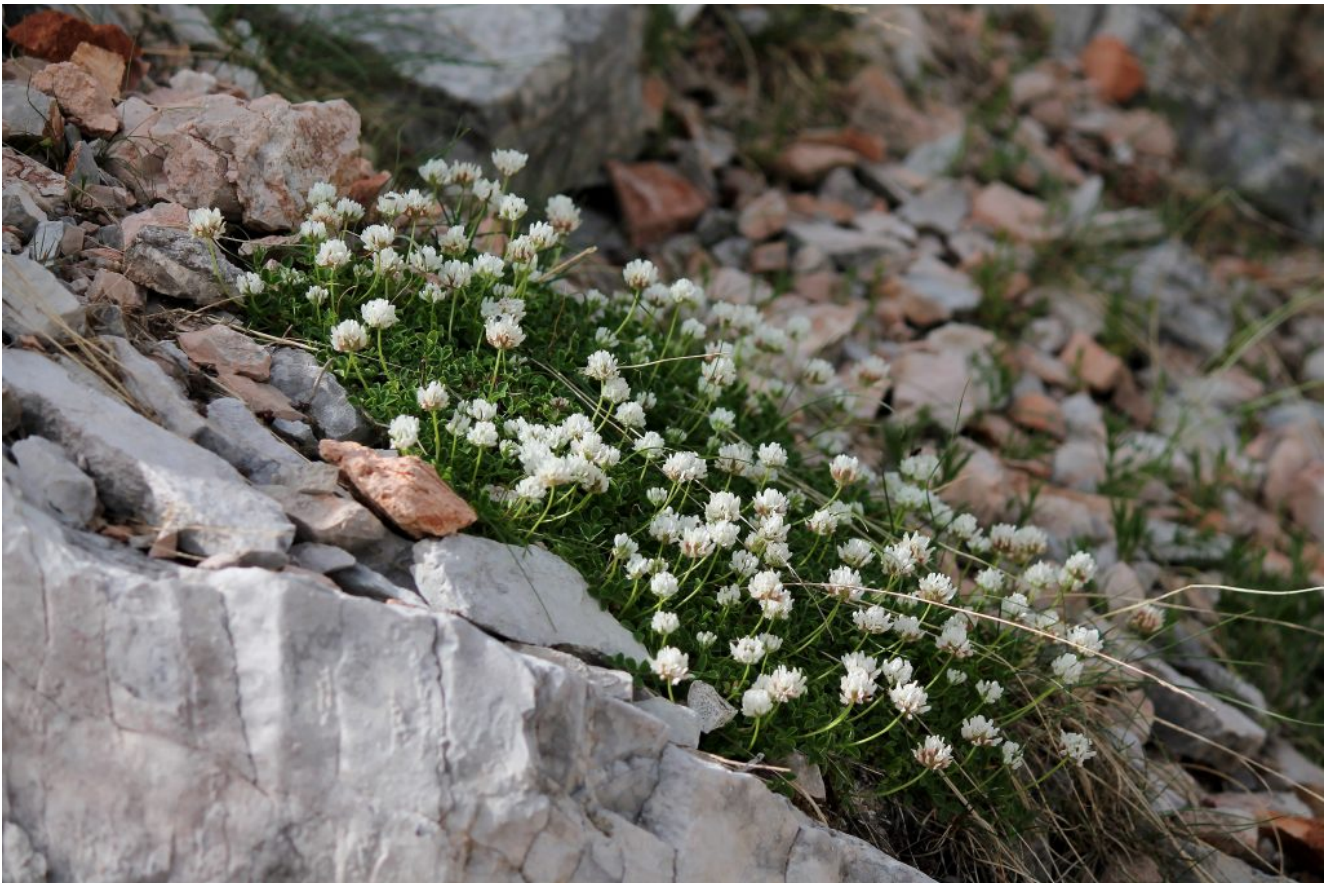
22- Trifolium thalii