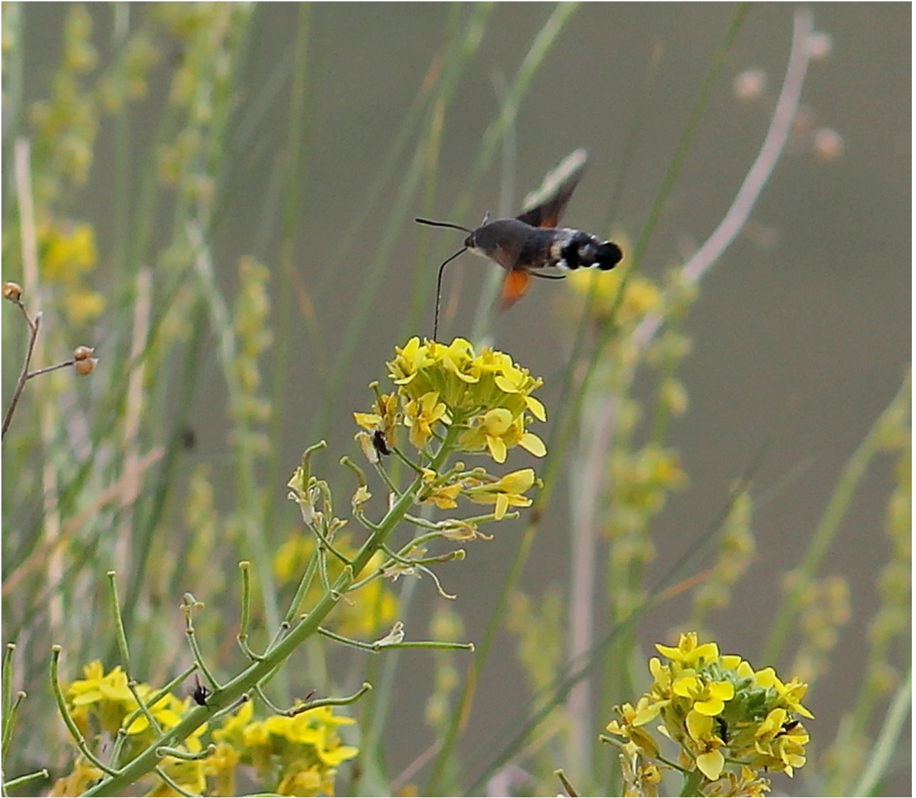
25- Una Sfinge colibri ( Macroglossum stellatarum ) si ciba in volo con la sua lunga spiritromba dai fiori della Brassica gravinae .