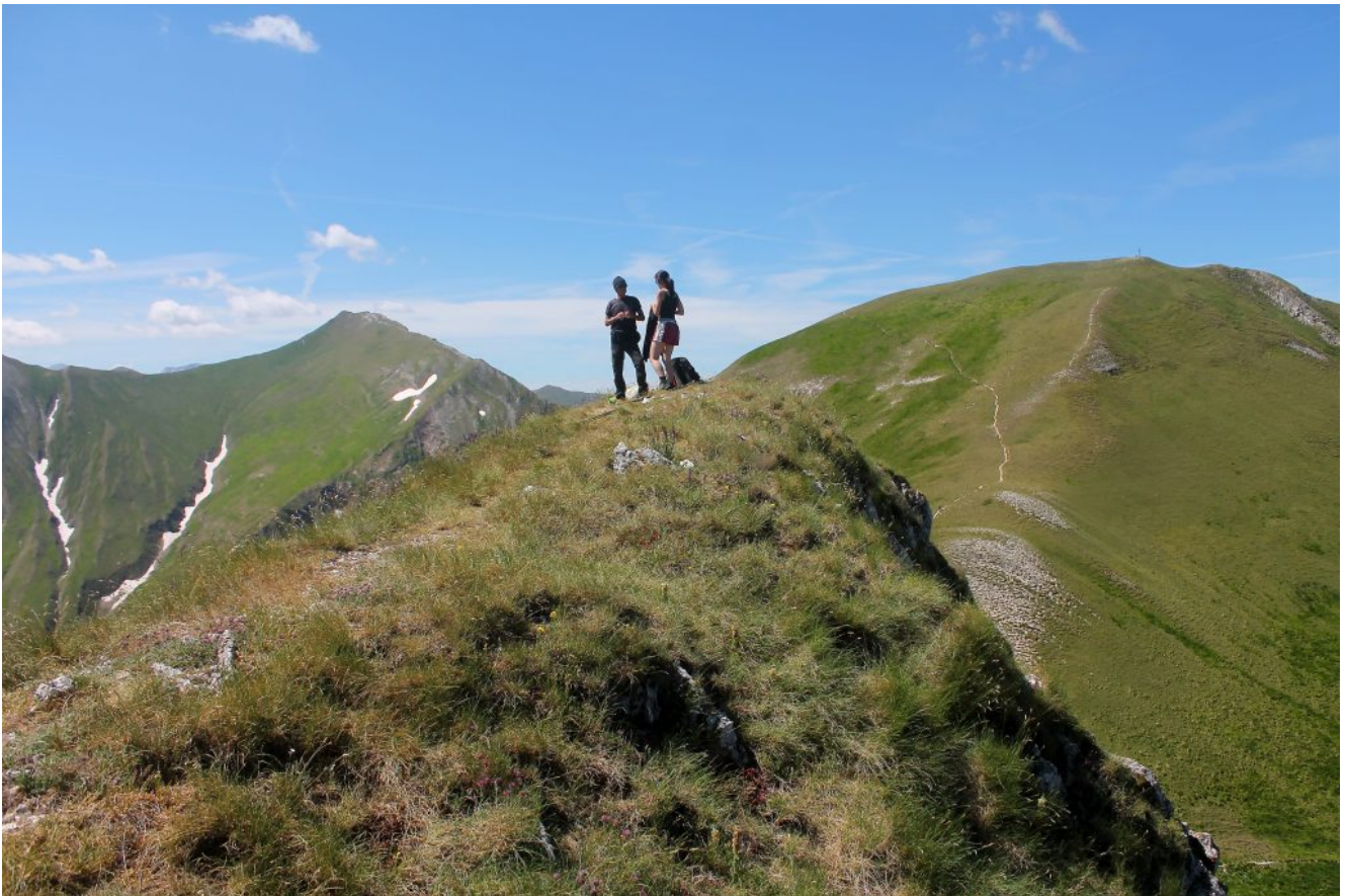
11- In Cima alla strettissima cima del Monte Acuto, a destra il Pizzo Tre Vescovi, a destra il Pizzo Berro.