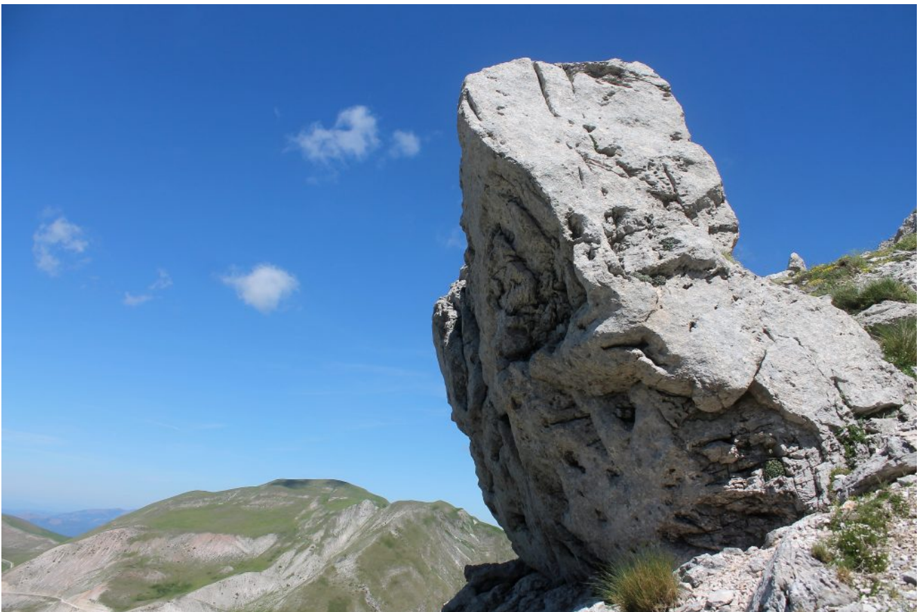
18- Il curioso torrione di roccia che caratterizza la ripida, ma per fortuna poco conosciuta, cresta Ovest del Pizzo Tre Vescovi da cui siamo scesi, sullo sfondo il Monte Rotondo.