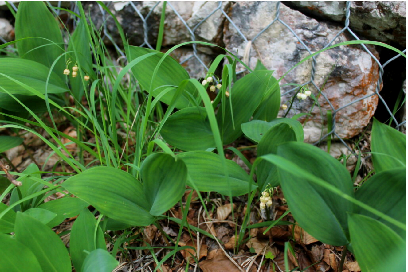
19- La rara Convallaria majalis (Mughetto).