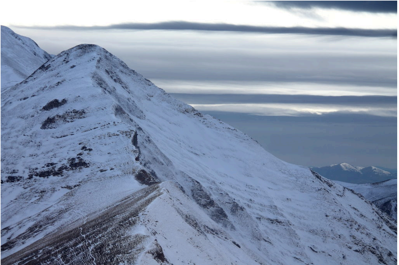
10- Il Monte Acuto con le nuvole di maltempo.