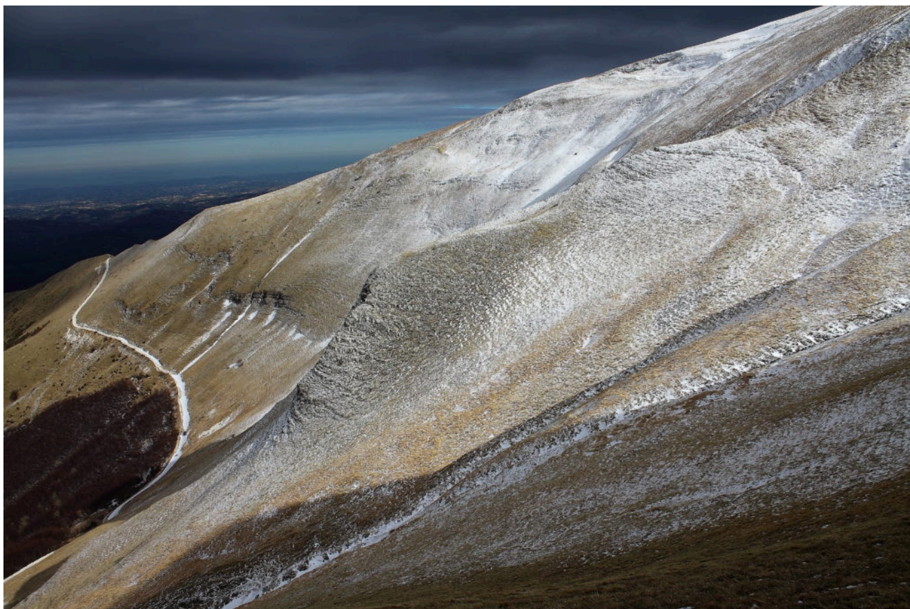
1- Il versante Nord del Monte Castel Manardo con la strada per

Di seguito le immagini della ascensione.