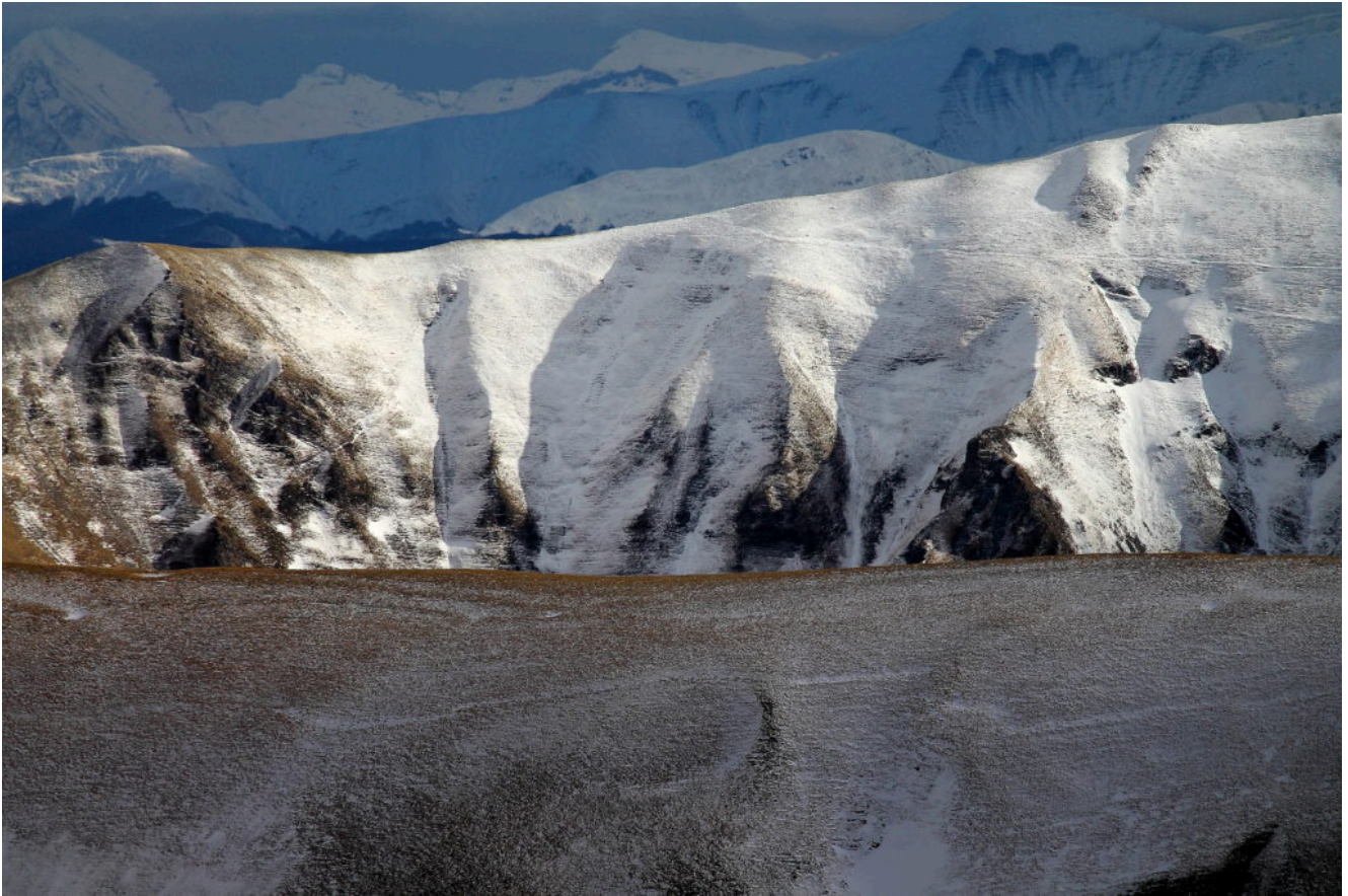
18- Successione di creste dal Pizzo Regina, Monte Zampa (con sole), Monte Banditello, Monti della Laga e, in fondo, Gruppo del Gran Sasso.