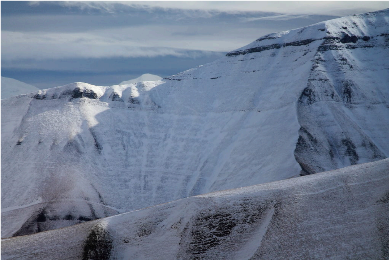
12- 13 Il versante Nord del Monte Sibilla emerge dalle pendici del Pizzo Regina.