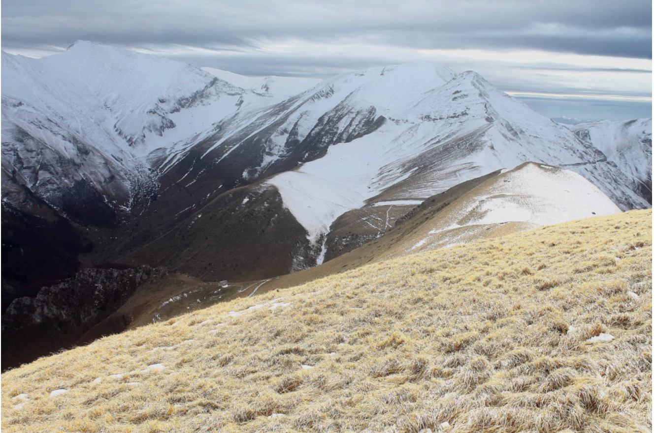
6- Da destra il M. Acuto, Pizzo Tre Vescovi e Pizzo Berro.

Parco, che rappresenta nel migliore dei modi la sua situazione.