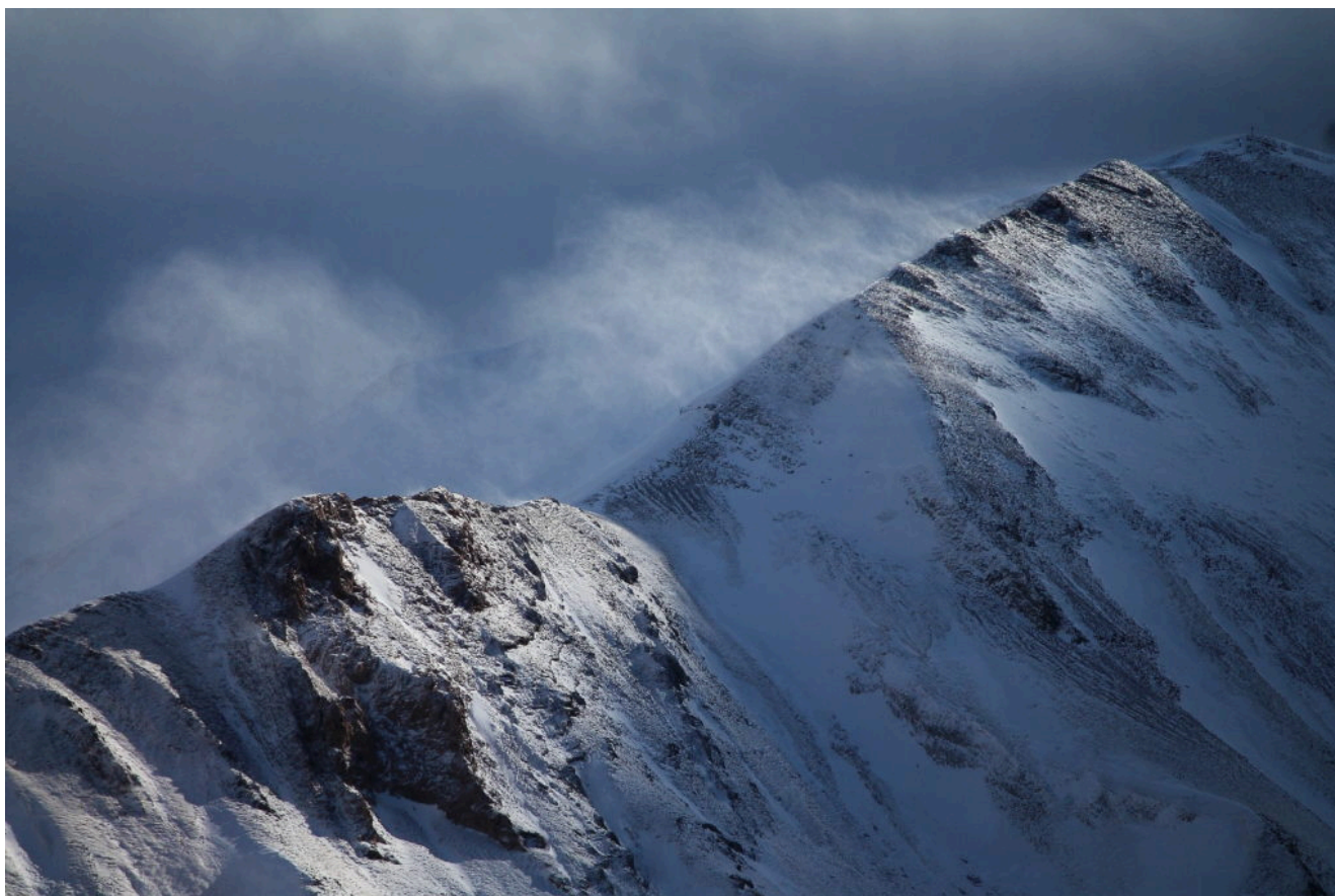
15 – Dopo 15 minuti dalla foto n.14