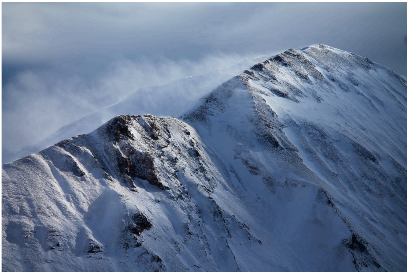
14 – Il vento aumenta sulla cima di Pizzo Regina.