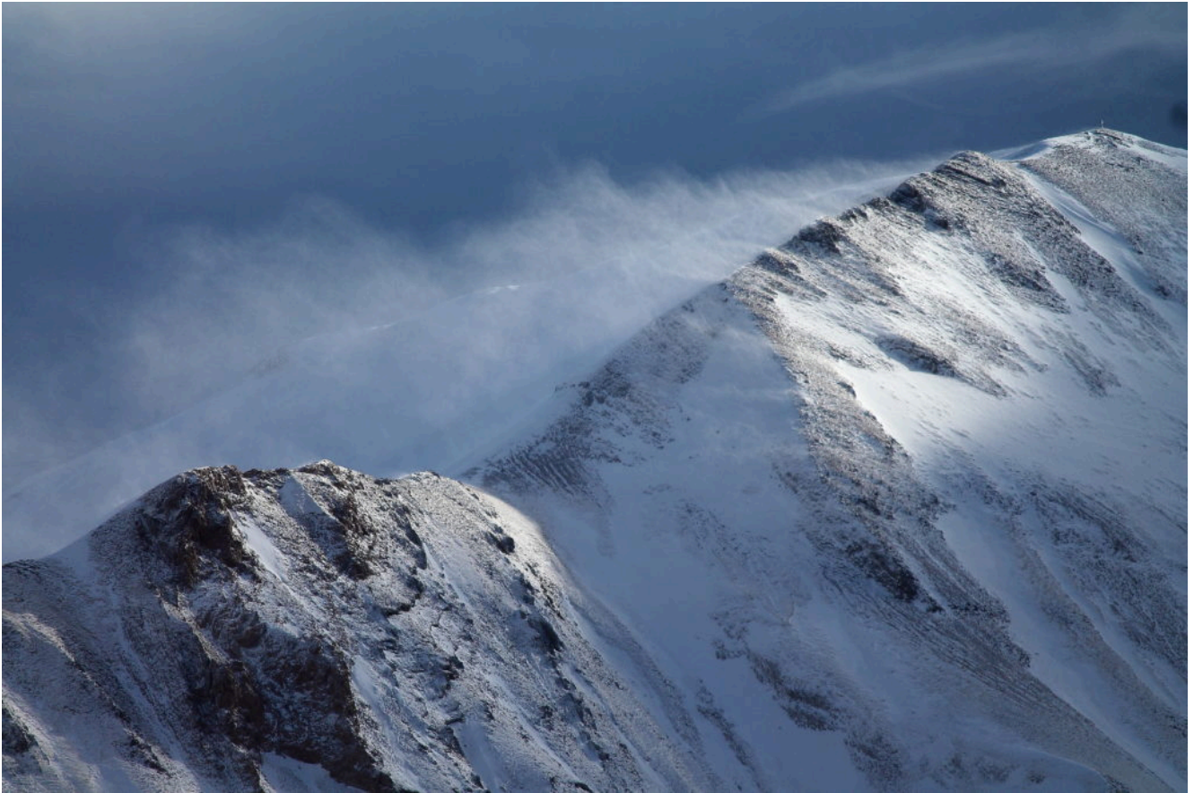
16 – 17 Dopo altri 15 minuti della foto n.15