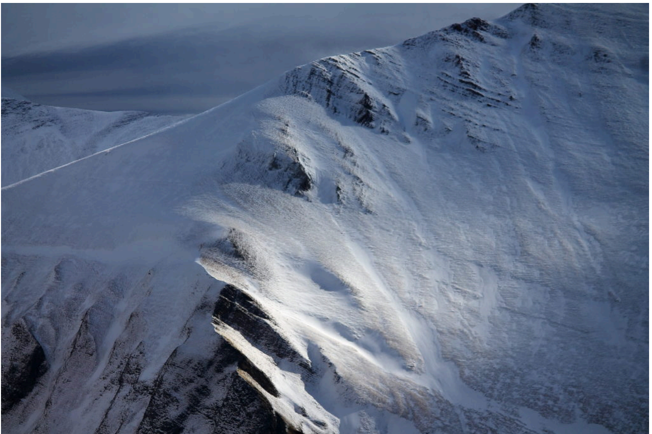
11-Le pendici superiori del Pizzo Regina con ancora una striscia di sole.