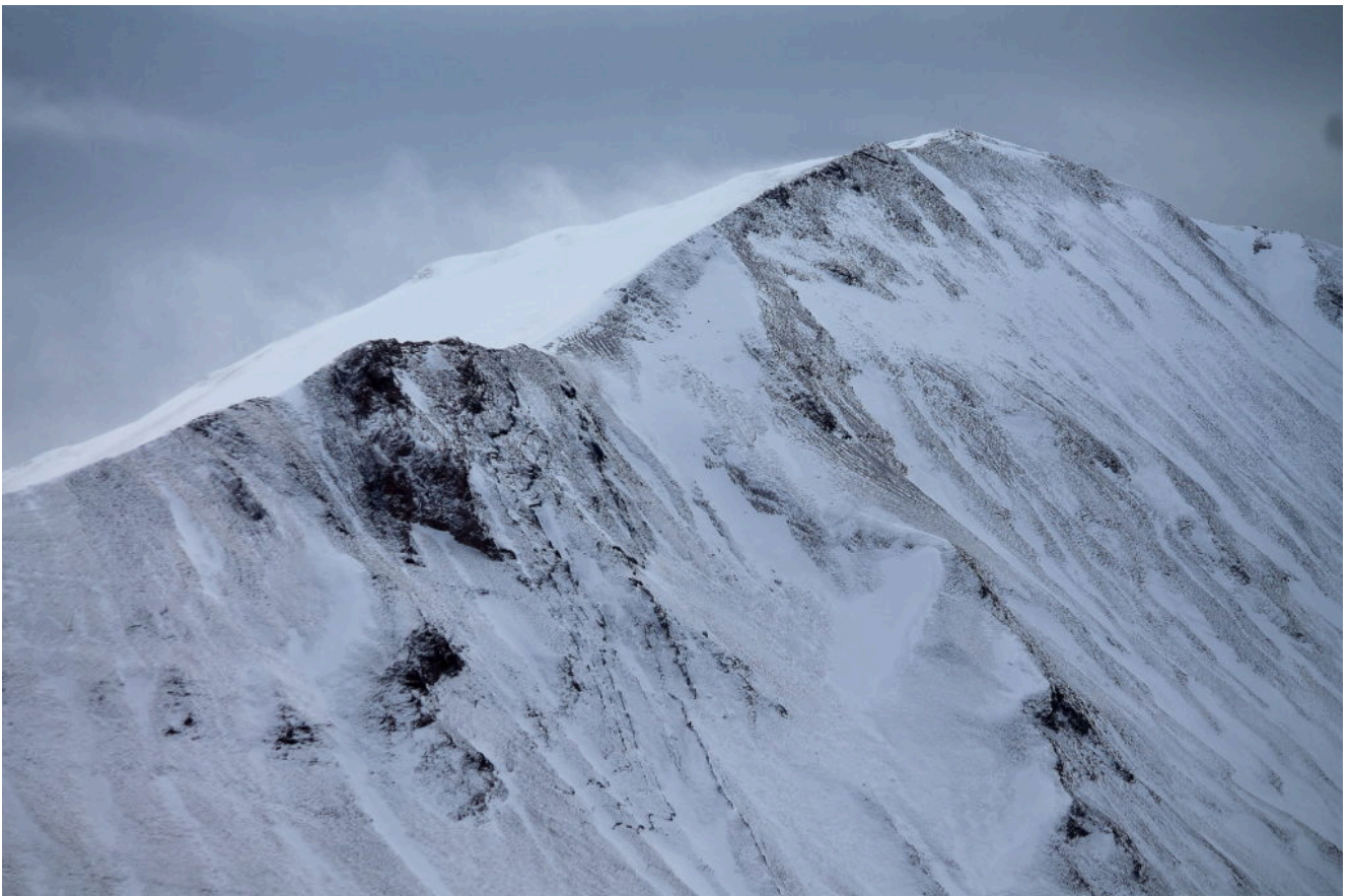
7- Sul Pizzo Regina già soffia vento. ma verrà peggio in pochi