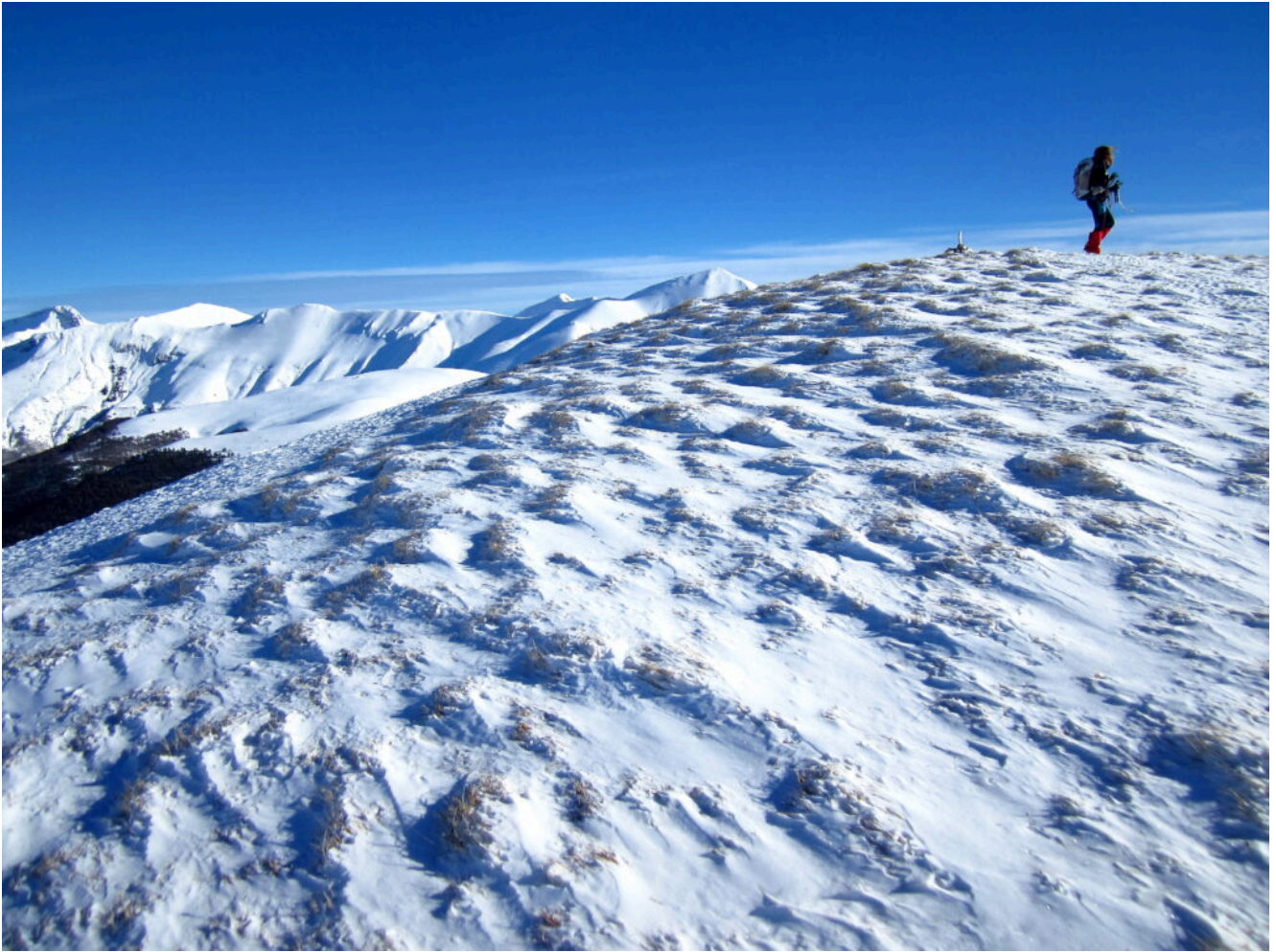
18- In cima al Monte Lieto.