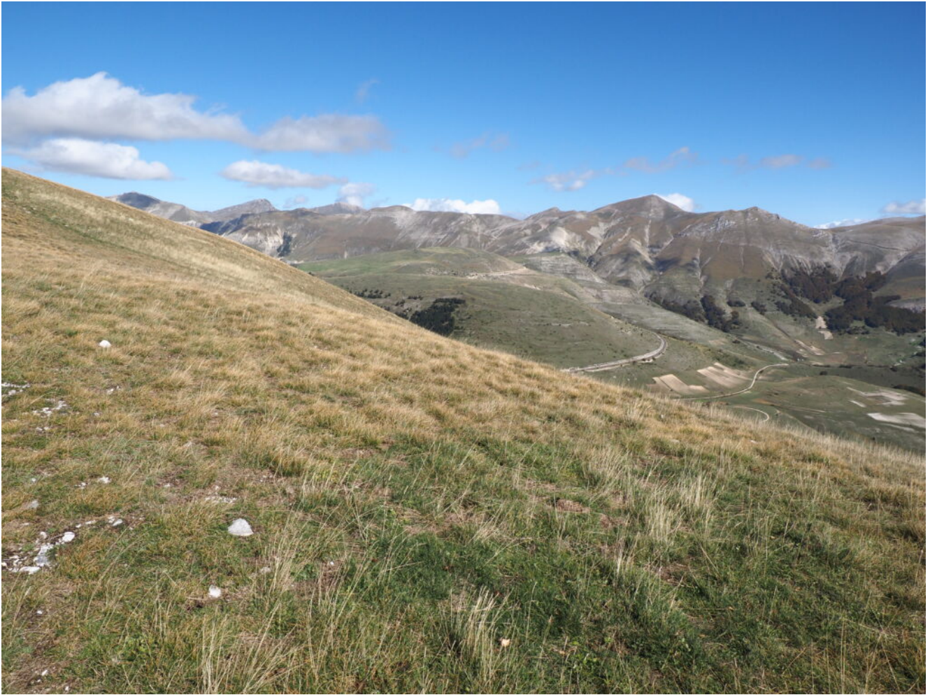
28- Veduta dalla cima del Monte Lieto verso il gruppo Nord dei Monti Sibillini.