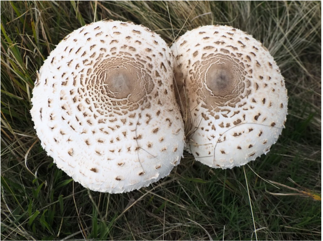
47- Bellissime Mazze da tamburo ( Macrolepiota procera ) nei prati di discesa.