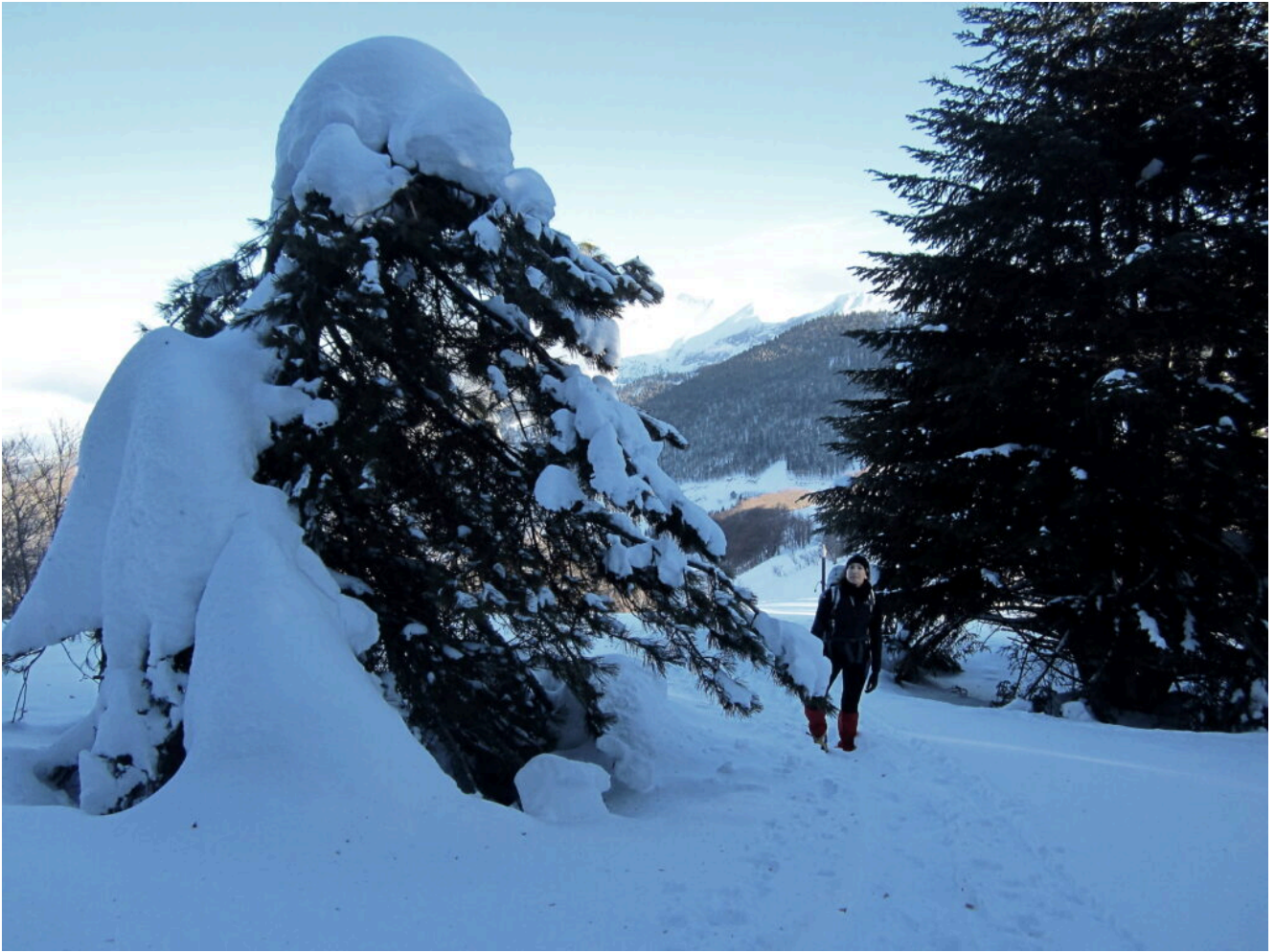
4 – 5 – Neve fresca all'interno del rimboschimento