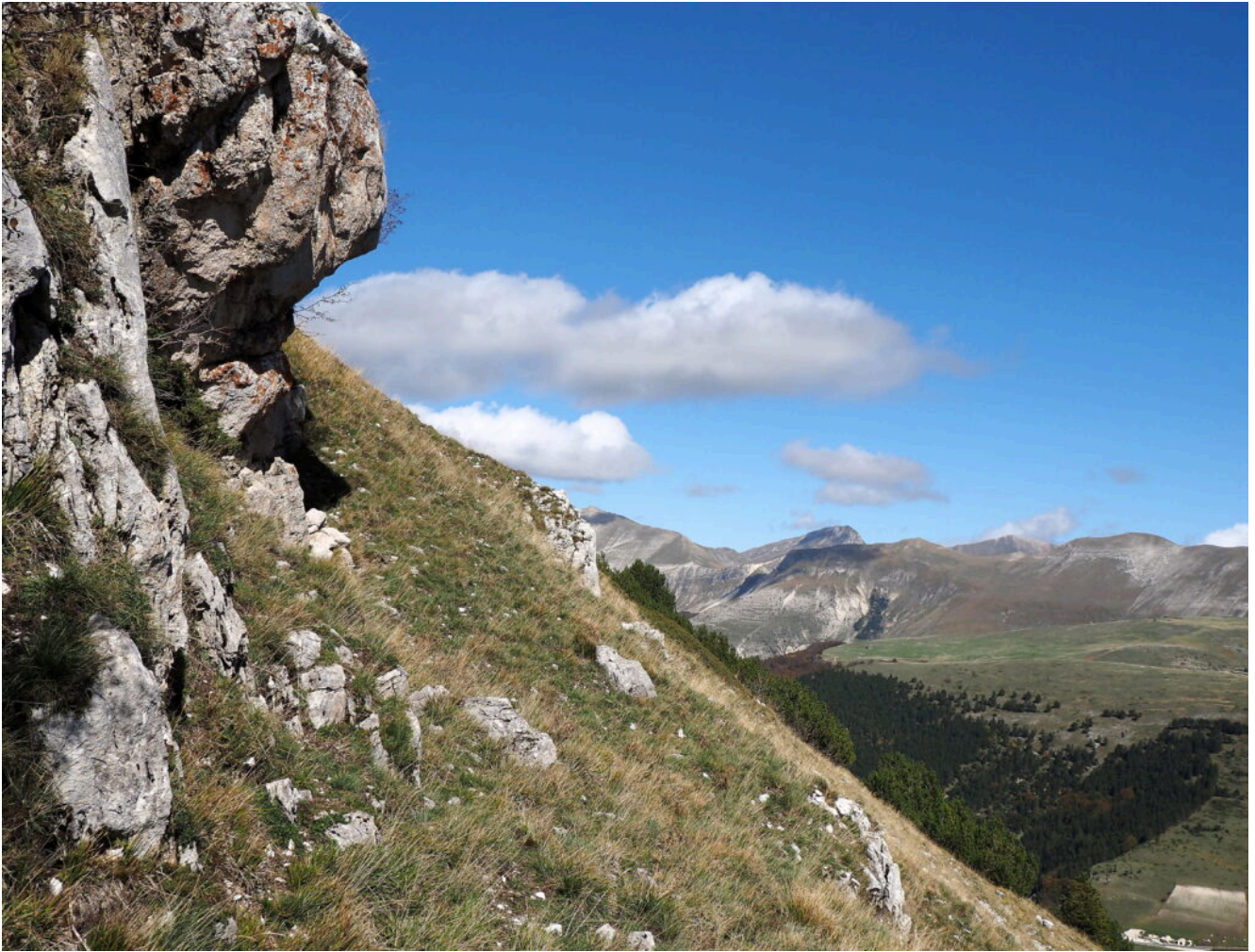
30 – 32- Le rocce presenti ai lati dell'ultima parte del canale.