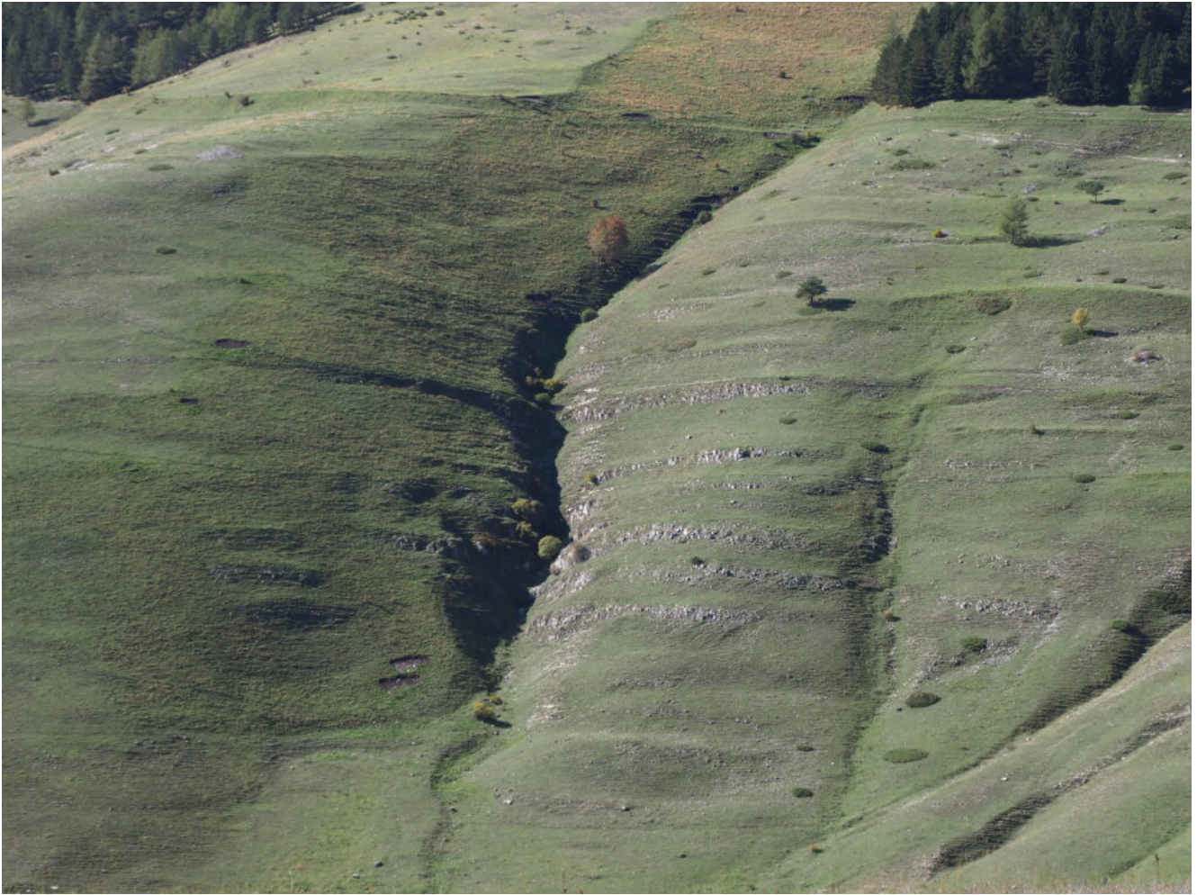
3- la prima parte del canale molto inciso e con dei saltini rocciosi.