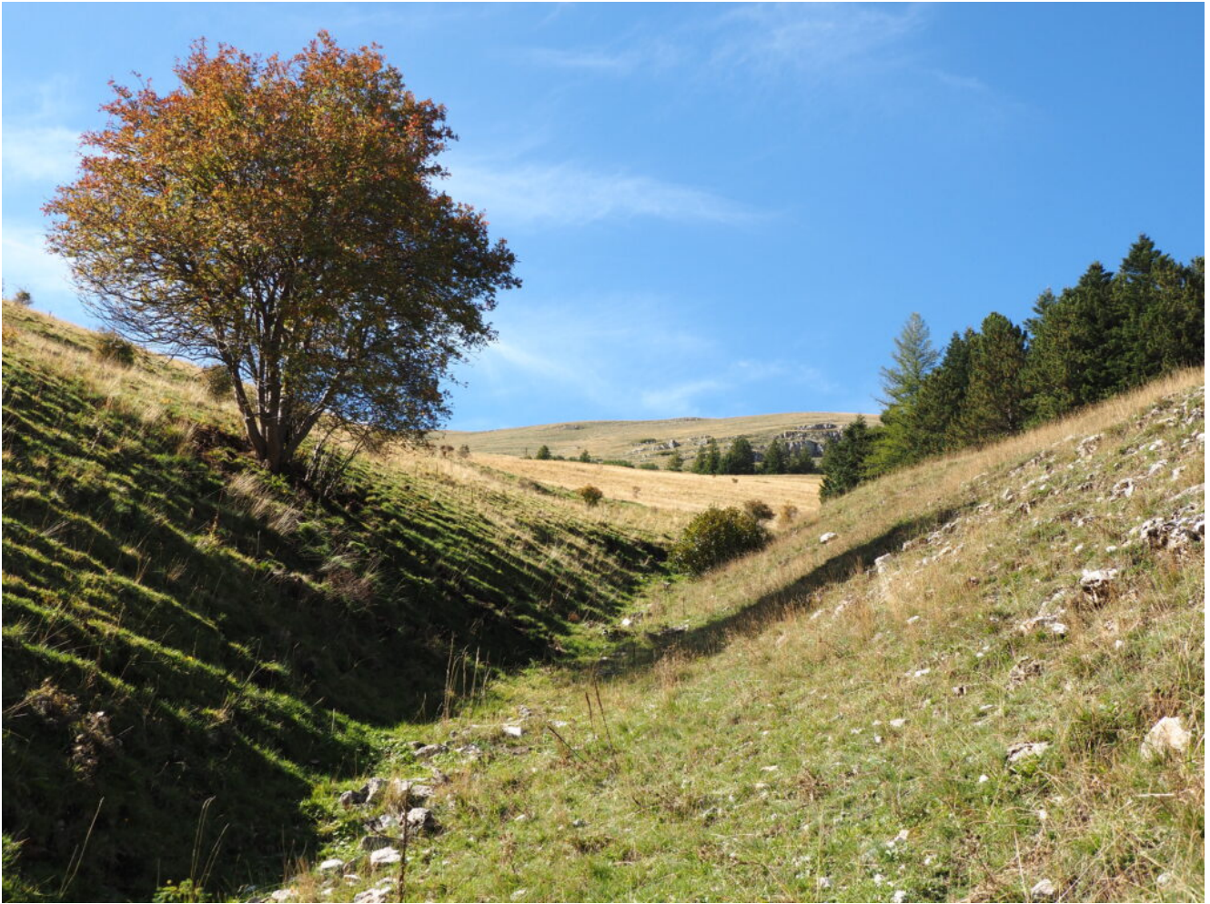
12- L'acero della foto n.10 e le prime conifere del rimboschimento a destra.