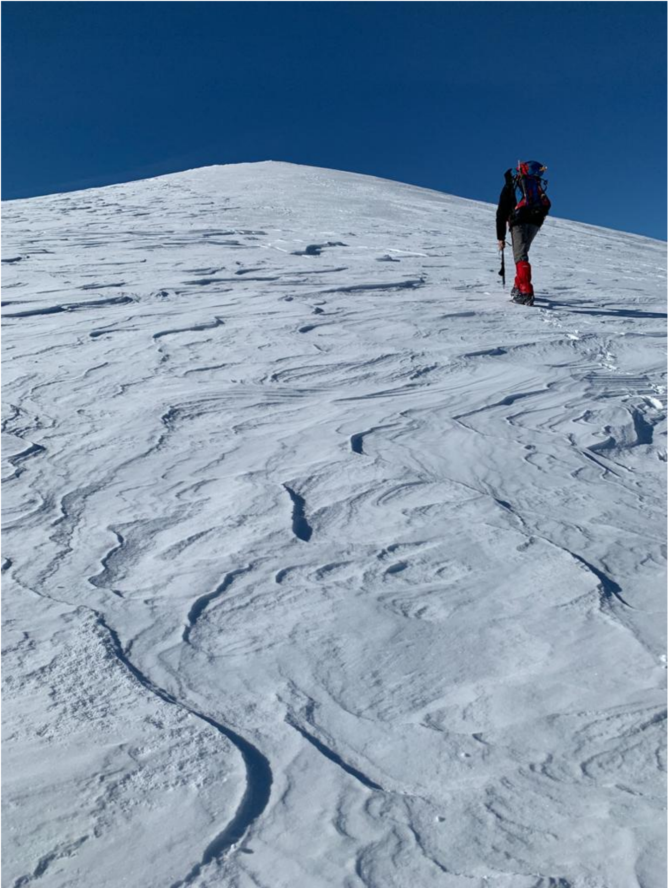
14 – 15- Verso la cima