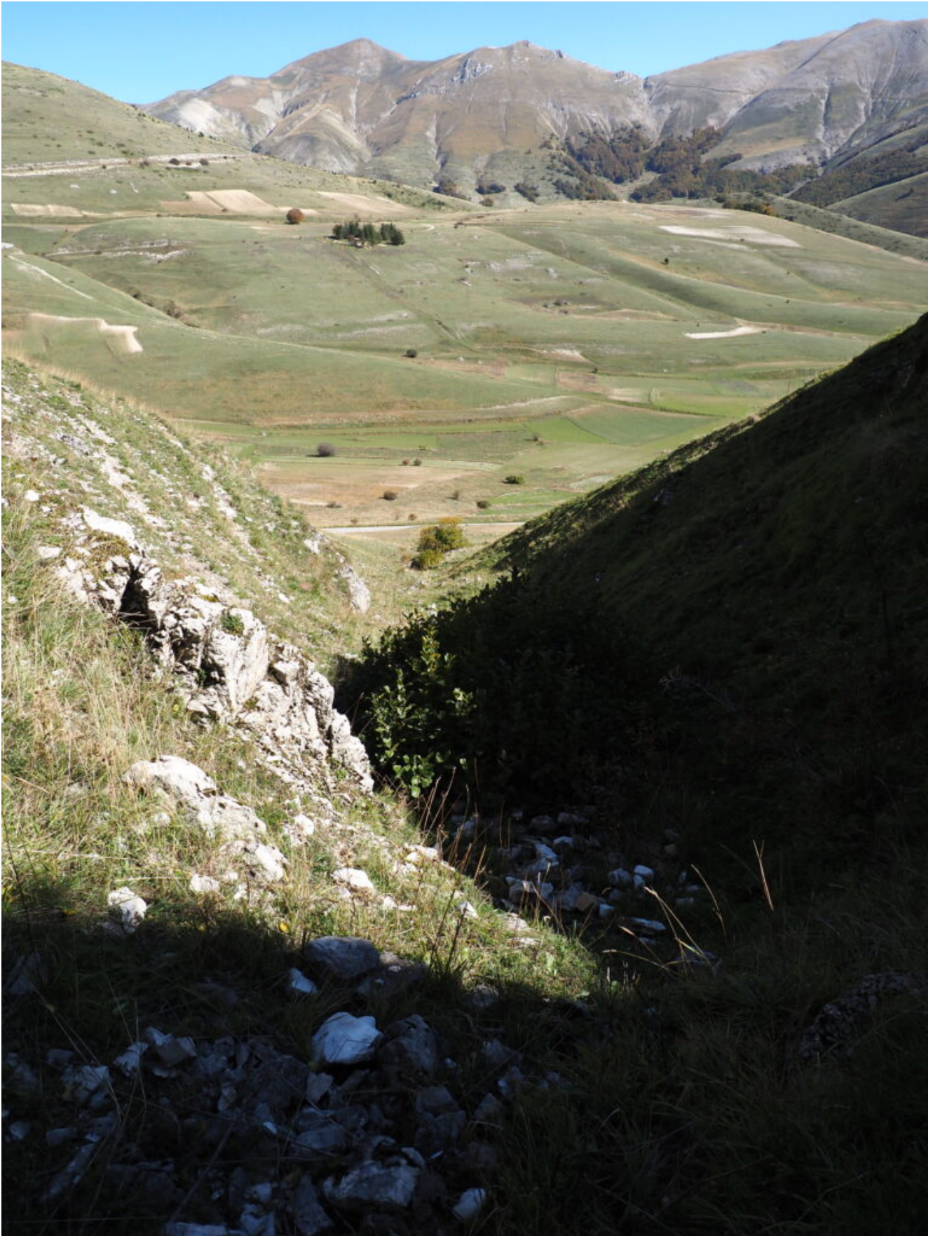
7- Il Monte Porche visto dall'interno del canale, in fondo la strada da cui si parte