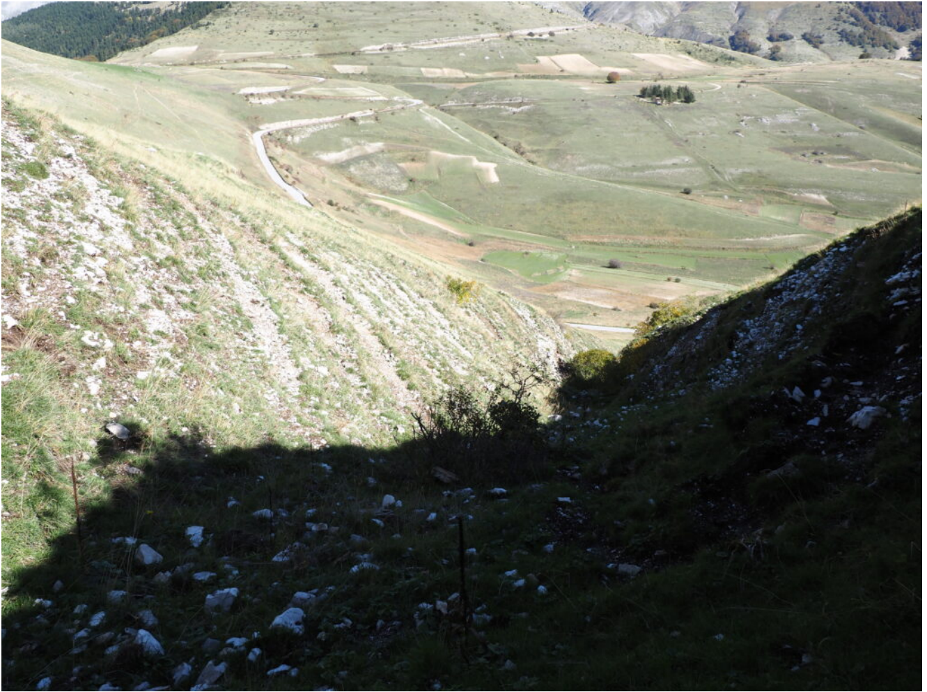
8- La Forca di Gualdo e la strada per Castelluccio.