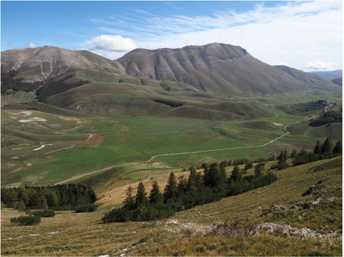
24- Veduta verso il Monte Argentella e la Cima del Redentore dai pressi della cresta.