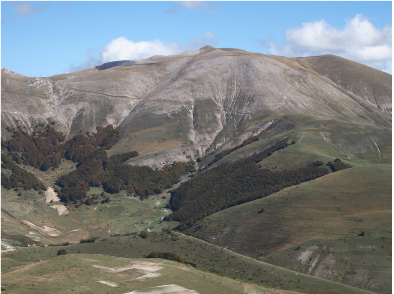
36- Il Monte Argentella e i boschi del San Lorenzo.