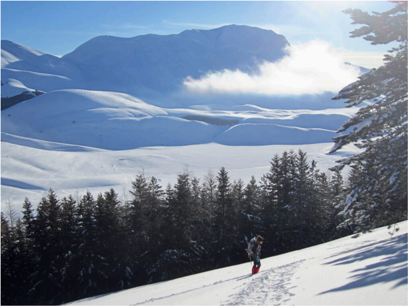
7- La Cima del Redentore ed il Pian Perduto