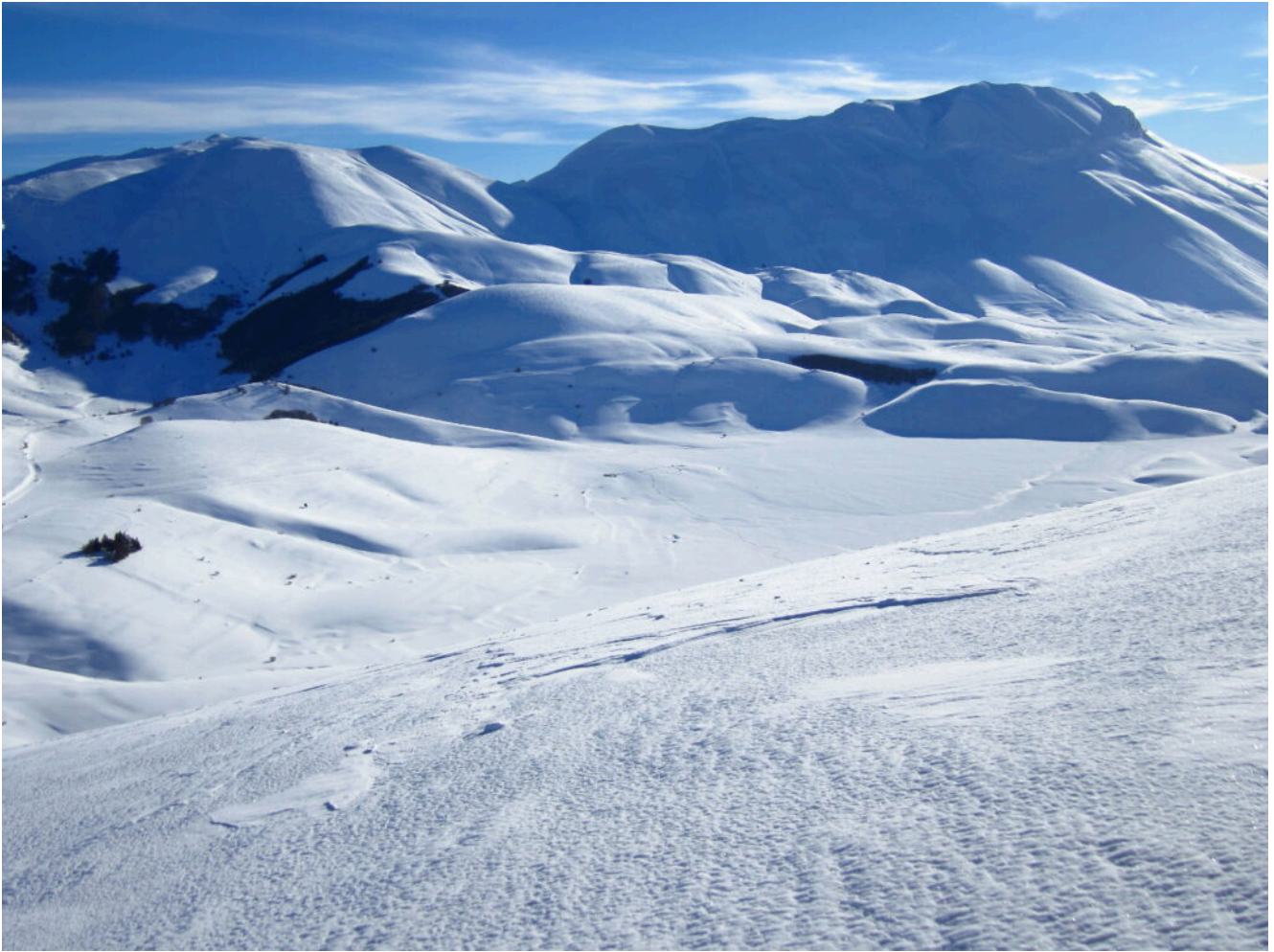
16- Il Pian Perduto, il Monte Argentella e la Cima del Redentore visti dalla cima di Monte Lieto.