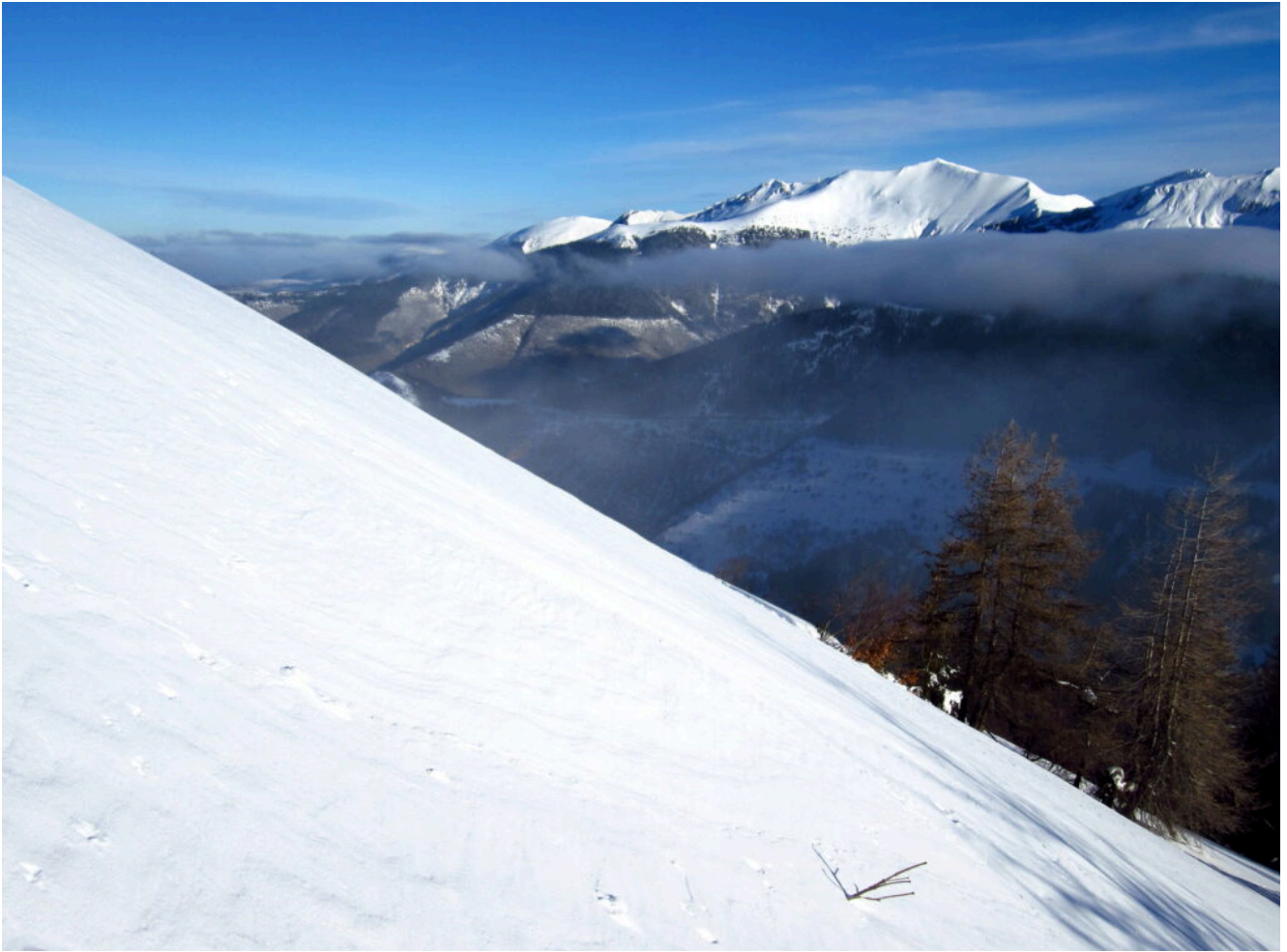
10- Finalmente neve ottima sulla cresta, sullo sfondo il Monte Bove Sud ed il Monte Bicco.