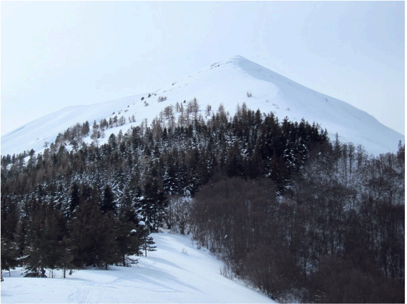
1 – 2- La cresta Nord di Monte Lieto con il primo tratto di rimboscimento vista dalla stazione di rilevamento sismico a monte della casetta di pastori.