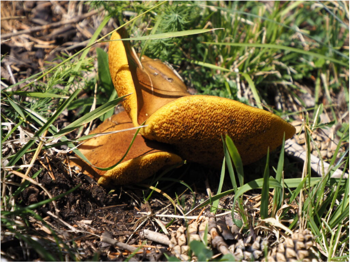
16 – 17 – Suillus gravillei detto anche laricino o pinarolo, porcino che abbonda nel sottobosco a conifere.