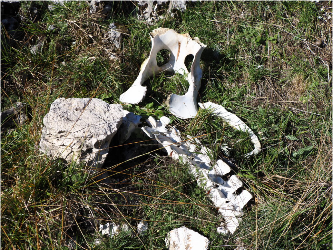
6- Una vecchia carcassa di bovino all'interno del canale.