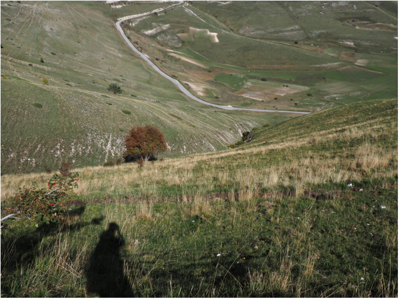
43- La ripida discesa verso la strada da dove si parte.