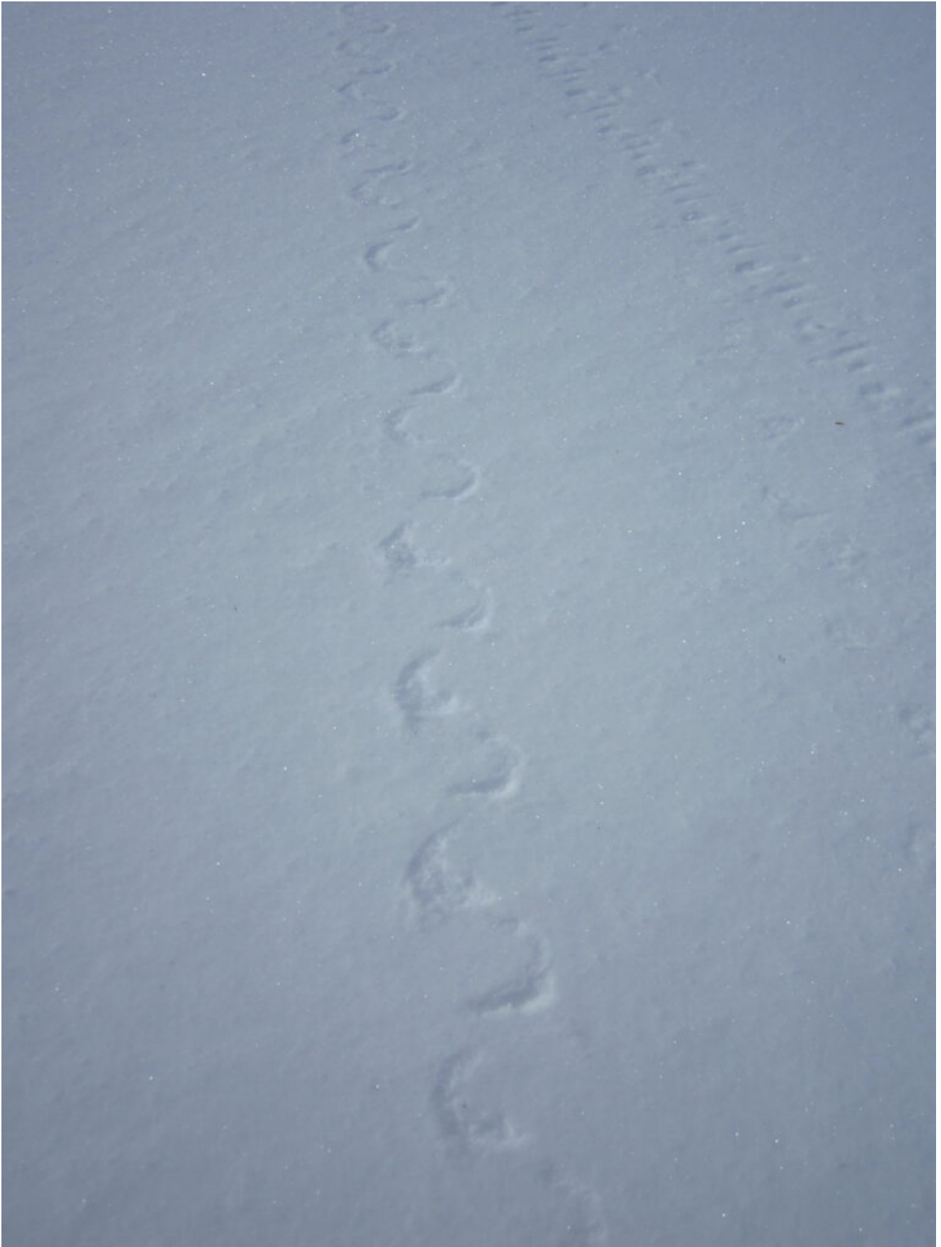
26- Strane tracce lasciate da porzioni di neve scivolate a valle dopo il nostro passaggio.