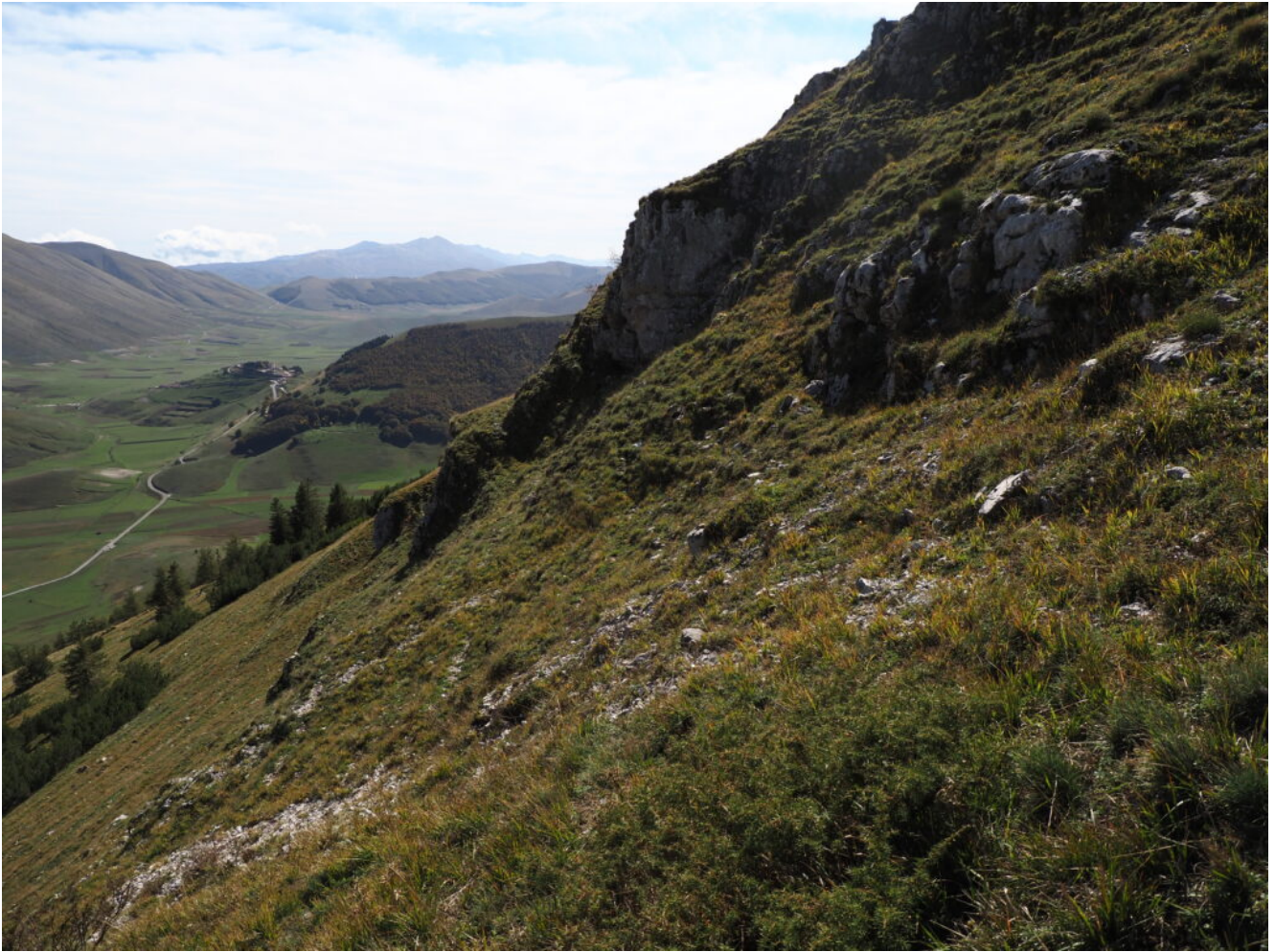
25- Castelluccio e il Piano Grande, sullo sfondo i Monti della Laga.