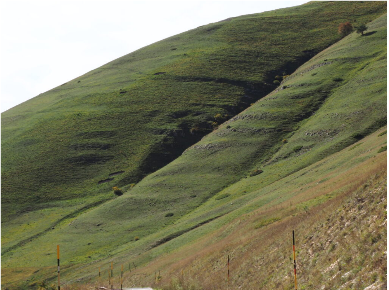
4- L'attacco del canale visto dalla strada Forca di Gualdo-Castelluccio.