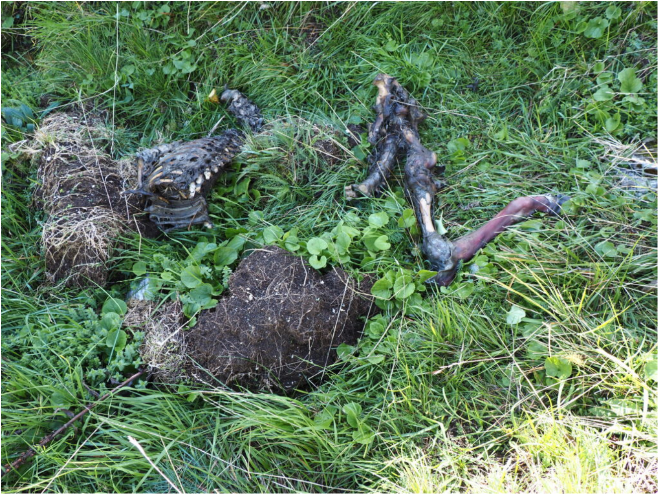
11- Una ulteriore carcassa, sembra di capriolo ma manca la testa.