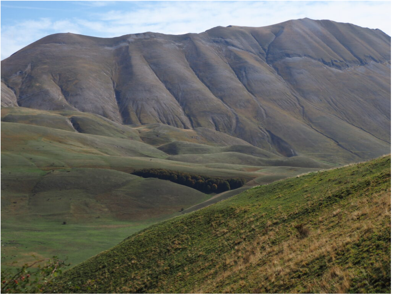
14- La Cima del Redentore e i Colli Alti e Bassi.