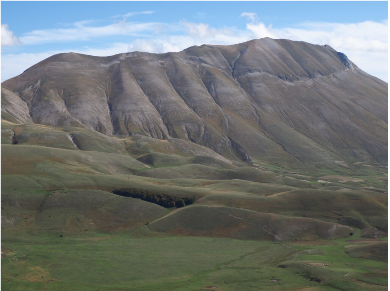
37- La Cima del Redentore ed i Colli Alti e Bassi.