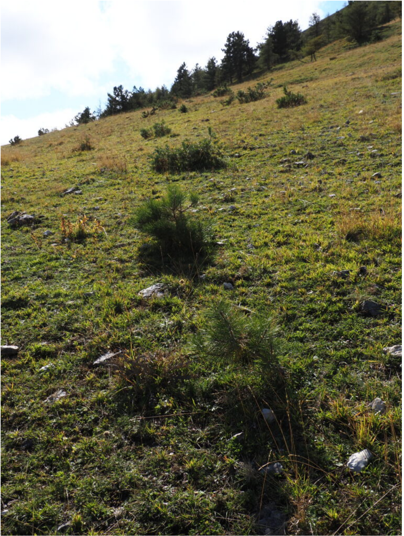
42- Piccoli Mughi crescono nel pendio sopra al rimboschimento