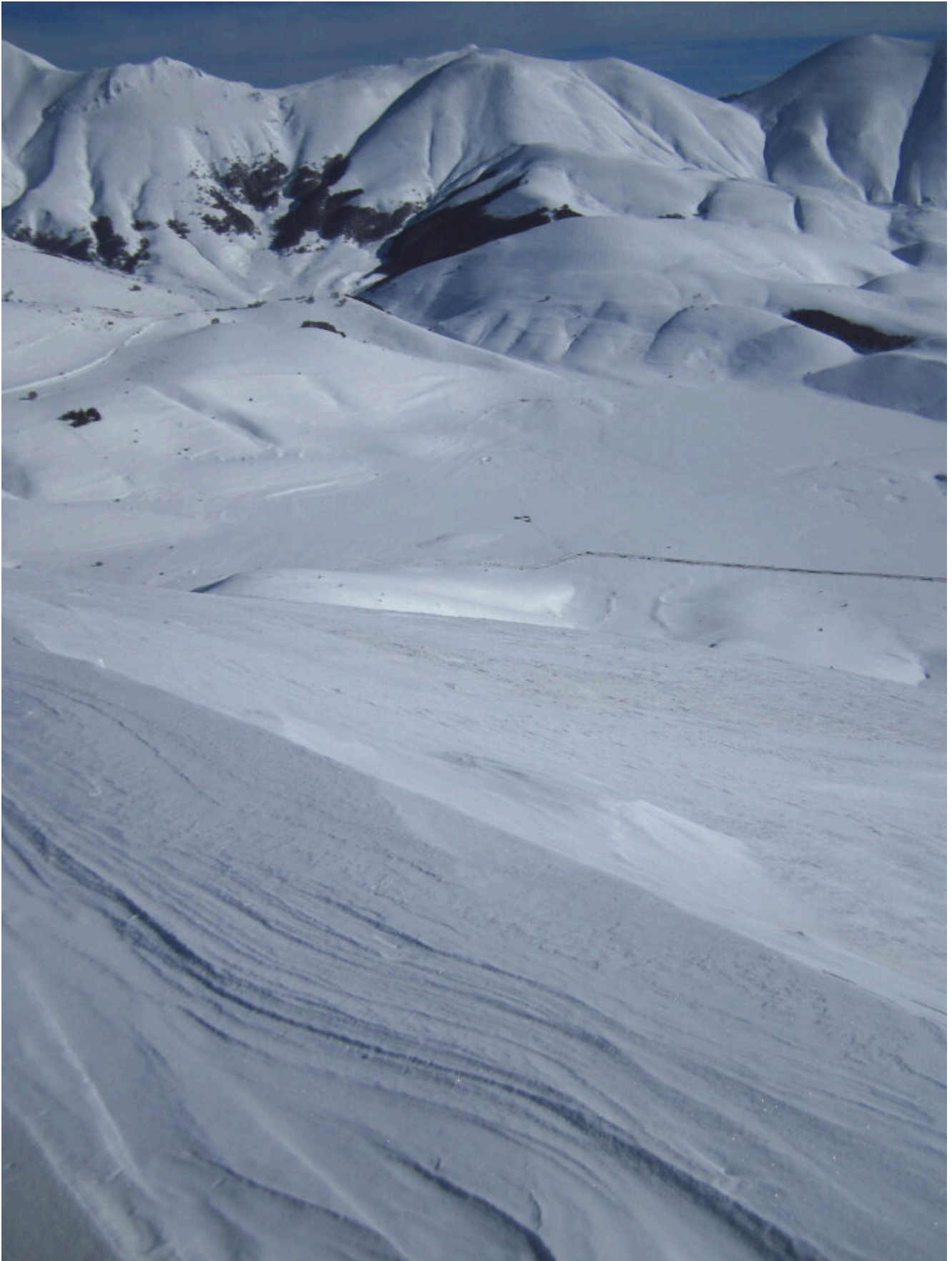
24- Veduta aerea del Pian Perduto e della conca del San Lorenzo.