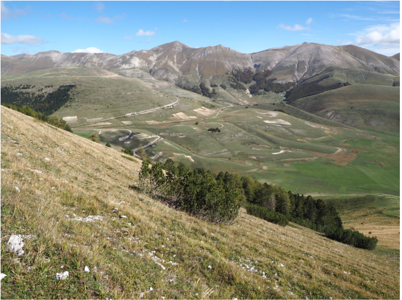
23- Veduta verso il Monte Porche e Monte Palazzo Borghese dai pressi della cresta.