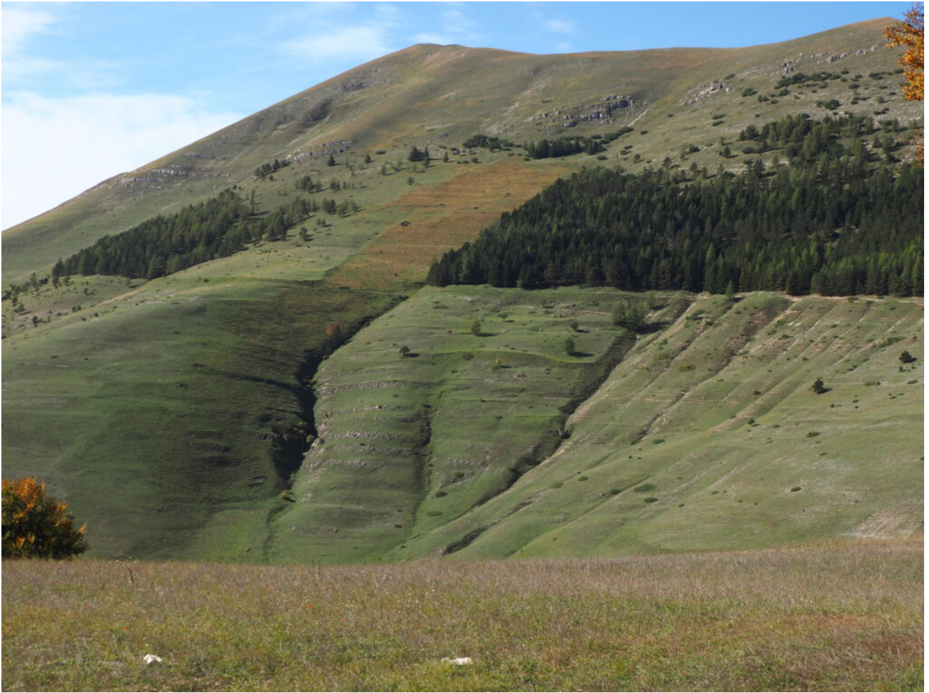
2- Zoom sul intuitivo canale di salita.