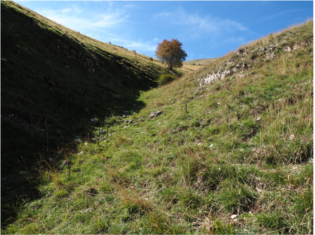
10- Un grande Acero delimita la parte più incisa del canale.