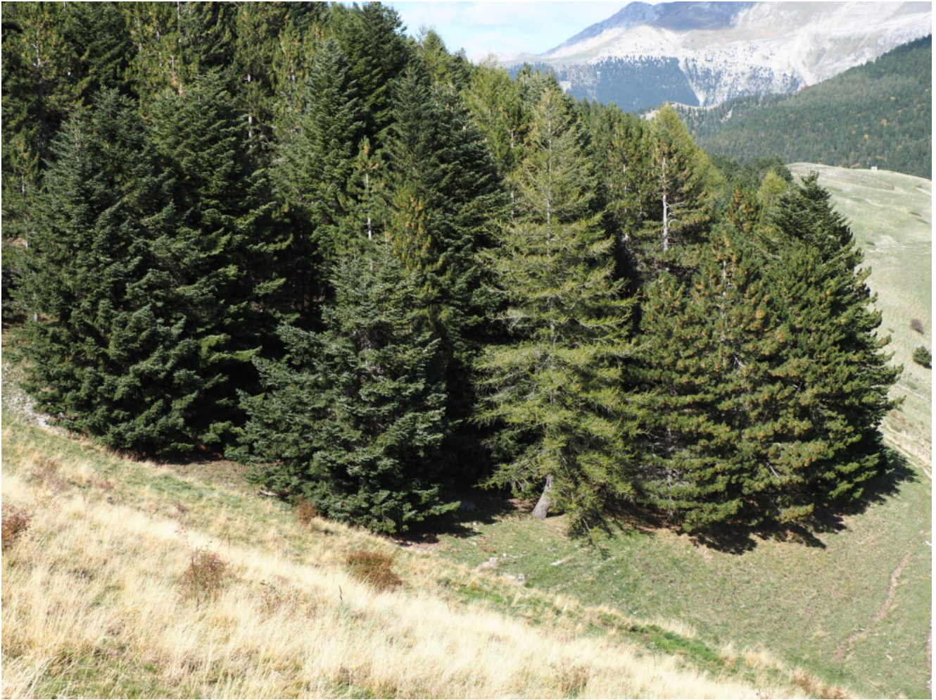
41- Il rimboscimento attraversato, formato da diverse essenze di conifere caratterizzate da sfumature di verde differenti.