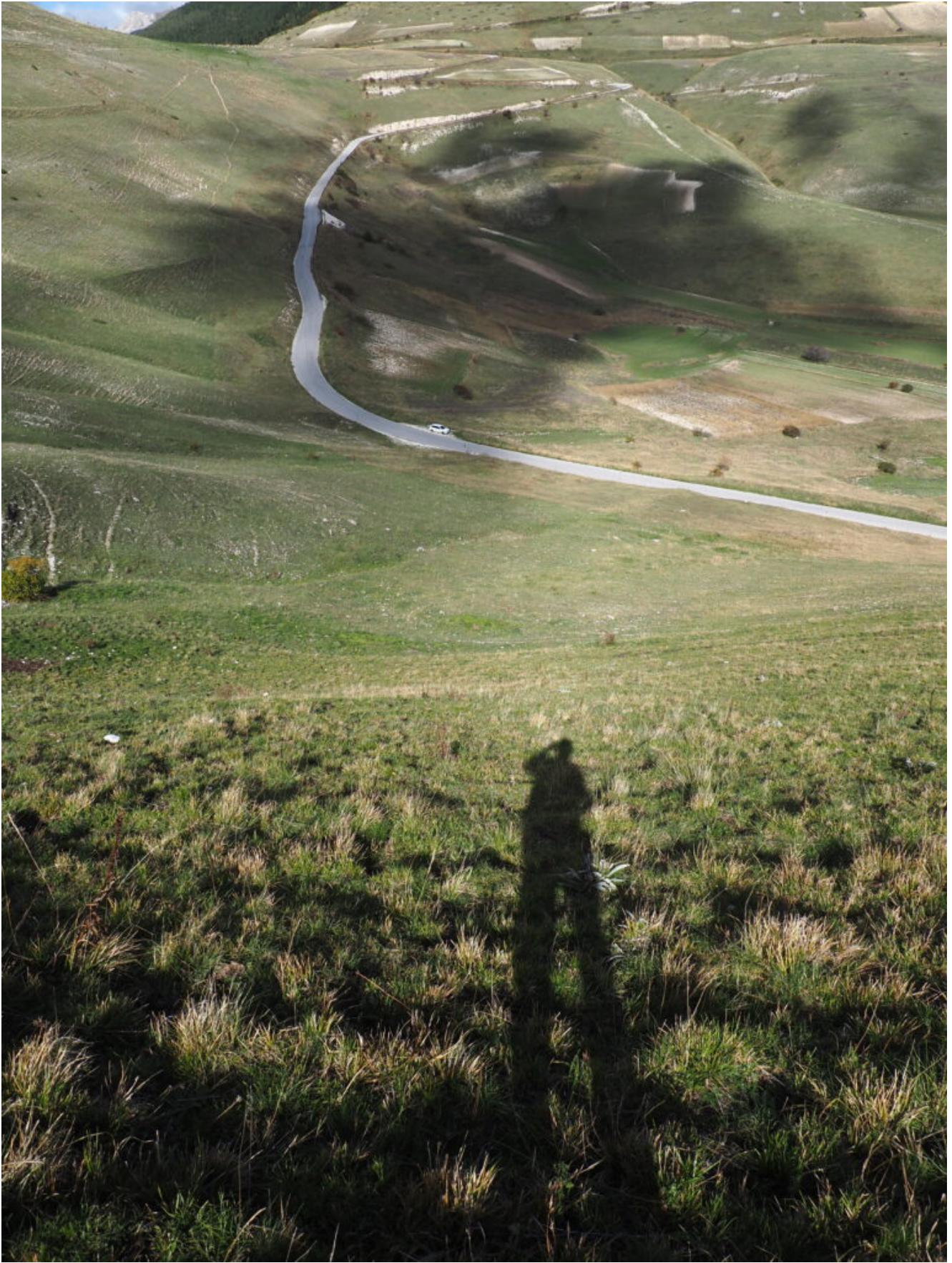
46- La mia fedele compagna di salite, anche se rimane sempre nel parcheggio.