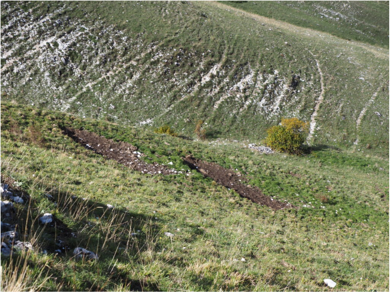
45- Altri tratti di sponda del canale dissestati dal passaggio di bovini.