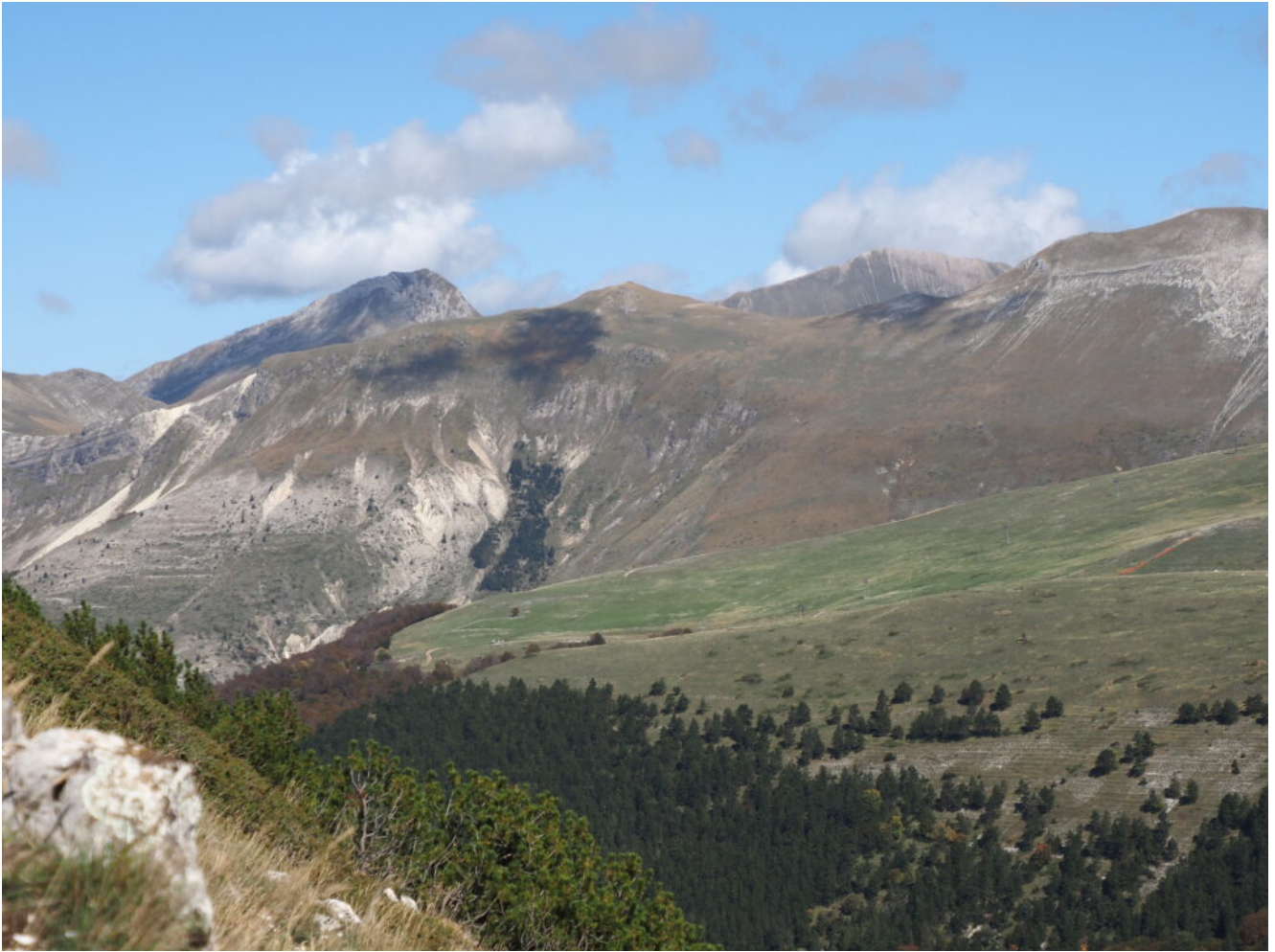
34- Il Pizzo Berro e il Pizzo Regina emergono ai lati della Cima di Passo Cattivo, a destra la Cima di Vallinfante.