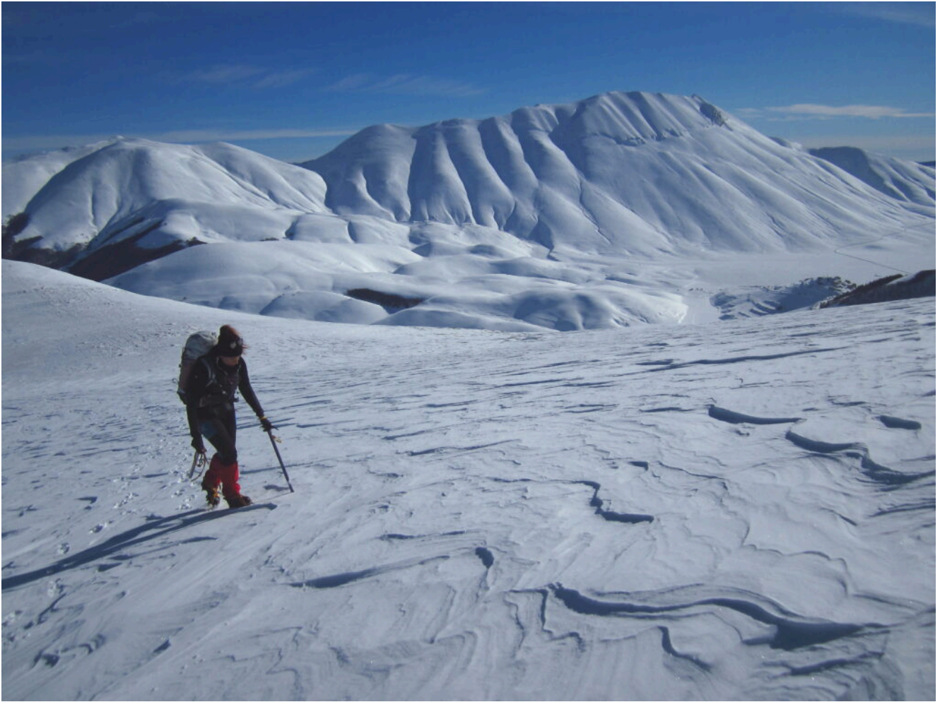
22- La Cima del Redentore vista dal Monte Lieto.