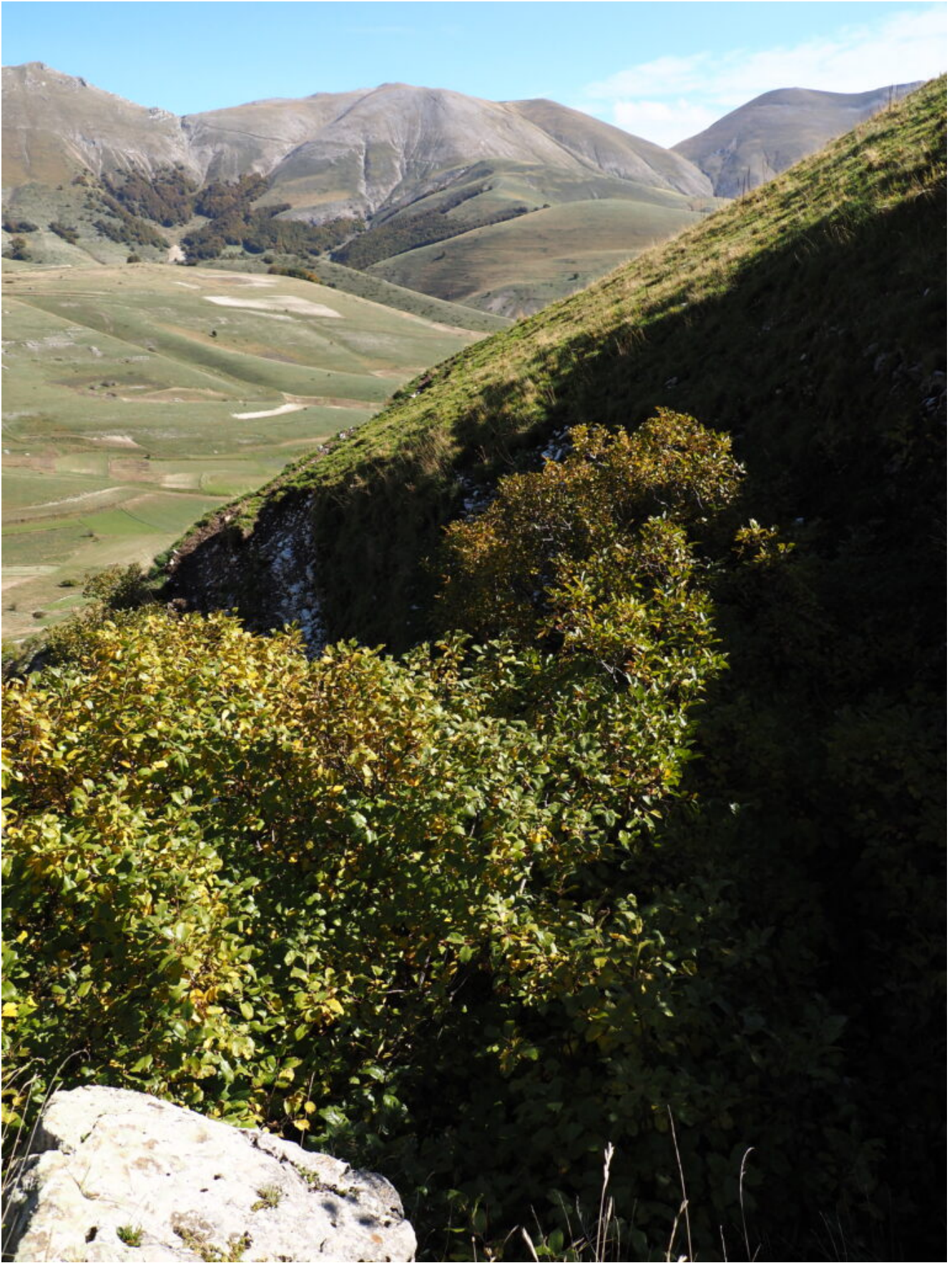
9- In corrispondenza dei saltini rocciosi vegetano arbusti di Ramno alpino, sullo sfondo il Monte Argentella.