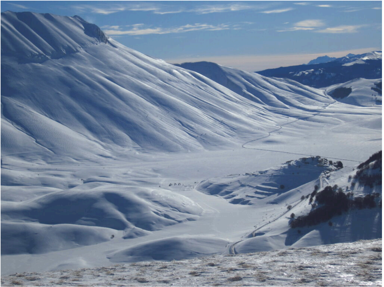
21- Castelluccio ed io Piano Grande con la strada per Forca di Presta.