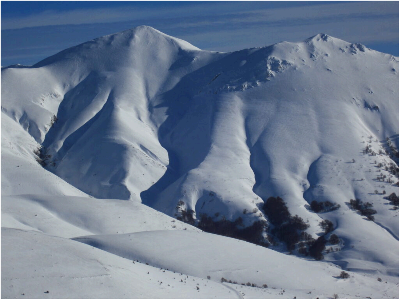
19- Il versante Ovest del Monte Porche (a sinistra) ed il Monte Palazzo Borghese (a destra).