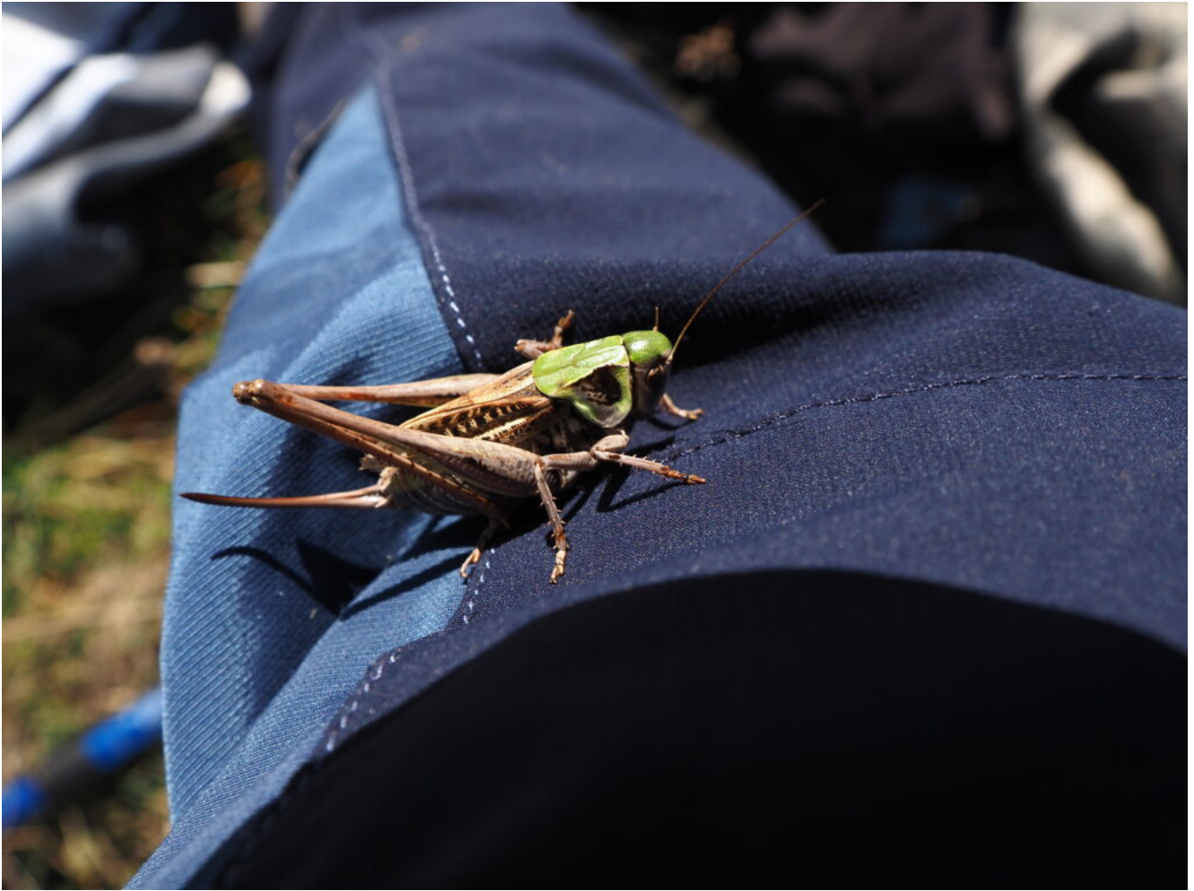
26- Grossa cavalletta si è affezionata ai miei pantaloni.