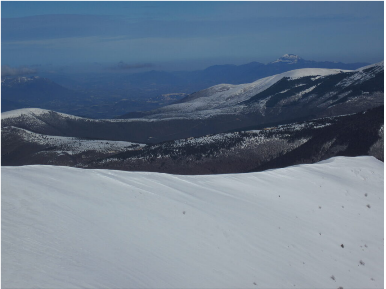
23- Veduta verso Nord con Camerino che emerge al centro della vallata a sinistra del Monte Careschio ed il Monte San Vicino a destra sullo sfondo.