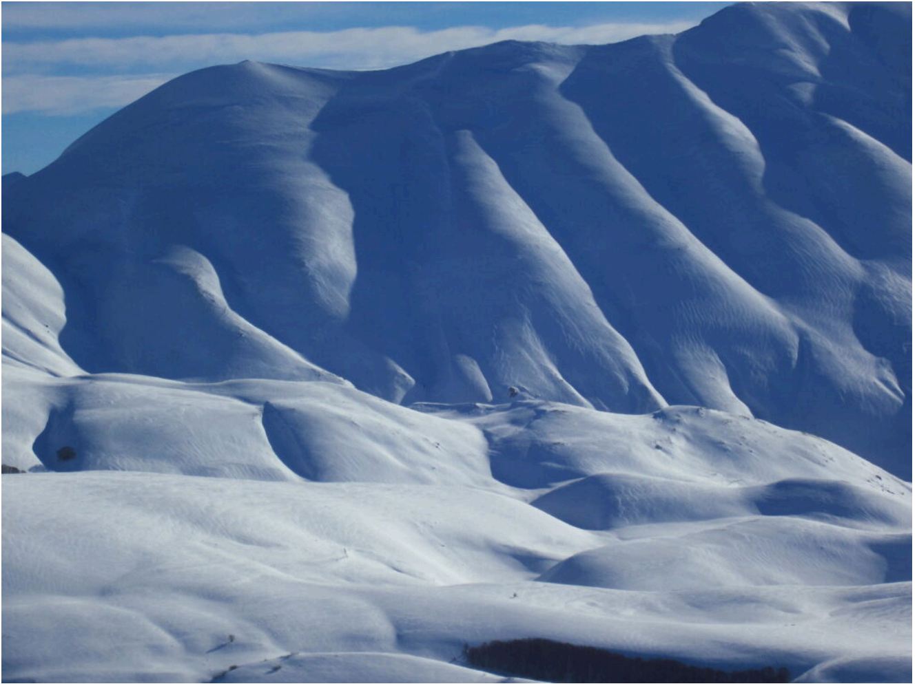
20- I canali Ovest della cima di Forca Viola e del Quarto San Lorenzo