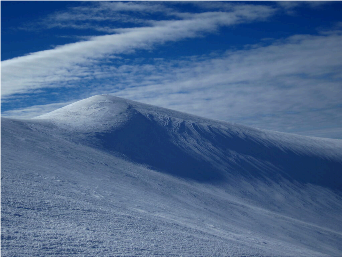
25- la cima del Monte Lieto.