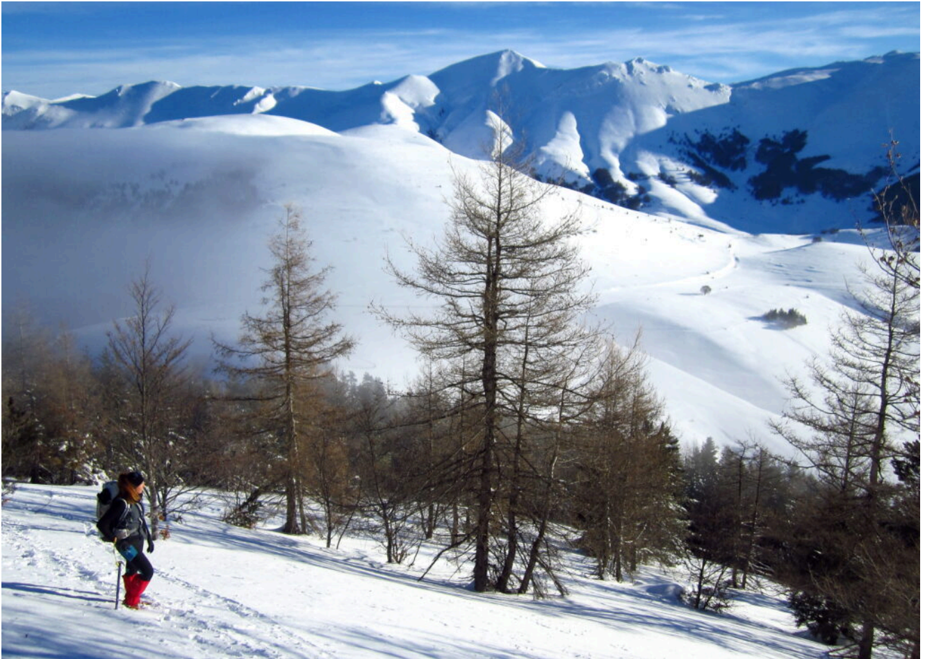
8 – 9- Gli ultimi larici isolati prima della cresta.