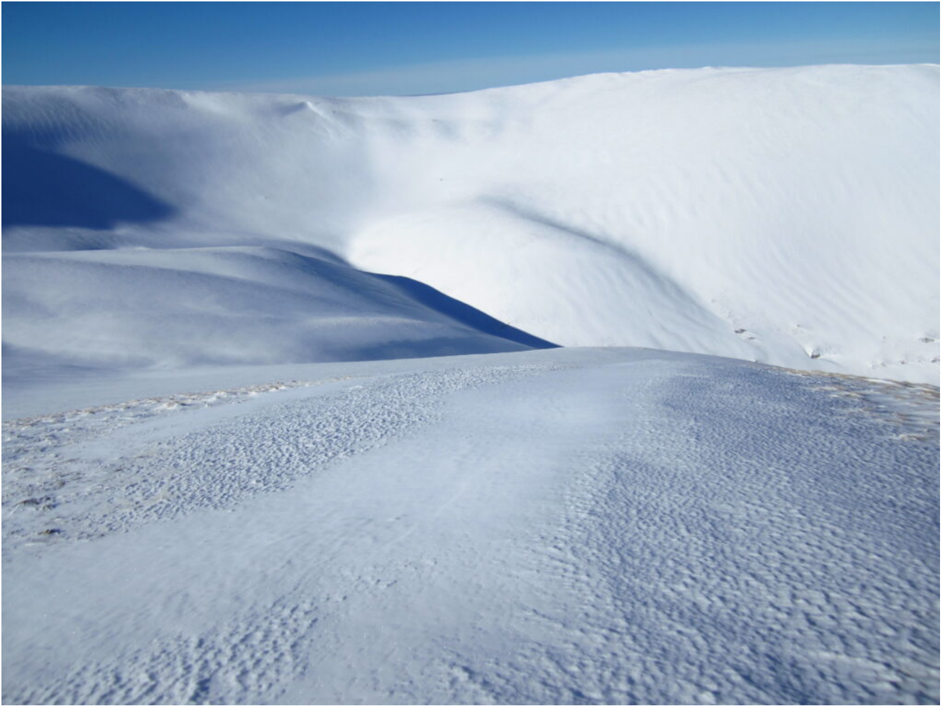
17- La cresta che scende dal Monte Lieto al Pian Falcone e la valletta di Valloprare sottostante.