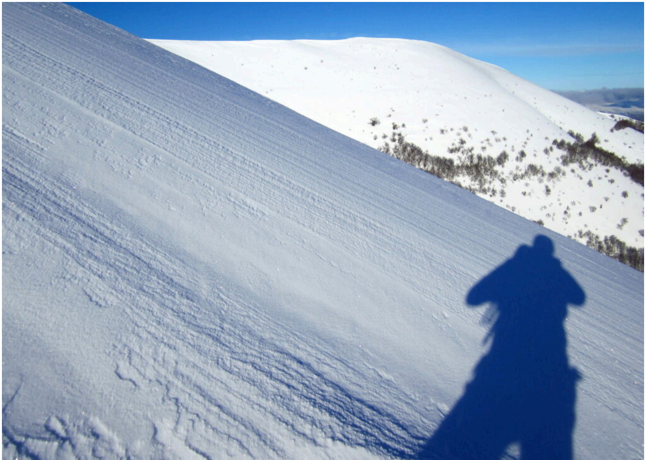
11- Il Pian Falcone visto dalla cresta.