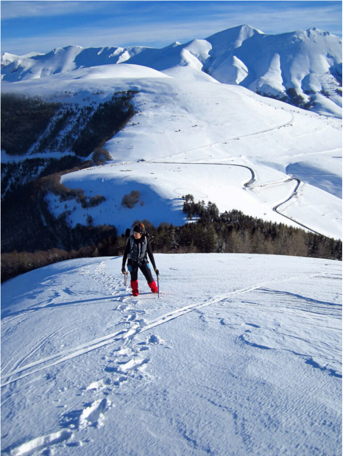
12 – 13- Il tratto più ripido della cresta Nord, alle spalle la Forca di Gualdo con la Madonna della Cona dove si dividono le strade per il Monte Prata (sopra) e per Castelluccio (sotto).