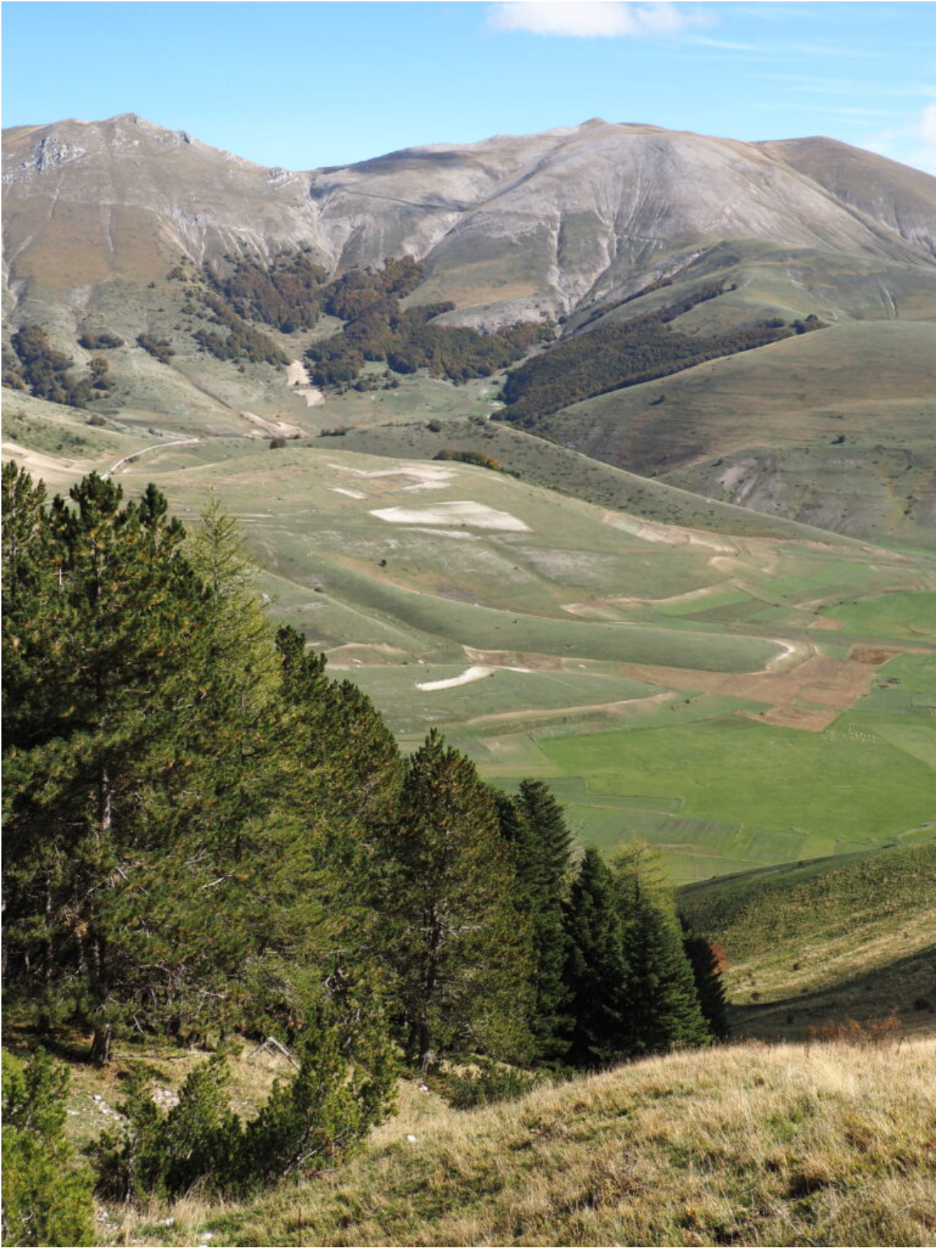
18- Il canale è delimitato alla sua destra orografica dal rimboschimento a conifere.