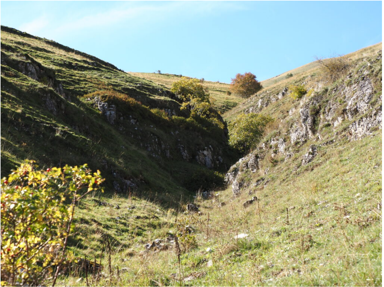
5- L'ingresso del canale nella sua prima parte incisa e con dei saltini rocciosi.