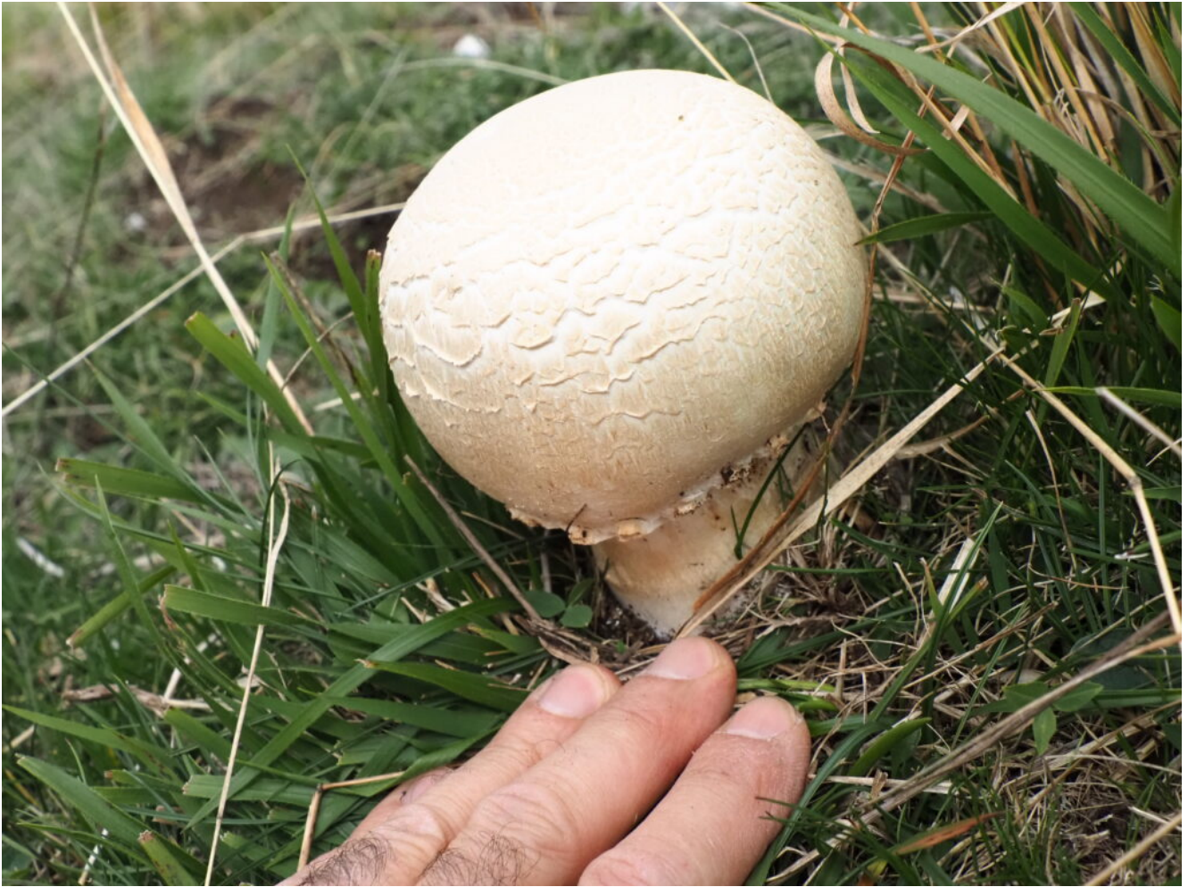
48- E buonissimo Prataiolo ( Agaricus macrospora ).