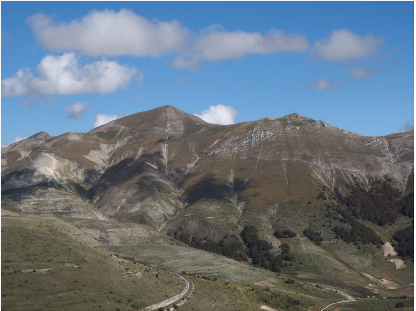
35- Il Monte Porche e il Monte Palazzo Borghese.