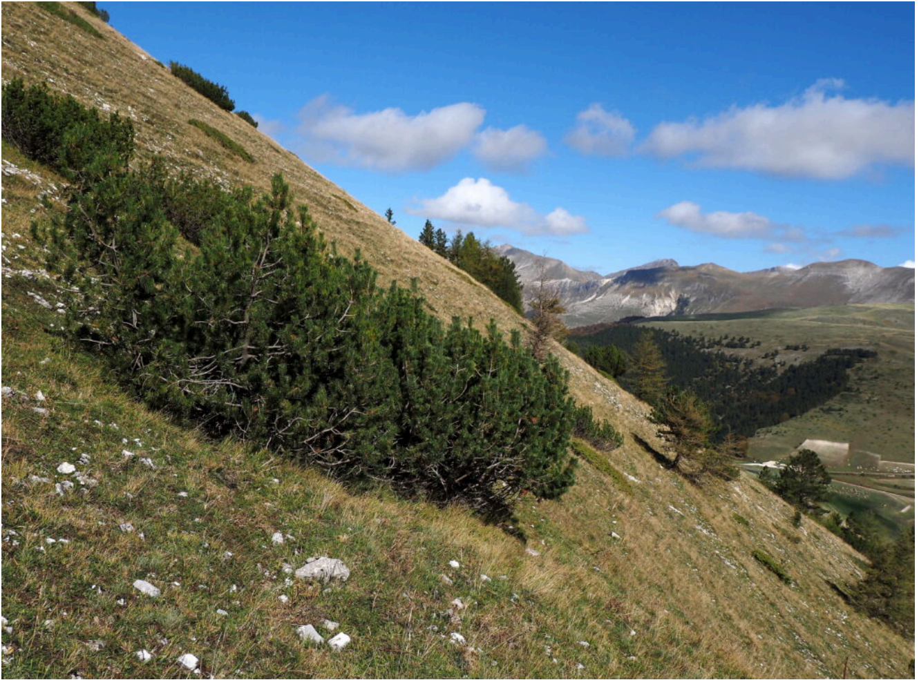
21- I Mughi vegetano bene in questo pendio.