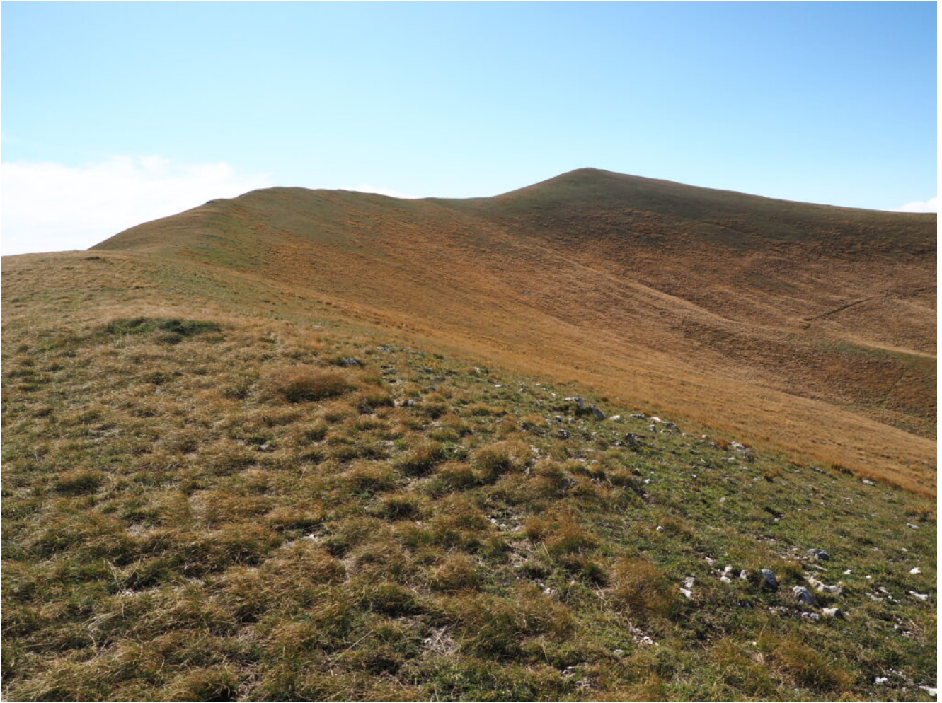
27- la cima di Monte Lieto vista dalla cresta di uscita.