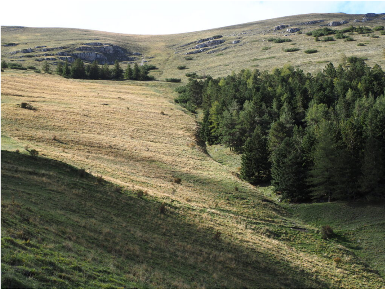
44- la continua linea del canale visto dal pendio di discesa di destra.