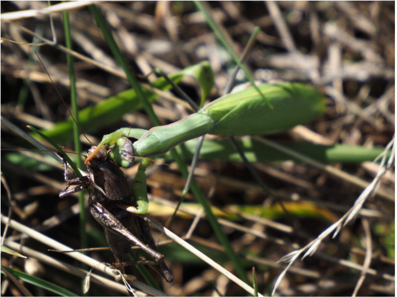
40- Mantide religiosa che si sta cibando di una cavalletta.