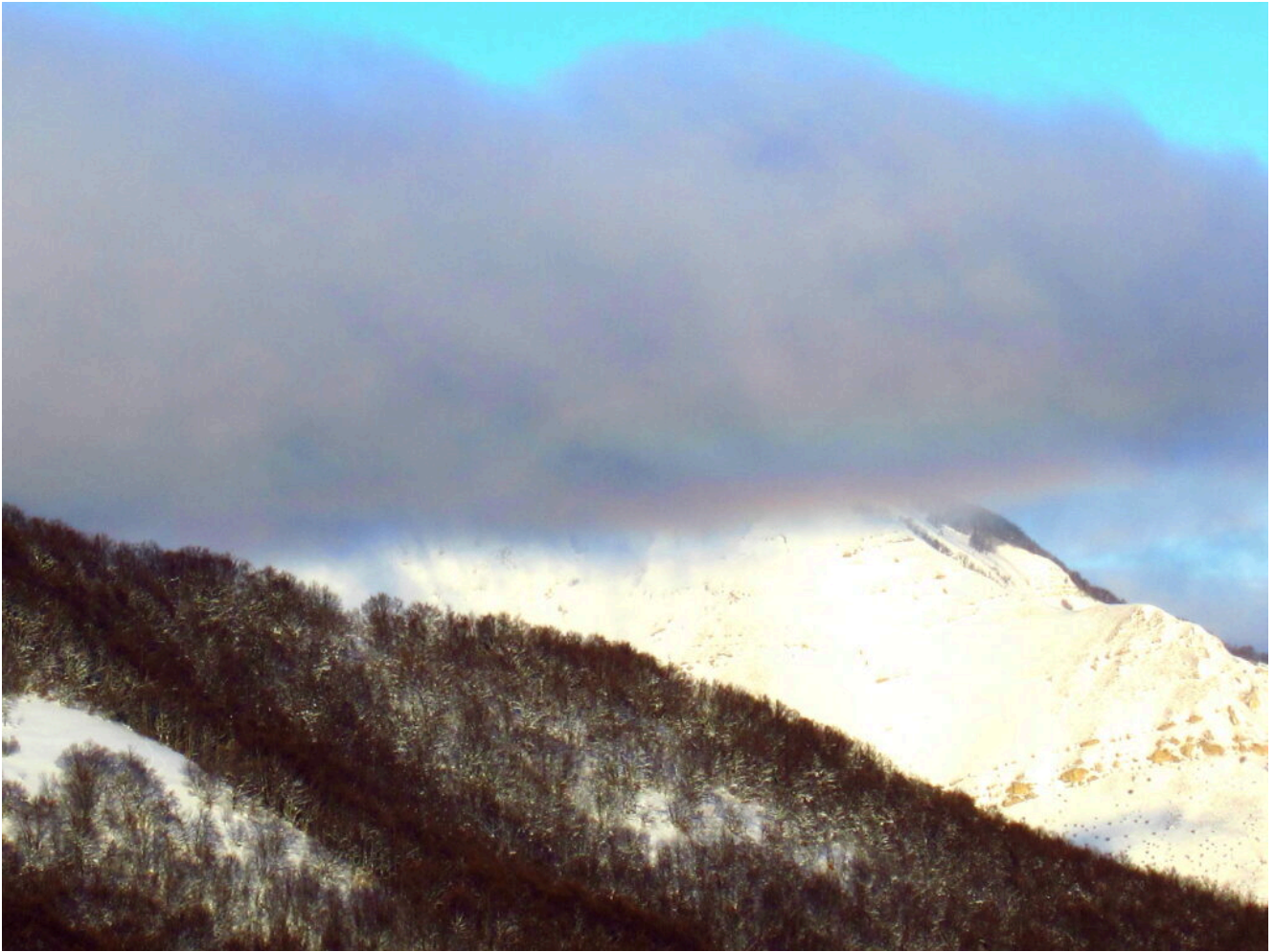
3- Nuvole arcobalenianti verso il Monte Cardoso.