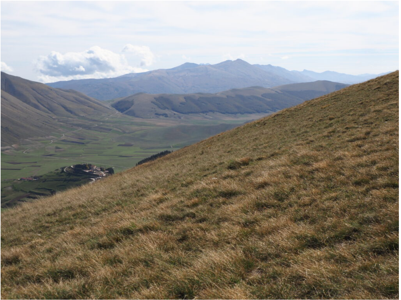
29- Veduta dalla cima del Monte Lieto verso Sud con Castelluccio