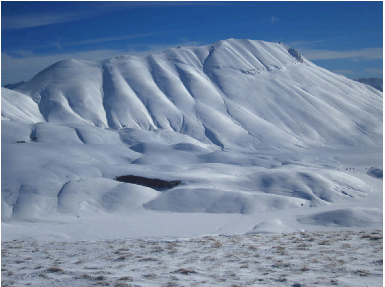
27 - 28 - 29-La Cima del Redentore in tempi diversi con diverse illuminazioni.