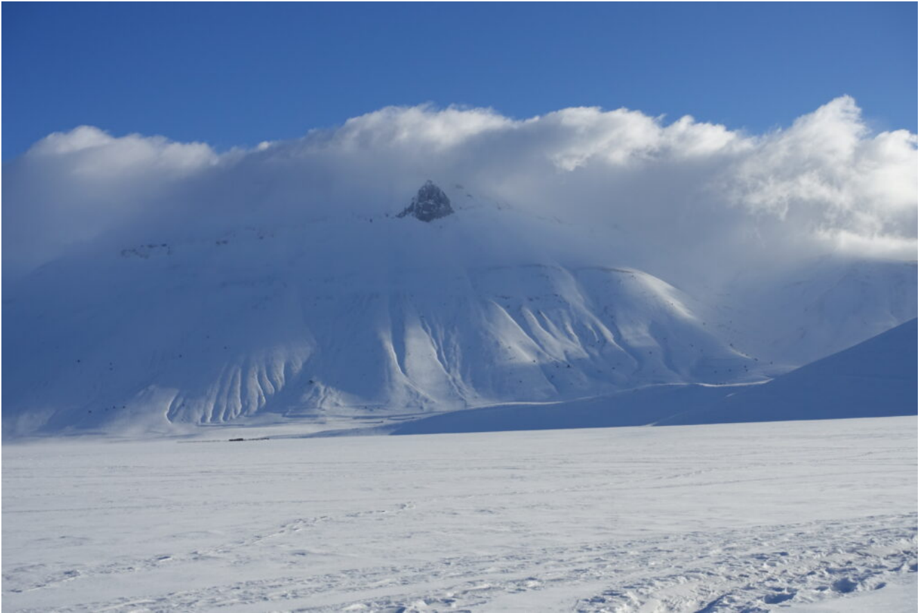
4- La Cime del Redentore è avvolta dalla nebbia proveniente dal versante Adriatico, sospinta dal vento di Tramontana, spicca lo Scoglio dell'Aquila.