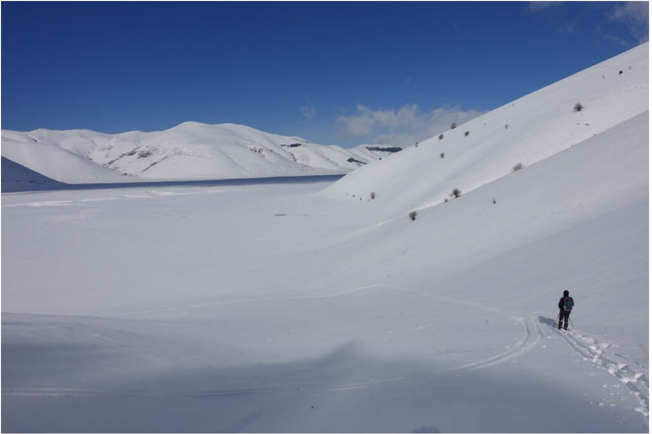
20- Ritorniamo all'immenso Pian Grande.