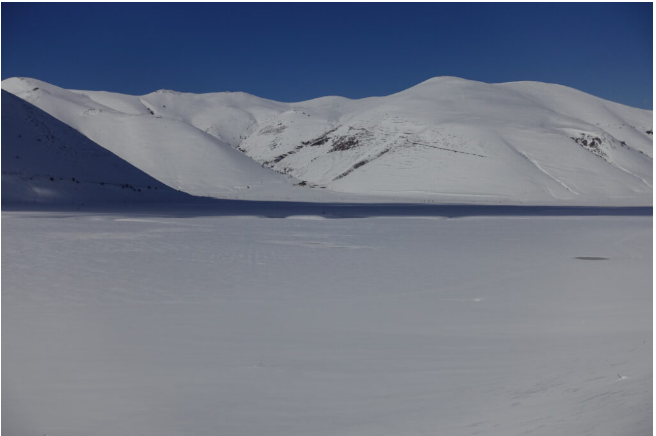
21- Le macchine sulla strada per Norcia, poco sopra la linea d'ombra, sono ancora piccolissime.