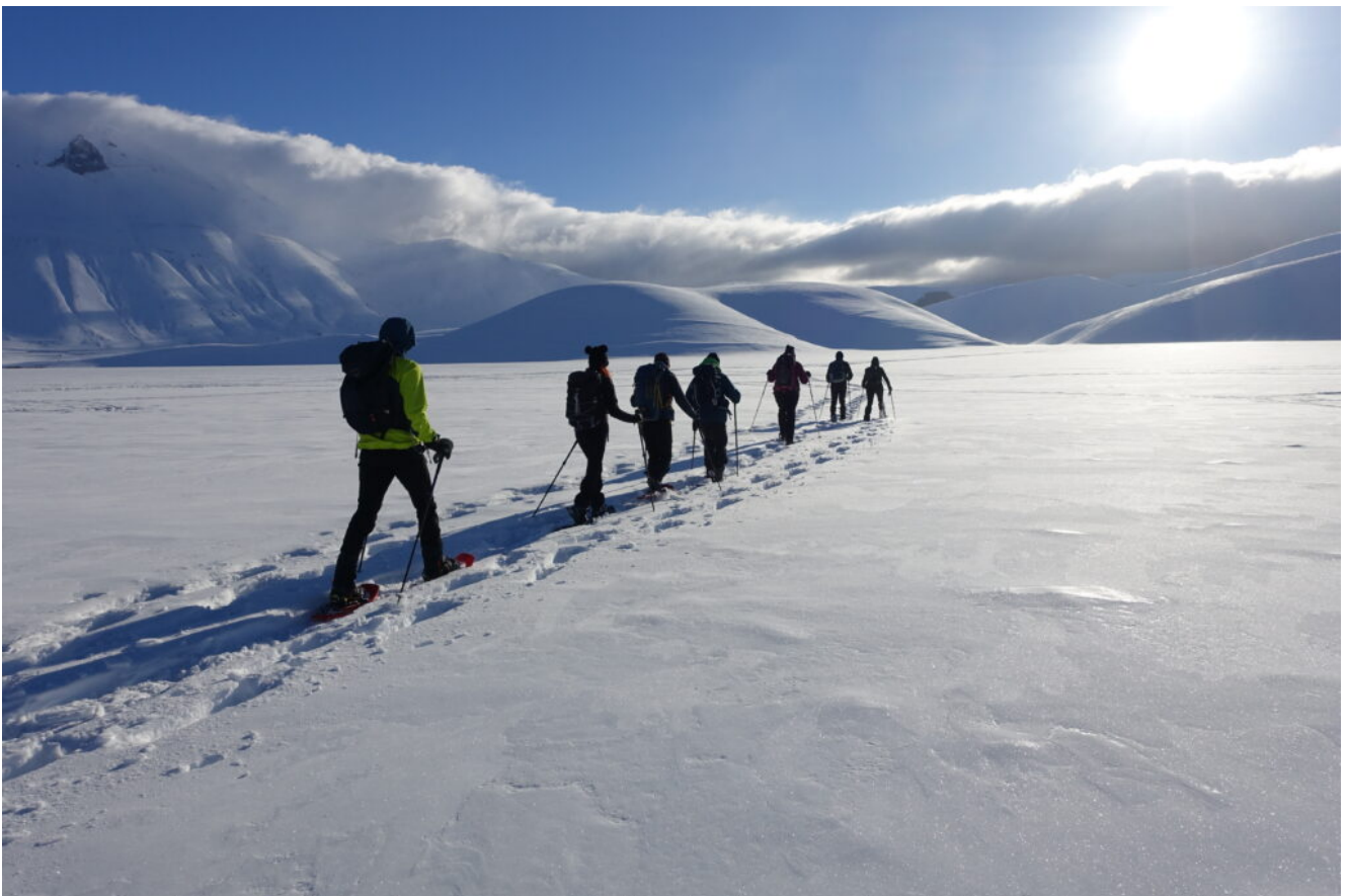
3- Spicca il colle denominato "La Rotonda" sopra alle nostre teste