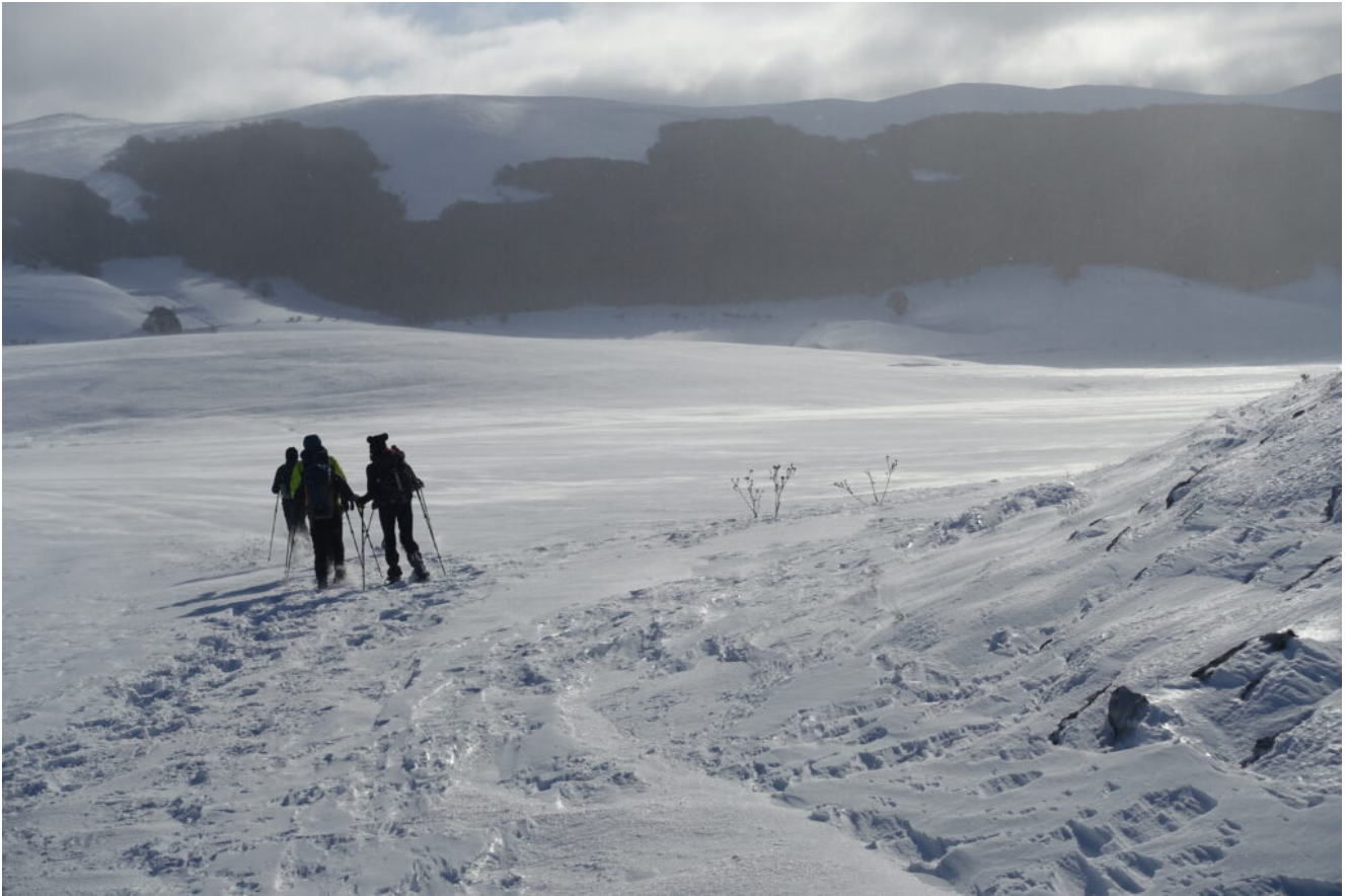
8- Girando la valle entriamo nel Pian Piccolo spazzato dal vento che solleva la neve, di fronte la Macchia Cavaliera ed il Monte Macchialta.