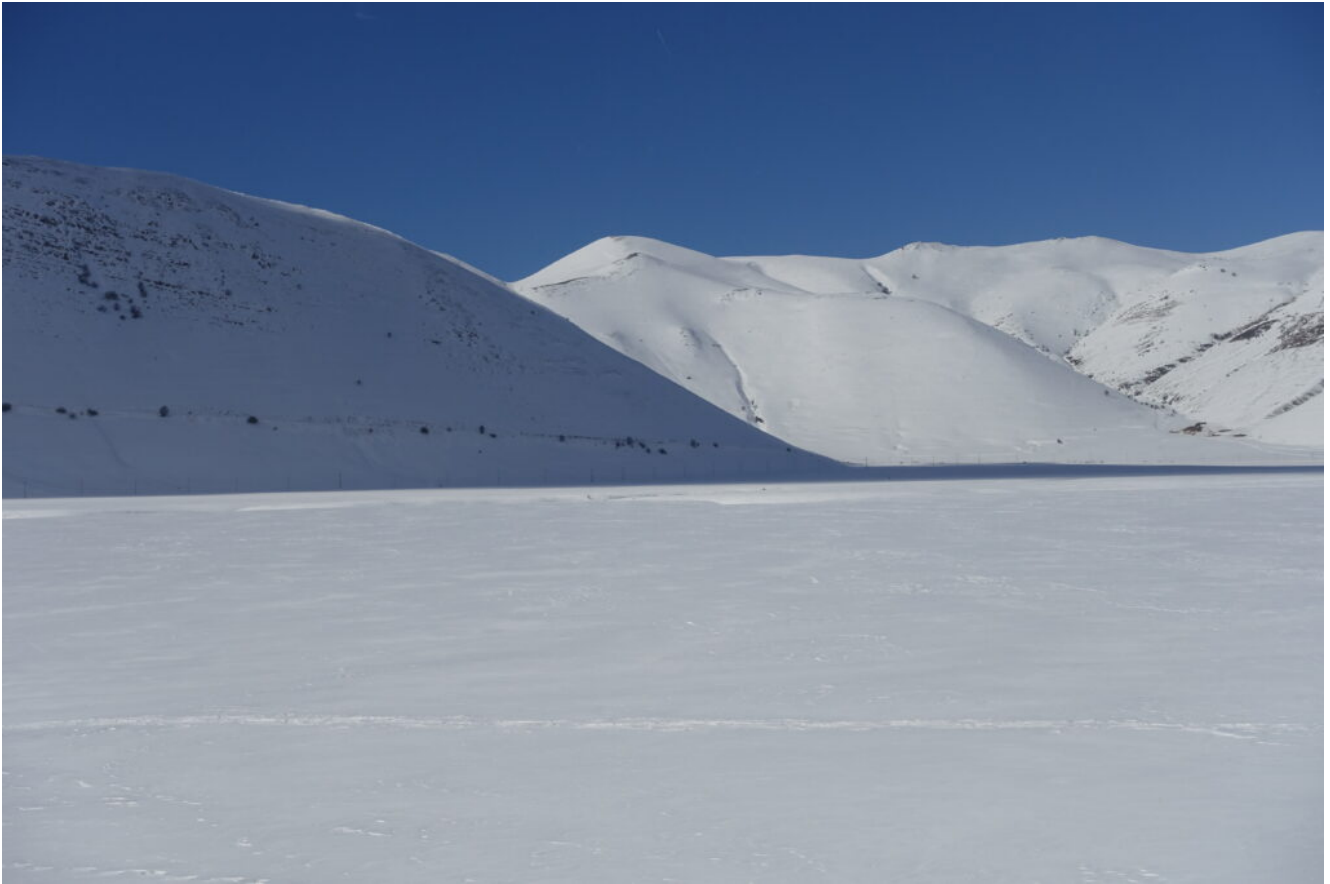
28- Il Monte Castello in ombra con la strada per Norcia.