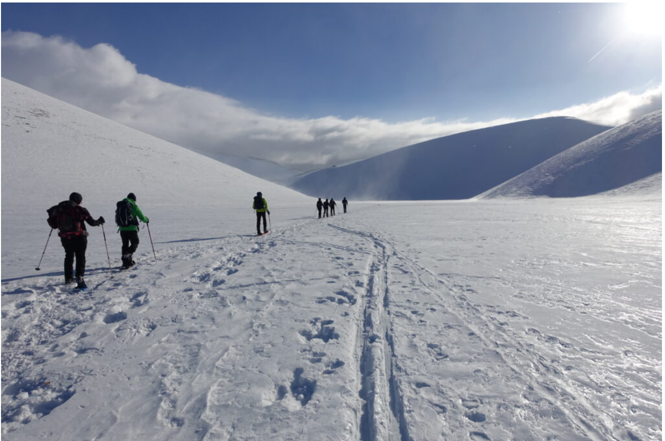
5- L'imbocco della Valle del Bonanno, sferzato da forti