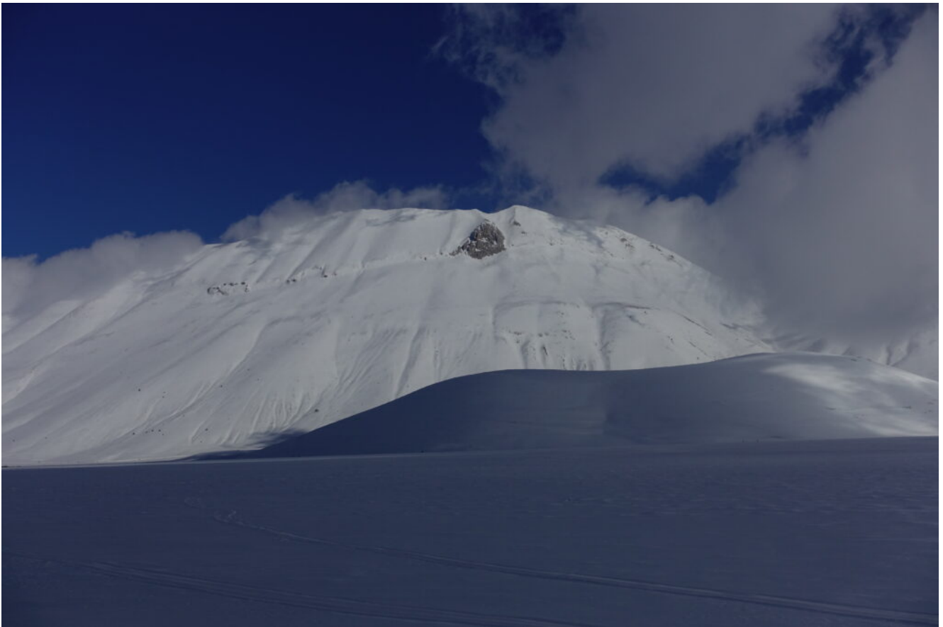
31 – 32- La Cima del Redentore a fine giornata si è scoperta dalla nebbia.