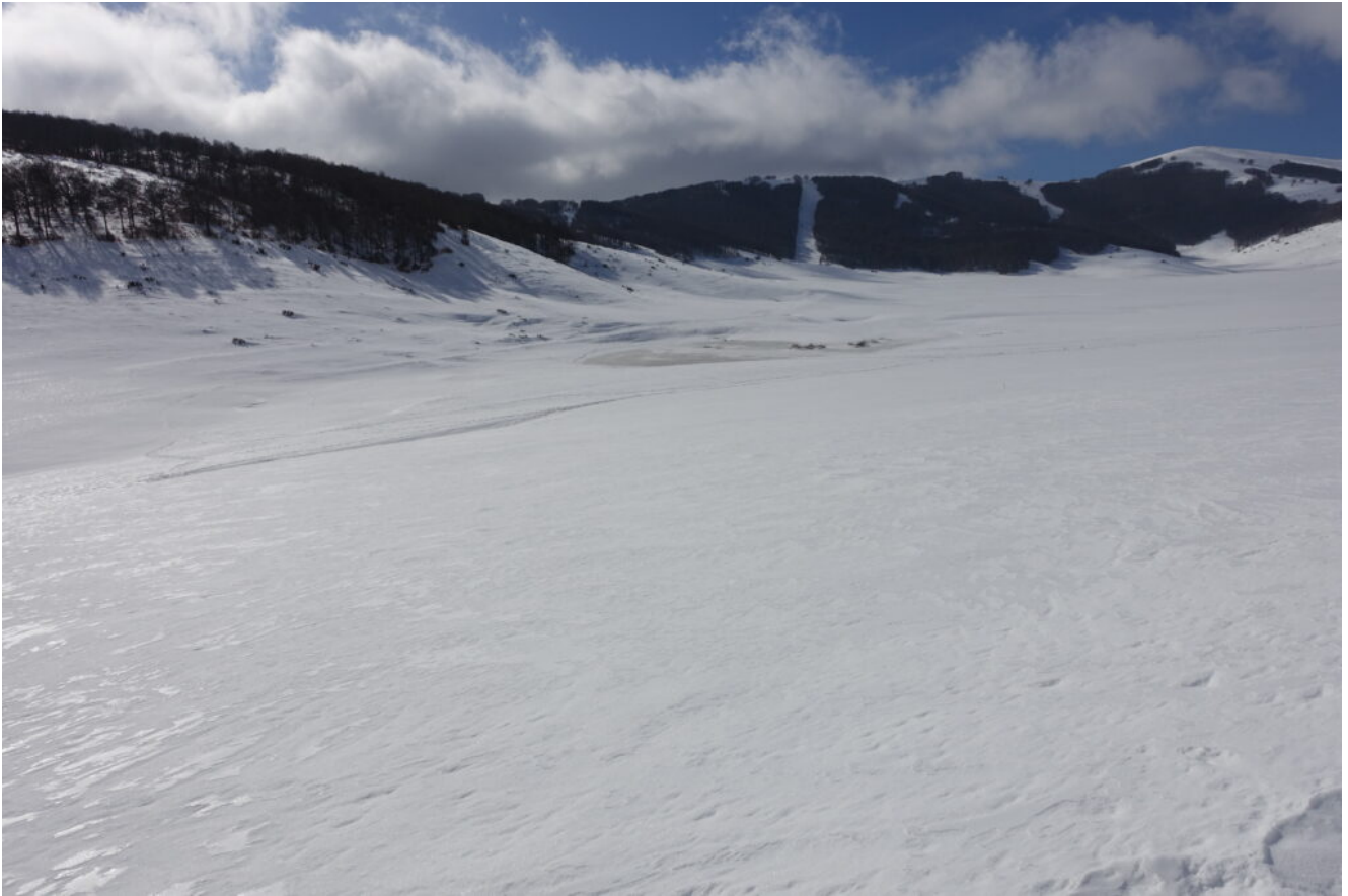
12- Il Laghetto del Pian Piccolo, con la superficie gelata ma visibile.