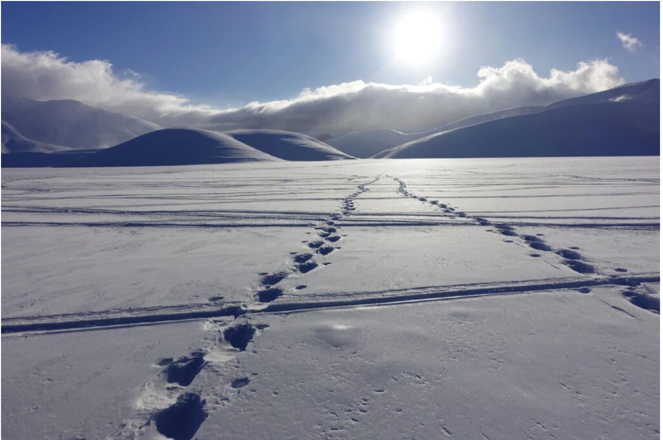
2- Direzione Valle del Bonanno.