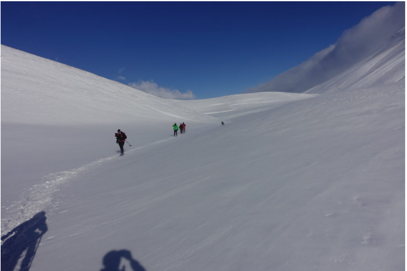
11- Il lungo Pian Piccolo.