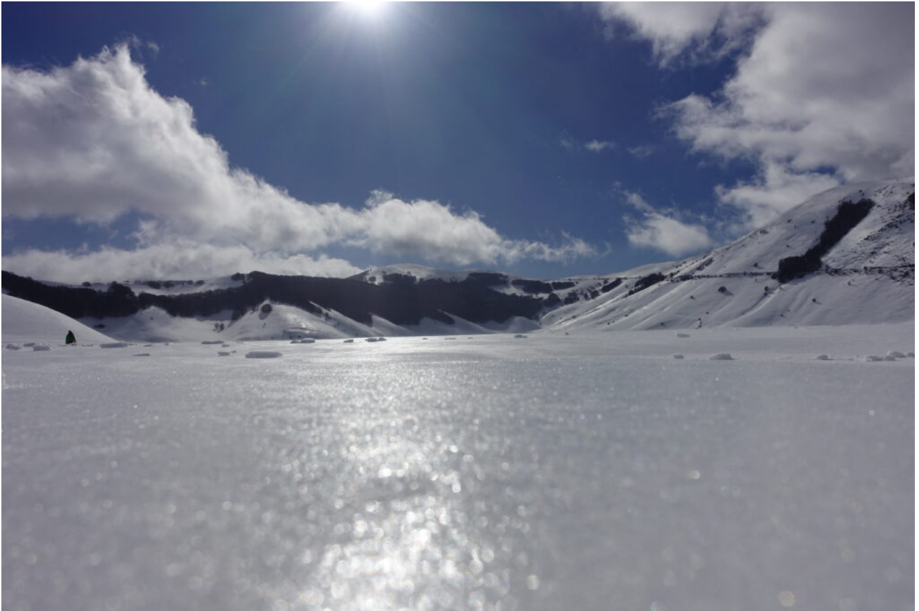
30- La parte terminale del Piano Grande verso il Fosso Mergani.