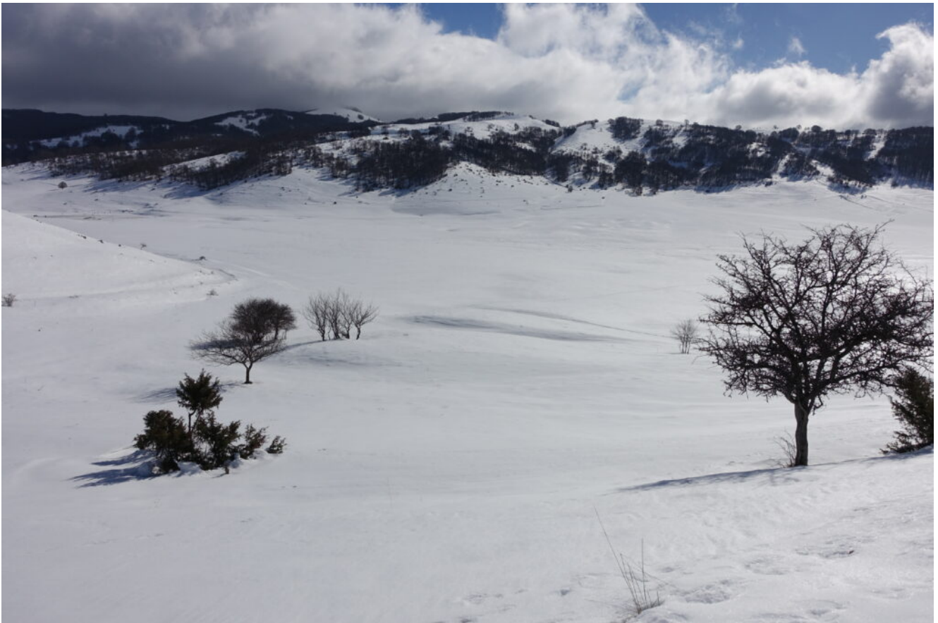
13- Il Pian Piccolo visto dalla salita per la Collina Carbonara dove sono presenti grandi esemplari di Biancospino.