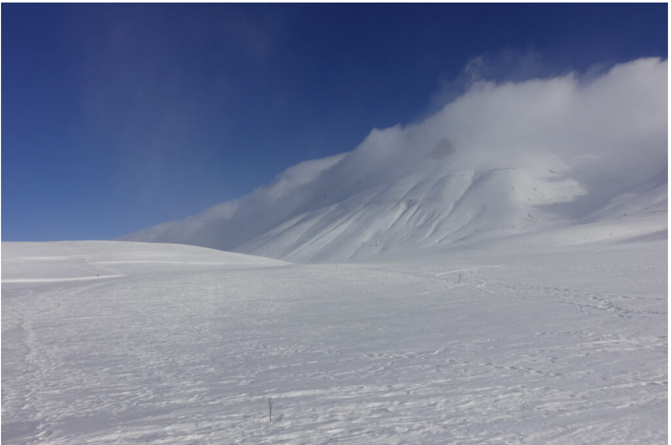
9- La Cima del Redentore vista dal Pian Piccolo.