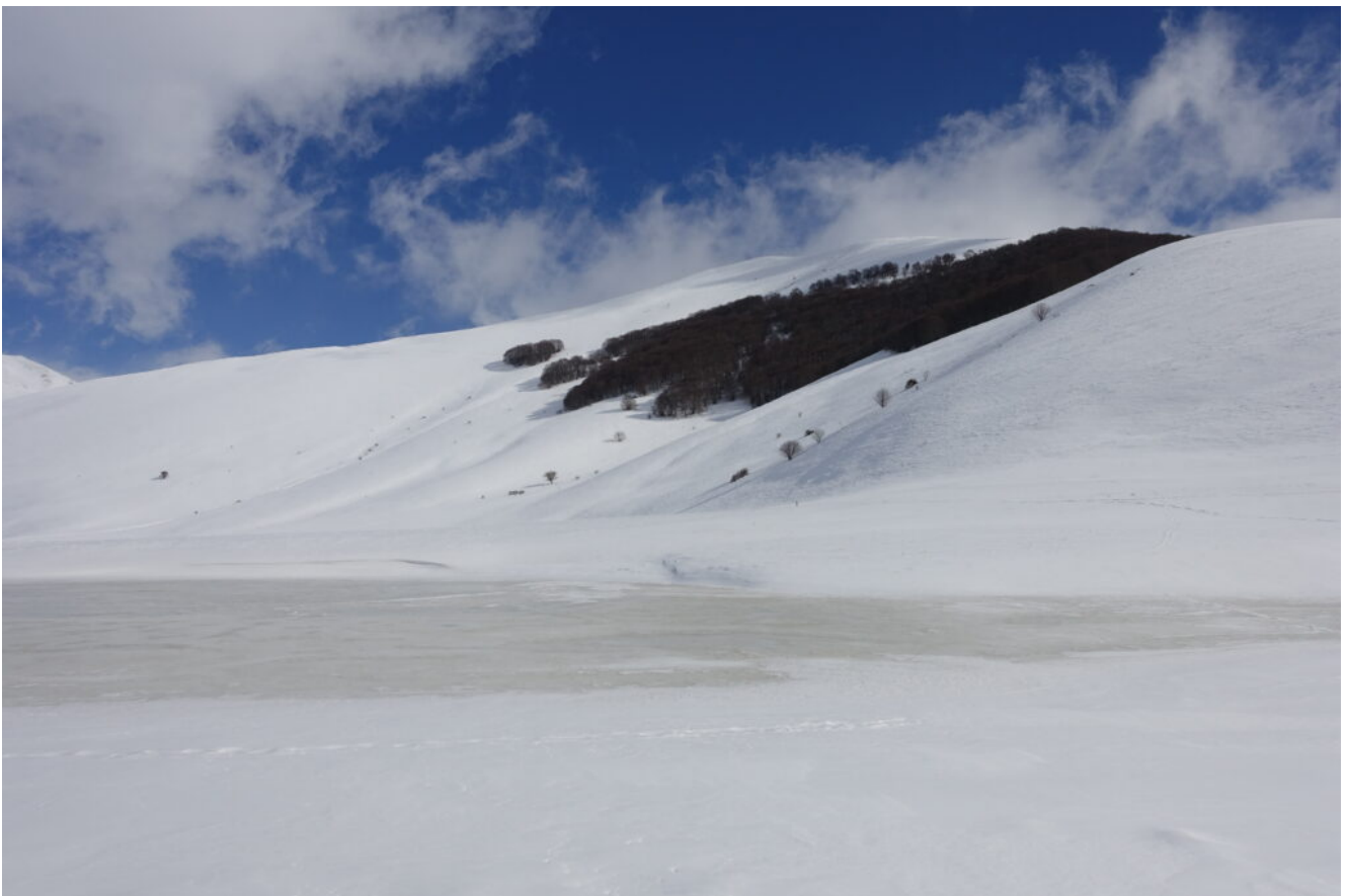
29- Il Monte Guaidone e la macchia di Costa Faeto con il lago temporaneo gelato