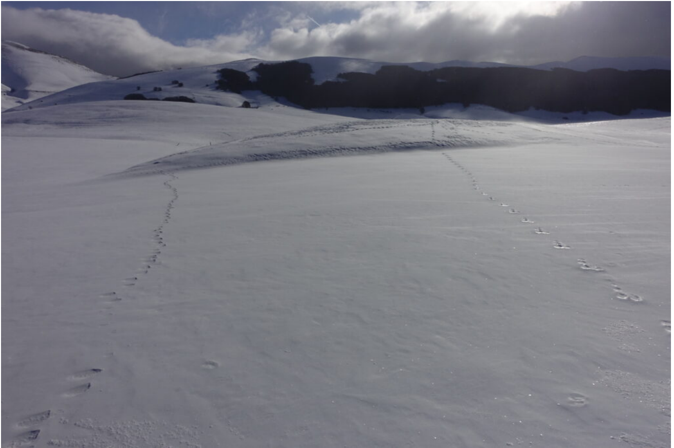
10. Orme di Volpe a sinistra e Lepre a destra nel Pian Piccolo.