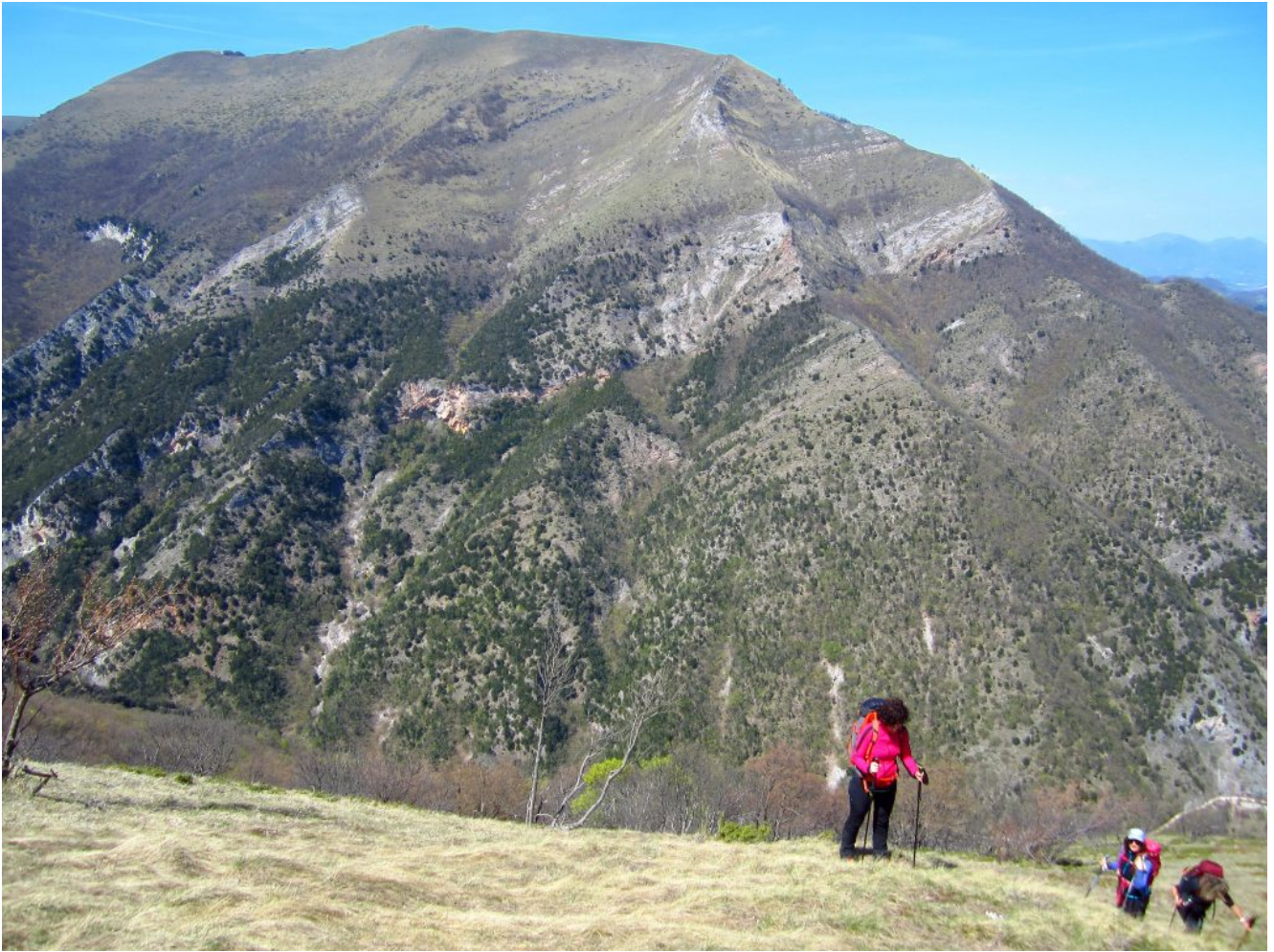
19- Il versante Sud del Monte Coglia