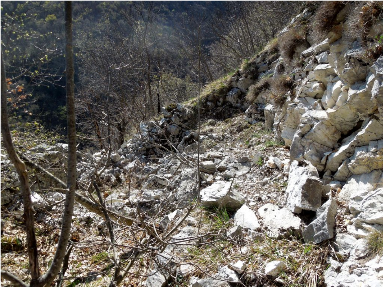
12- Lo scavo presente a monte del canale, poco prima dell'imbuto di Buggero, dove probabilmente veniva preparata la calce necessaria per le opere murarie del canale .