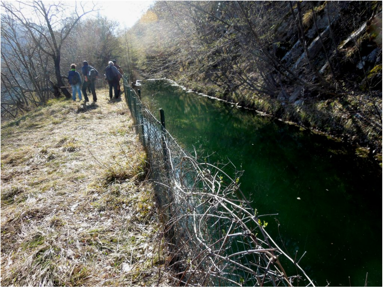
2- Il canale di accumulo nel tratto scoperto..