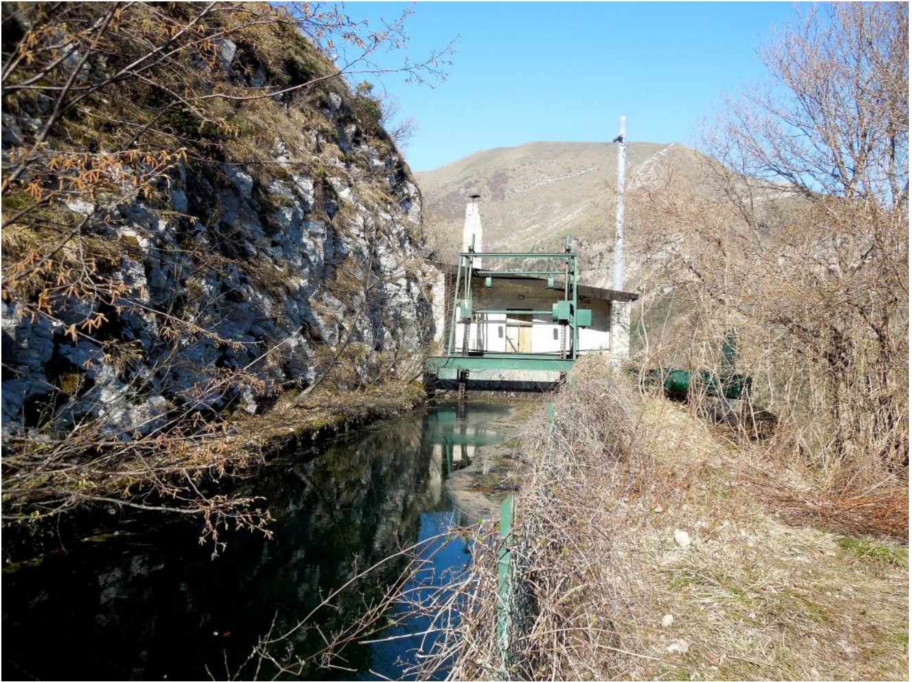
1- La Casetta Piemà dove termina il canale di accumulo e inizia la condotta forzata della centrale di Bolognola.