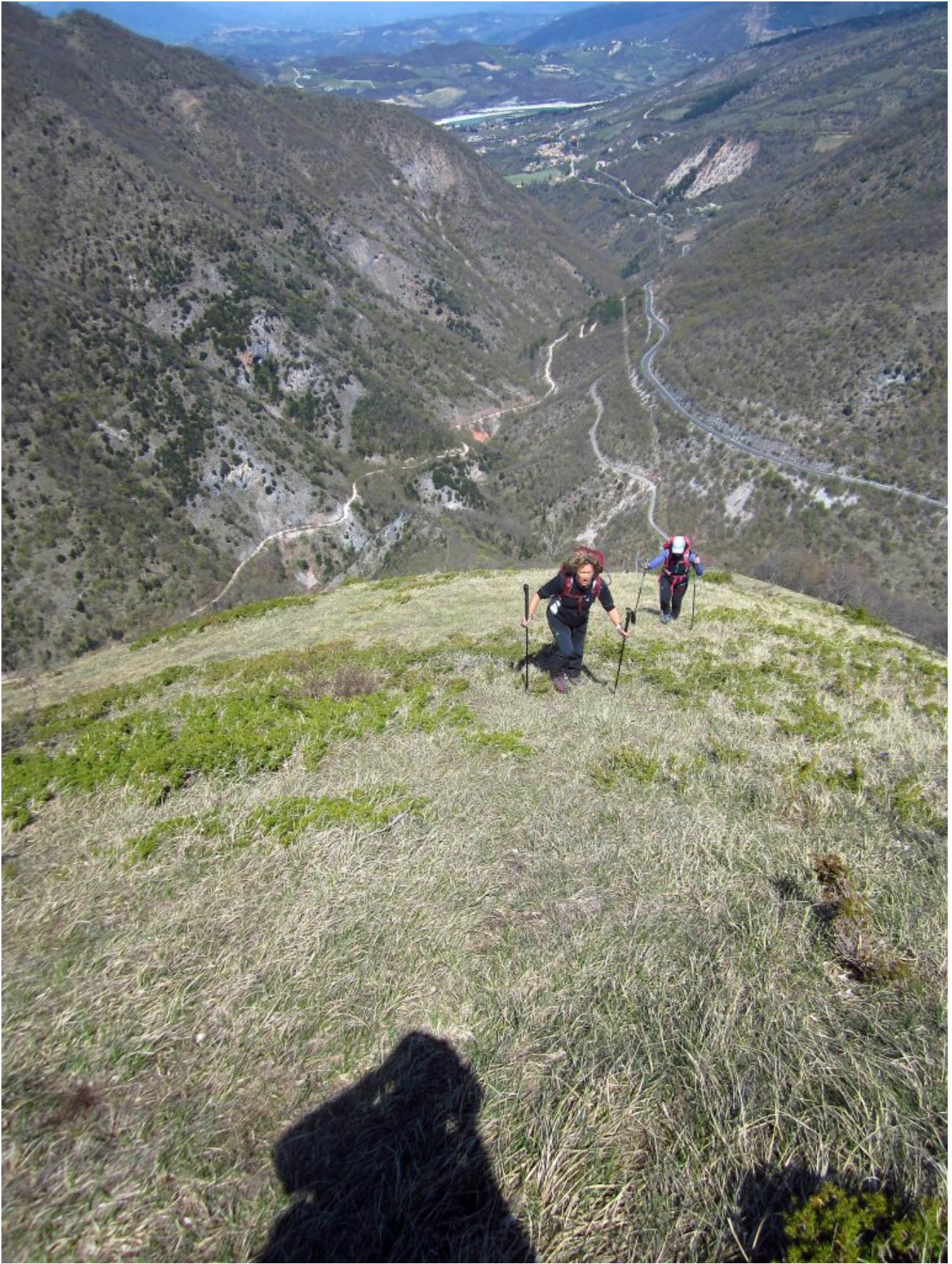
18- Dalla Casetta Piemà saliamo verso il Puntone Piemà da dove si ha una veduta centrale della Valle del Fiastrone da Bolognola al Lago di Fiastra.