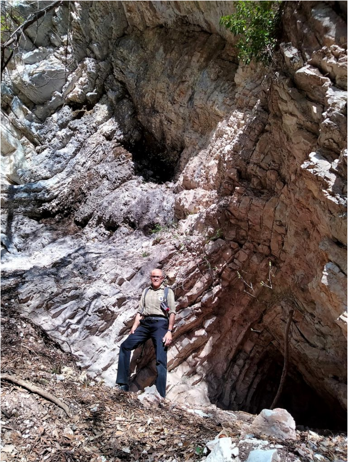
8 - 9 - 10 - 11- La seconda grotta più piccola ma più profonda.