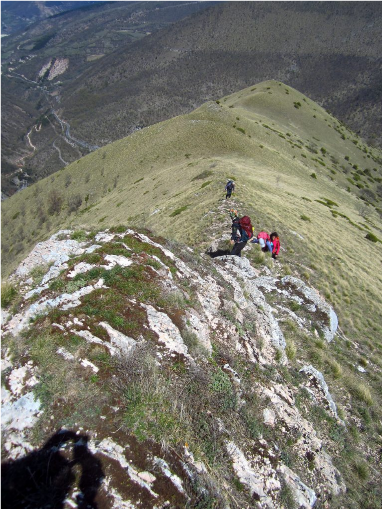
25- L'area cresta rocciosa di Scaglia Rossa de La Costa dei Frati, a sinistra si nota la strada di breccia che scende a Rio Sacro e quella sopra parallela asfaltata che conduce alla Centrale idroelettrica mentre sopra a tutte la strada Fiastra-