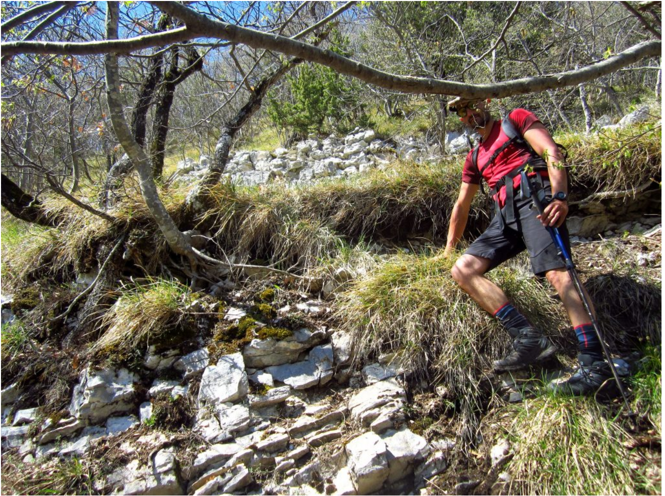
13- Il muretto a secco che delimita lo scavo della foto n.12, visto dal canale.