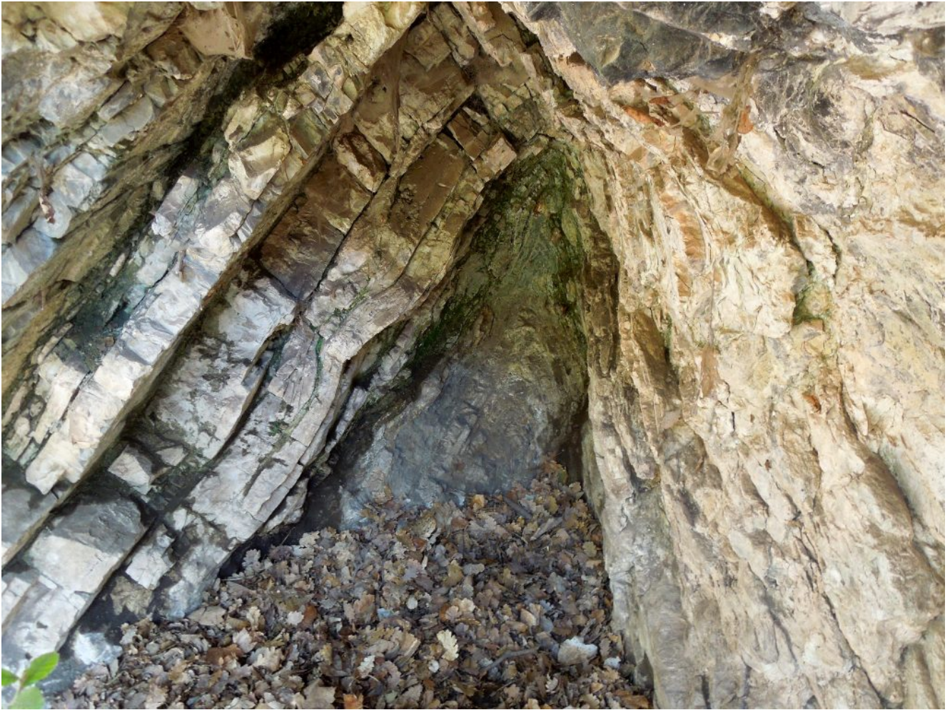
11- (Ph. Manuel).