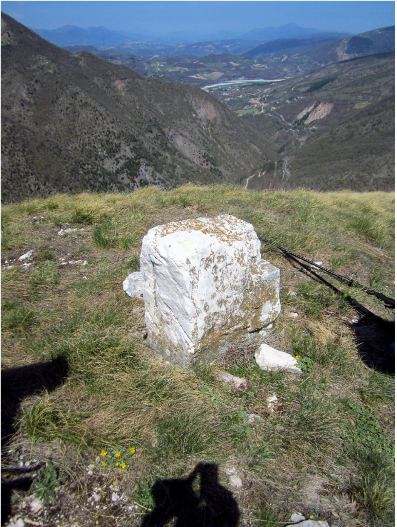
20 -21 – Il “Termine” di Bolognola, cippo di calcare sulla cima del Puntone Piemà che segna il confine tra Bolognola ed Acquacanina.