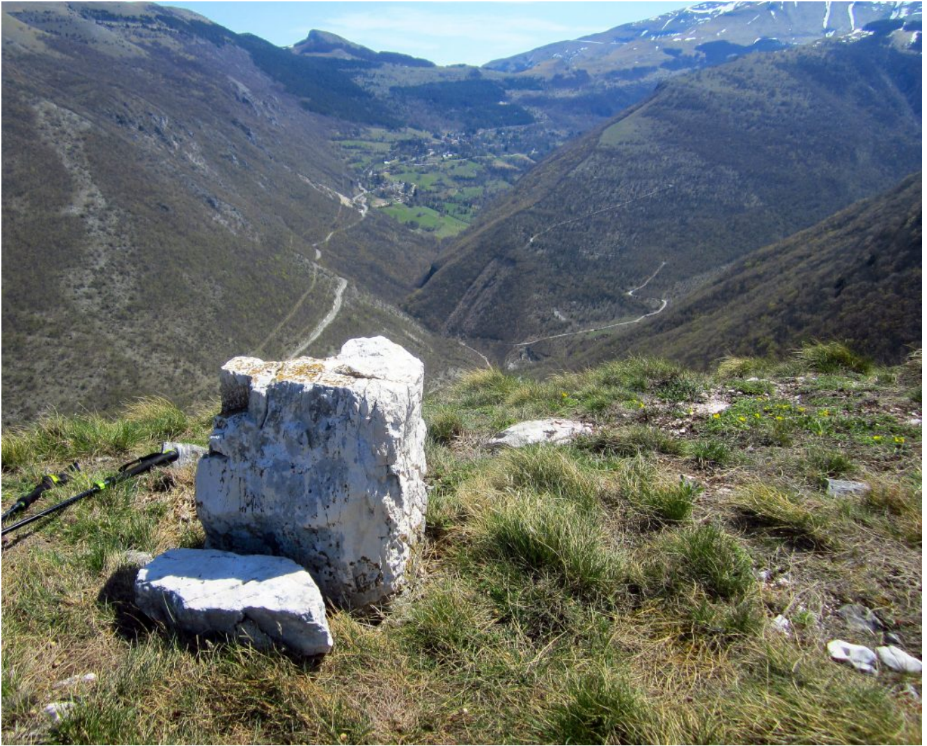
21- Veduta di Bolognola