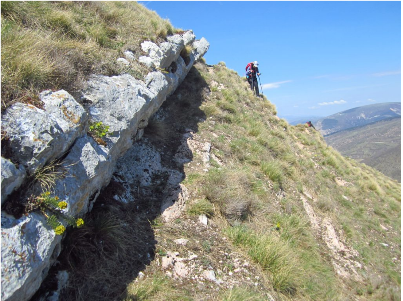
27- Le rocce da cui forse proviene il cippo del Puntone Piemà.