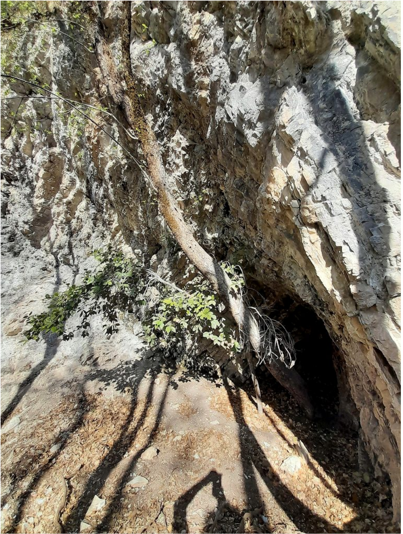
5- Dettaglio della prima grotta.(Ph. Alicia).