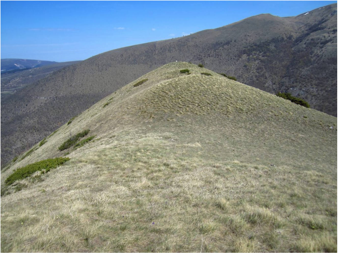
22- Il Puntone Piemà con il "Termine" di pietra.