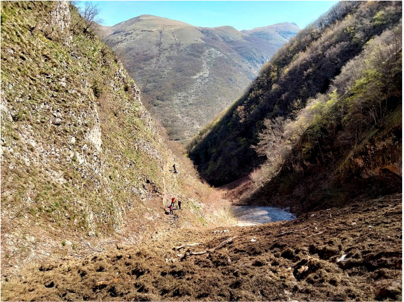
16- Il canale visto dalla sommità del cumulo di neve (Ph. Francesco).