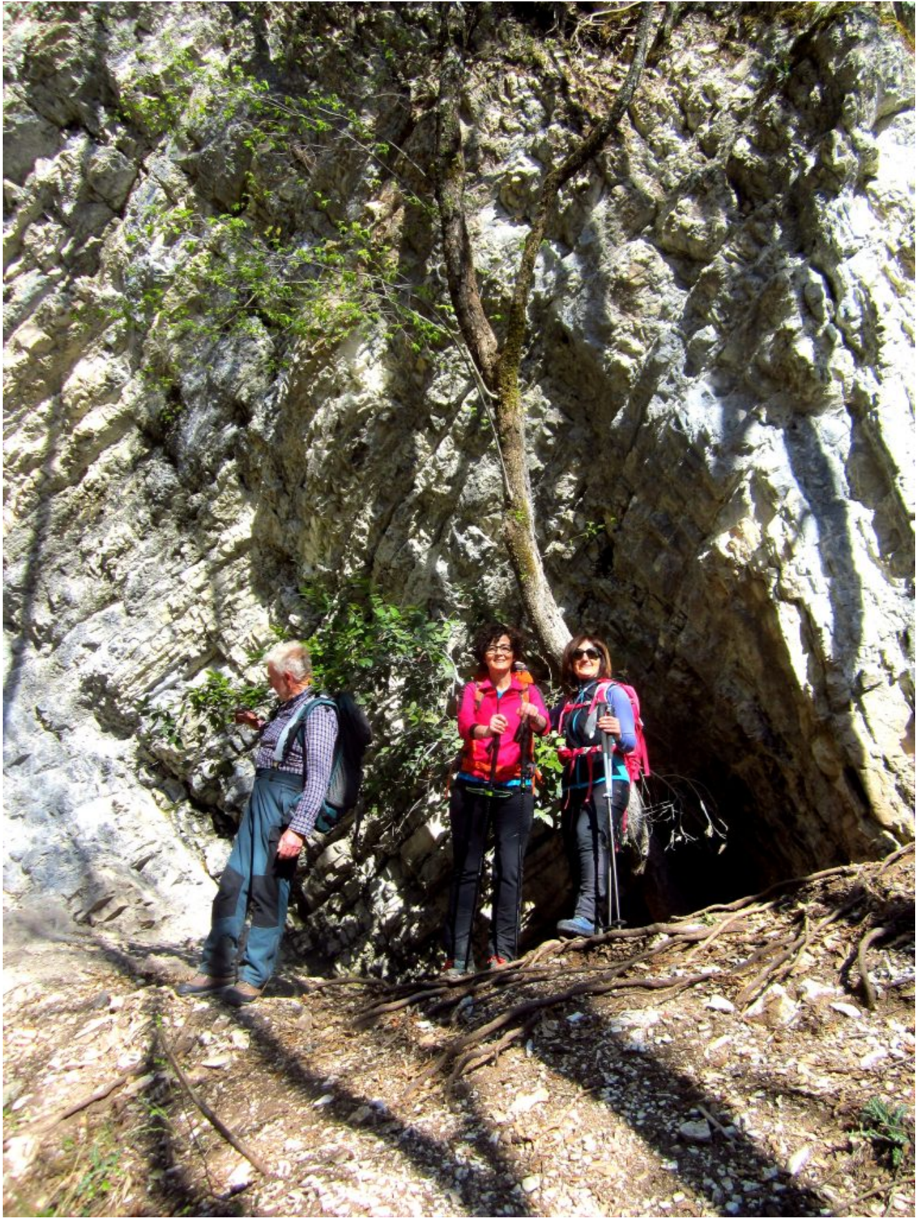
6- Le dimensioni della prima grotta.