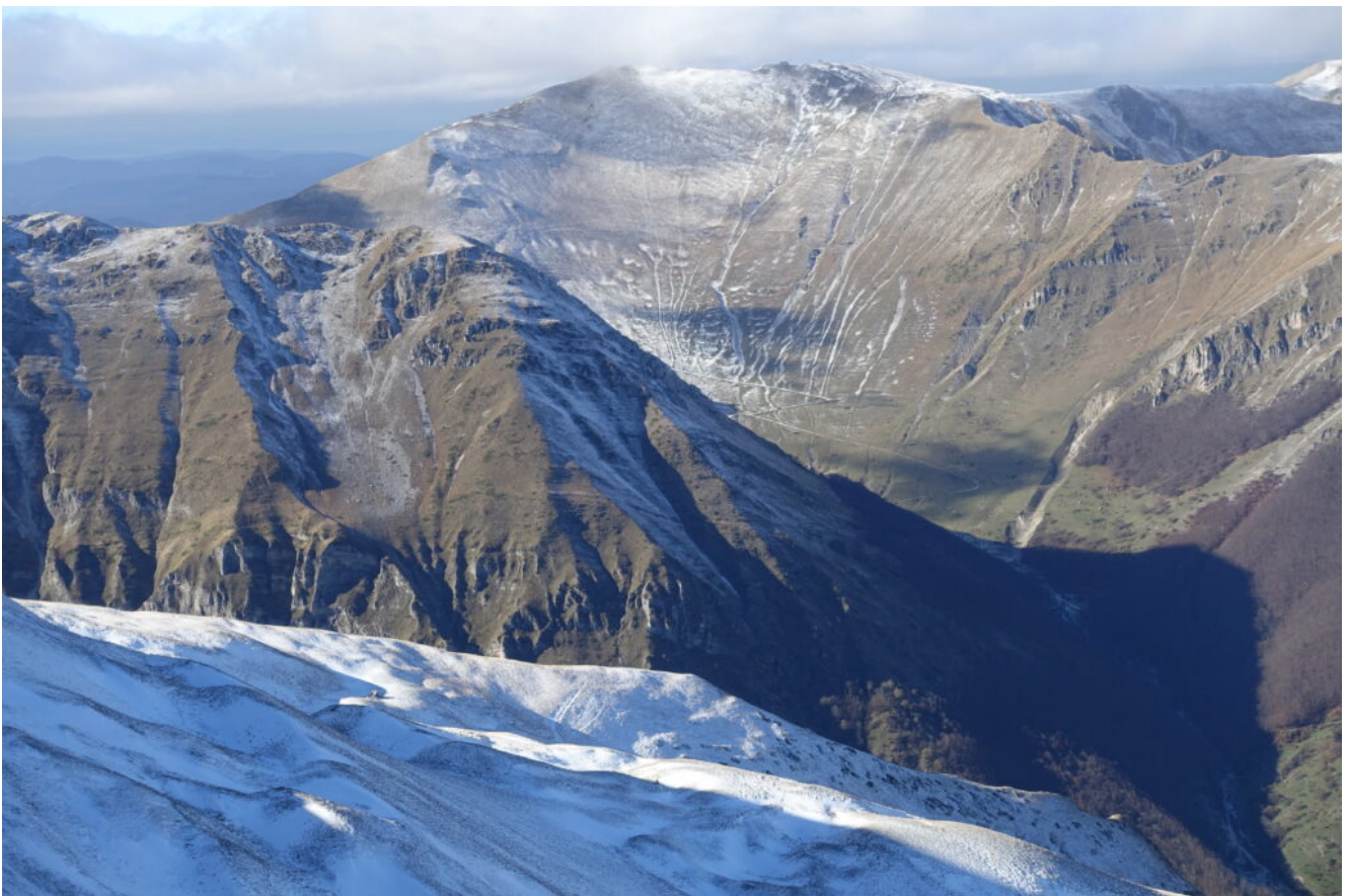
31- Il Monte Bove Sud e Cima Cannafusto più in basso.