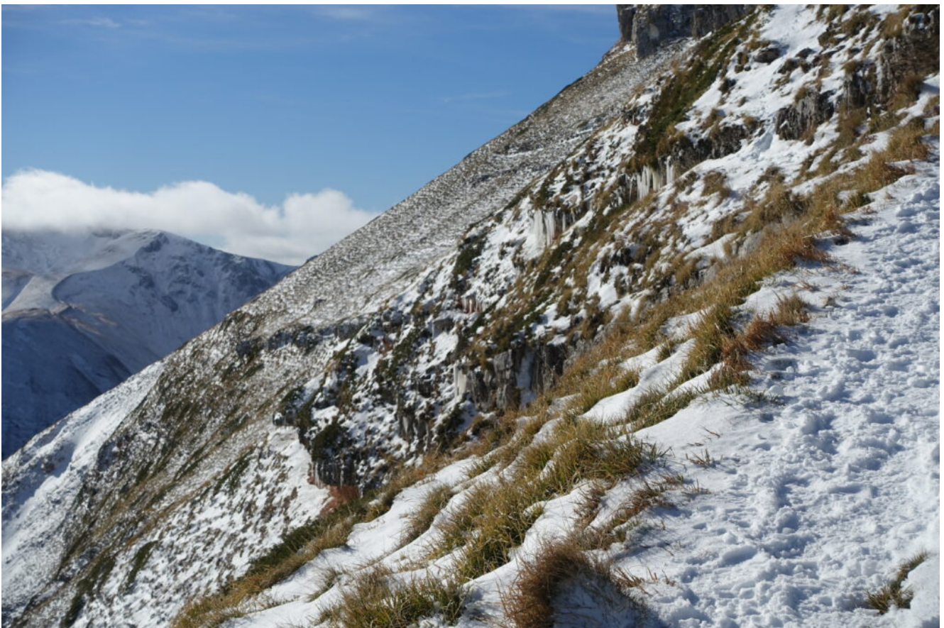
21- Colate di ghiaccio nel versante Est del Monte Sibilla.