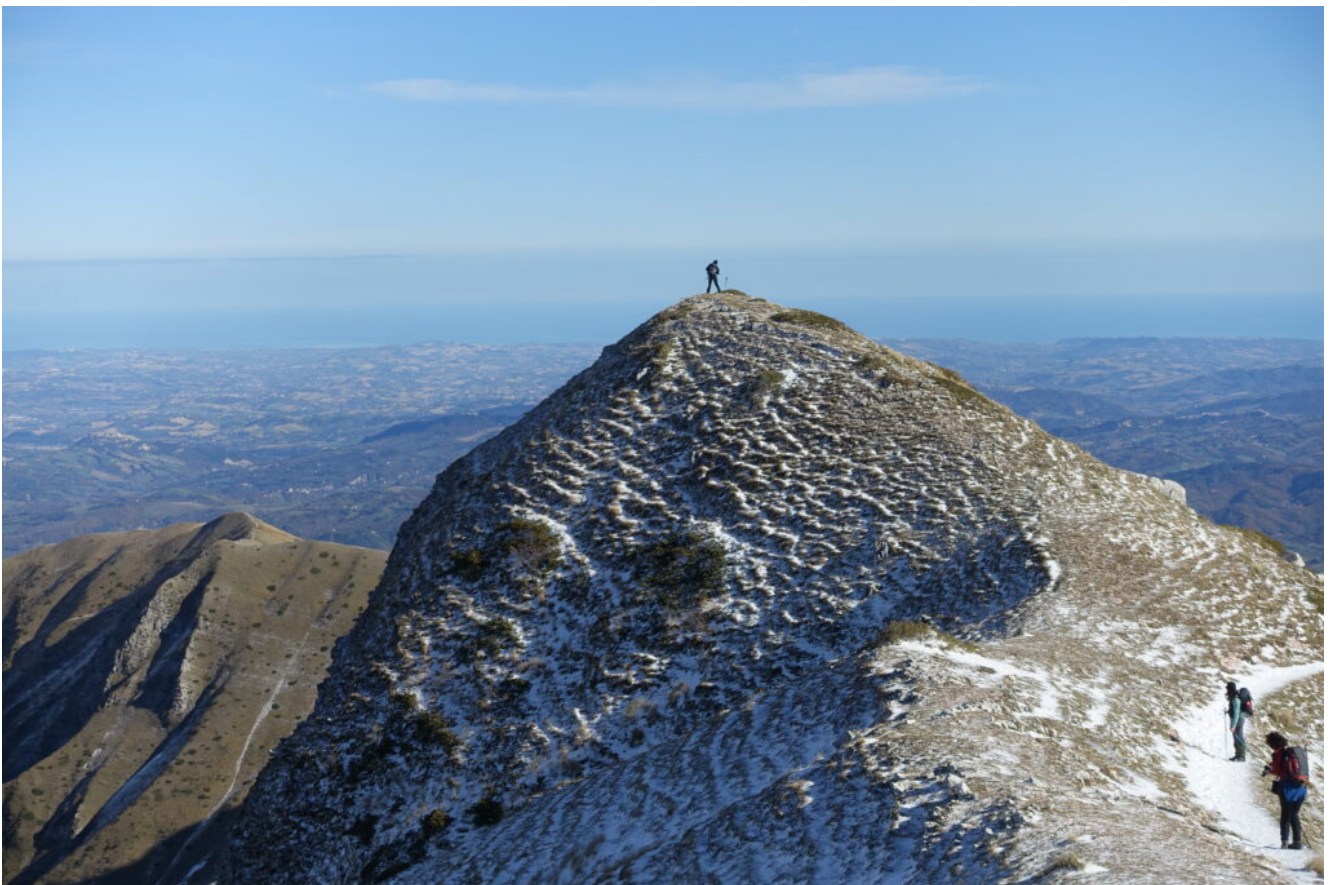
19- Con Paolo rimasto indietro.