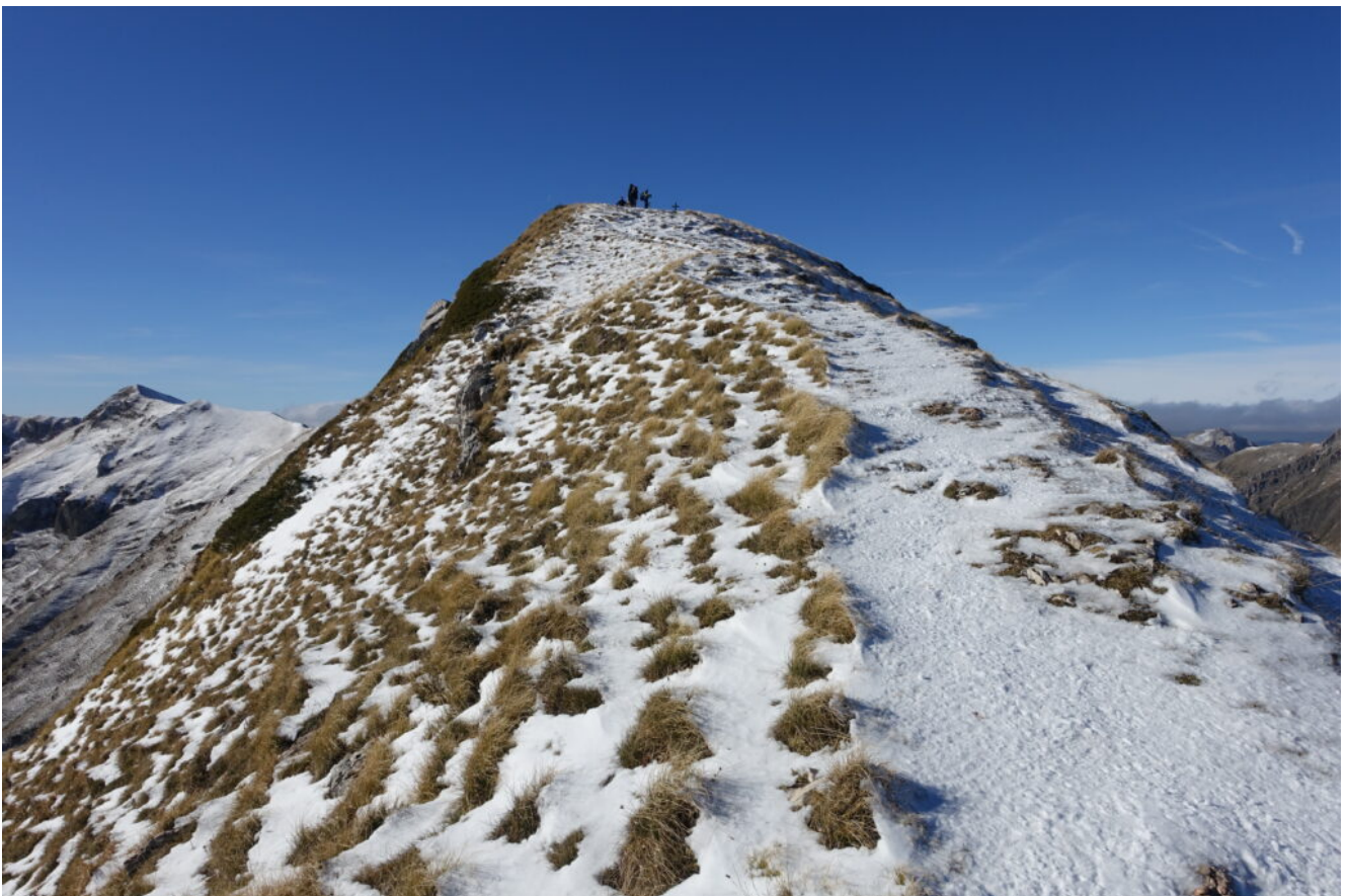
23 – 28- Nelle due cime del Monte Sibilla.