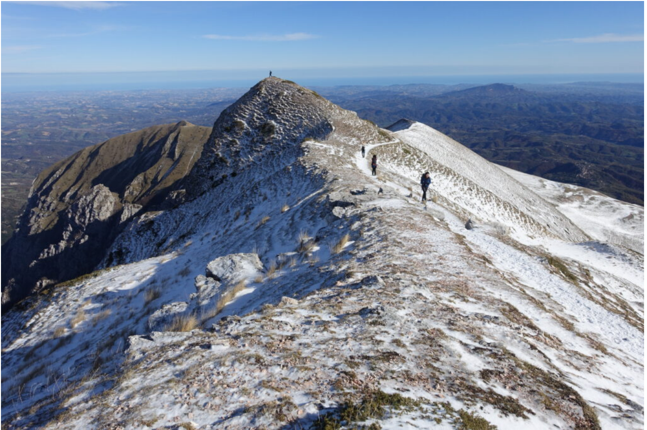
18- Veduta verso il Mare Adriatico.