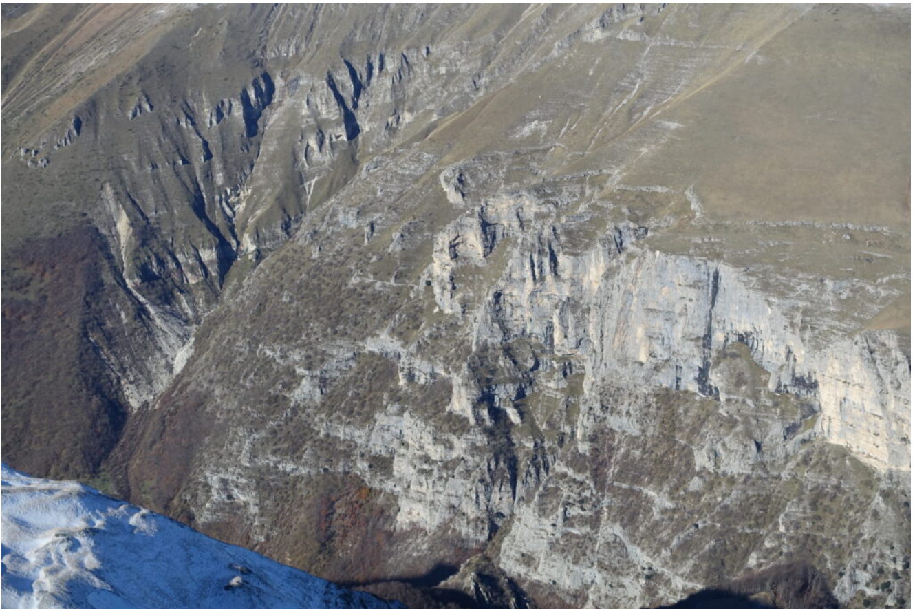
33 – 34- La cengia delle Ammoniti sopra ai Grottoni e la Cengia delle Capre alla base dei Grottoni.