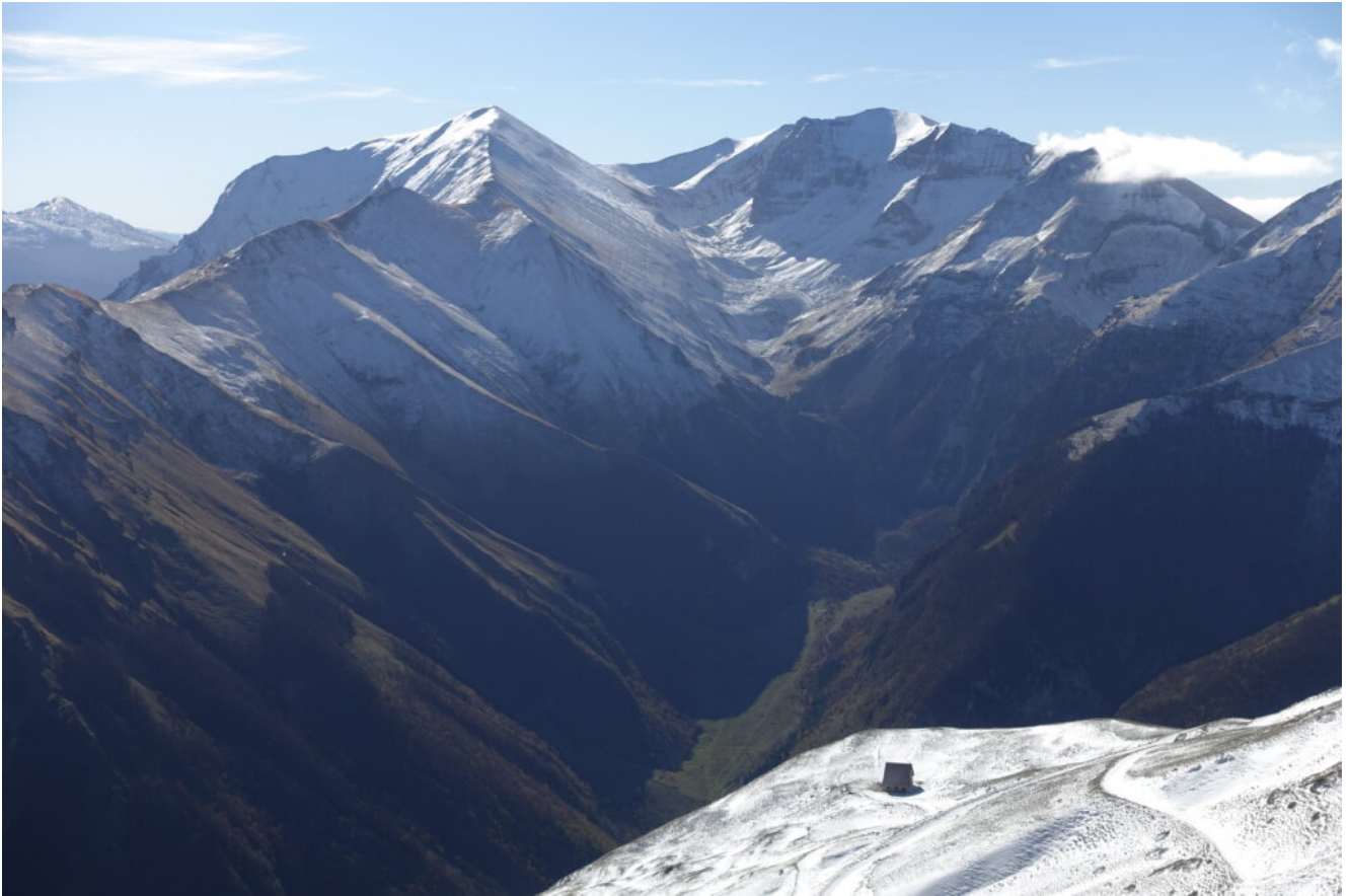
16- Il Monte Vettore a sinistra, la valle di Pilato e la Cima del Redentore a destra.