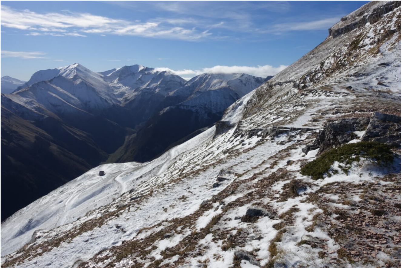
20- Il Casale della Banditella.