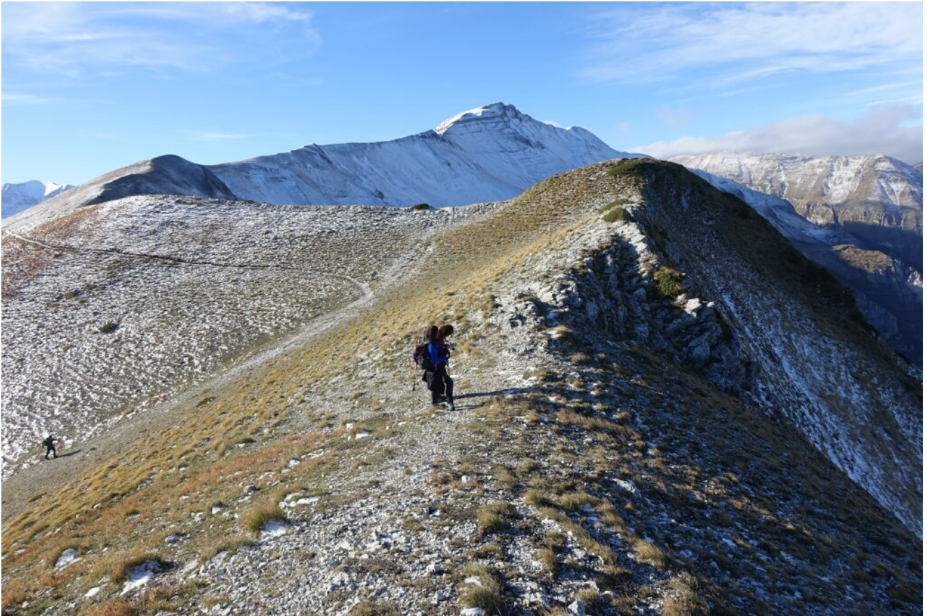
2- La sella del Monte Zampa.