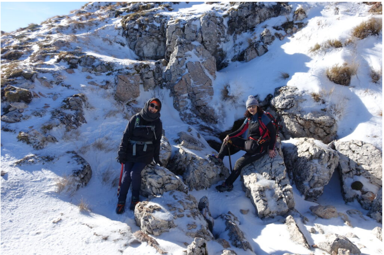
37- La Grotta della Sibilla o delle Fate.