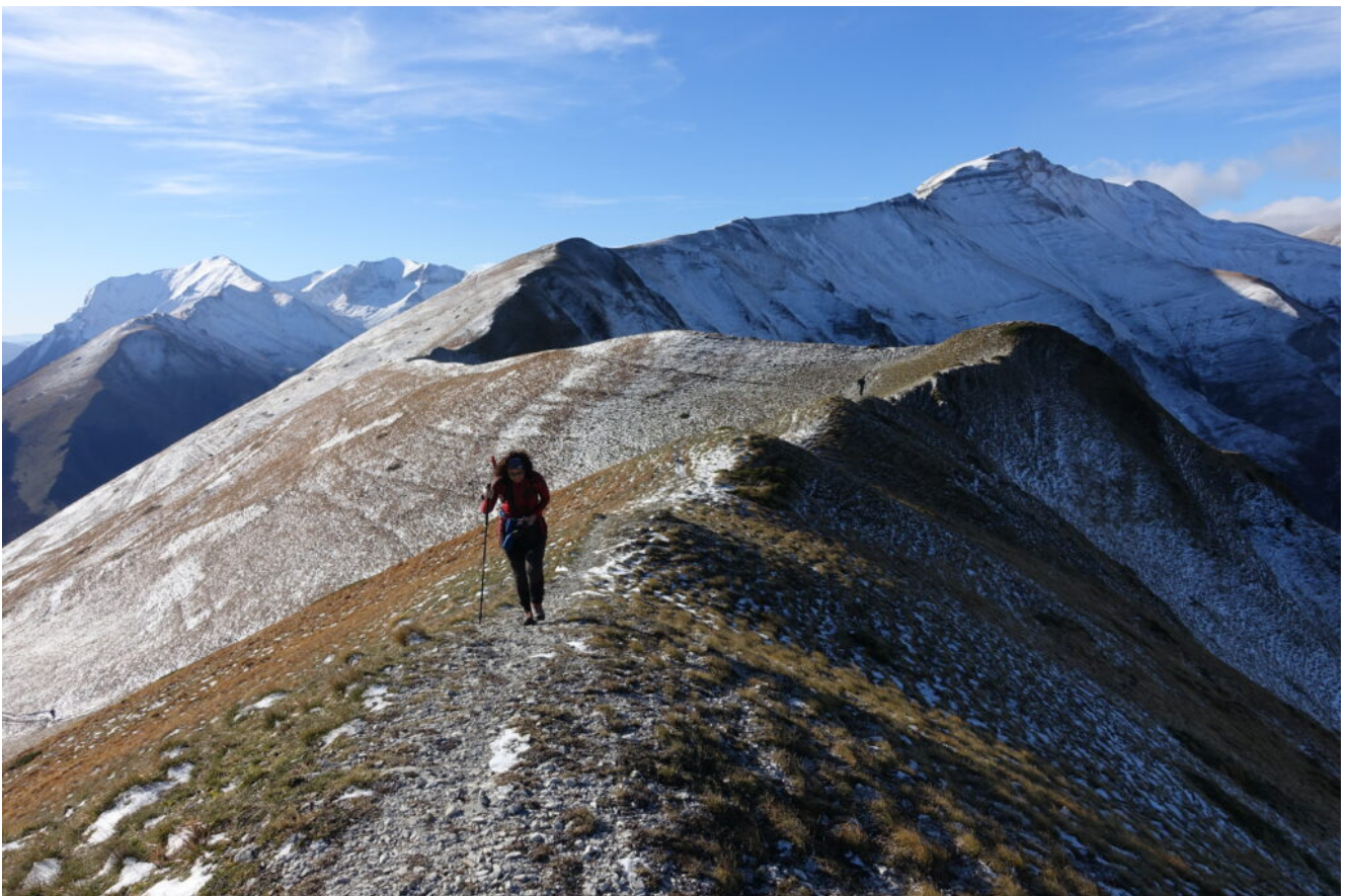
3- Ci dirigiamo verso la cima del Monte Zampa.