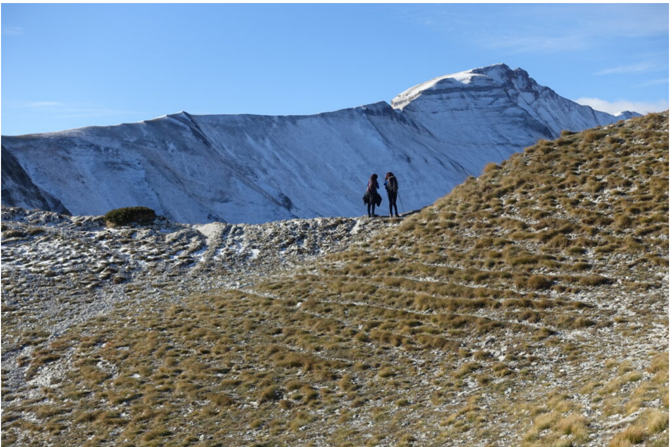
5- Riprendiamo la cresta per il Monte Sibilla.