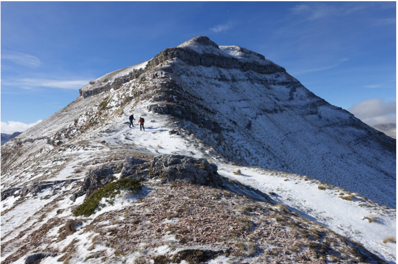
17- Giunti in prossimità della "Corona" dove è presente il tratto attrezzato con catene.