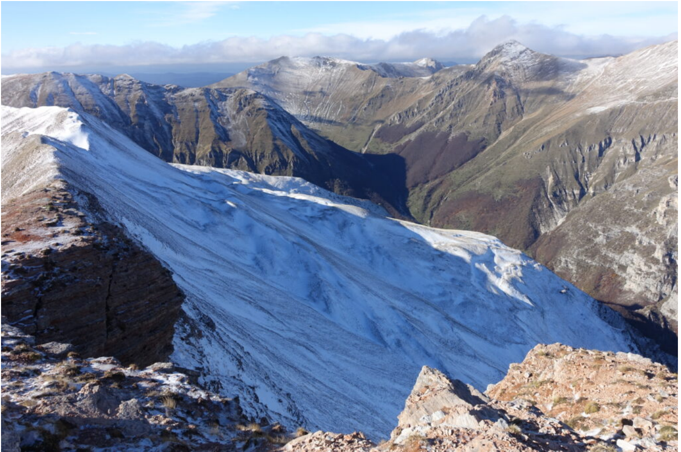
30- Il pendio Nord del Casale della Sibilla.