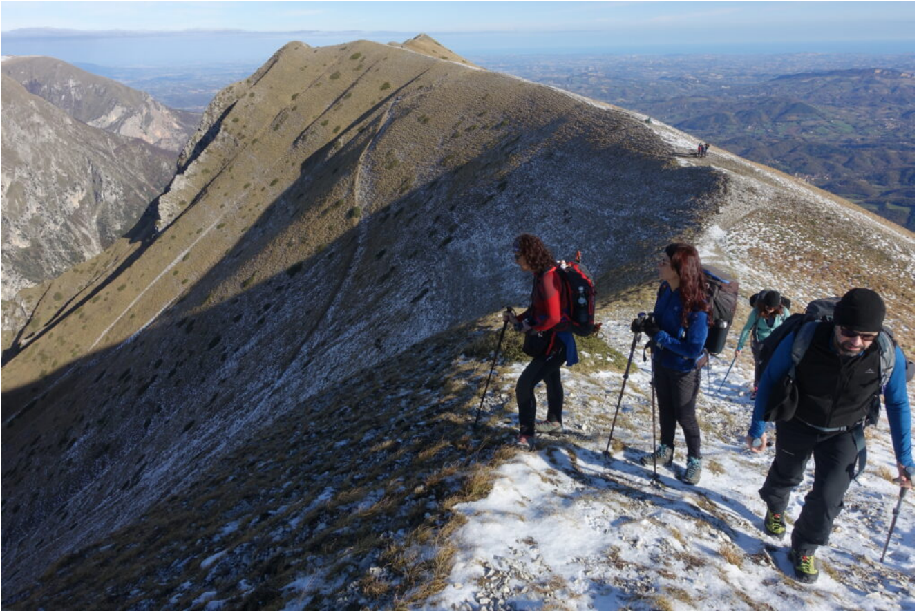
6- Il Monte Zampa con il sentiero che scende nel versante Nord per gli imbuto di Meta-Le Vene.