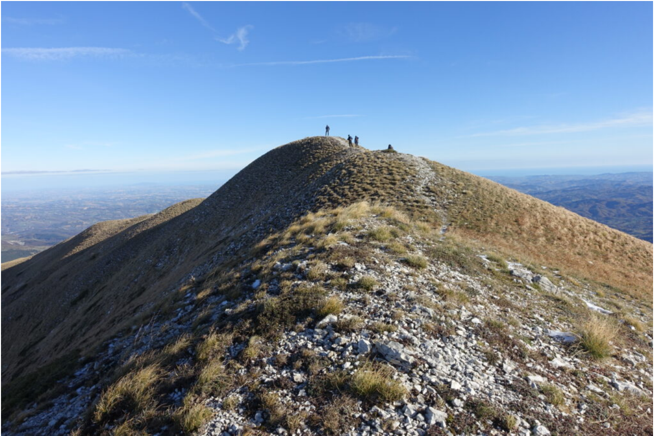
4- In cima al Monte Zampa.