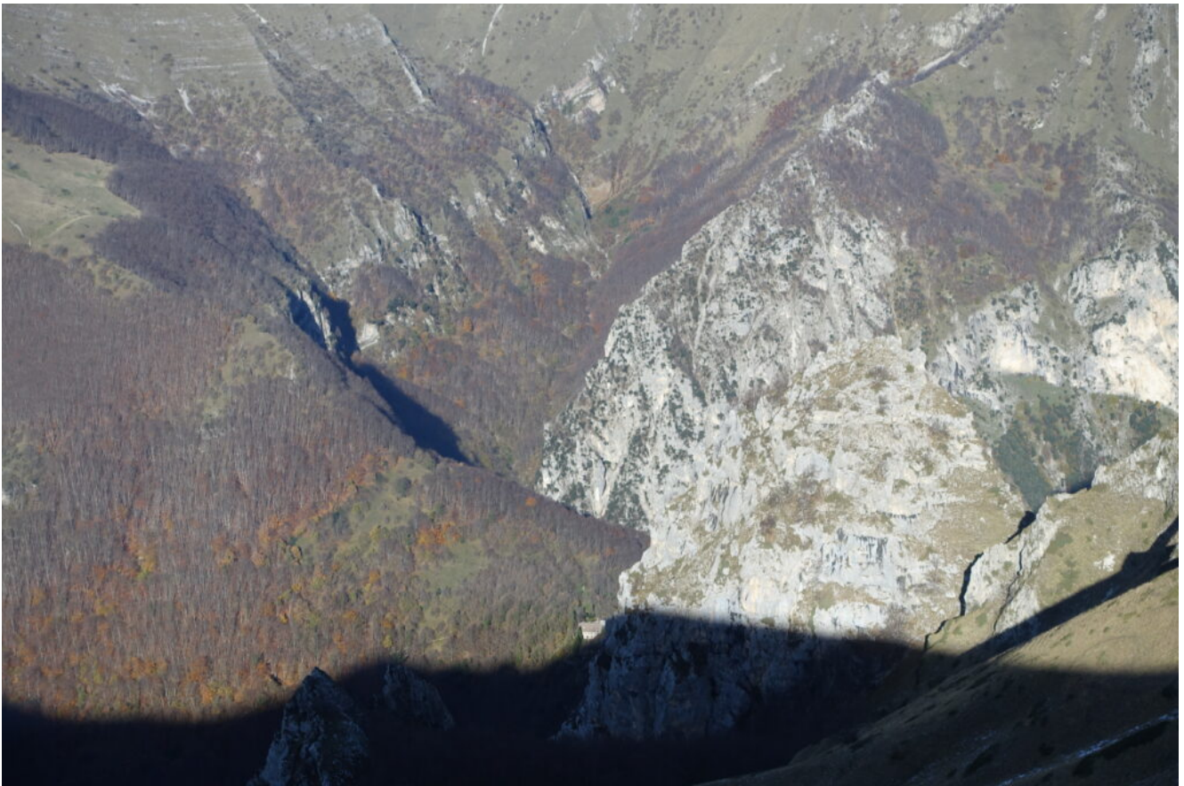
7- Il Romitorio di San Leonardo appena illuminato dal sole con il Fosso del Rio a monte.