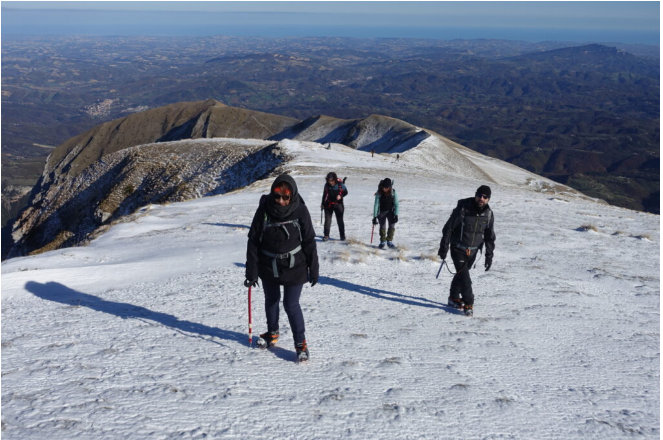
22- Il plateau sommitale del Monte Sibilla.