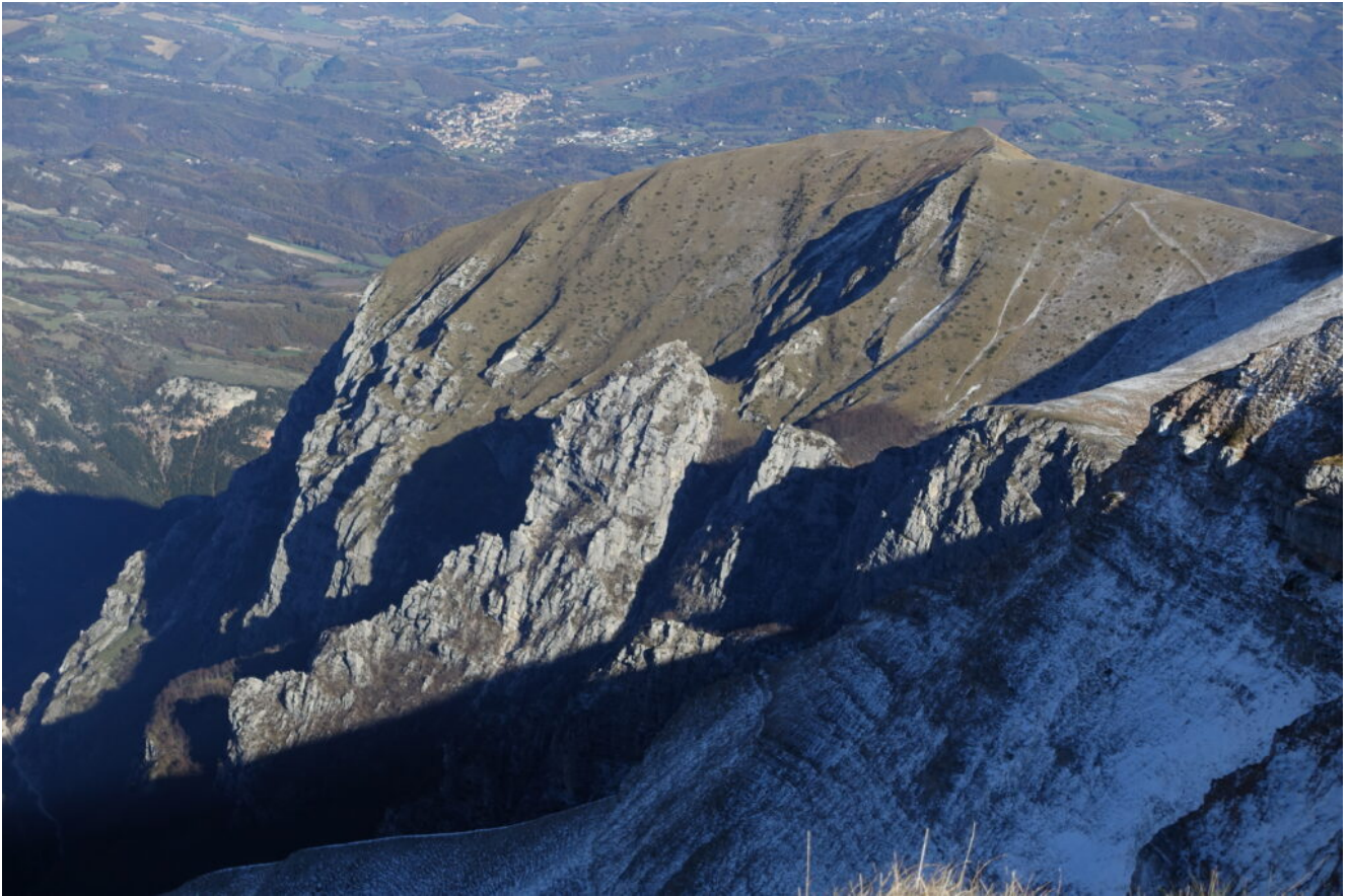
36- Il Monte Zampa con i Torrioni di Meta.