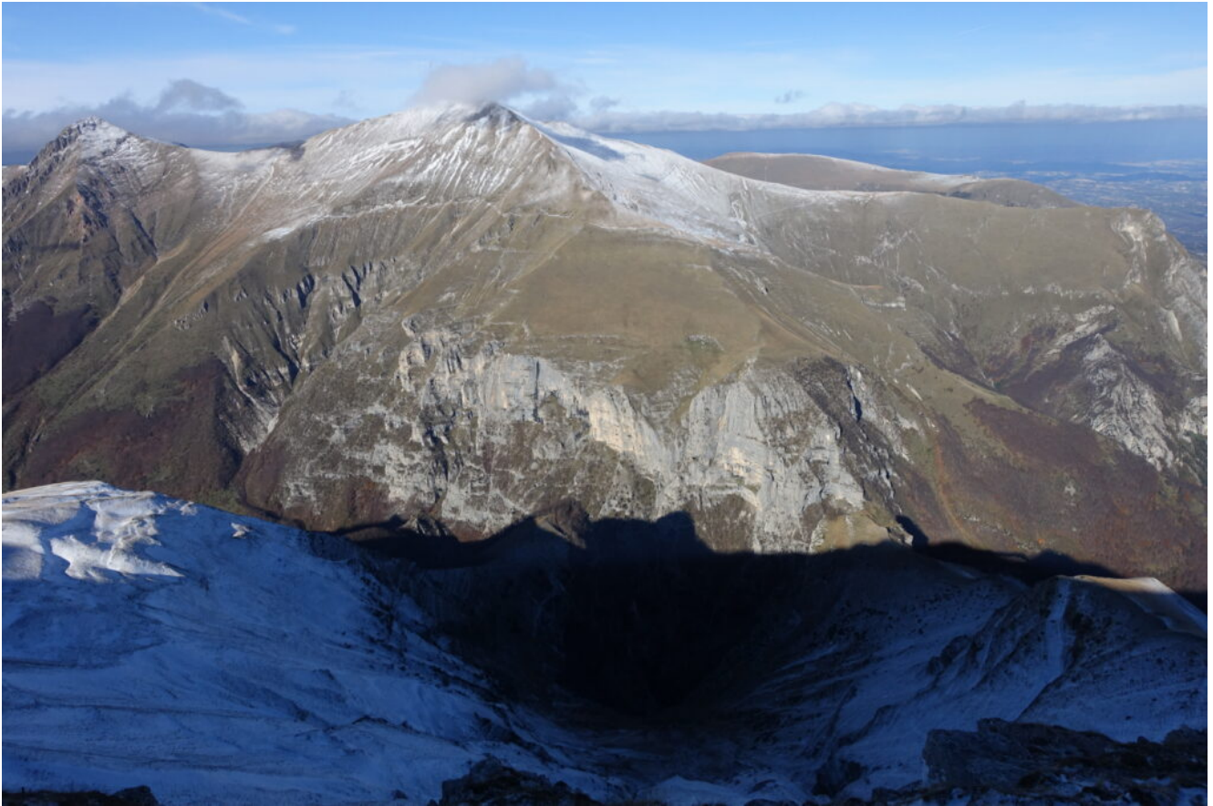
32- Il Pizzo Berro a sinistra, La Priora al centro e Il Pizzo a destra.