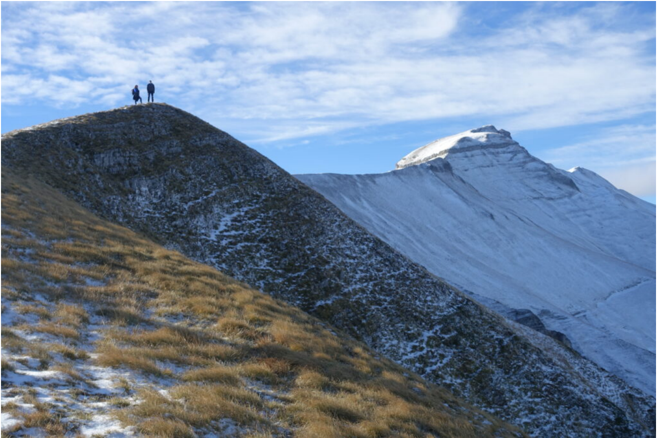
8 – 14 – Fasi di salita verso la “Corona” della Sibilla.