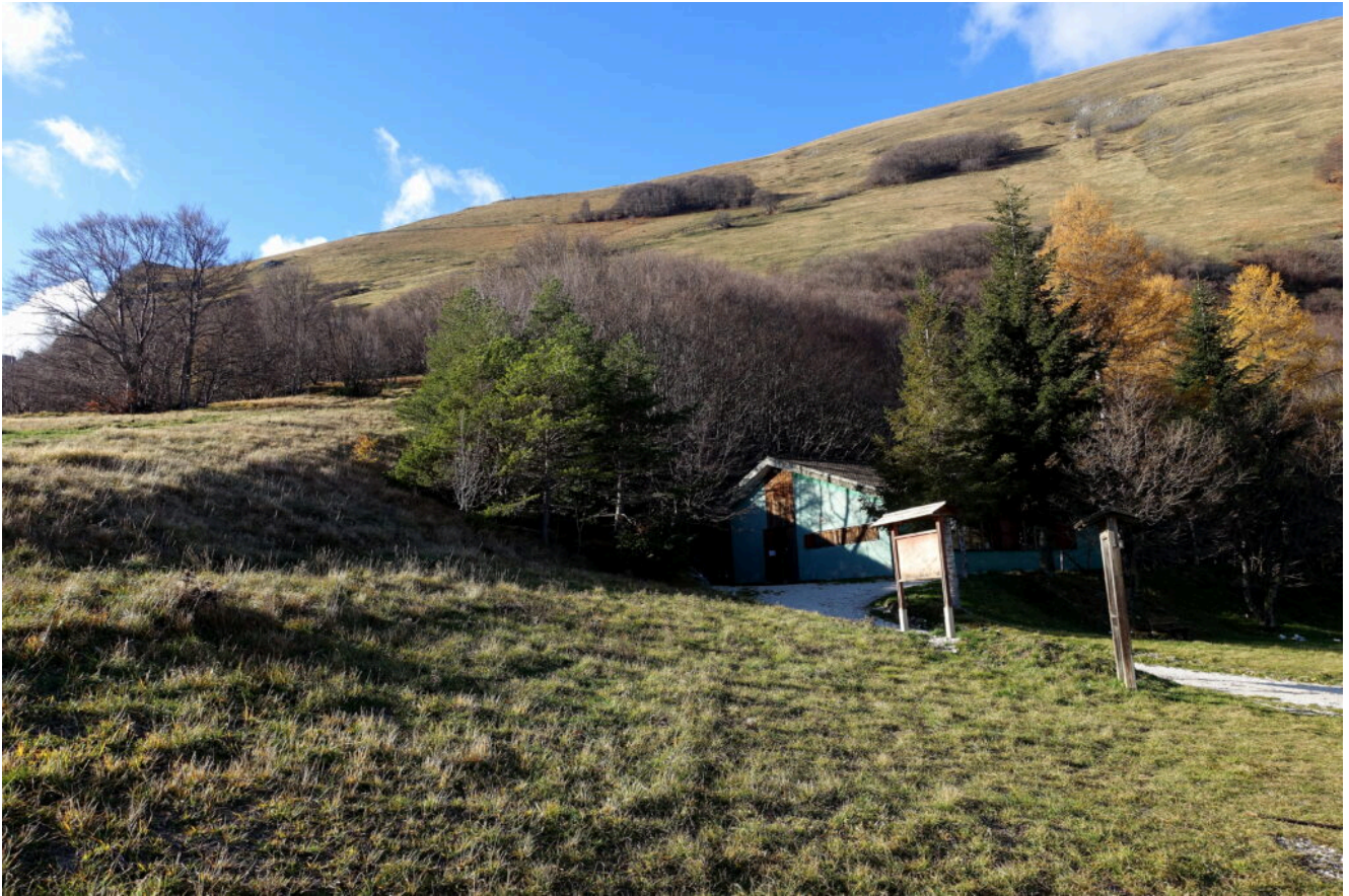
9- Il Rifugio Città di Amandola