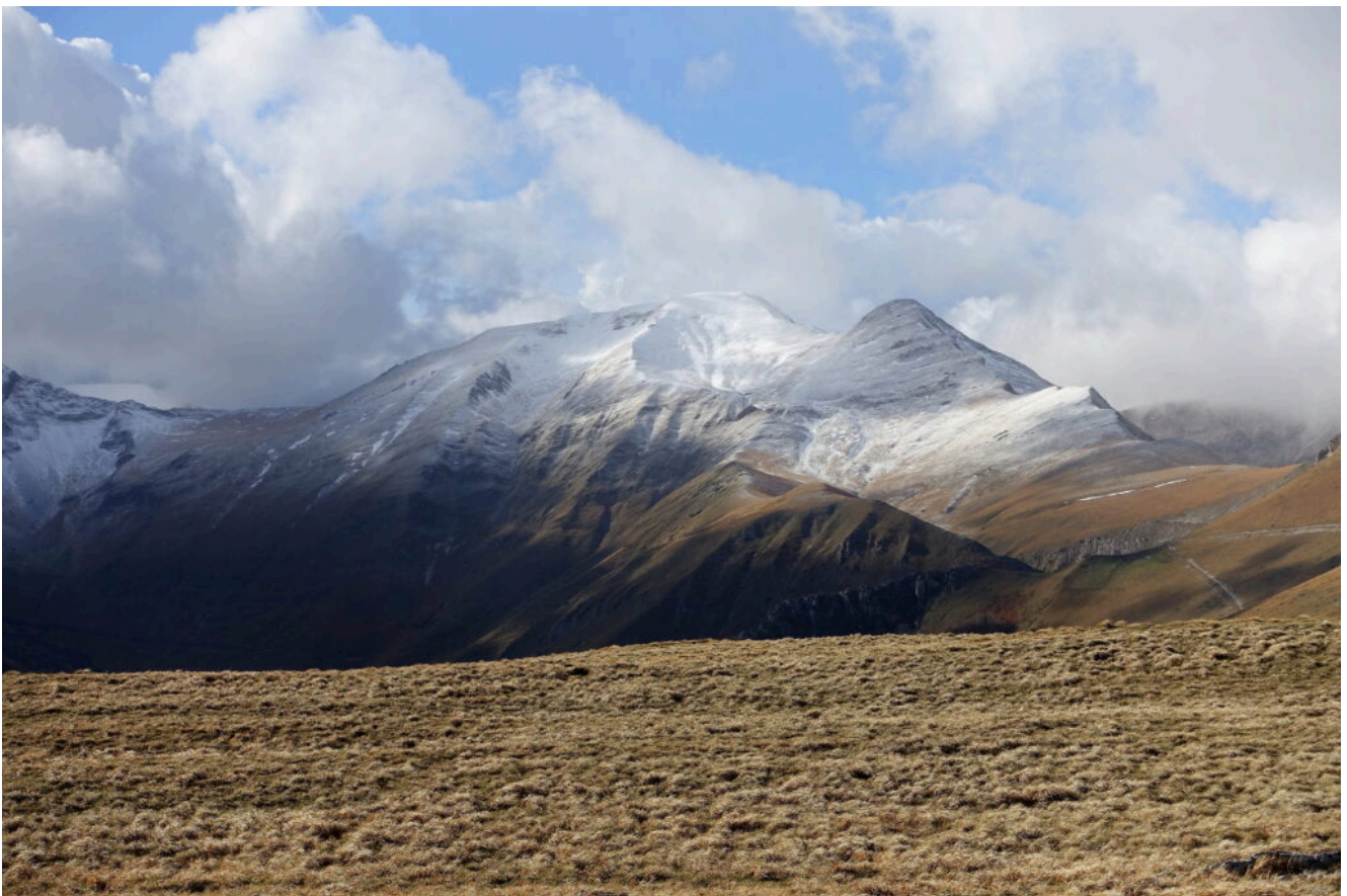
18- Il Monte Acuto ed il Pizzo Tre Vescovi visti dal Monte Amandola