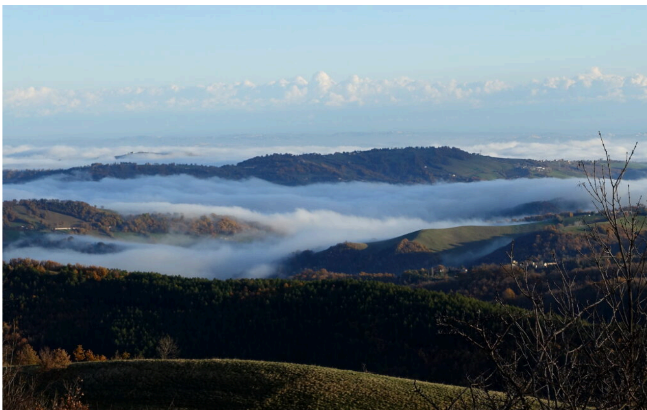
1- 2- Nebbia mattutina nelle valli intorno ad Amandola

Partenza da Garulla (861 m.), preso il sentiero N4 fino a Casalicchio, risalita al Rifugio Città di Amandola quindi per il sentiero E6 (241) saliti fino al Monte Amandola (1707 m.) , ridiscesi per lo stesso sentiero, ritorno a Garulla per il Rifugio Casale di Vallecaprina (11 Km di sviluppo a/r, 850 m. di dislivello).