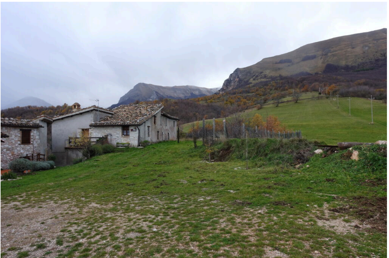
5 – 6- La frazione di Casalicchio, sullo sfondo a destra il Balzo Rosso, a sinistra Il Pizzo quindi, ancora più a sinistra, coperto dalla nebbia, il Monte Zampa.