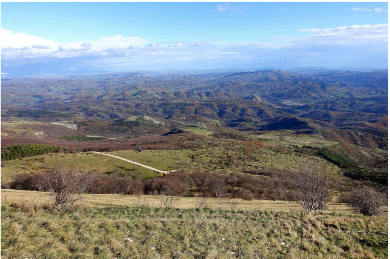
10- Il panorama a monte del Rifugio