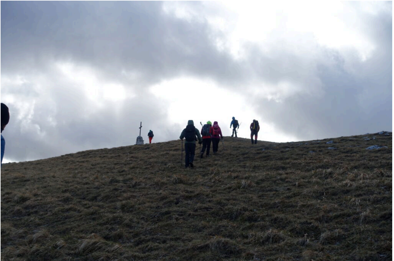
17- La croce di cima del Monte Amandola