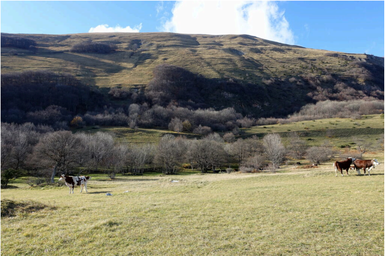
25- Le pendici Est del Monte Amandola con, in alto, il sentiero percorso.