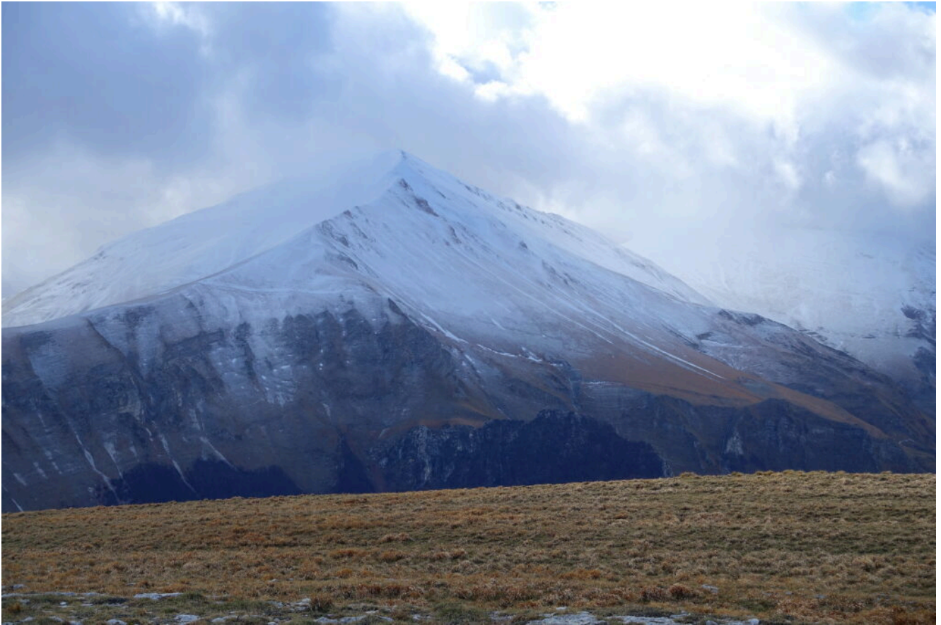
19- Il Pizzo Regina.