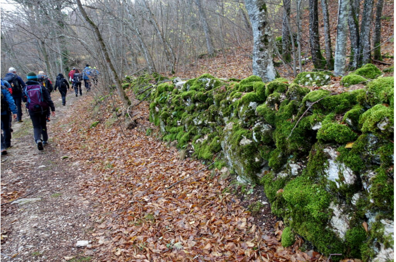
4- Vecchio muretto a secco nel sentiero N4