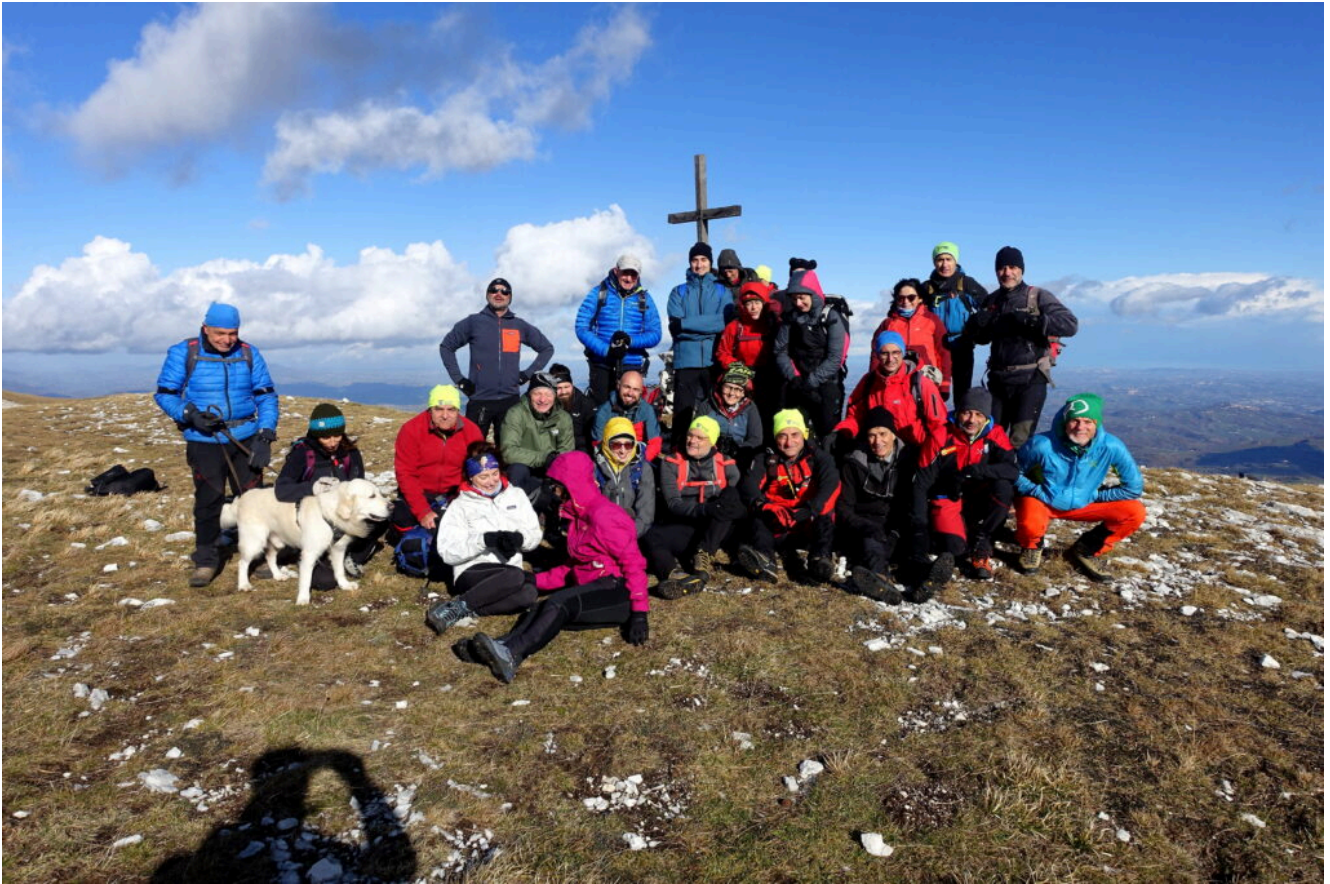
21- Foto di gruppo sulla cima del Monte Amandola