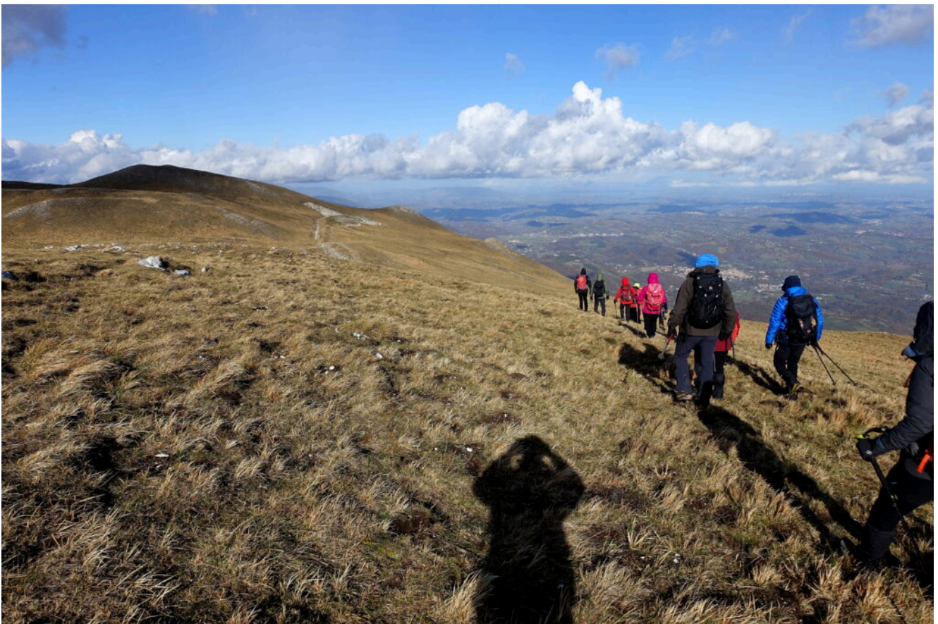
22 – 23-Discesa per lo stesso itinerario.