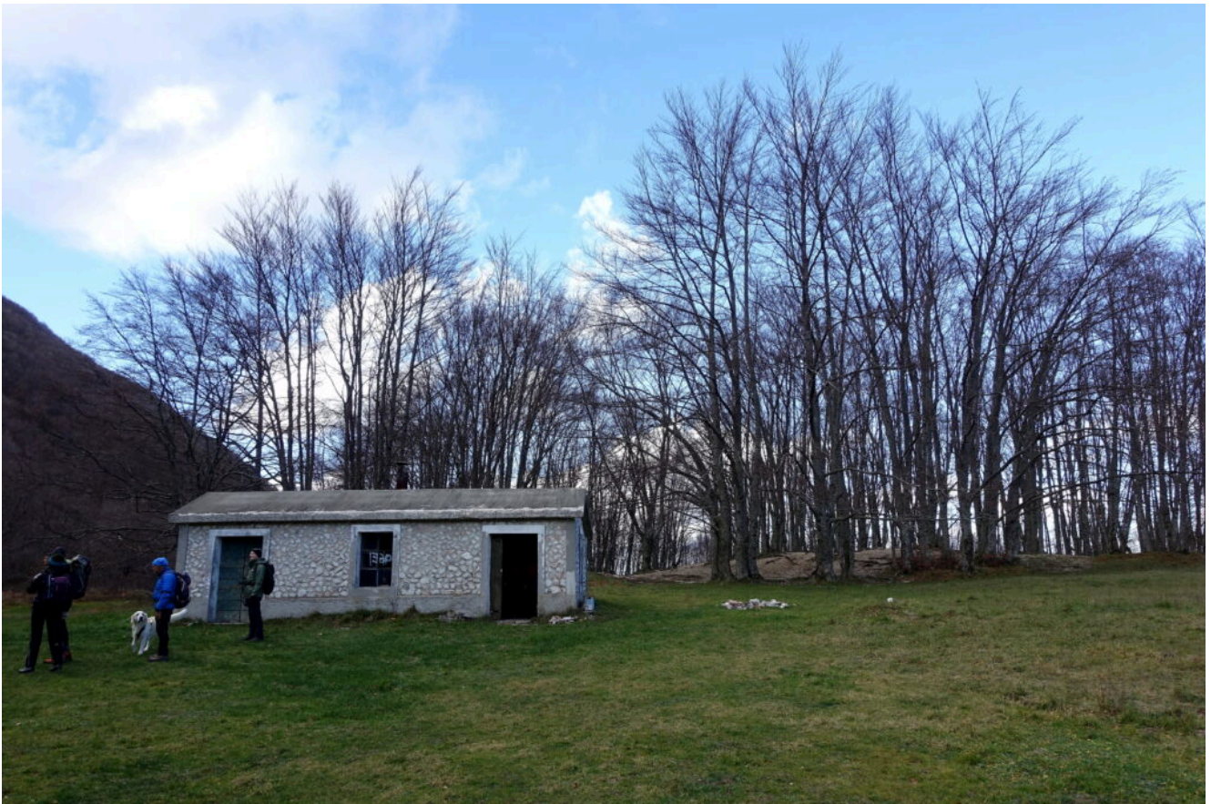
26- Il Rifugio Casale di Vallecaprina, ormai con il sole tramontato.