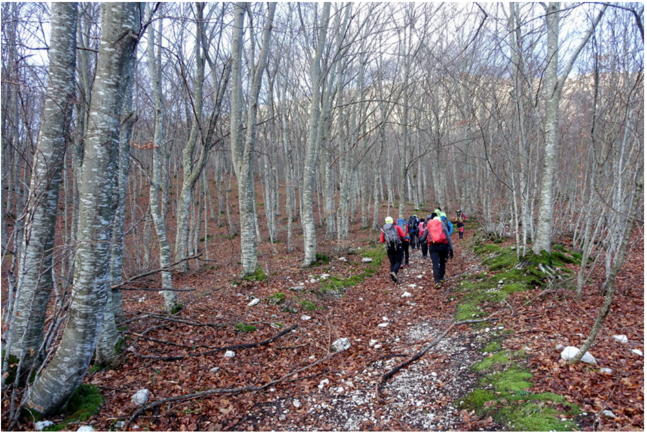
7 – 8- Risalita verso il Rifugio Città di Amandola