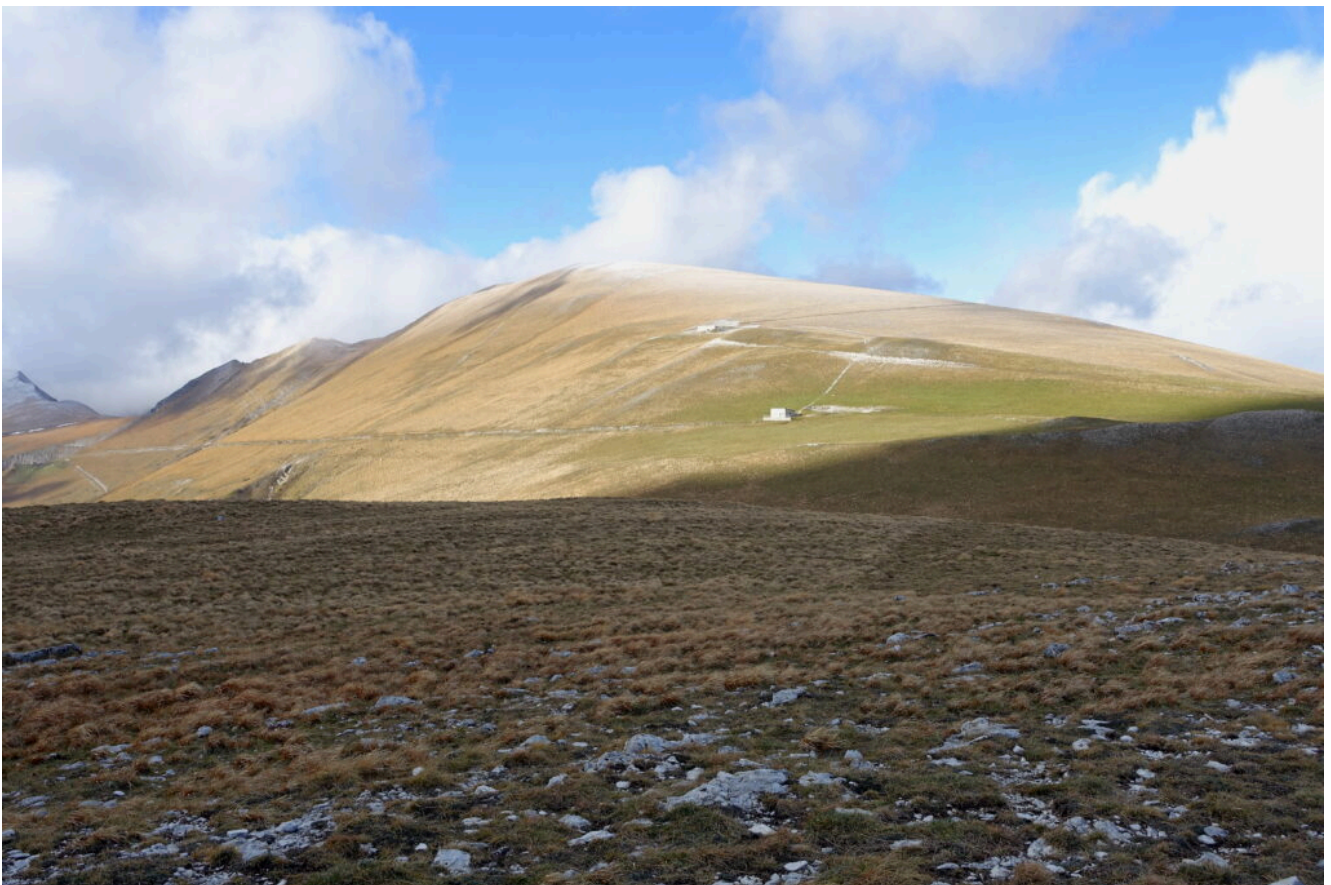
20- Il Monte Castel Manardo ed il Casale Grascette.