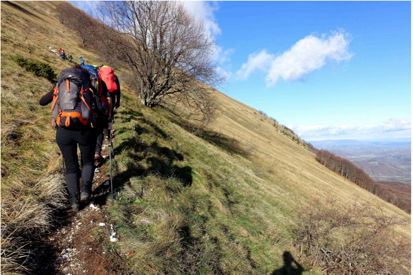
11 – 16-Fasi di risalita per il sentiero E6 (241) verso il Monte Amandola