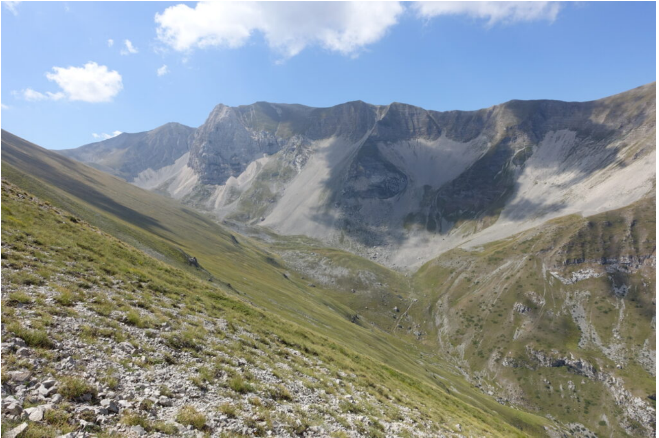
18- La parte finale della Valle del Lago di Pilato.