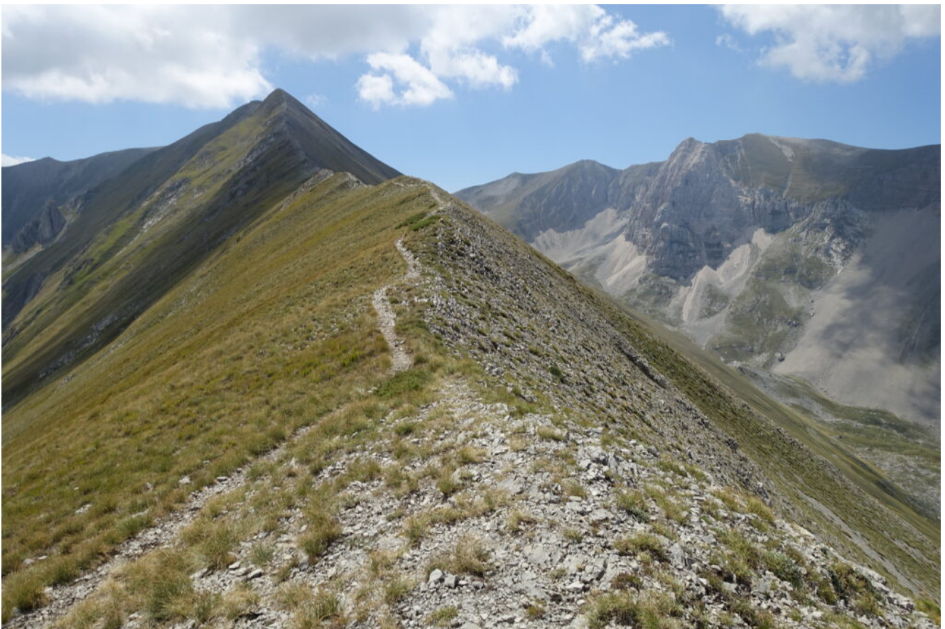
19- Il cima al Monte Torrone ed il sentiero di cresta verso l'Antecima Nord del Monte Vettore.