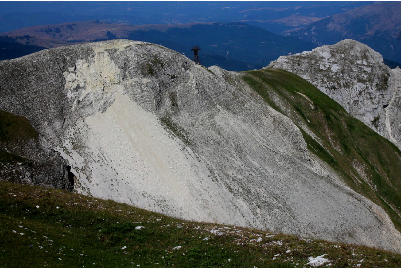
12- La frana osservata dalla cresta verso il Monte Bove Sud. Ben visibile il pilone della vecchia funivia e lo sdoppiamento della cresta a monte che si è pericolosamente accumulata verso valle e franata ancora più in avanti. A sinistra il Monte Biccio.