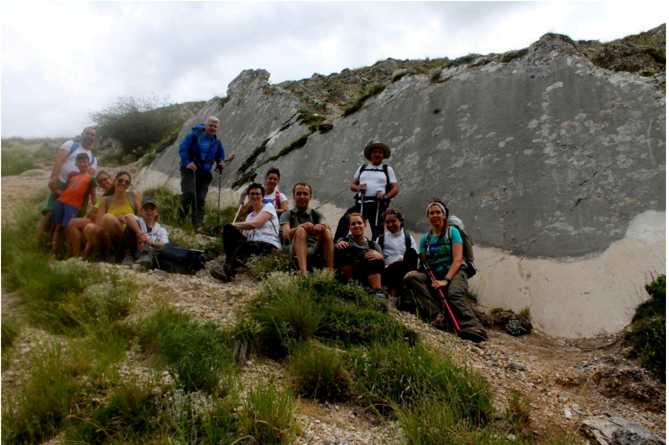
1- Il gruppo di escursionisti ai piedi della scarpata cosismica dei Colli Alti e Bassi.