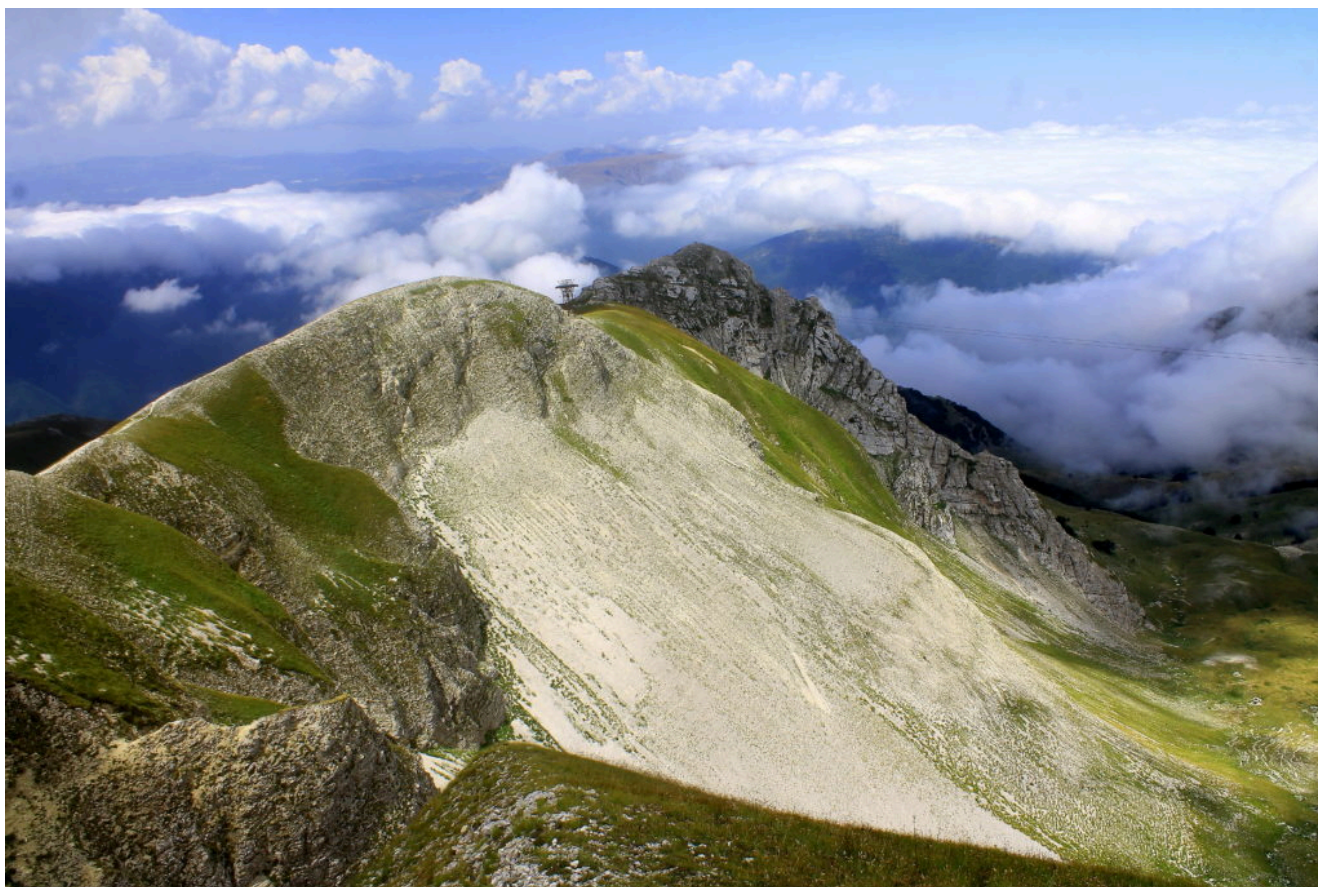
14- Foto storica, lo stesso tratto di cresta fotografato a Giugno del 2016, prima del terremoto.

Un lieve sdoppiamento è visibile anche nella cresta il primo piano a sinistra mentre sullo sfondo a destra è visibile la lunga striscia bianca della frana de "le Quinte".