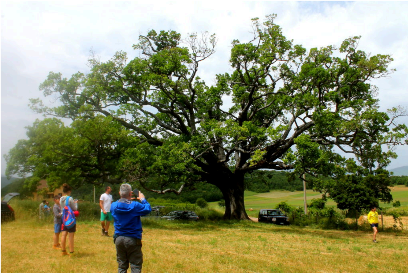
3- La grande Quercia secolare di Nottoria di Norcia

Notare la forma della pianta di Globularia meridionalis scesa più in basso di circa 50 centimetri.