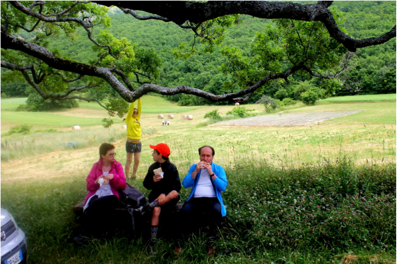
4- Sosta per il pranzo sotto alla grande quercia.