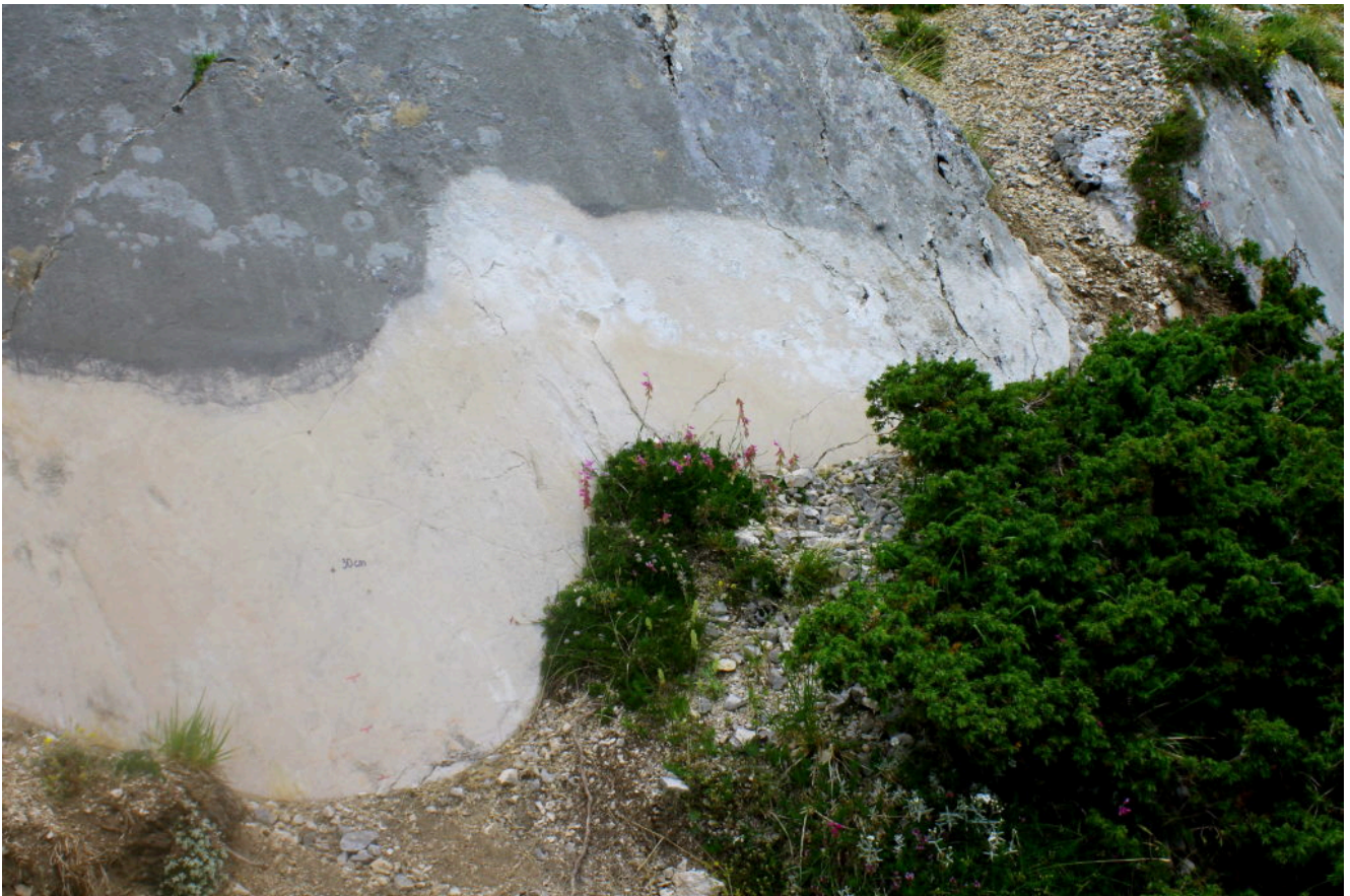
2- L'abbassamento del terreno a seguito del terremoto contrassegnato dalla fascia bianca nella parete rocciosa in