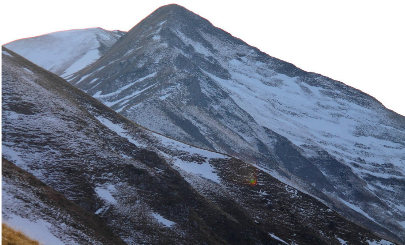
7- Il Monte Acuto ed il Pizzo Tre Vescovi a sinistra.