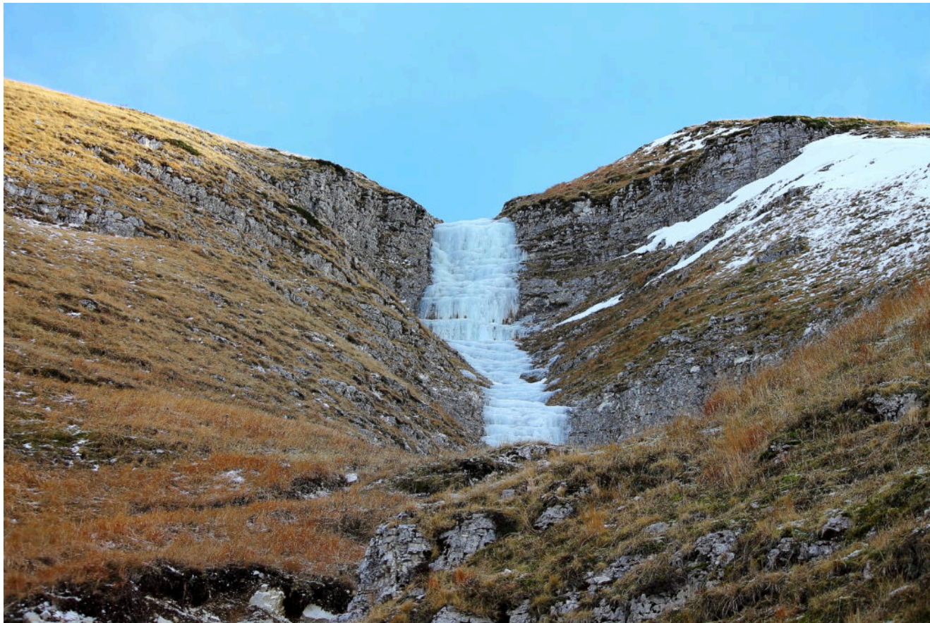
8- La colata di ghiaccio vista dalla base del canale.