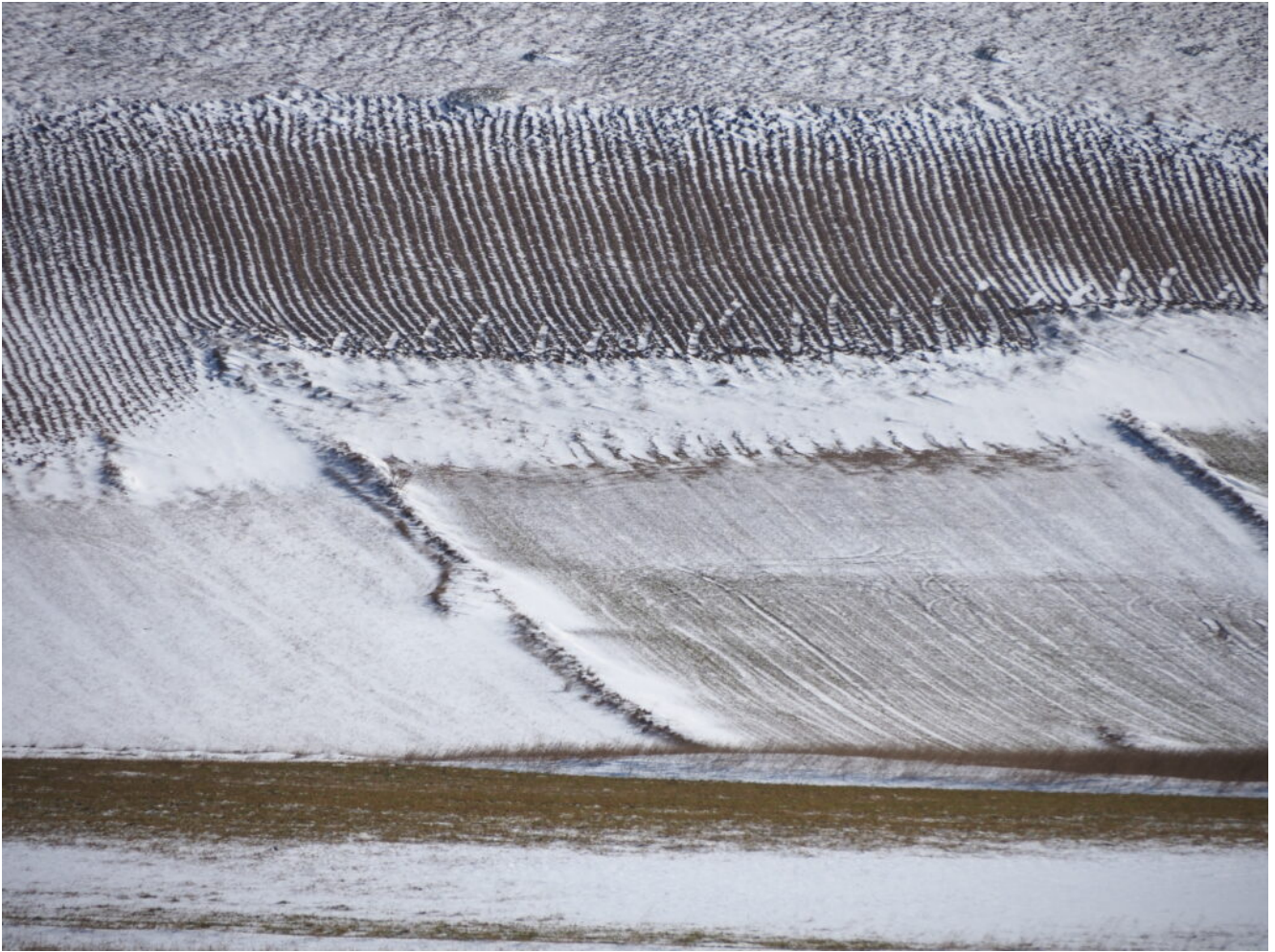
25 – 26 – L'ultimo campo coltivato sul pendio sotto al Cordone del Vettore.