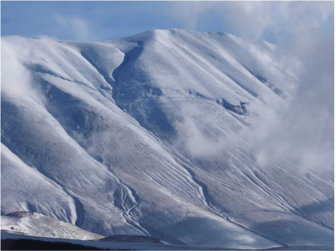
8- La Cima del Redentore e il canale "la Virgola".