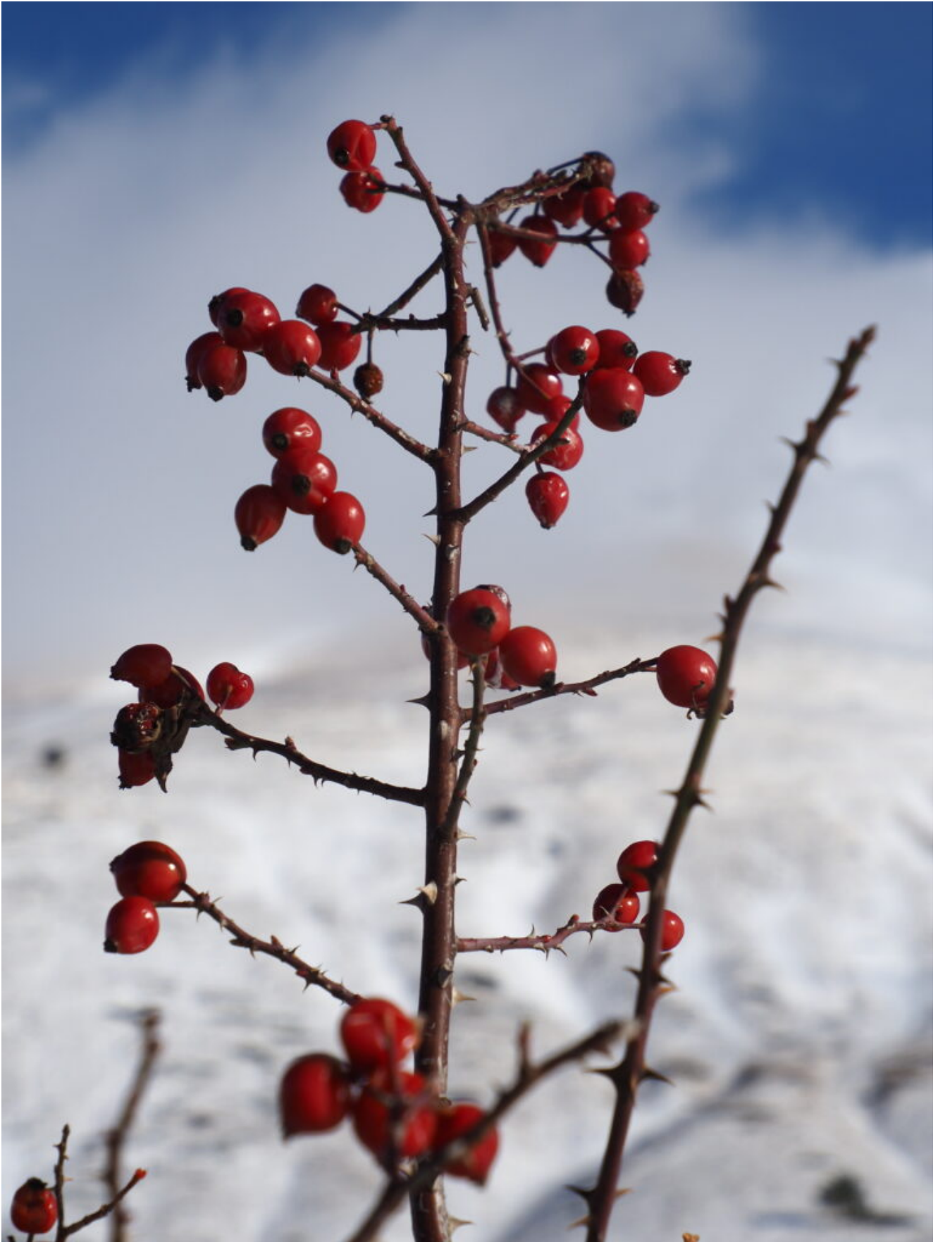
31 – 33- Cinorroidi di Rosa canina, l'unico colore rosso di questa stagione.