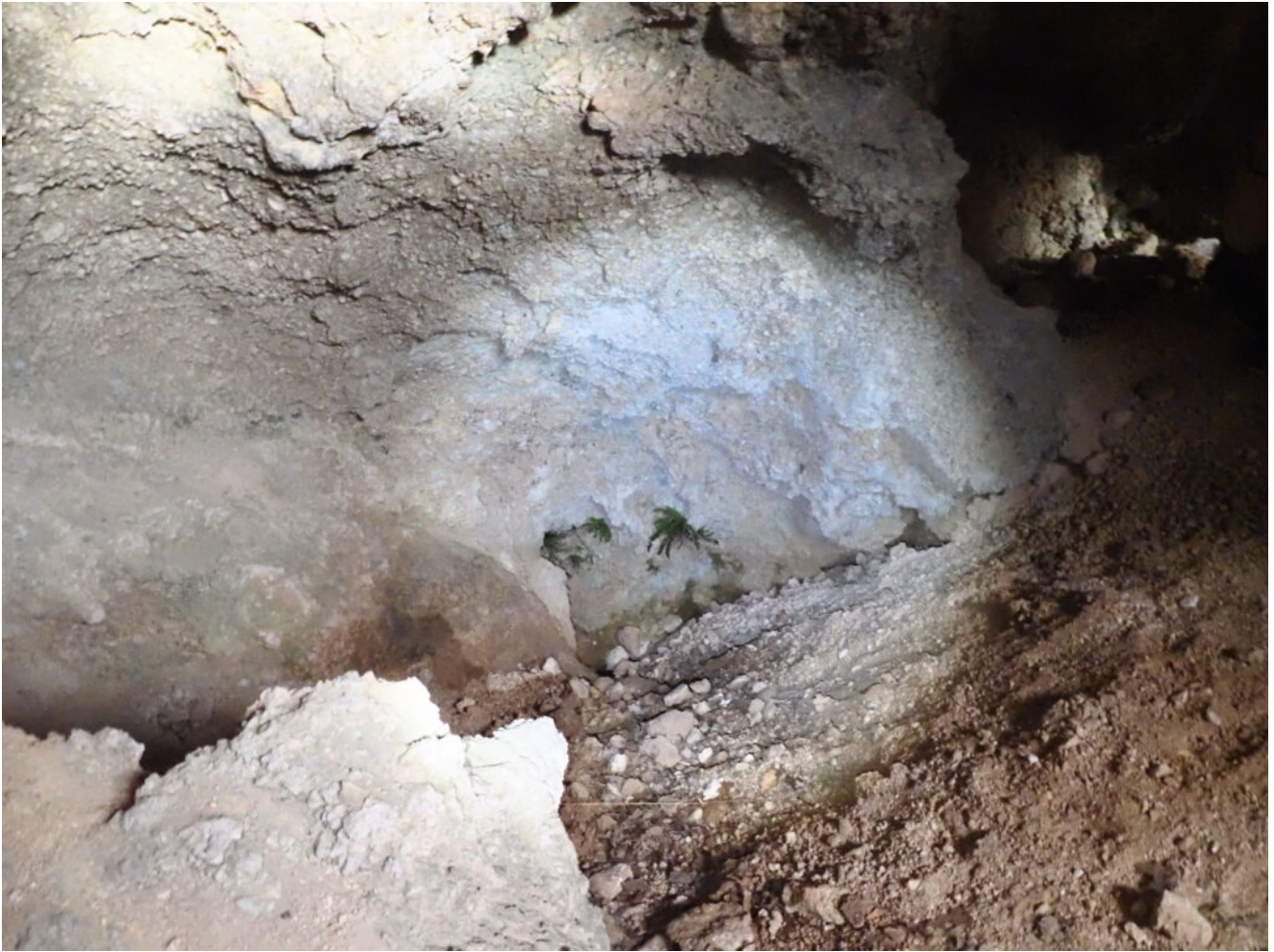
41- Felci Falso Capelvenere ( Asplenium trichomanes ) crescono nel fondo della Grotta dove arriva la luca.