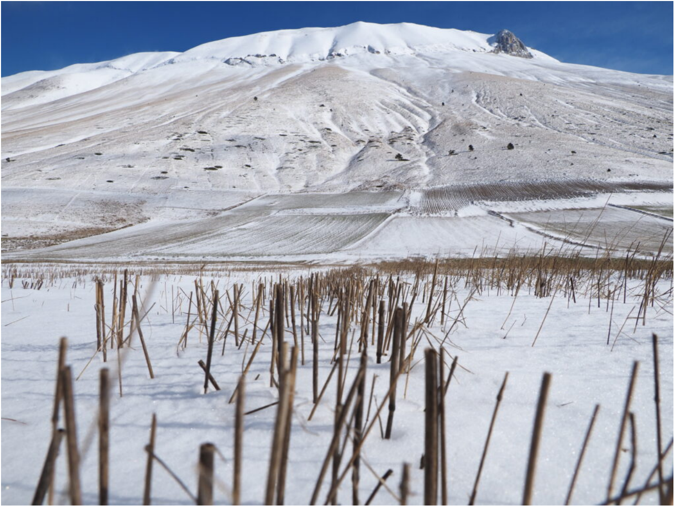
34- Steli di farro falciato emergono dalla poca neve.