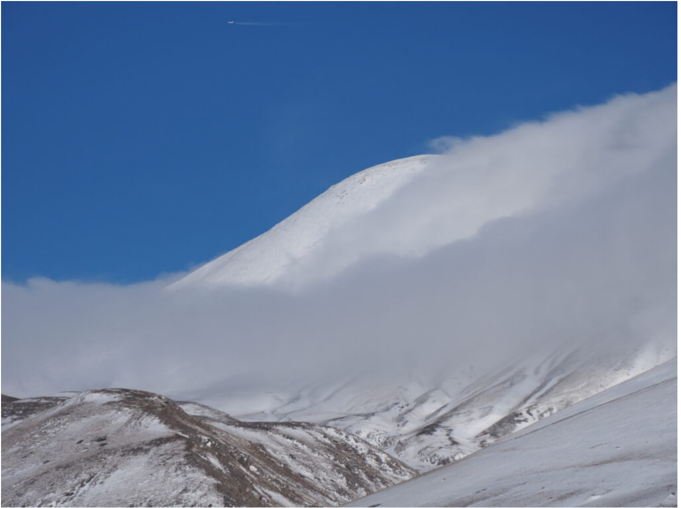
29- Il Monte Argentella con il passaggio di un aereo.