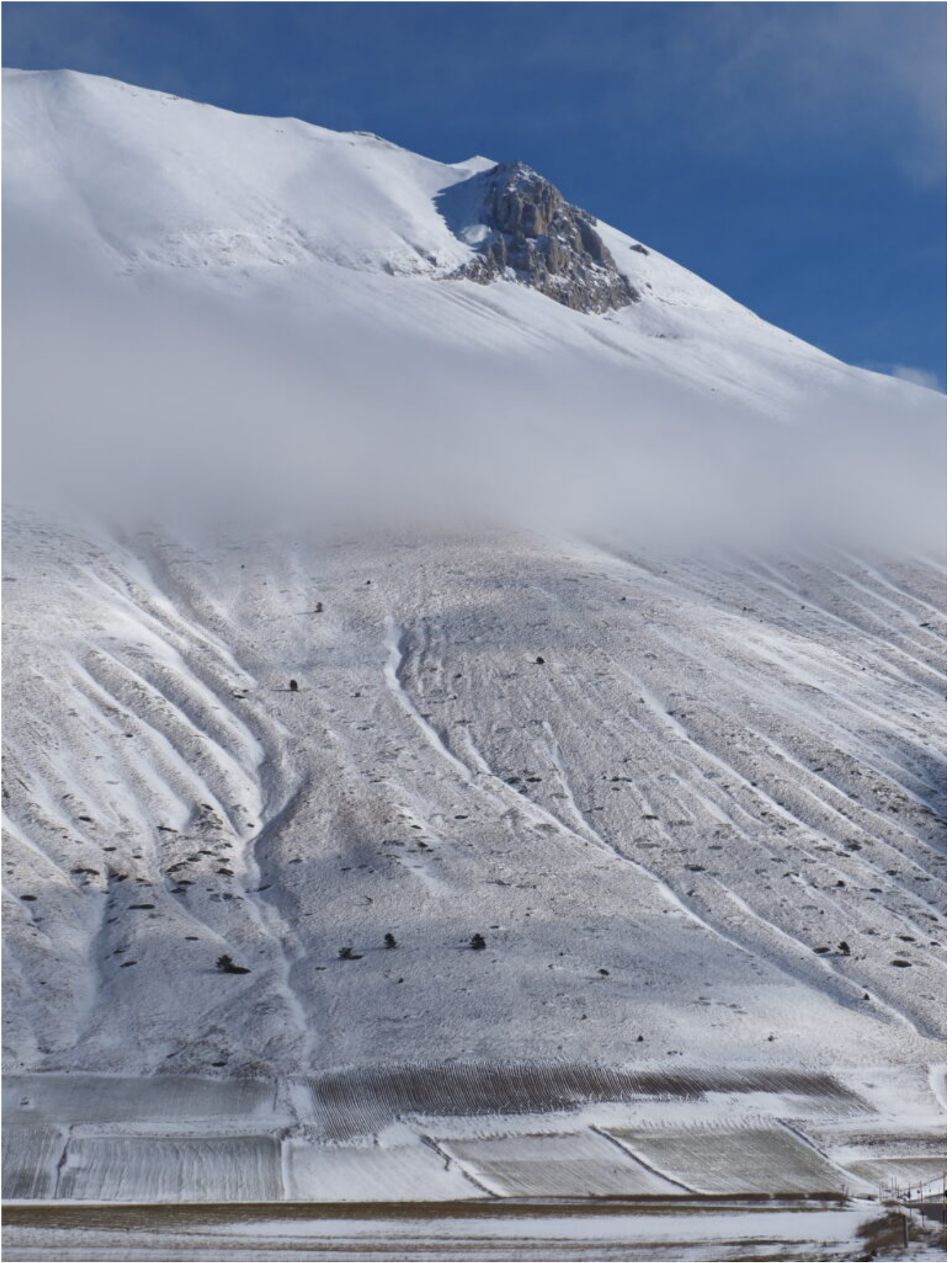
20 - 22 - Lo scoglio dell'Aquila.