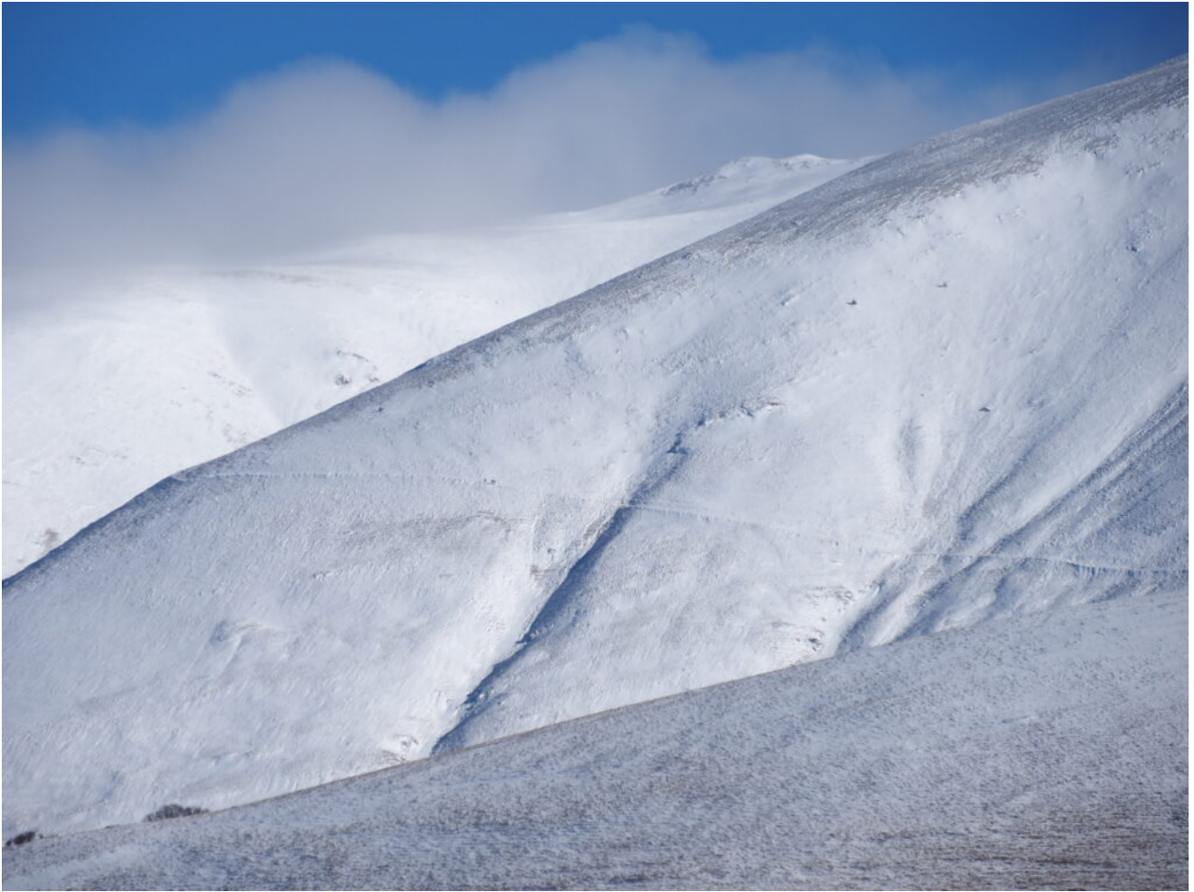
9- Escursionisti appena visibili sulla "strada imperiale" nel tratto del versante Ovest del Monte Argentella.