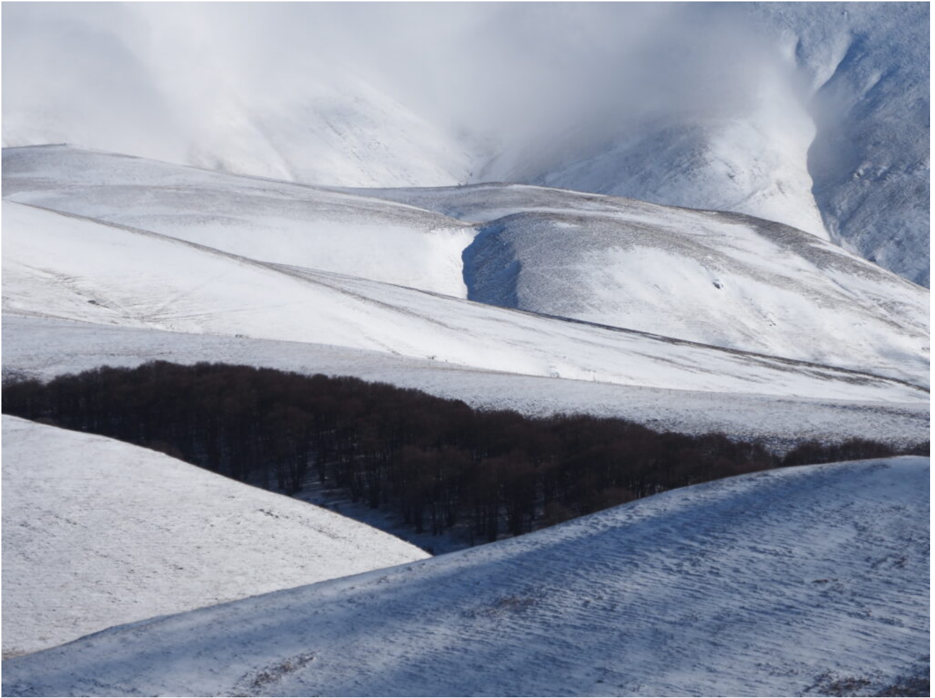
11- Incroci di curve intorno alla faggeta dei Colli Alti e Bassi.