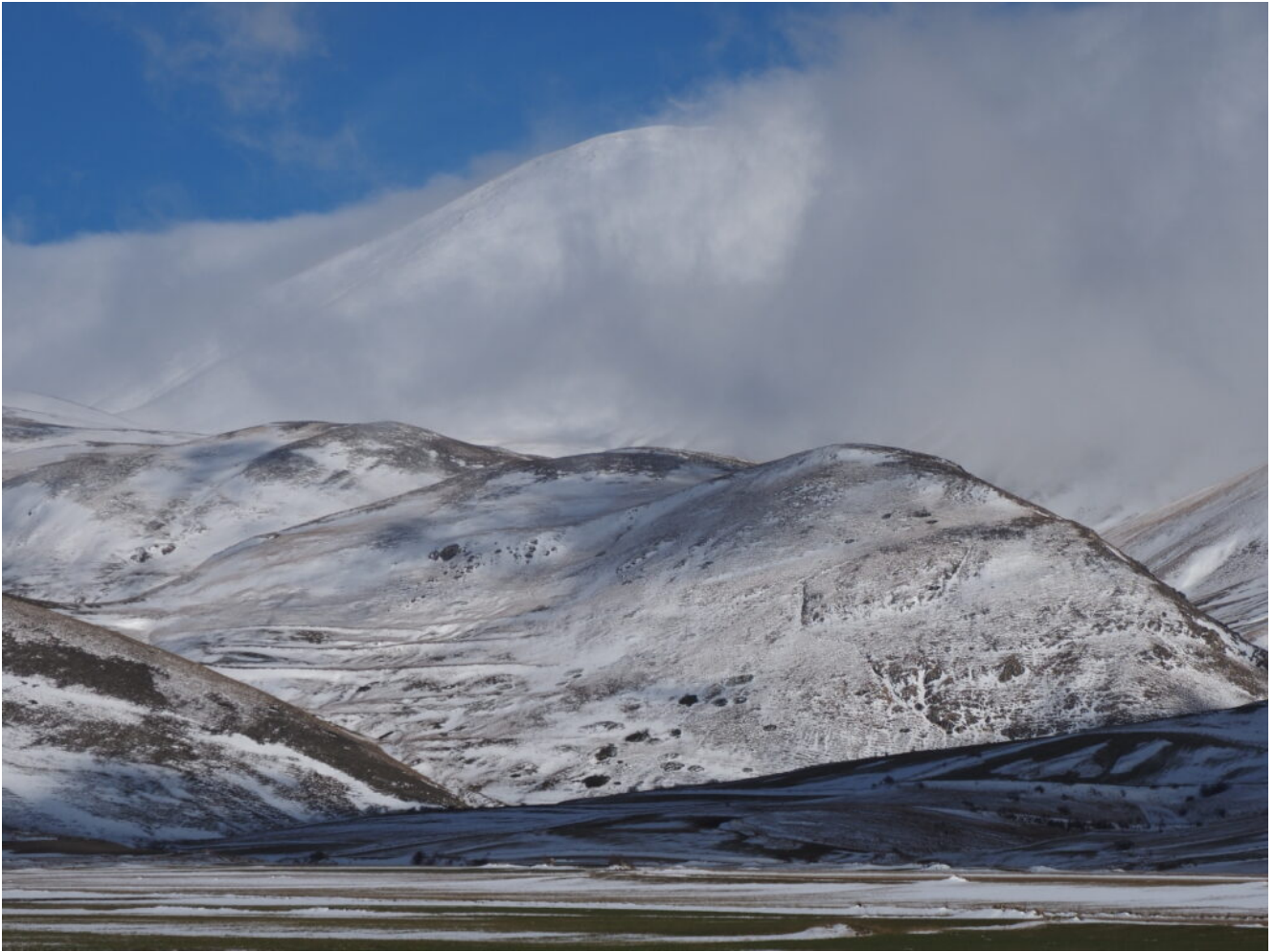
23 – 24 -I Colli Alti e Bassi visti da Sudovest .