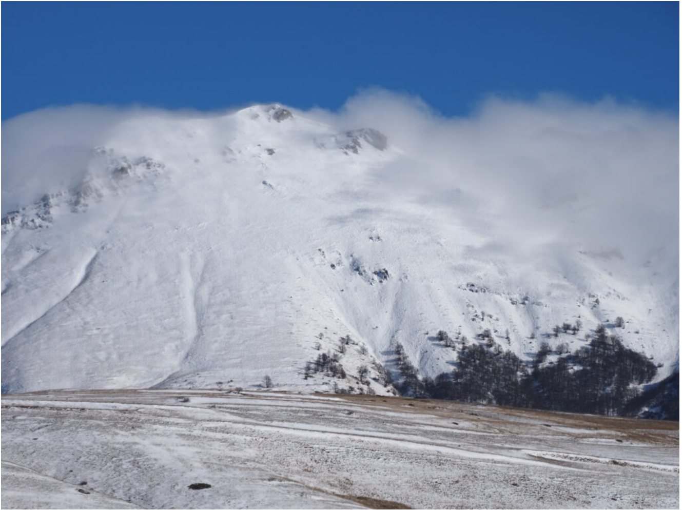
4- Monte Palazzo Borghese