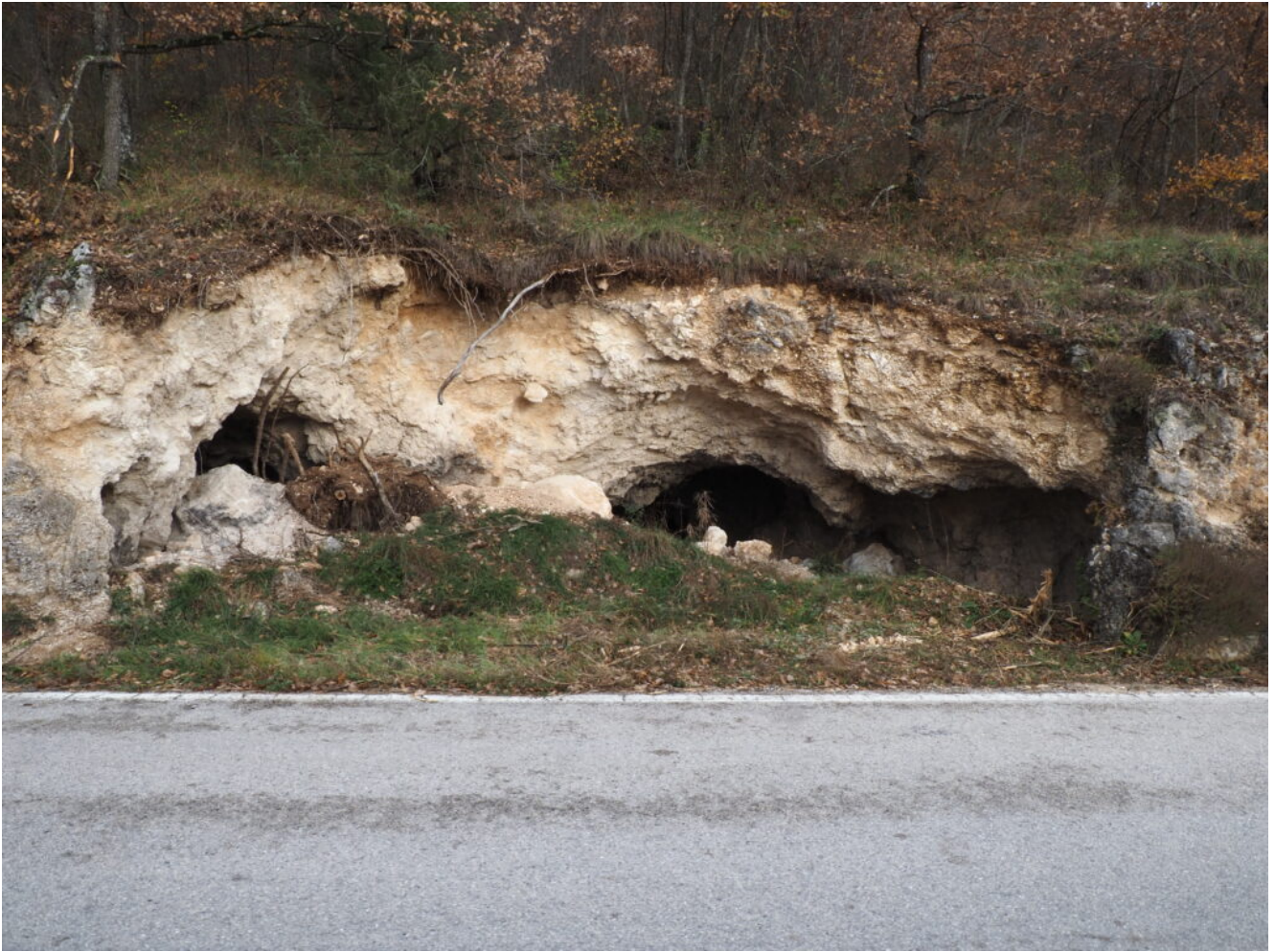
35 – 40 – La piccola Grotta di Quota 900 nella strada che da Castelluccio scende a Norcia.