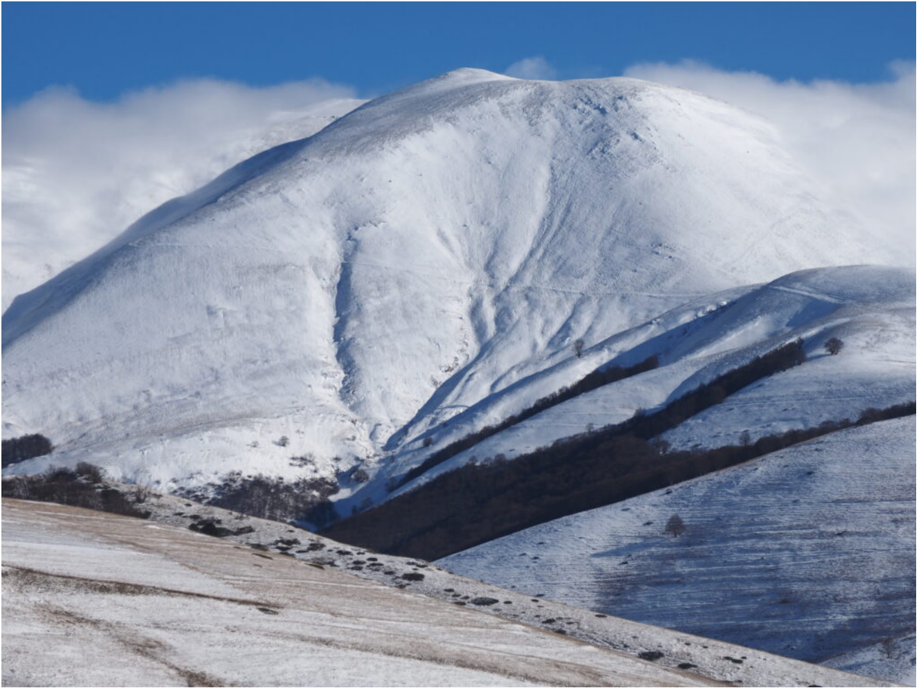
5- Monte Argentella.