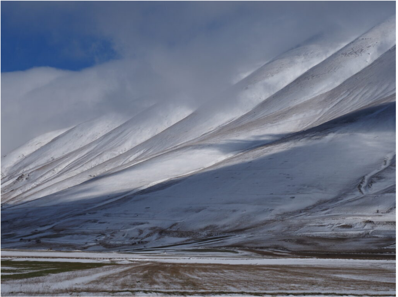
27 – 28 – I canali della Cima del Redentore visti da Sudovest.