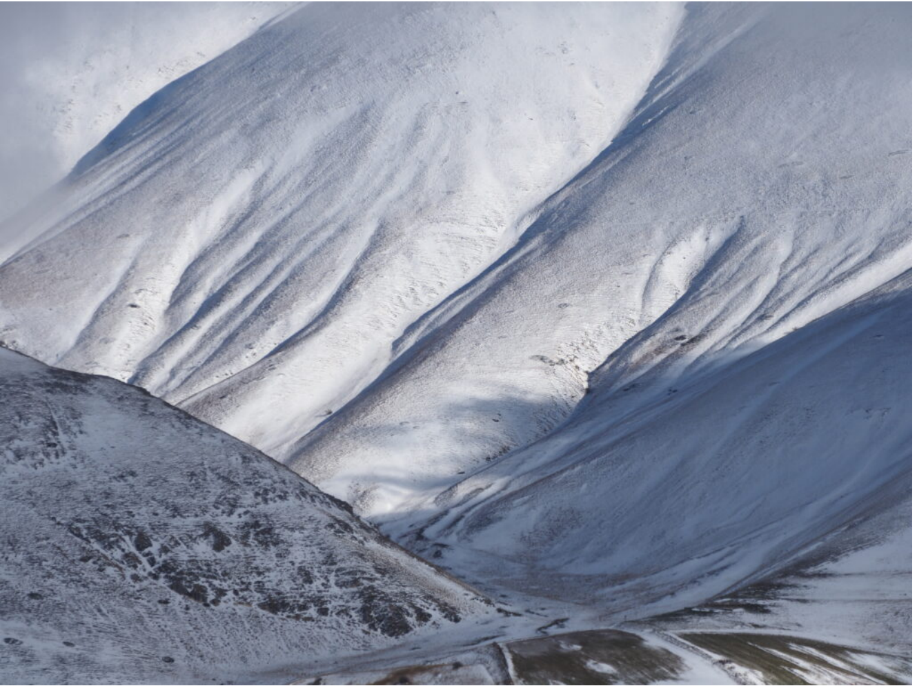
17 - 18 - La Valle delle Fonti.