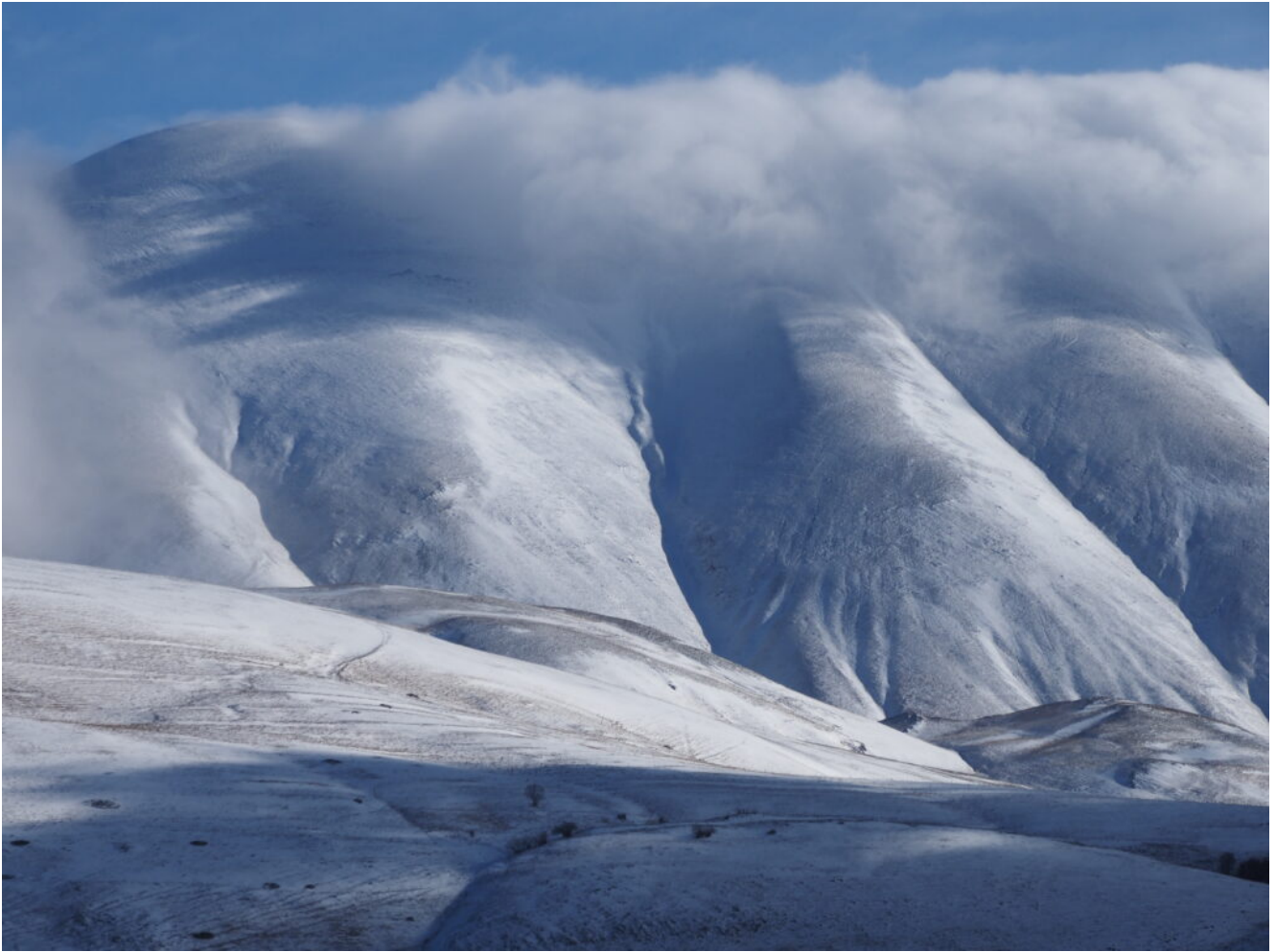
7- La Cima di Forca Viola.