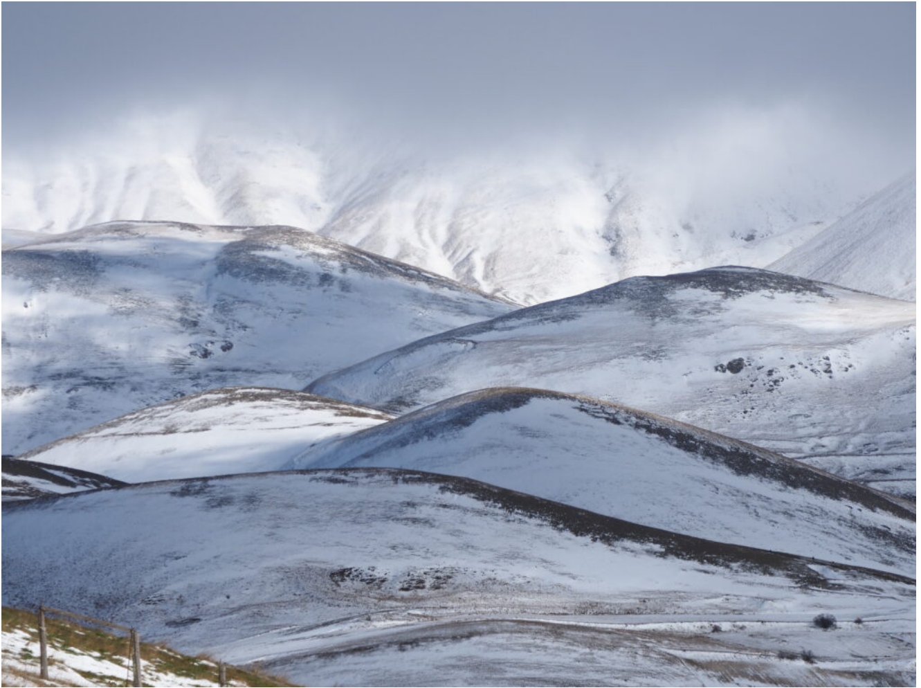
19- I Colli Alti e Bassi.