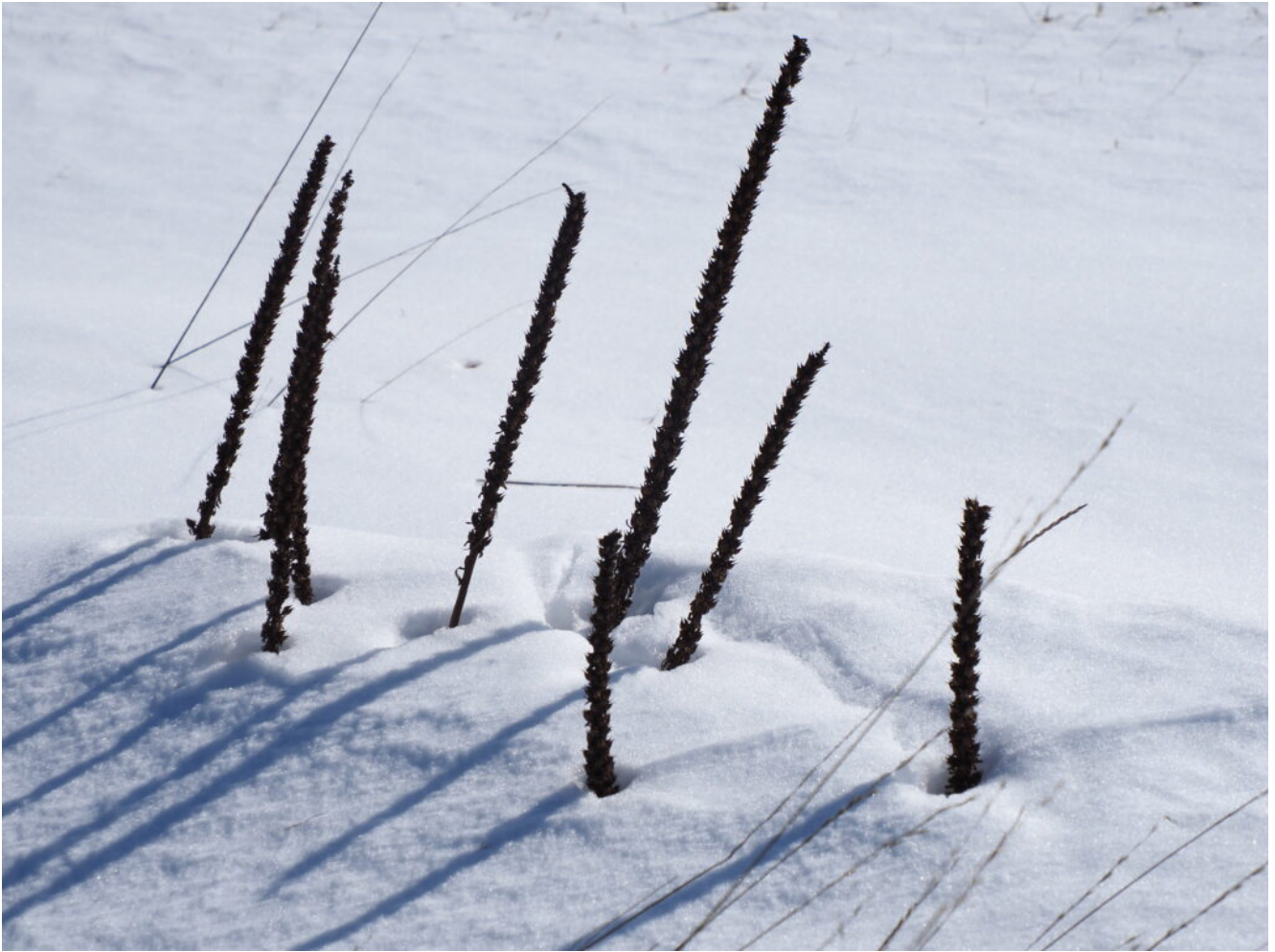
30- Steli di Verbascum spp.