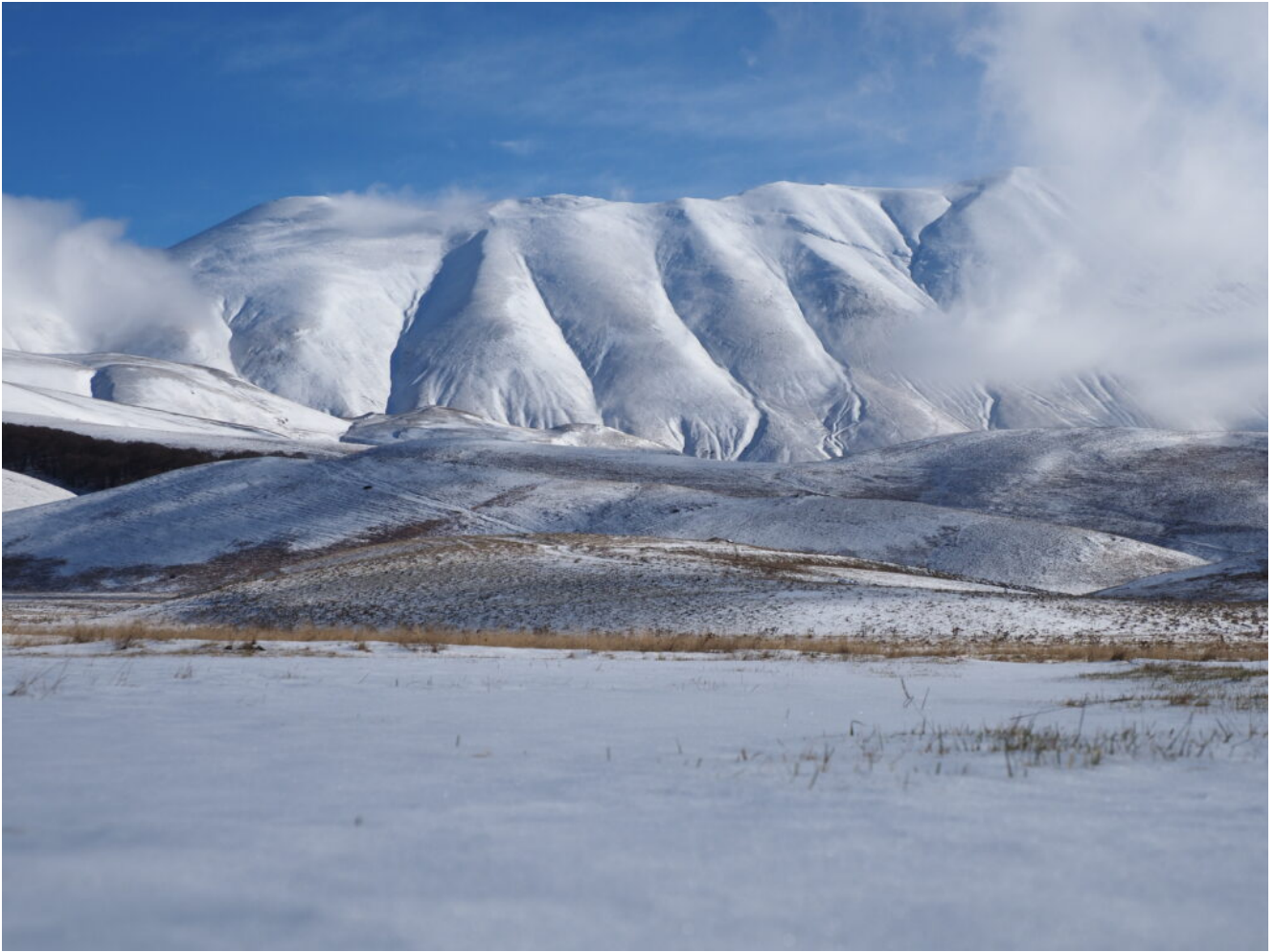
10- Pian Perduto, i Colli Alti e Bassi e la Cima del Redentore