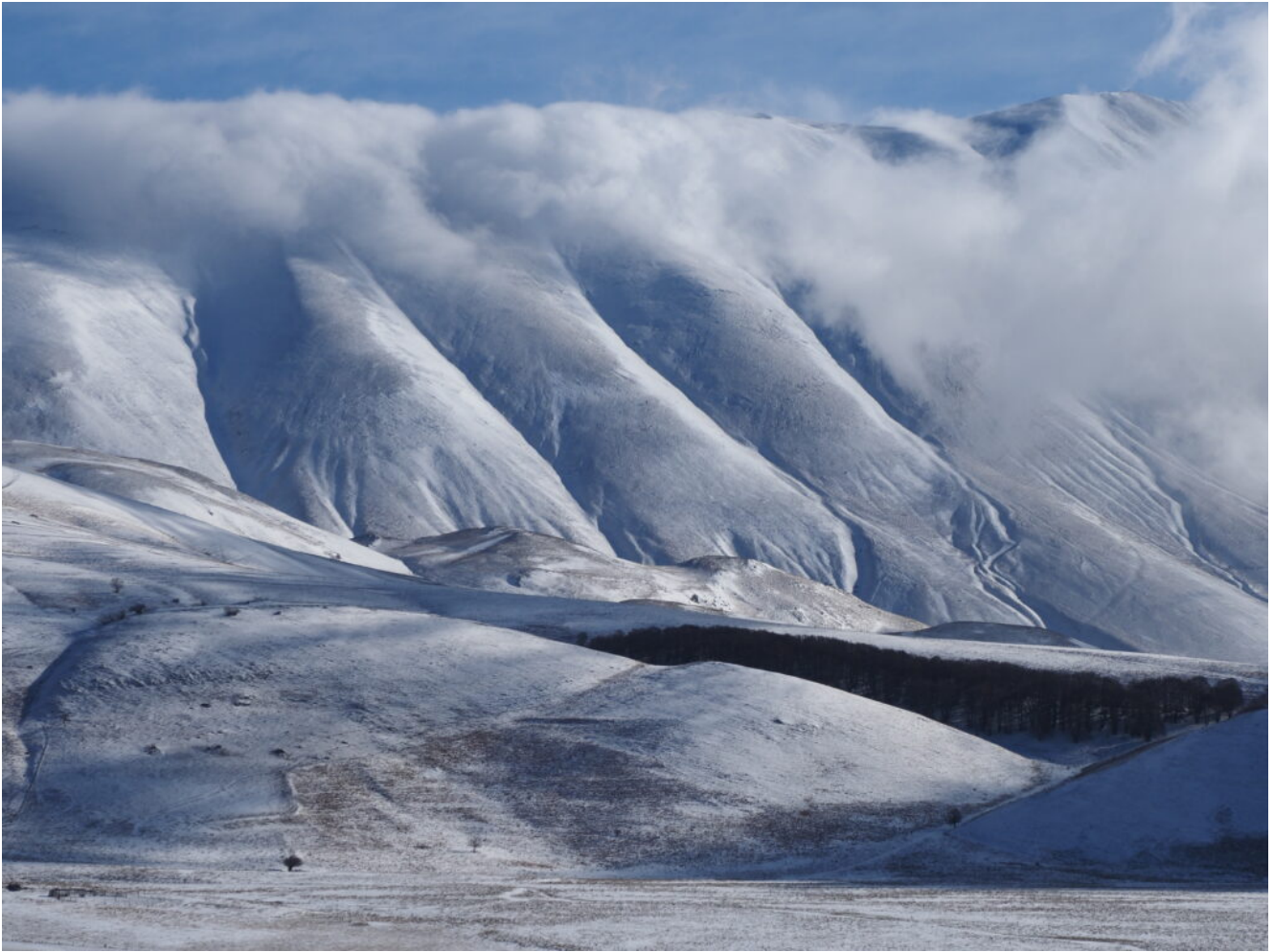
6- I canali del versante Ovest della Cima del Redentore.