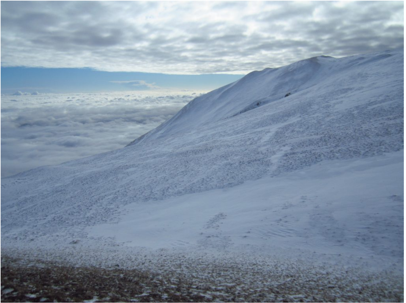
5- Il Monte Amandola ed il mare di nebbia che si estende fino in Abruzzo.