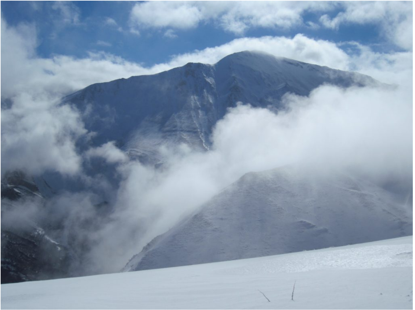
19- Il Pizzo Regina emerge dalla nebbia.