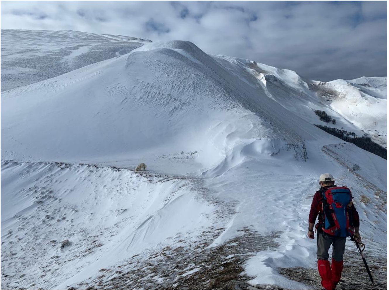
7- La cresta Nord-est del Monte Castel Manardo sale dal Monte Berro.