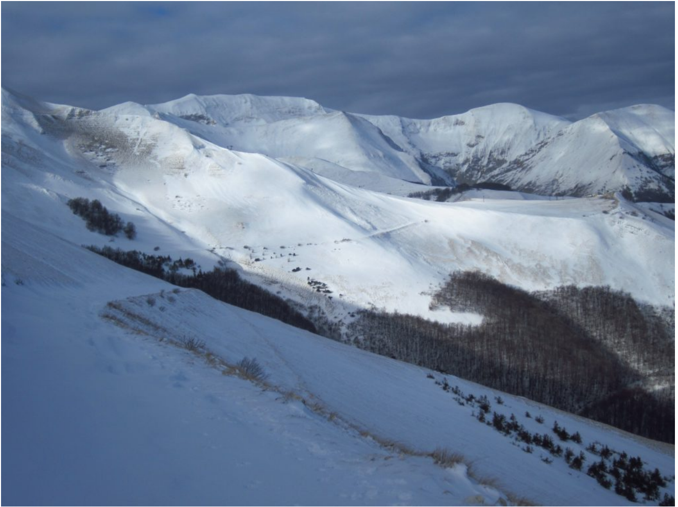
9- Da sinistra il Monte Rotondo, Monte Pietralata e Monte Cacamillo, visti da Monte Berro.