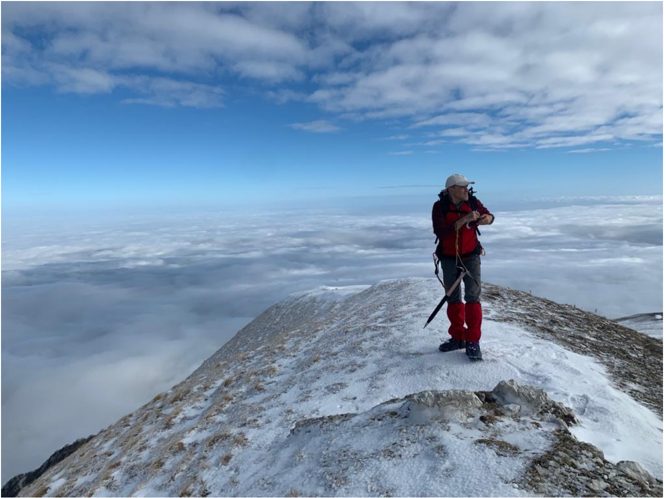
6- Il poggio del Monte Berro.