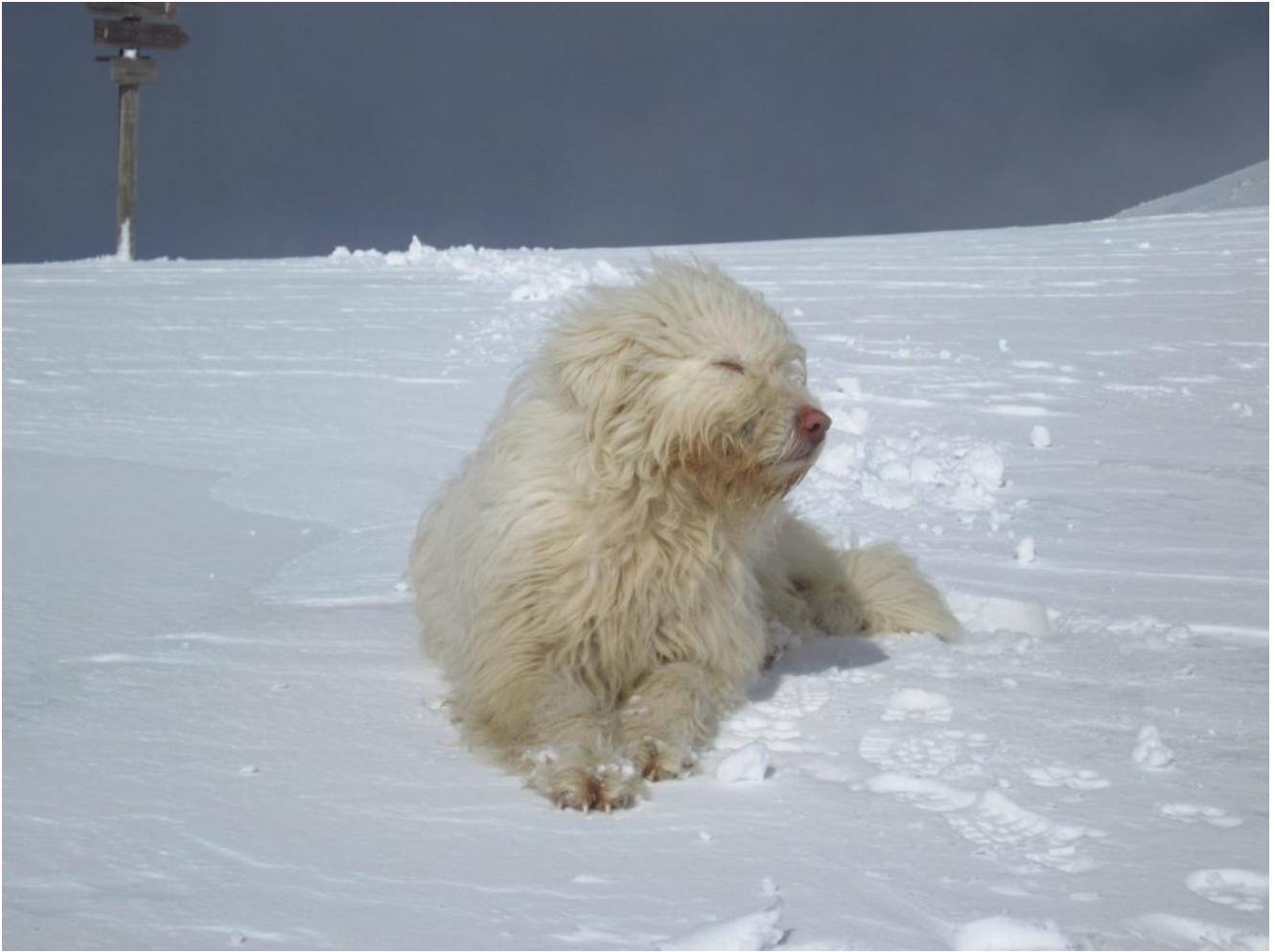
20 -21- 22- Il nostro peloso compagno di escursione a Forcella Bassete.