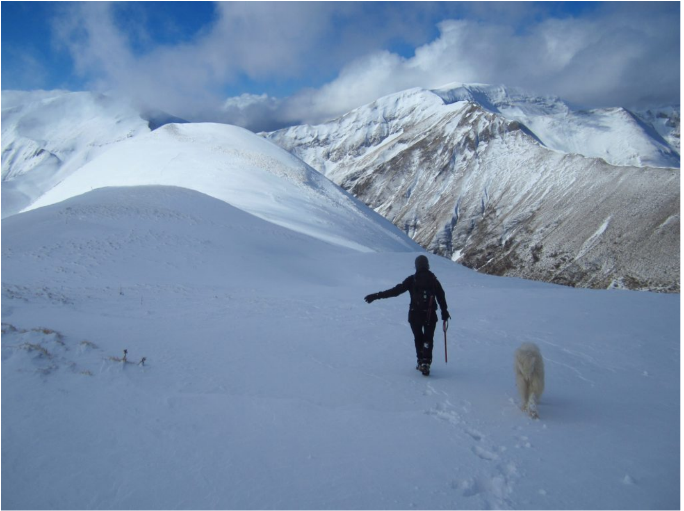
14- Il Monte Rotondo a destra.