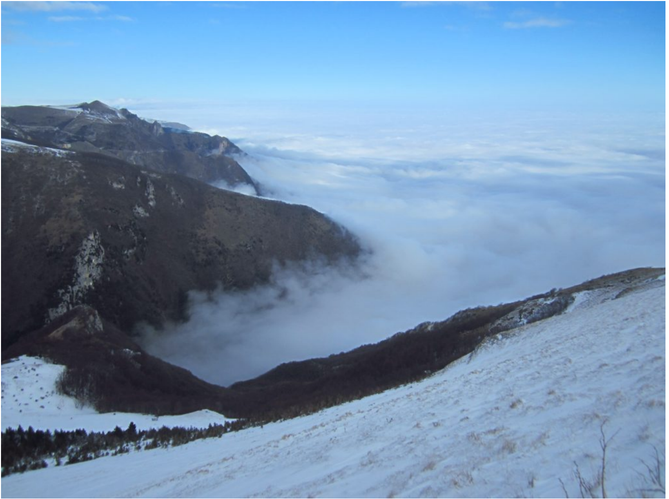
2- Un mare di nebbia ricopre le colline marchigiane, in basso la Valle Tre Santi.