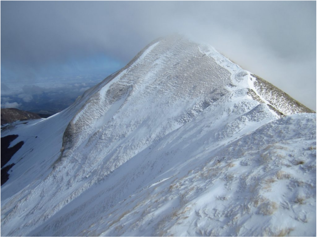
18- Il versante Ovest dello Scoglio del Montone.