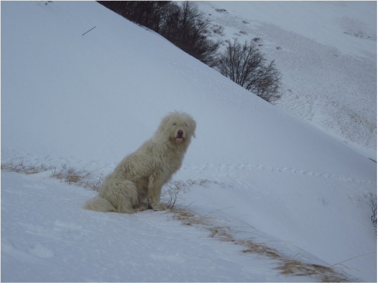
4- Il nostro meraviglioso compagno di escursione.