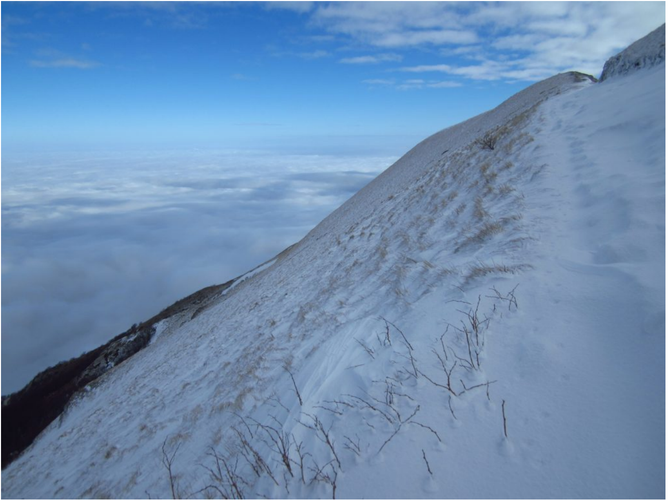
3- Il tratto di strada con il poggio del Monte Berro in fondo.