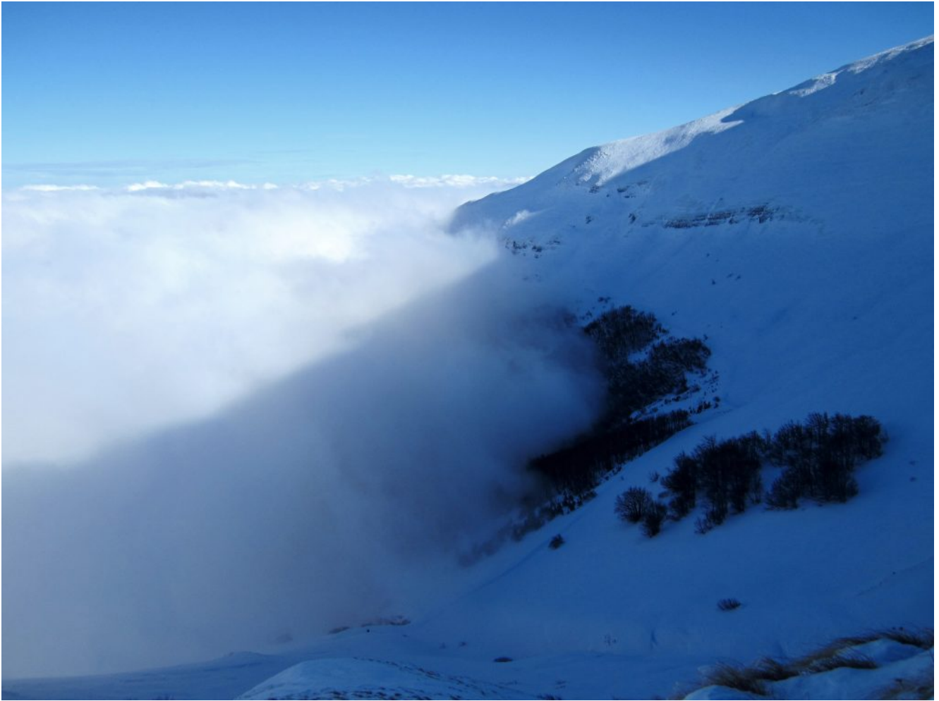
3- Le pendici Nord di Monte Castel Manardo ricoperte dalla nebbia.