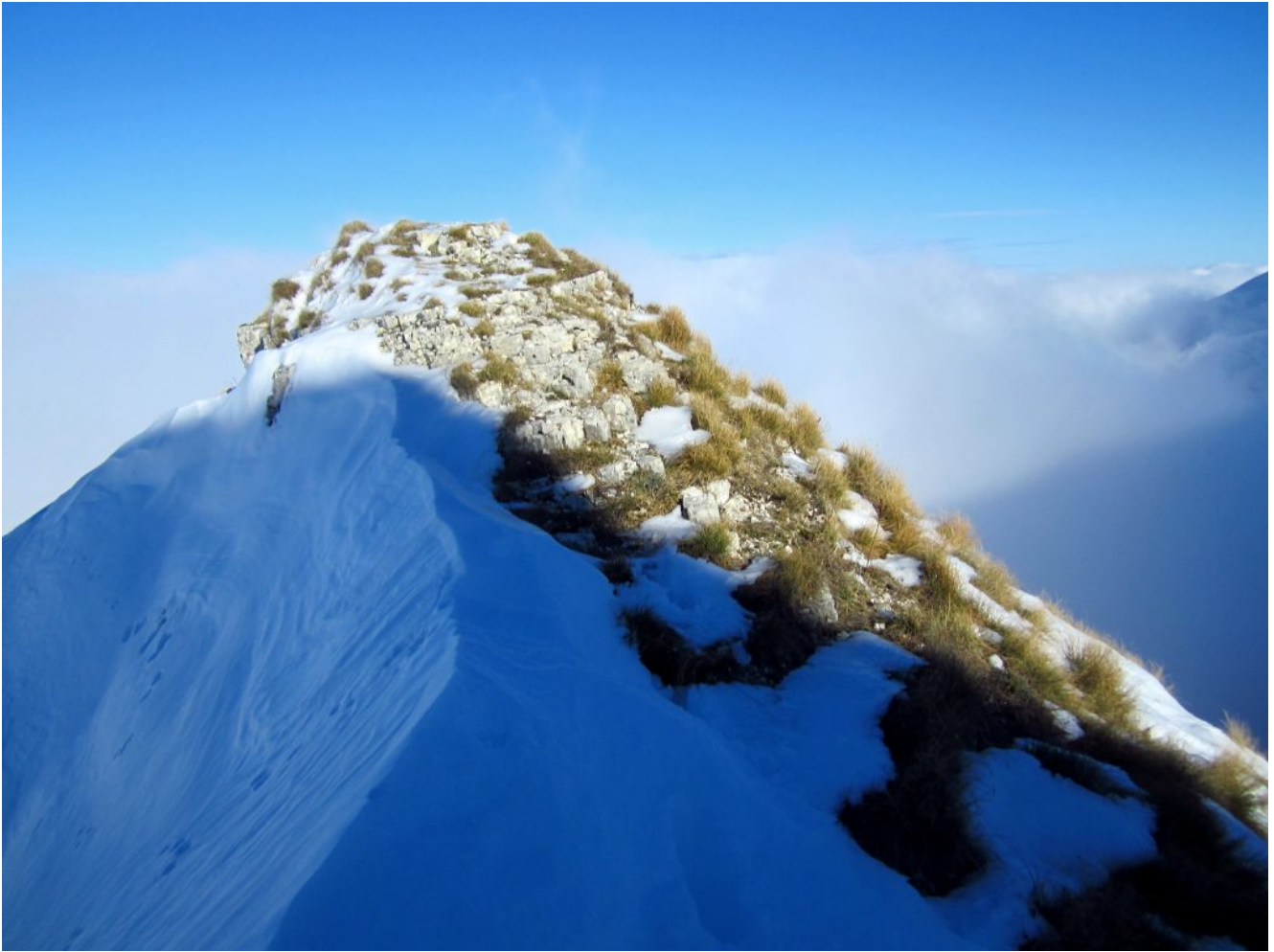
4- La cresta Nord del Monte Castel Manardo, in prossimità della cosiddetta "Porta di Berro".