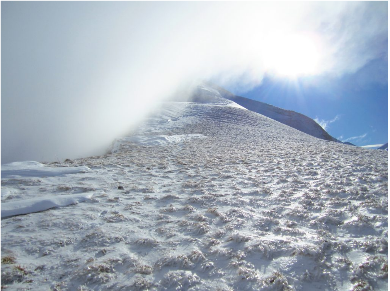
5- La cresta Nord del Monte Castel Manardo