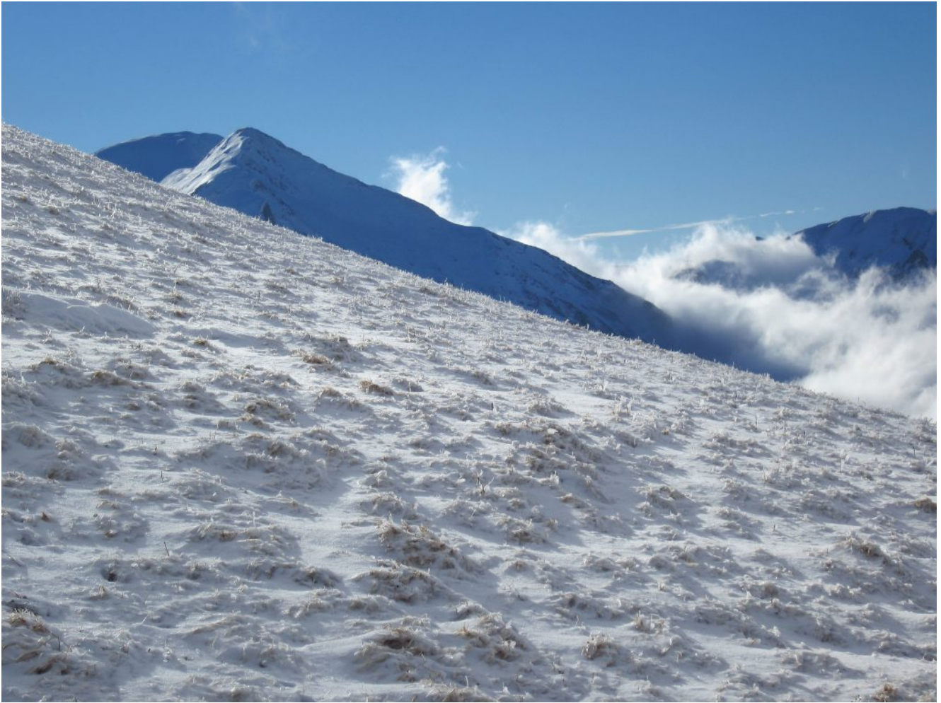
6- Emergono il Pizzo Tre Vescovi ed il Monte Acuto.