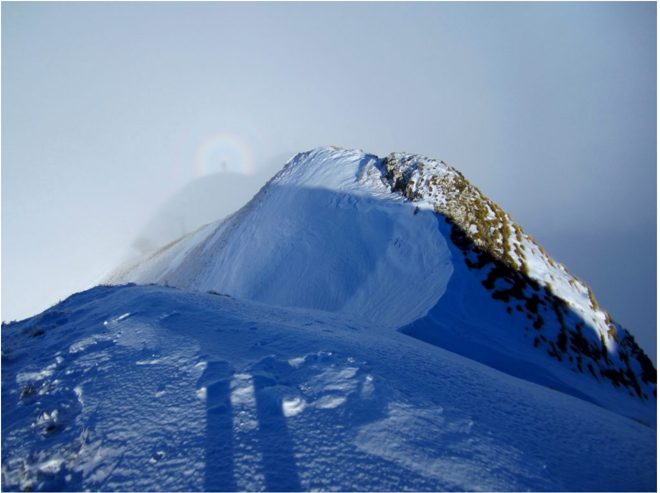
8 – 14- Varie immagini della Gloria Solare vista in posizioni diverse della cresta Nord.