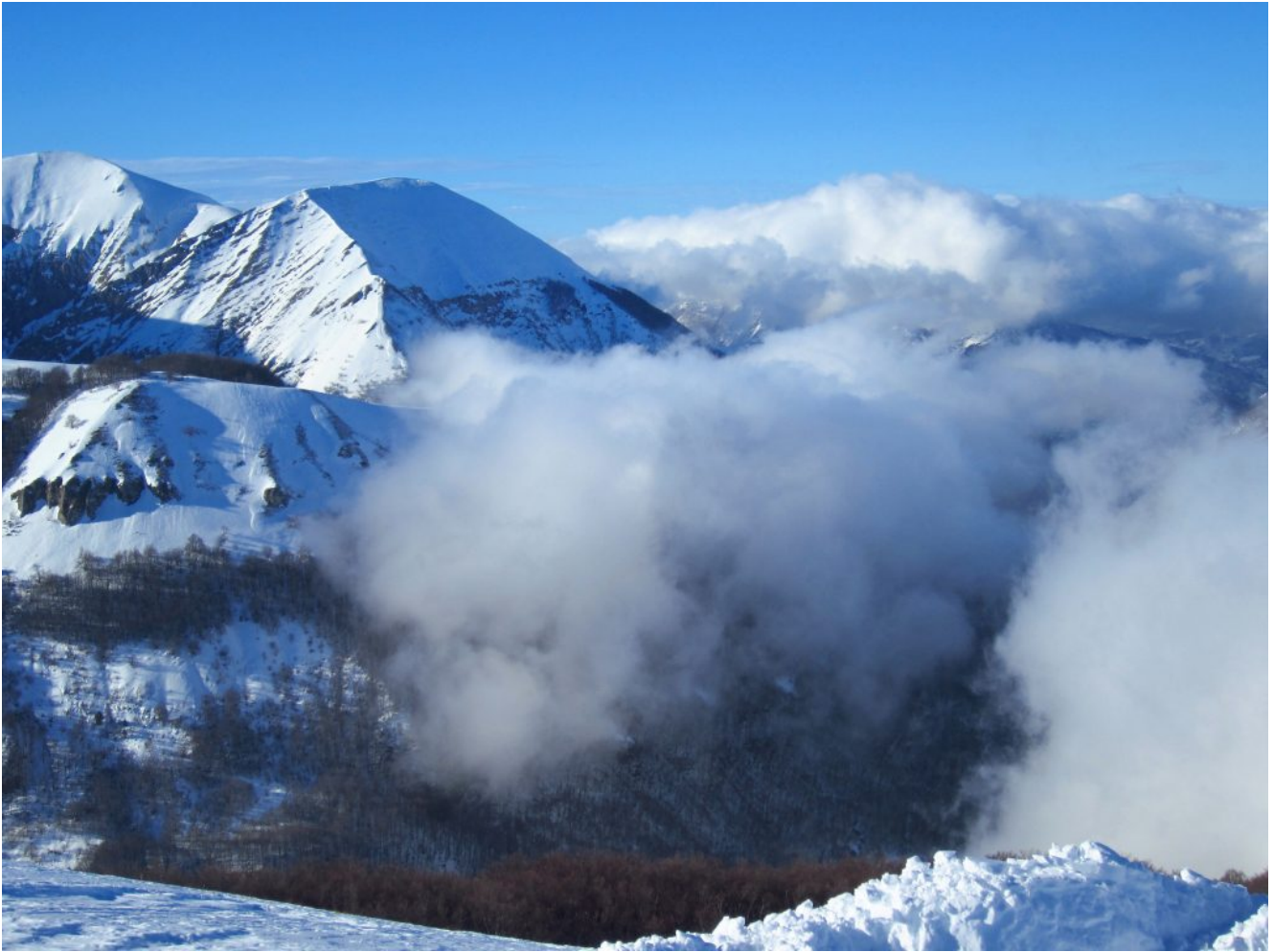
2- La vallata di Bolognola con, a sinistra, il Monte Pietralata ed il Monte Cacamillo