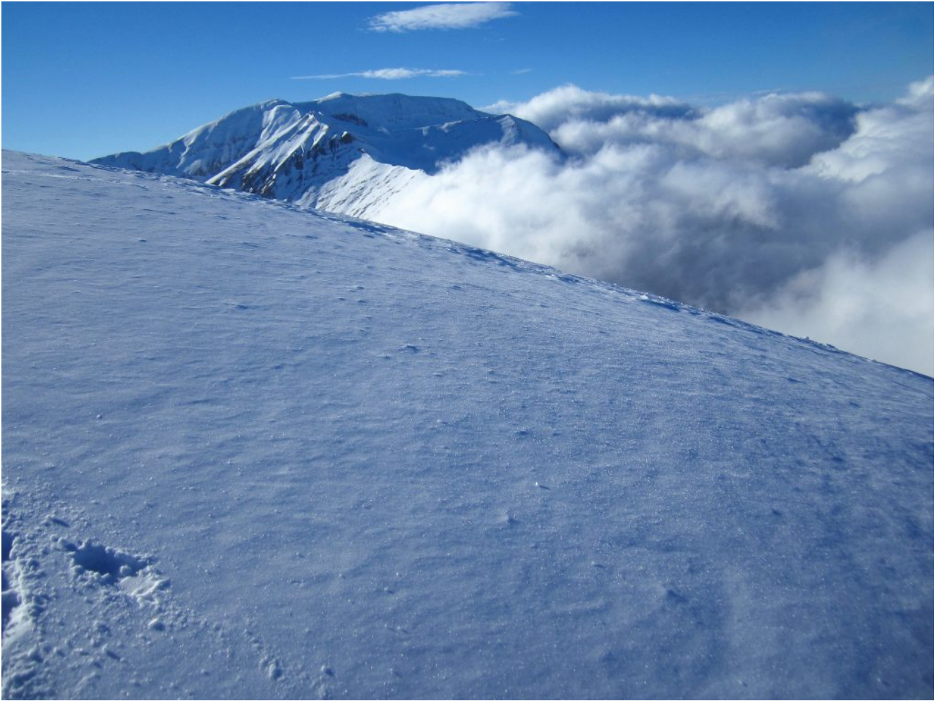
7- Il Monte Rotondo.