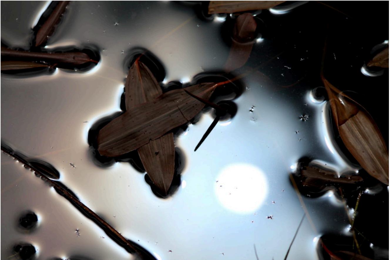
6 – 7 Il sole si riflette nei vari stagni del Fosso Mergani al Piano Grande