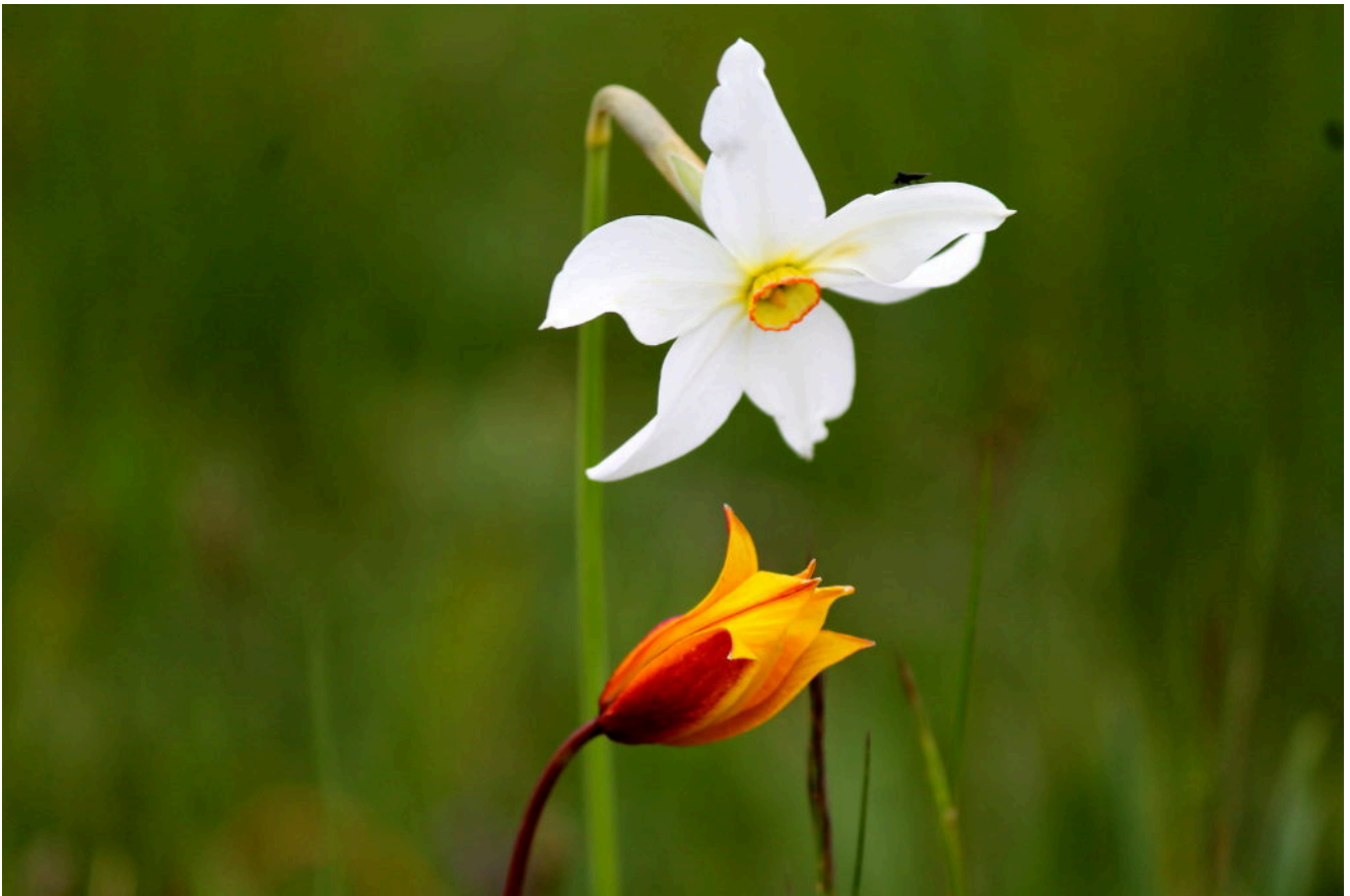
5- Narcissus poeticus e tulipa australis che sembrano quasi dialogare tra loro