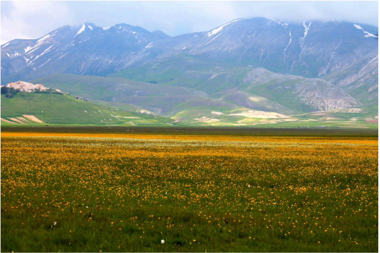
8- La fioritura spontanea del Piano Grande, a sinistra il "cumulo di macerie" di Castelluccio. Sullo sfondo il M. Porche a sinistra e il M. Argentella a destra, nei Colli Alti e Bassi si nota la fioritura delle foto n.1-2.