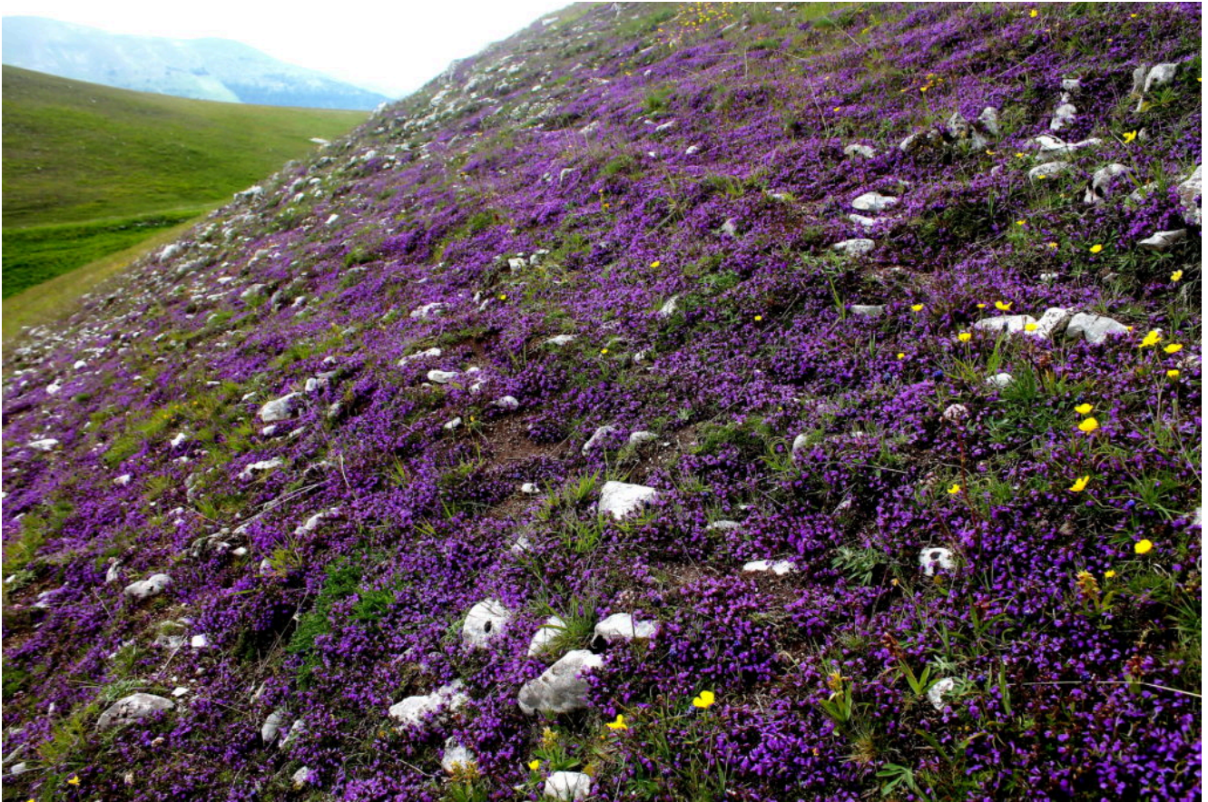
2- la fioritura di Acinos alpinus vista da vicino