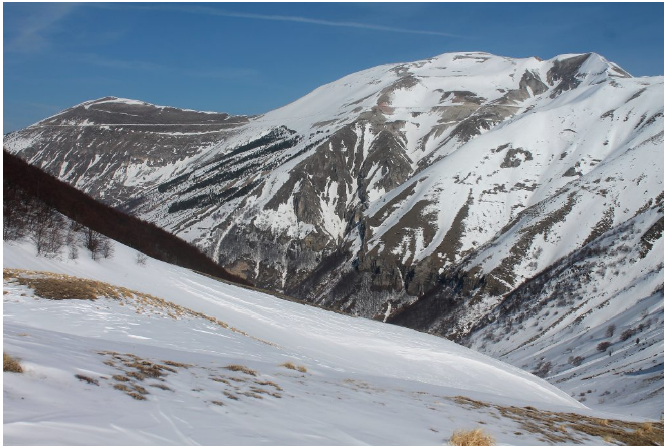
8- I versanti Sud della Croce di Monte Rotondo a sinistra, sgombra dalla neve e il Monte Rotondo a destra.