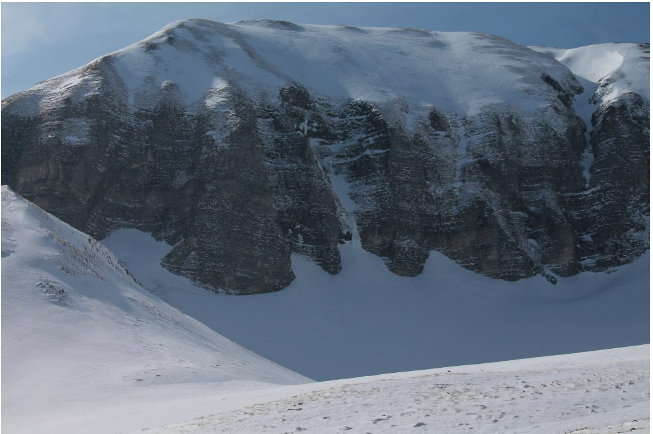
10- Le pareti Nord del Monte Bove Sud con, al centro, la cascata di ghiaccio denominata "Torre di Luna" .