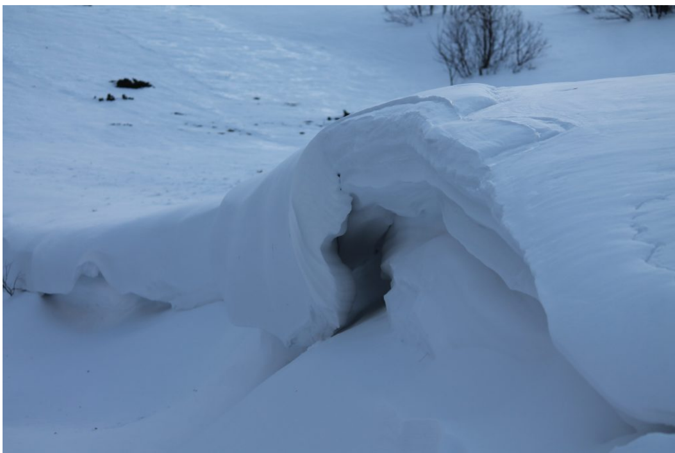
1- Grande cornice nel bordo del canale di Fonte Angagnola.