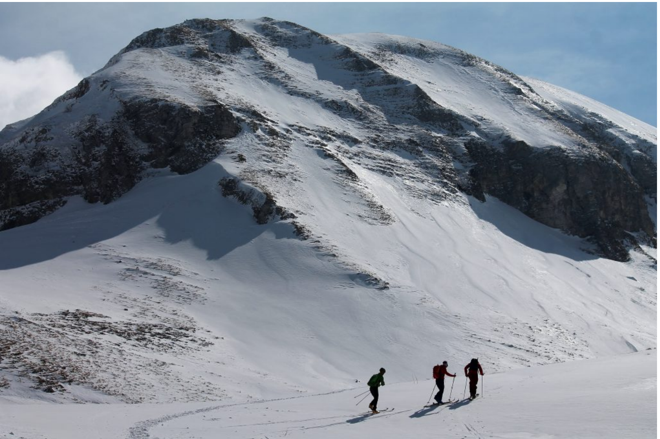
24- Sciatori salgono sotto al Monte Cascino mentre noi già scendiamo.