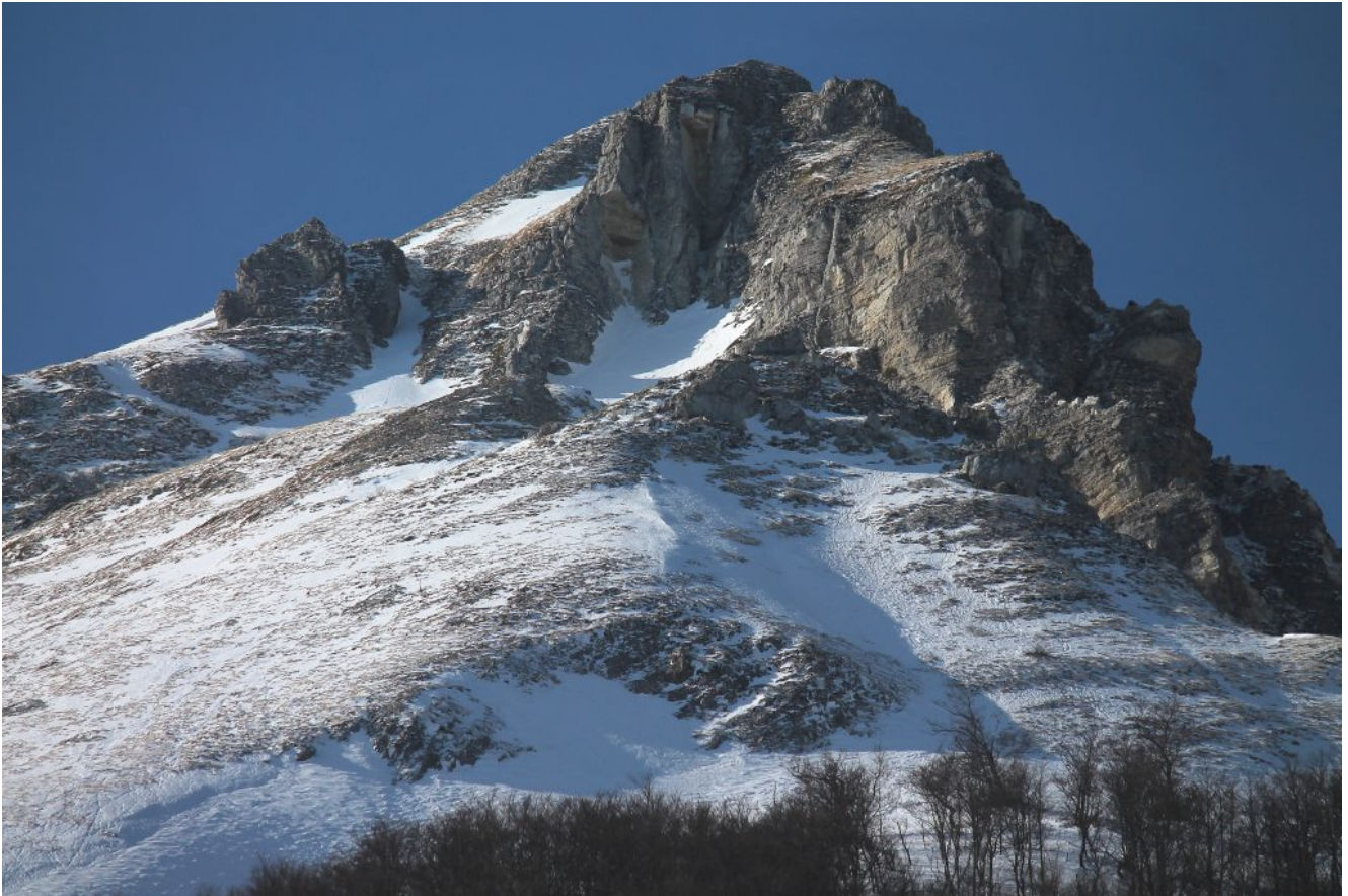
2- La Cima del Lupo sul bordo sinistro del Canalone Nord con scarso innevamento, si nota la traccia a sinistra che permette di scavalcare la cresta rocciosa di fronte per raggiungere la cima.