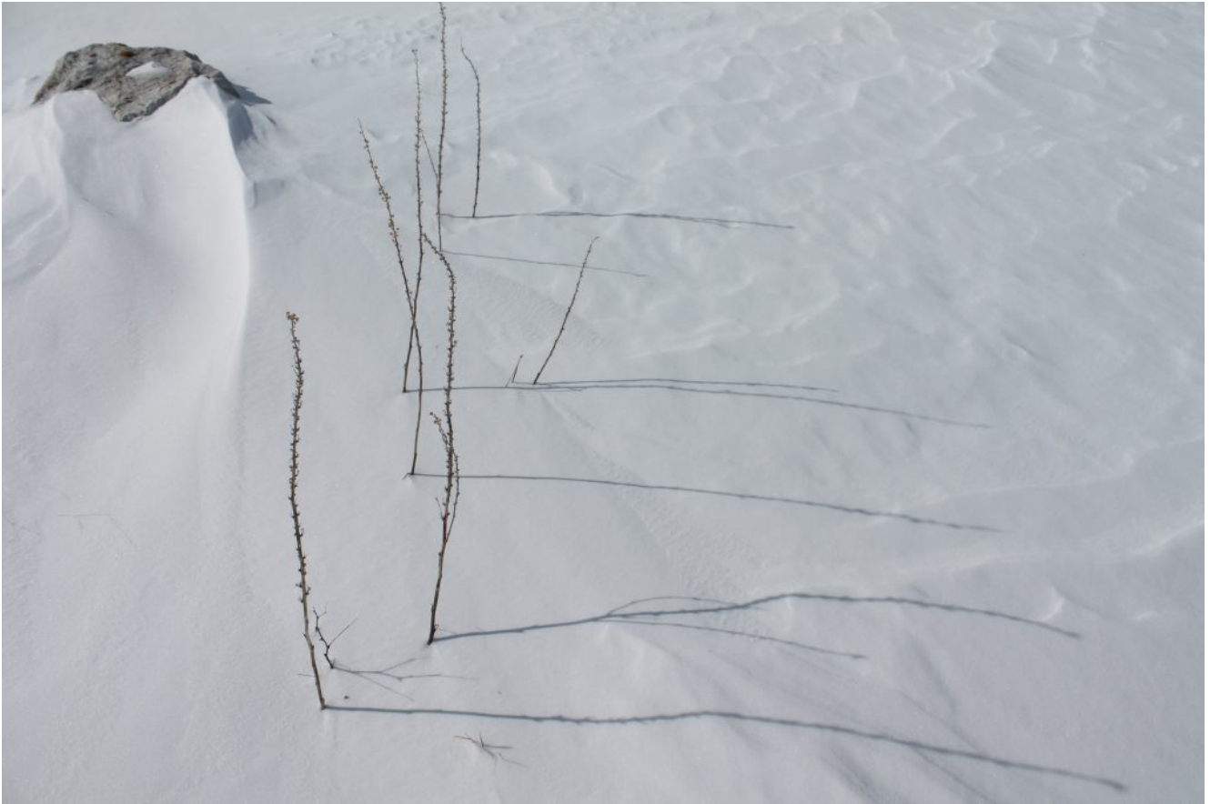
9- Steli di Verbascum emergono dalla neve purtroppo non abbondante.