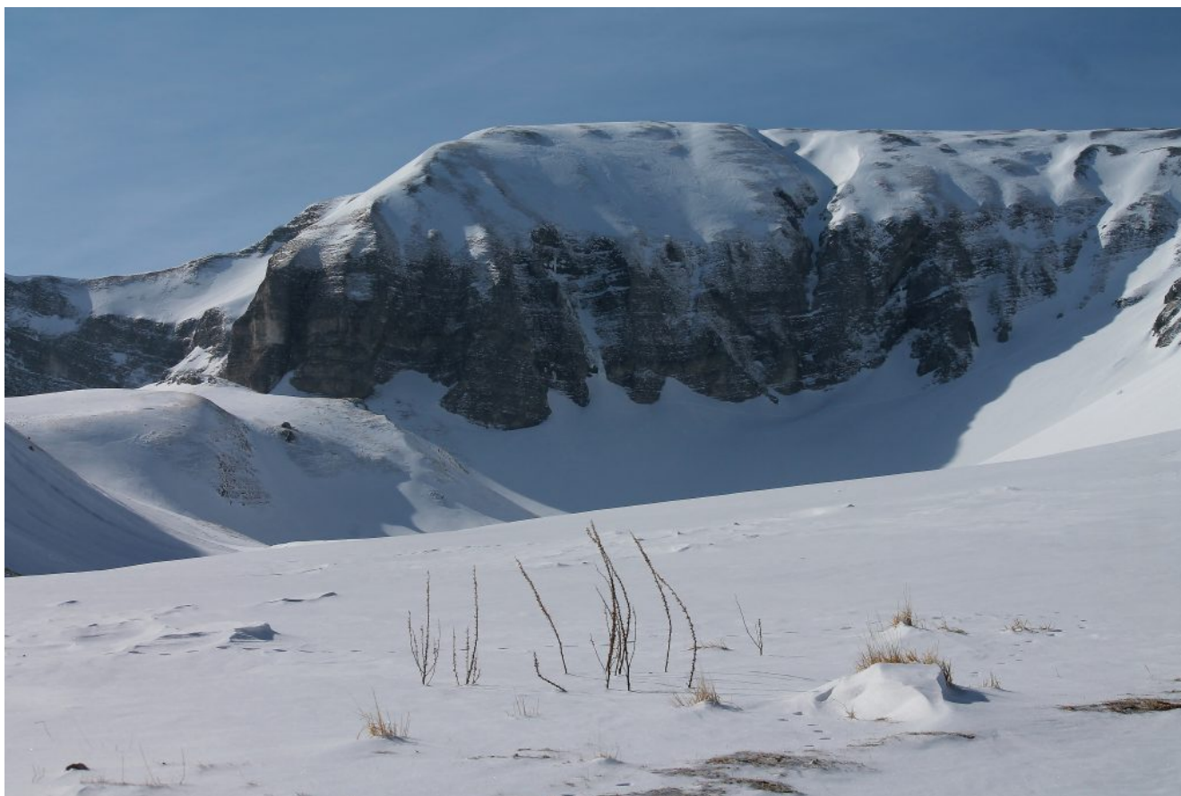
7- Il Monte Bove Sud e la testata della Val di Panico.