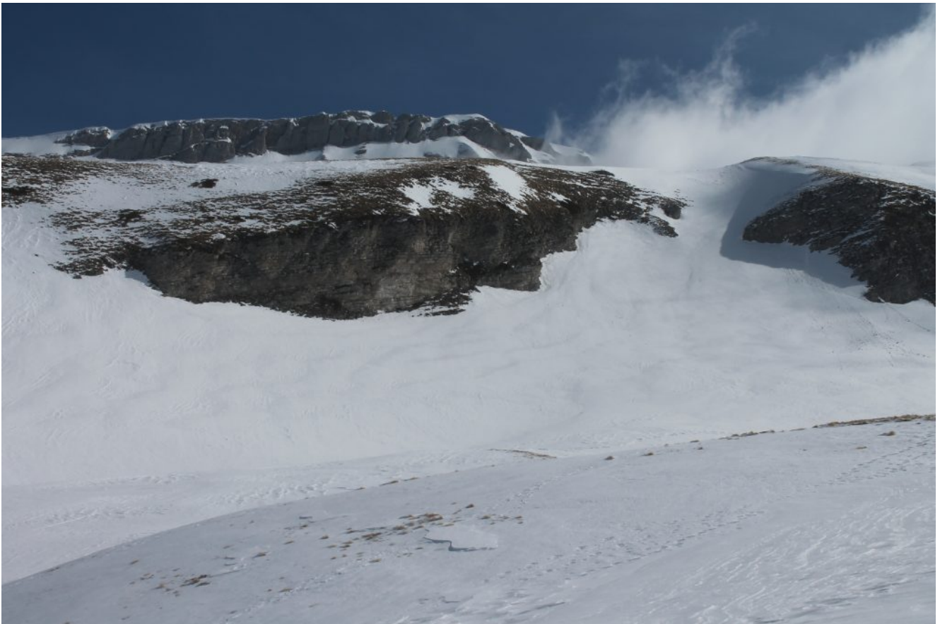
22- Il Pizzo Berro e la nebbia che tracima invece dalla Valle del Tenna.