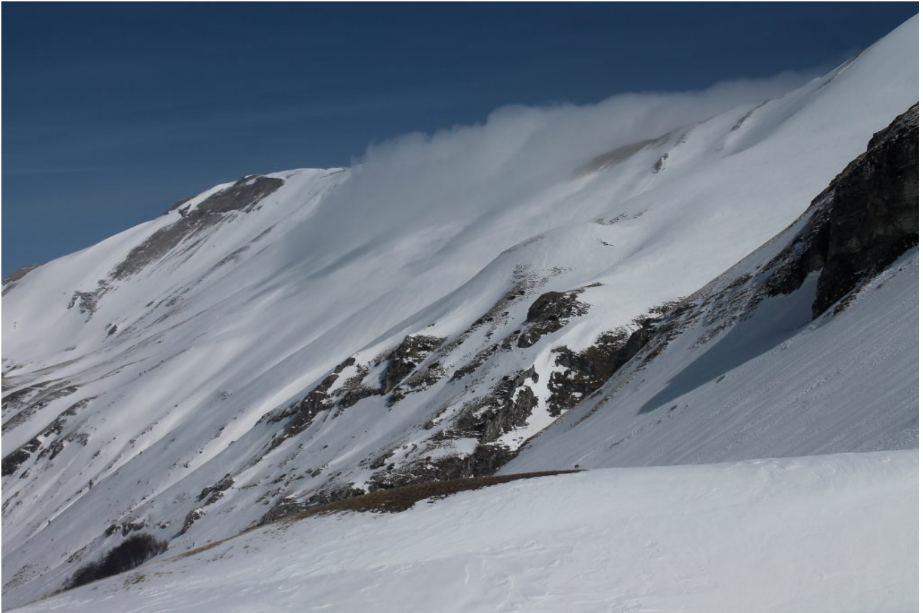
21- Il Pizzo Tre Vescovi e la Forcella Angagnola da cui tracima la nebbia dalla Valle dell'Ambro.