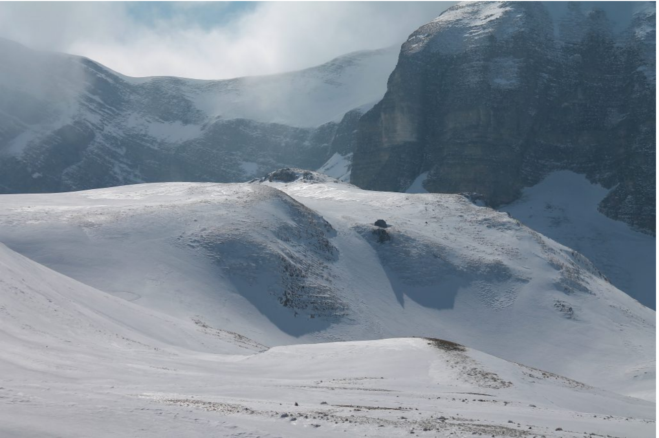
23- E ormai la nebbia sta scendendo dalla Forca Cervara anche il Val di Panico