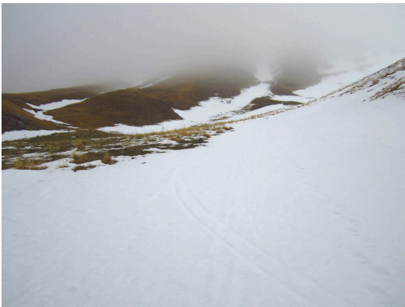
1- La Valle delle Fonti con l'inizio dei due “Canali gemelli” coperti in alto dalla nebbia.

DISCESA: Dalla cima si scende i per la cresta Sud in direzione di Forca Viola che si raggiunge in circa 30 minuti, giunti alla sella si scende direttamente per il canale in direzione Ovest che riporta in altri 30 minuti alla Valle delle Fonti nel punto dove si è iniziata la salita di uno dei due “canali gemelli”.