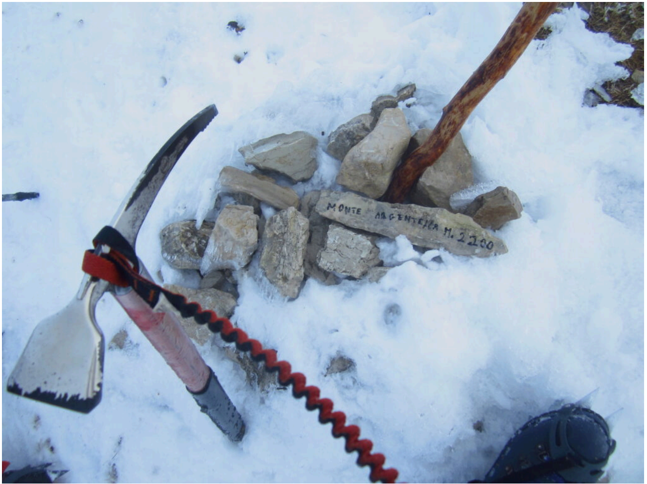
15- A dimostrazione che siamo arrivati sulla cima del M.Argentella la solita pietra con la scritta col pennarello.