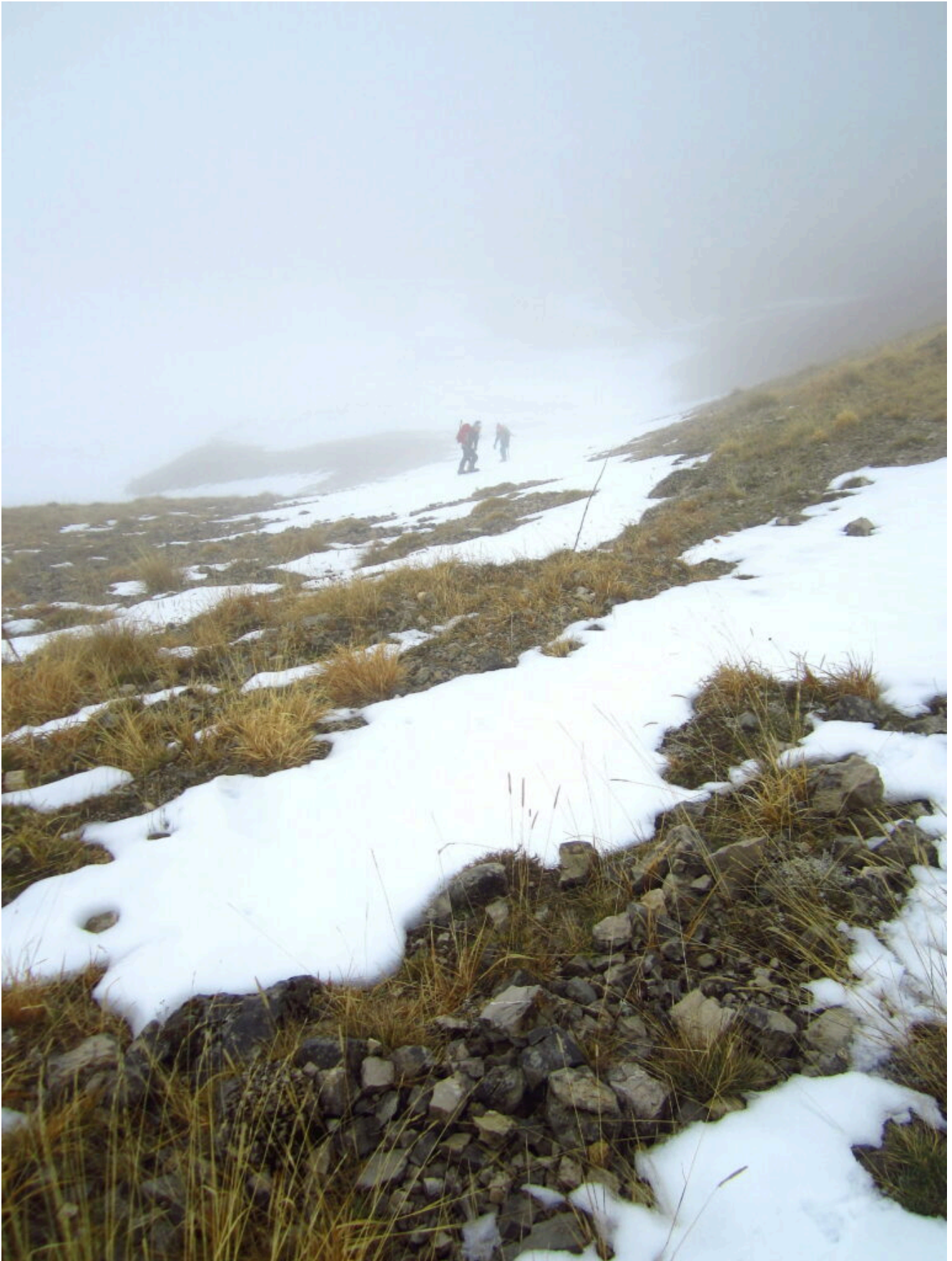
3- Primo tratto di salita nel canale destro.