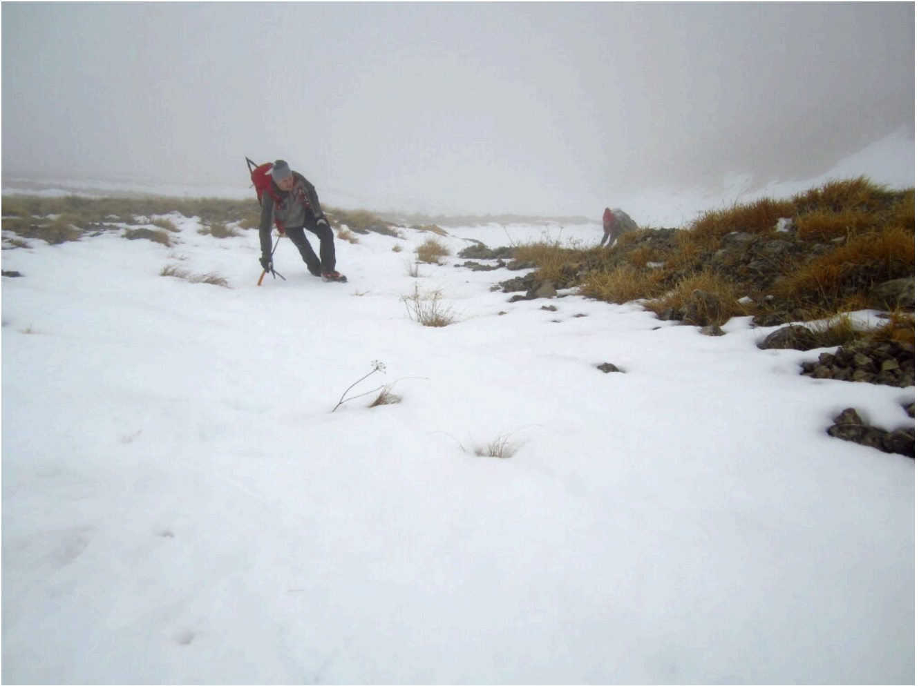
8 – 9- Il tratto finale del canale prima del pianoro sommitale.