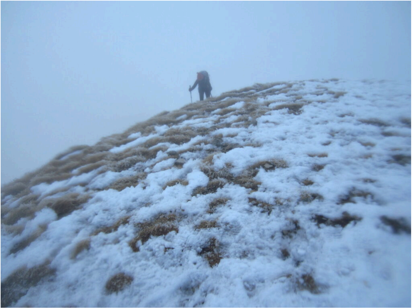
14- Finalmente la cima del Monte Argentella sbuca dalla nebbia.