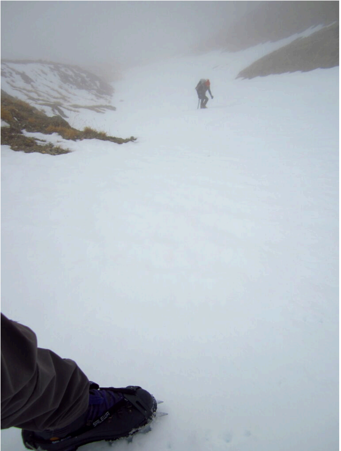
5 – 6 – 7- Il tratto centrale più ripido del canale gemello di destra.