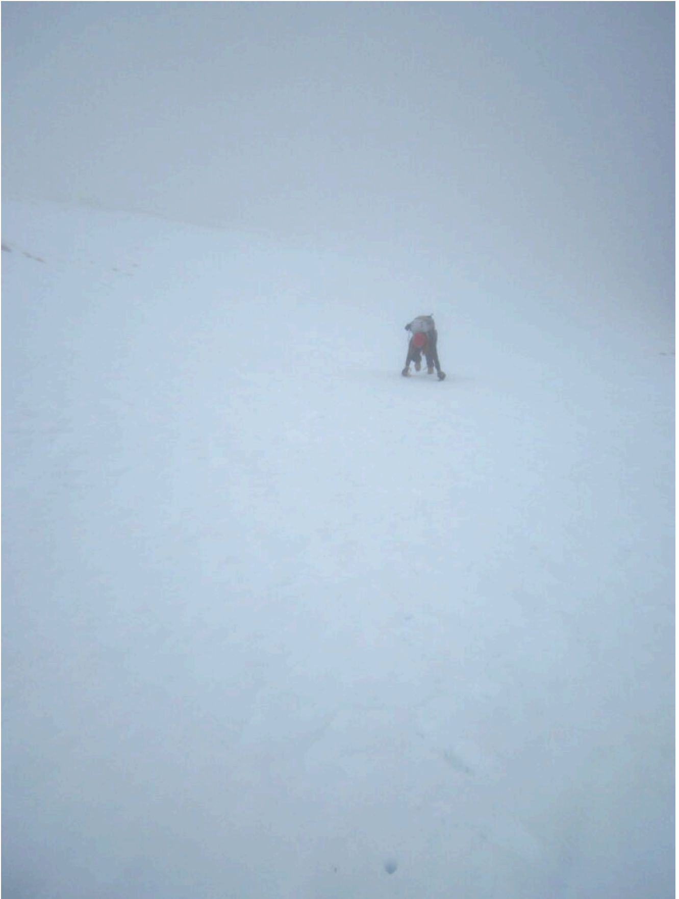
10- A quota 1900 metri la neve ricopre tutta l'erba e siamo immersi nel più totale whiteout.